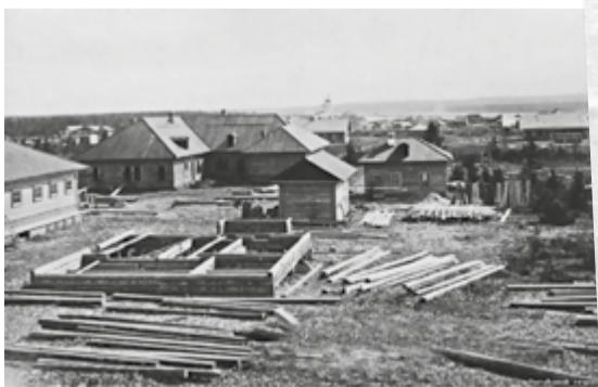
с. Монастырское, 1900 год