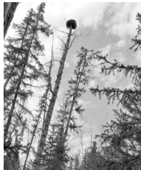
Гнездо скопы удалось разглядеть благодаря квадрокоптеру

Для построения классификации и проведения ординации (выявления основных экологических факторов формирования и функционирования лесов территории заповедника) выполнены описания лесных фитоценозов в южной