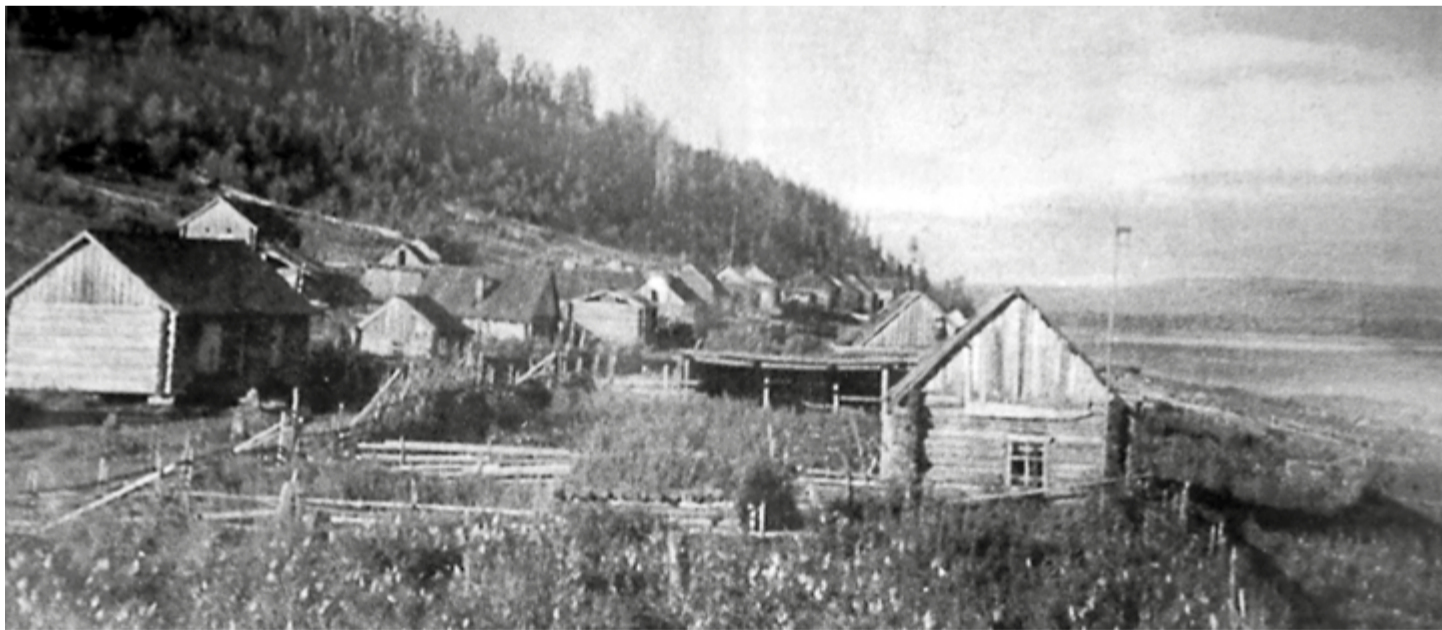
п. Суломай, 1949 год