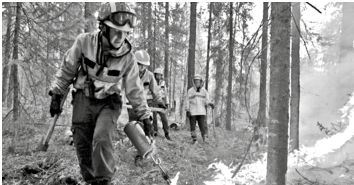
Вблизи п. Куомба был низовой пожар, его тушили наземным способом