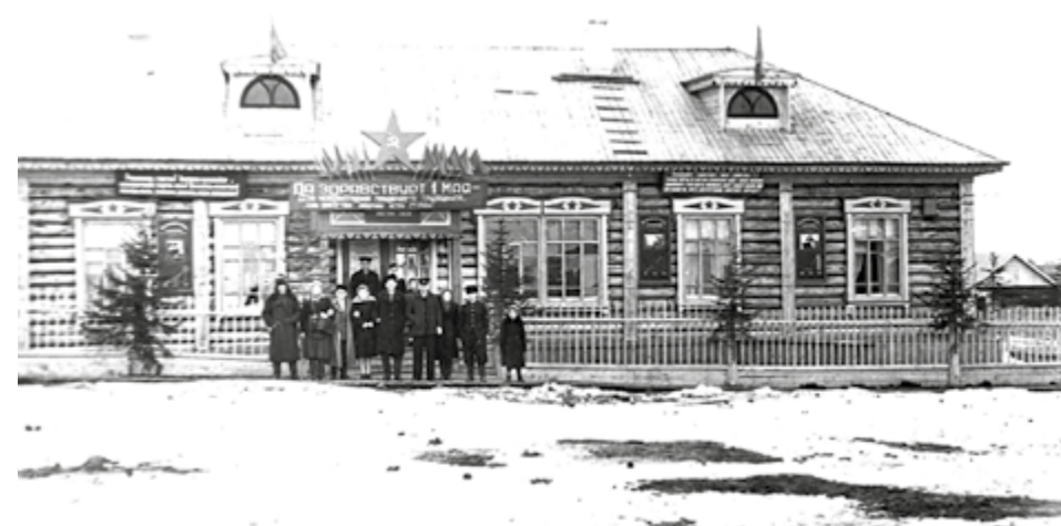
Здание почты, 50-е годы