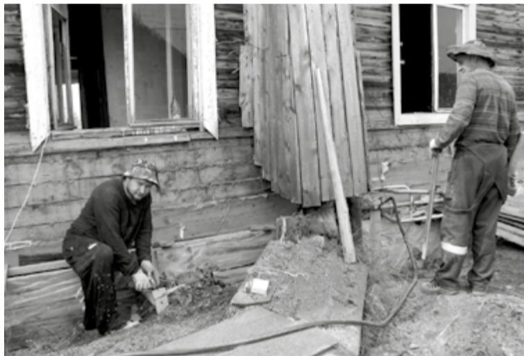
Жаркая погода не помеха работе

кладбище, расположенном на ул. Красноярская.