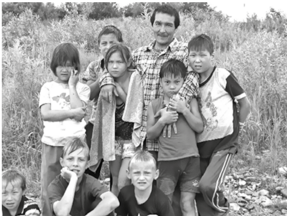
Жители п. Суломай, 2000-е годы