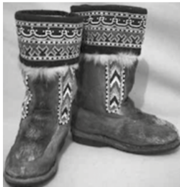
Унты мастерицы всегда пользовались большим спросом