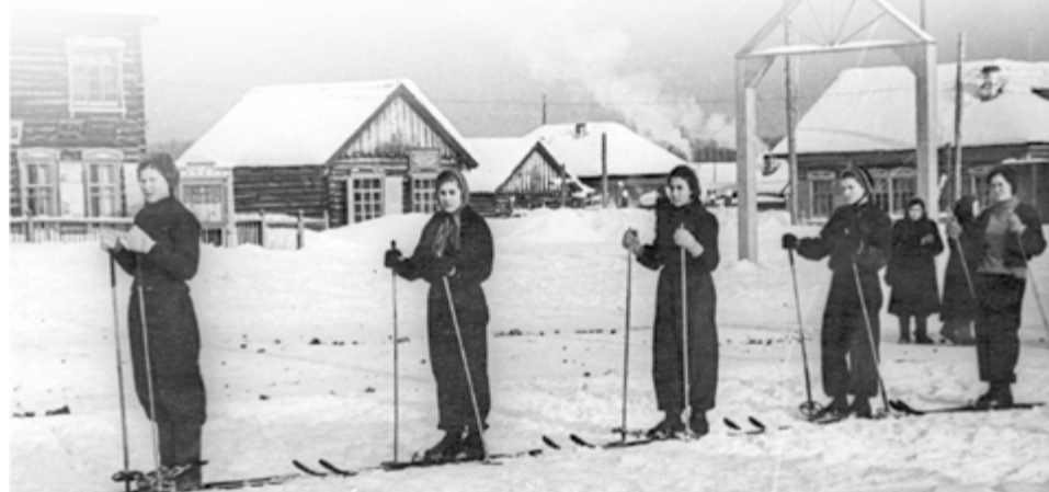
Ванаварские лыжники прошлого века