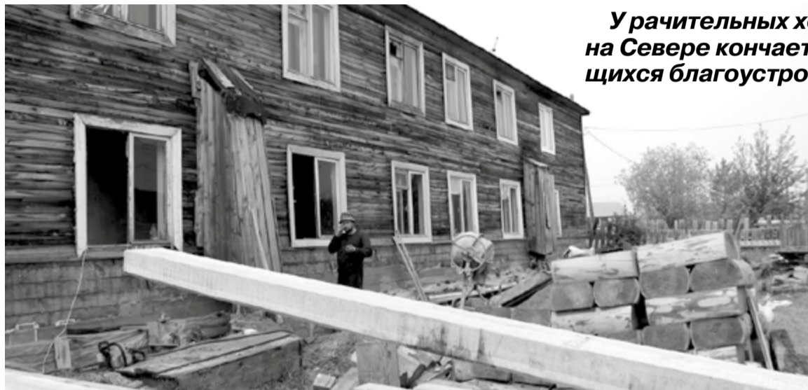
Капитальный ремонт многоэтажного дома, расположенного в пер. Кипучий

Нынешнее лето не исключение. Органы местного самоуправления с. Ванавара уже с самого его начала организуют и контролируют качество всего комплекса работ по благоустройству села.