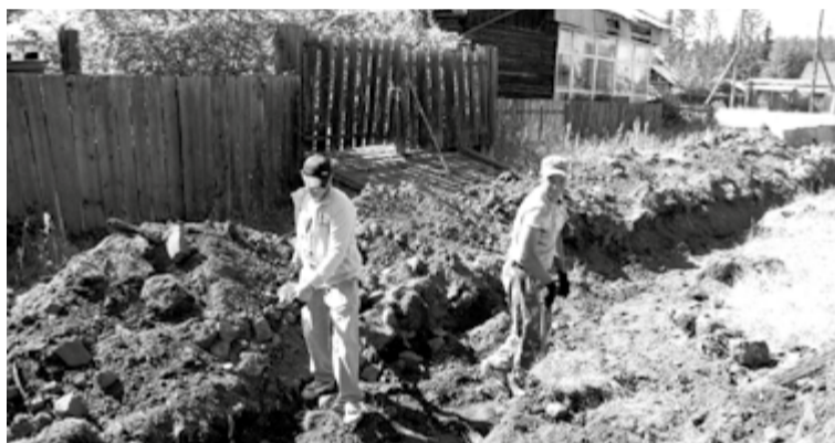
Создание отводной канавы в пер. Больничном

У рачительных хозяев все делается вовремя. Летняя пора на Севере кончается быстро, поэтому у людей, занимающихся благоустройством сел, на счету каждый день.