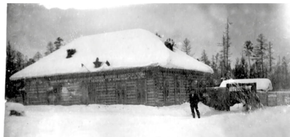
Первая школа, 30-е годы