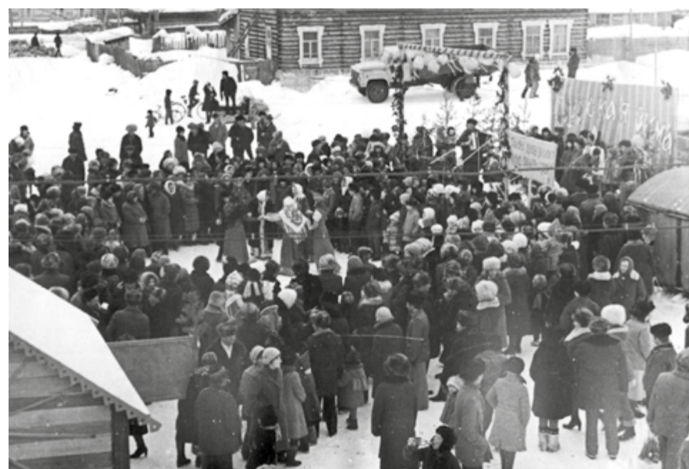
Проводы зимы в Ванаваре, 60-е годы