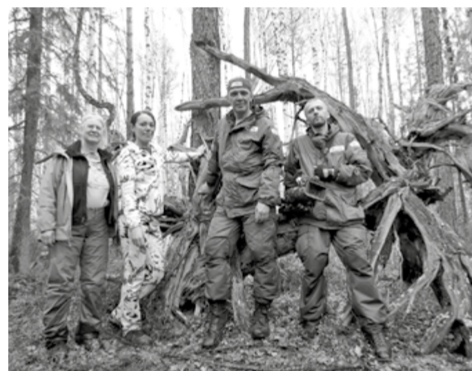
Сотрудники заповедника и съемочная группа «Россия-Красноярск» на пути к горе Фаррингтон, рядом с лиственницей – свидетелем взрыва 1908 года