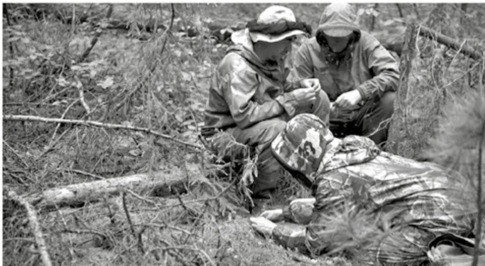
Экспедиция провела учет биоразнообразия, запасов фитомассы древостоя

С помощью квадрокоптера 6 июня была предпринята попытка проанализировать гнездо, но возникла сложность в агрессивном поведении самки. В связи с чем, квадрокоптер был запущен с противоположного берега реки Чамбы, поднят на высоту выше полета птицы и опущен вертикально над гнездом. Итак, в гнезде находится три яйца. Таким образом, отмечен факт обитания репродуктивной пары на реке Чамба.