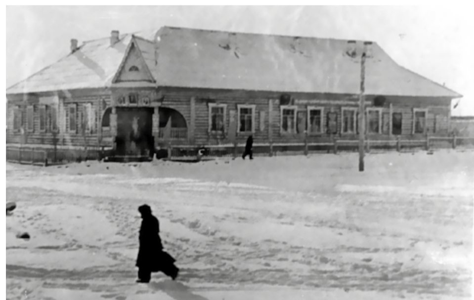
Ванавара, 50-е годы