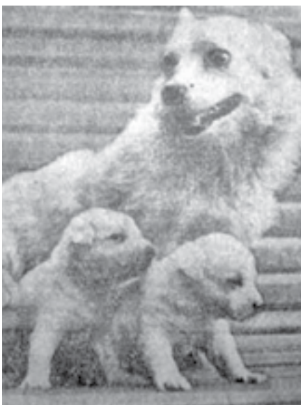
Жулька с потомством

испеченный кандидат в космонавты вел себя совершенно спокойно. Генеральному конструктору Сергею Королеву решили пока не докладывать об инциденте, а псу дали кличку ЗИБ (Запасной Исчезнувшего Бобика). Непутевый и его коллега отлично перенесли полет, техника не подвела. После приземления Королев заметил подмену и, получив объяснения, заверил, что скоро на советских ракетах будут летать все желающие. На докладе руководству генеральный конструктор трактовал аббревиатуру ЗИБ как «Запасной исследователь без подготовки».