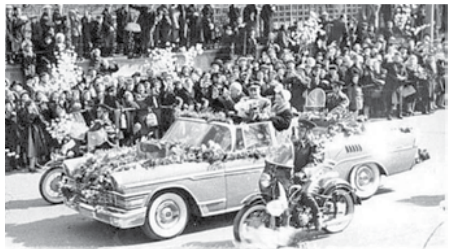
Страна встречает первого космонавта