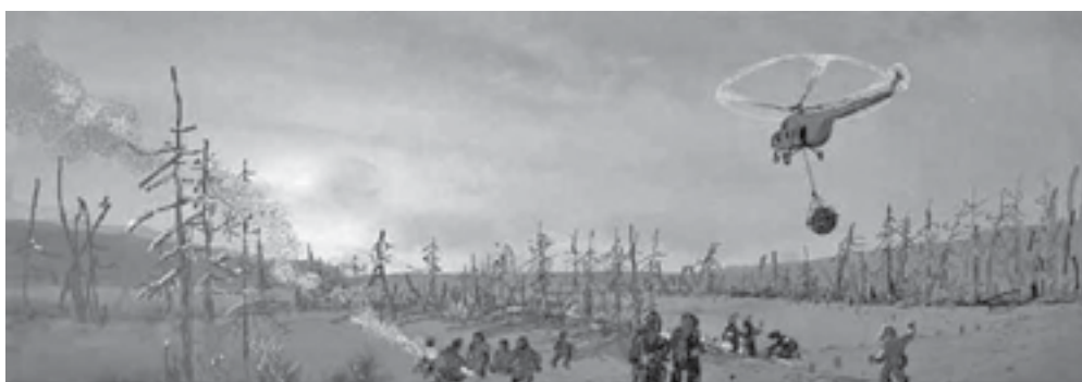
Эвенкия, просека для эвакуации СА