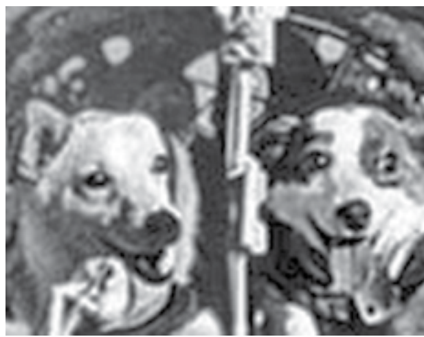
Белка и Стрелка