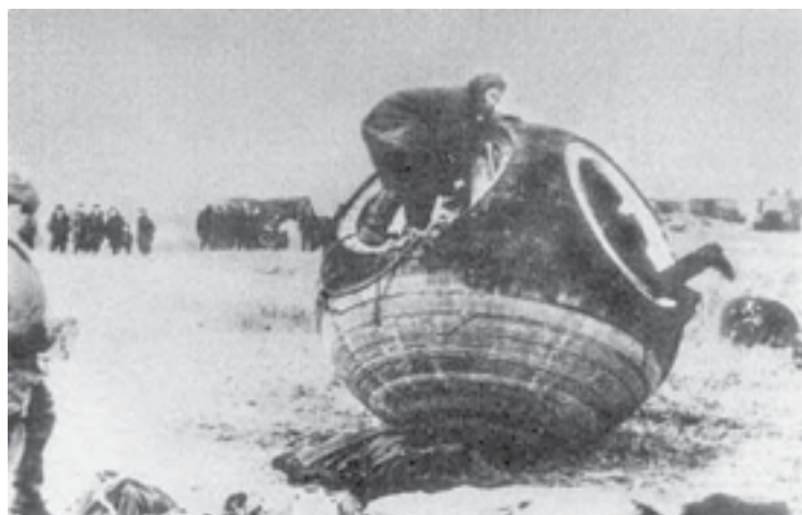
Спускаемый аппарат в Туруханске