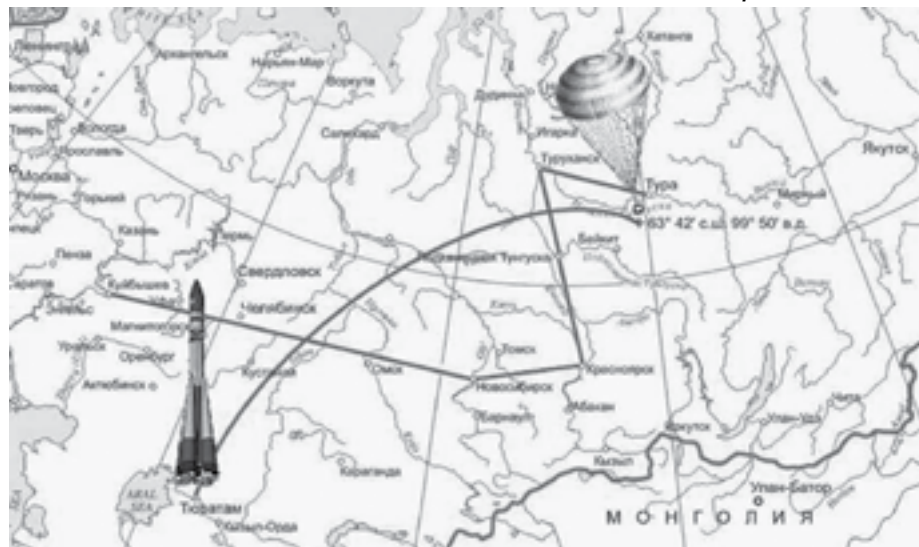
Место приземления СА