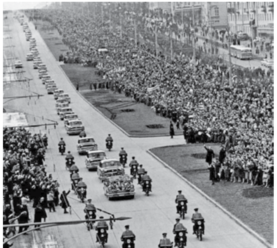
Москва, торжественный парад