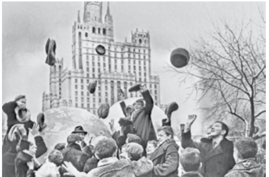
Мы - первые в космосе!