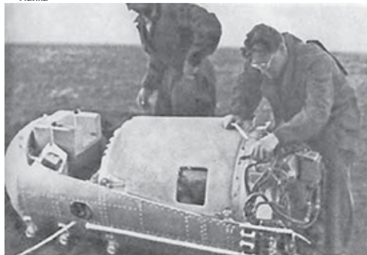
Катапультирующее кресло Белки и Стрелки