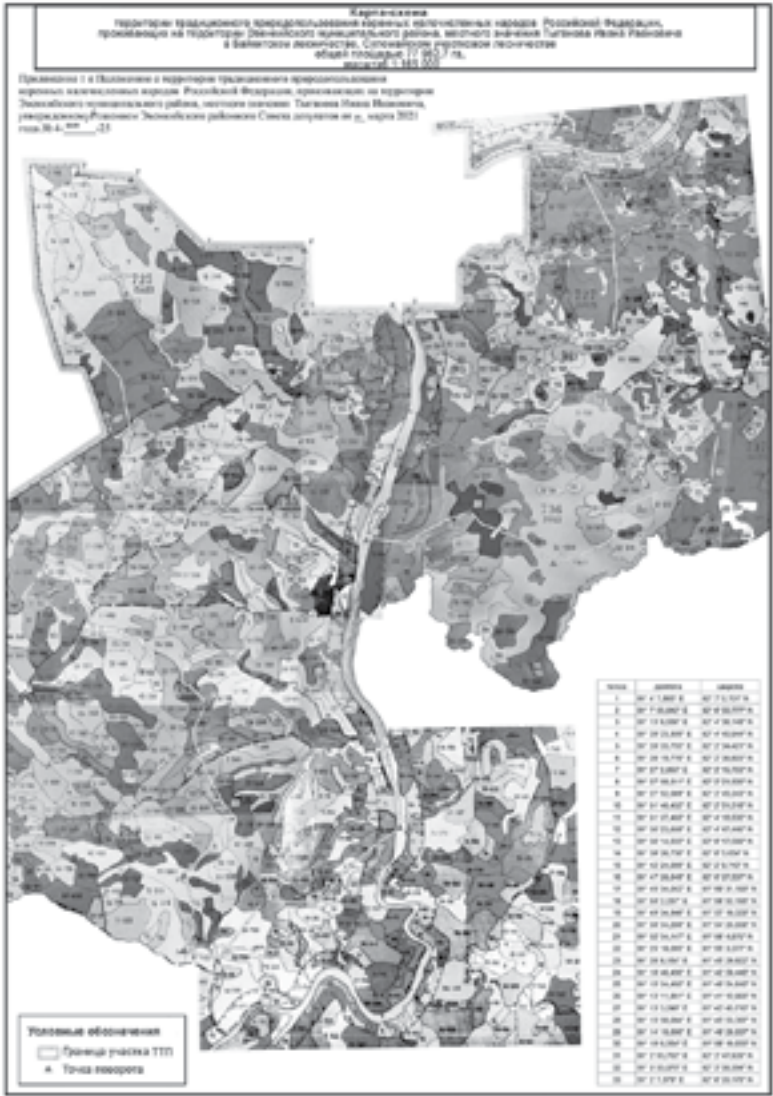
Реестр координат поворотных точек границы территории традиционного природопользования КМНС в Байкитском лесничестве, Суломайском участковом лесничестве