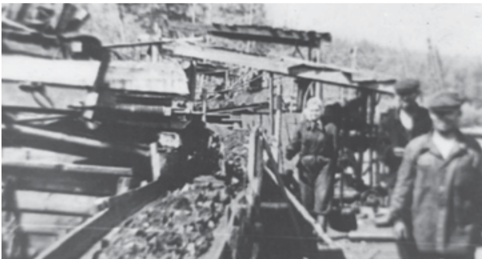
Верхние площадки склада графита