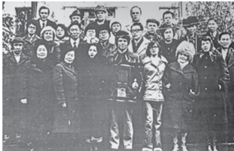
Всероссийский семинар-творчество народов Сибири и Дальнего Востока, г. Ялта, 1980 г.