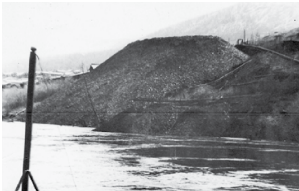
Графит готов к погрузке