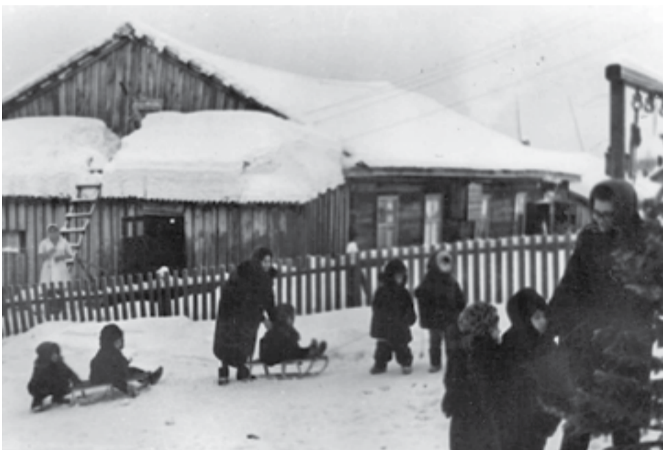
Ногинский детский сад, 1967 г.