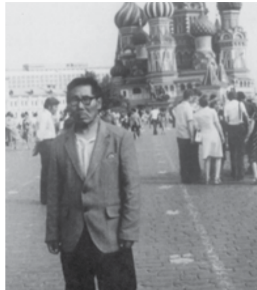
Поездка в столицу

В начале XX века территория современной Эвенкии входила в состав Туруханского края и была разделена на четыре инспекторских района. Чиринда относилась к Илимпейской управе, которую населяли тунгусы родов Удыгирь, Хирогир, Оёгирь, Хутукагырь, Эмидак, Гургугырь, Кампагырь, Баягырь, Ялтакагырь.