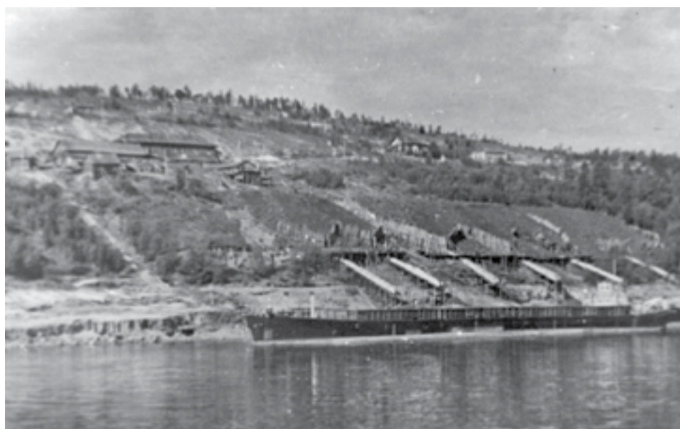
Отправка графита, п. Ногинск, 1950 г.

16 марта 1951 года населенный пункт Ногинск был отнесен к категории рабочих поселков