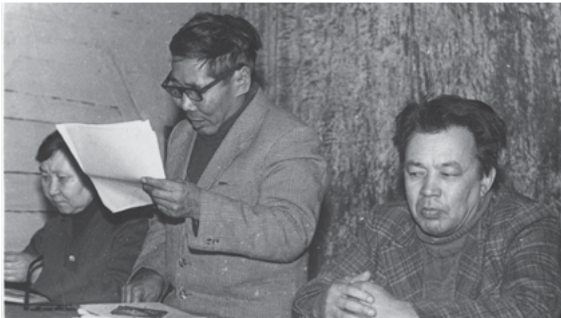
Эвенкийские поэты на встрече с читателями