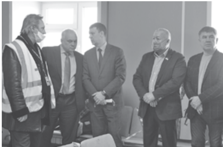
Представители власти оценили развитие пассажирских авиаперевозок по северным направлениям