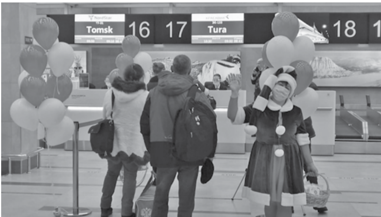
Жители Эвенкии могут заранее зарегистрироваться на рейс, выбрать место, заказать дополнительное питание, увеличить объем багажа

перелетов. Сегодня открытие новой полетной программы АО «КрасАвиа» и прибытие в Туру нового, более комфортабельного и вместительного самолета АТР72 позволят значительно улучшить обеспечение транспортных потребностей жителей района, особенно в «пиковые» сезоны. Кроме этого, нас радуют подходы авиакомпании к выполнению услуг в плане стоимости билетов и предоставления дополнительных опций. Сегодняшнее событие – еще один шаг в развитии транспортной системы на нашей территории, и надеемся на дальнейшее обновление авиапарка воздушных судов на северных направлениях», – прокомментировал глава Эвенкии Андрей Черкасов.