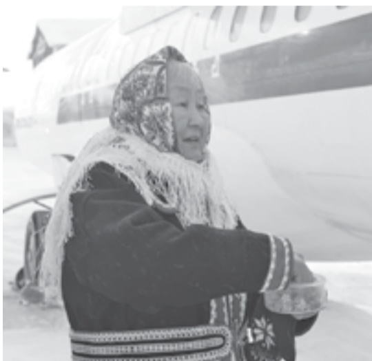
Новая полетная программа АО «КрасАвиа» подразумевает не только современные самолеты, но и качественное обслуживание