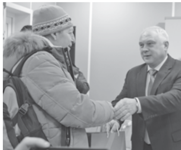
Памятный подарок – первому пассажиру рейса

«Переход регионального сегмента на современные самолеты – это для Эвенкии и для Красноярского края в целом большой шаг, – отметил министр транспорта Красноярского края К.Н. Димитров. – Новая полетная программа подразумевает и более качественное обслуживание населения. Жители Эвенкии могут заблаговременно забронировать рейсы, выбрать нужное место, увеличить объем бесплатного багажа. Летом в период отпусков, когда в районе значительно увеличивается спрос на авиабилеты, мы ставили дополнительные