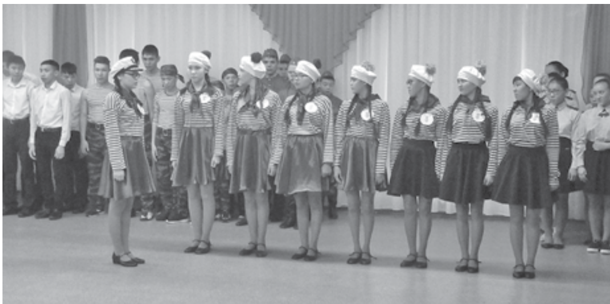
В детском доме придумывается много разных конкурсов