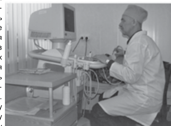
Трудовые будни в Ванаварской межрайонной больнице

Афганская военная кампания (25 декабря 1979 - 15 февраля 1989) - военный конфликт на территории Демократической Республики Афганистан между правительственными силами Афганистана при поддержке Ограниченного контингента советских войск с одной стороны и вооруженными формированиями афганских моджахедов («душманов»), пользующихся политической, финансовой, материальной и военной поддержкой ведущих государств НАТО, Китая и консервативного исламского мира, с другой стороны. В обиходе Афганскую войну принято называть кратко - Афган.