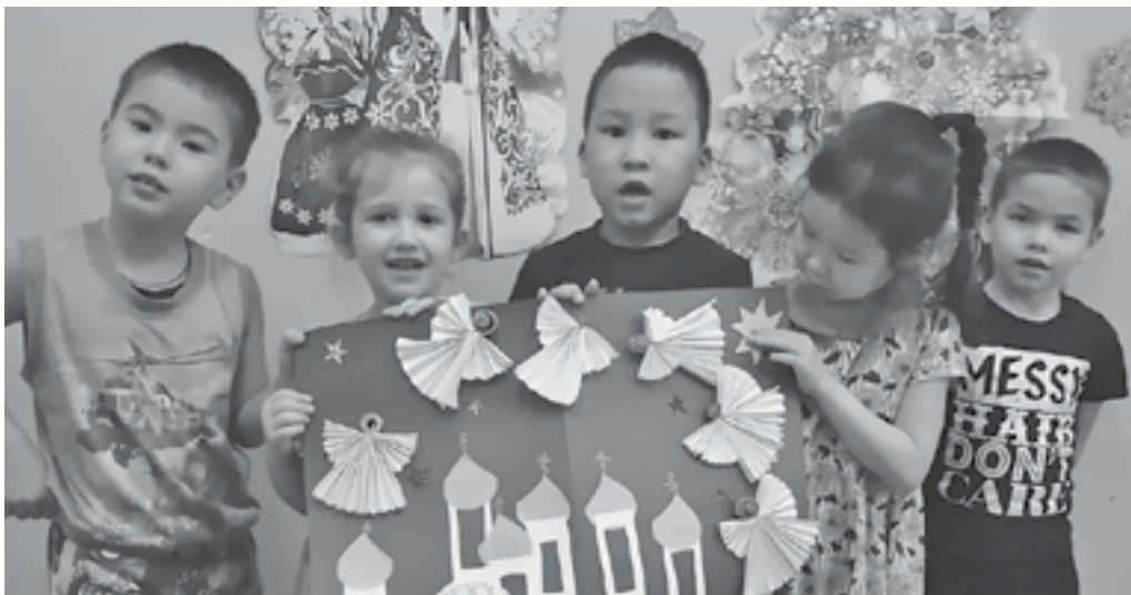
Воспитанники детского дома творят вместе

КГКУ «Ванаварский детский дом» - не просто единственное в Эвенкии учреждение, где заботятся о детях-сиротах и детях, оставшихся без попечения родителей. Это сложный живой организм, который постоянно развивается и меняется.