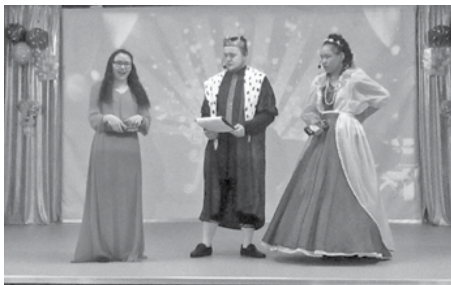
Дети вместе с педагогами ставят интересные спектакли