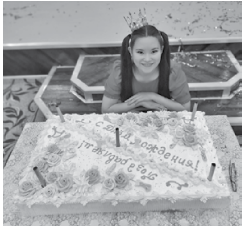
Здесь весело отмечают дни рождения

В настоящее время в стенах детского дома проживает 73 воспитанника, 11 из них - дошкольного возраста. Жизнь в детском доме включает в себя различные составляющие, но основными направлениями работы является создание для воспитанников условий, максимально приближенных к семейным, а также осуществление работы по устройству их в семьи граждан. Всем известно, что каждый ребенок должен воспитываться в семье. Коллектив детского дома стремится к этому. Именно в этом направлении в учреждении за последние два года произошли значительные перемены в лучшую сторону.