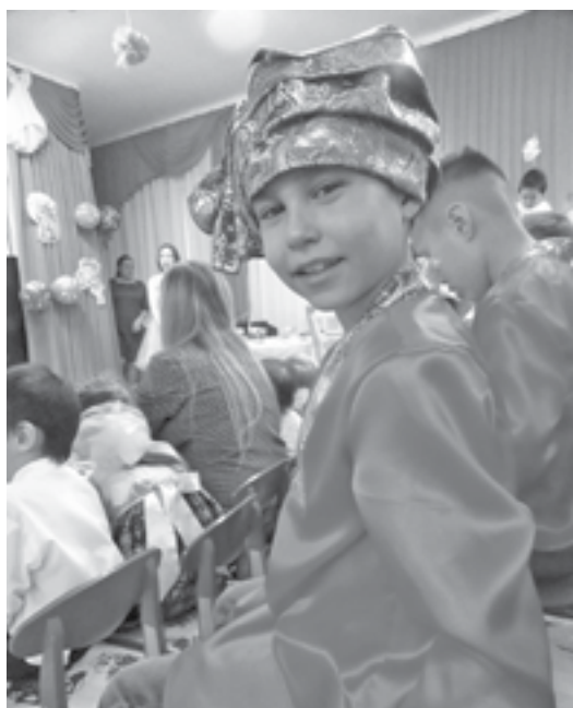
Каждый ребенок может попробовать себя в роли артиста