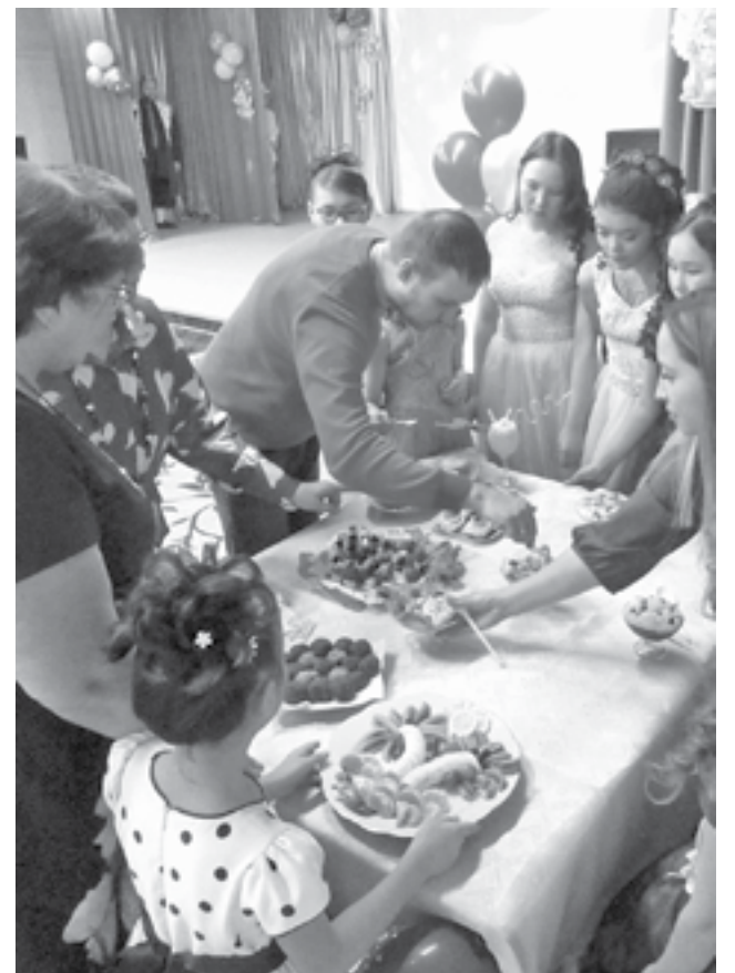
Каждый праздник - как в семье

Жизнь в Ванаварском детском доме насыщена и богата на культурные события, на творчество. Дети здесь не просто ухожены и накормлены. Они живут в атмосфере огромной любви и заботы дружного коллектива учреждения, бережного отношения со стороны сотрудников к душевному миру каждого воспитанника. Благодаря большой слаженной работе педагогов и их каждодневному труду, воспитанники детского дома чувствуют себя защищенными и счастливыми. Они любят свой дом и наверняка будут тепло вспоминать его на протяжении всей своей «взрослой» жизни.