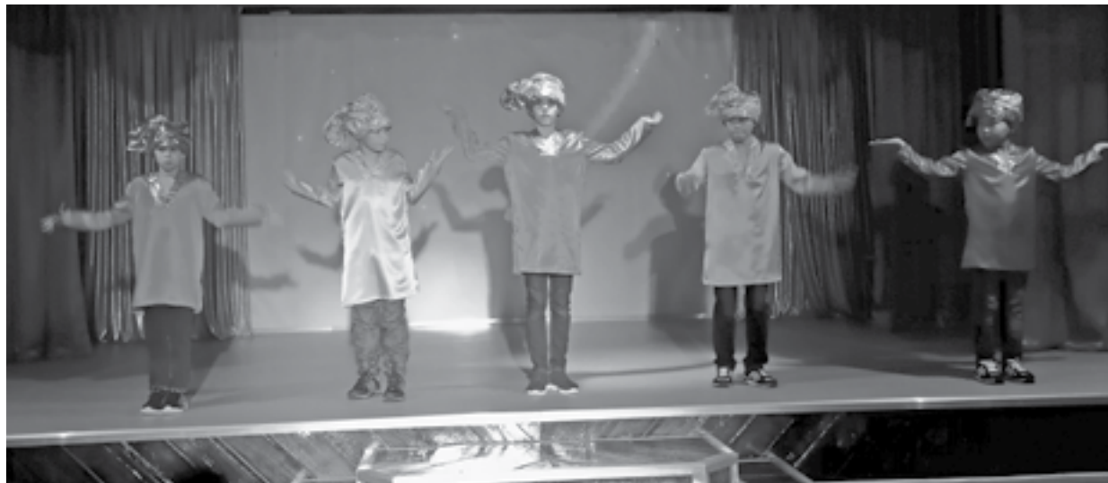
Счастья вам, ребята!

Татьяна ВЛАСЕНКО