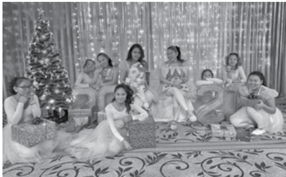
Юные красавицы после яркого выступления

О чем мы переживаем больше всего, так это о наших выпускниках. В настоящее время значительно поднялся проходной балл не только в высших учебных заведениях, но и в колледжах, техникумах. Часто сталкиваемся с тем, что проходной балл в среднем профессиональном образовательном учреждении равняется 5, не говоря уже об учреждениях высшего образования. Пора поступления для всех нас - это всегда большие переживания, волнения, иногда слезы, разочарования, но все-таки чаще чувство гордости и ощущение счастья. В этом году у нас планируется 12 выпускников. Это большое количество. Практически все будут поступать в техникумы и колледжи. Есть выпускницы, которые планируют поступать в высшие учебные заведения. Воспитанники давно определились в выборе профессий и начали готовиться к поступлению заранее. Будем надеяться, что у них все получится!