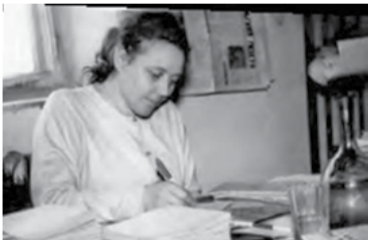
С юных лет мечтала стать учителем..., 1967 г.

В Байkitском Доме культуры состоялась презентация книги «Моя отчизна, частичка я твоя».