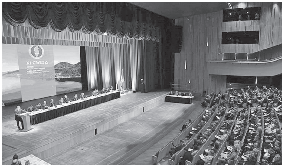
Подобные форумы крайне полезны для представителей органов МСУ, в том числе в части использования новых эффективных технологий управления