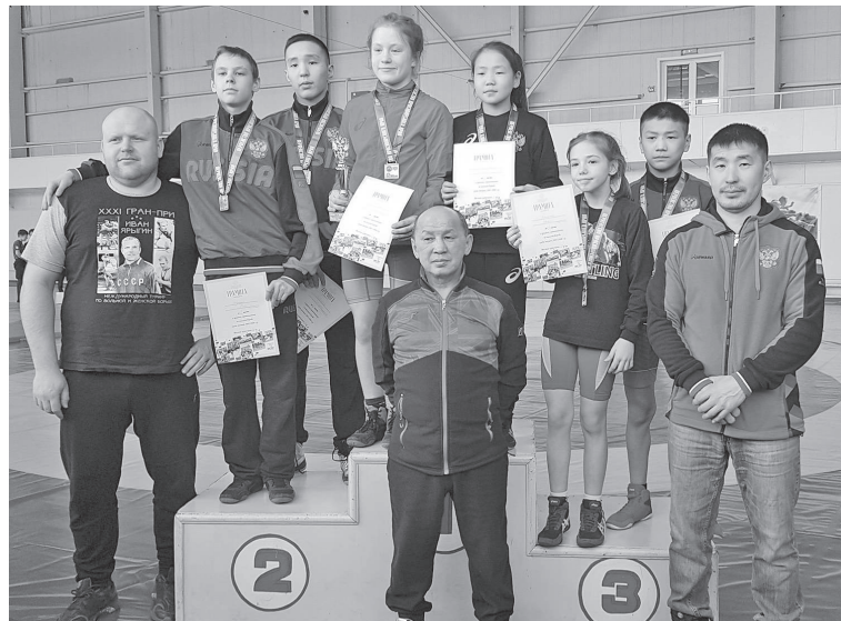
Спортивный уровень эвенкийских борцов растет с каждым годом

В городе Шарыпово состоялись соревнования по вольной борьбе на первенство Красноярского края среди юношей и девушек 2005-2006 годов рождения.