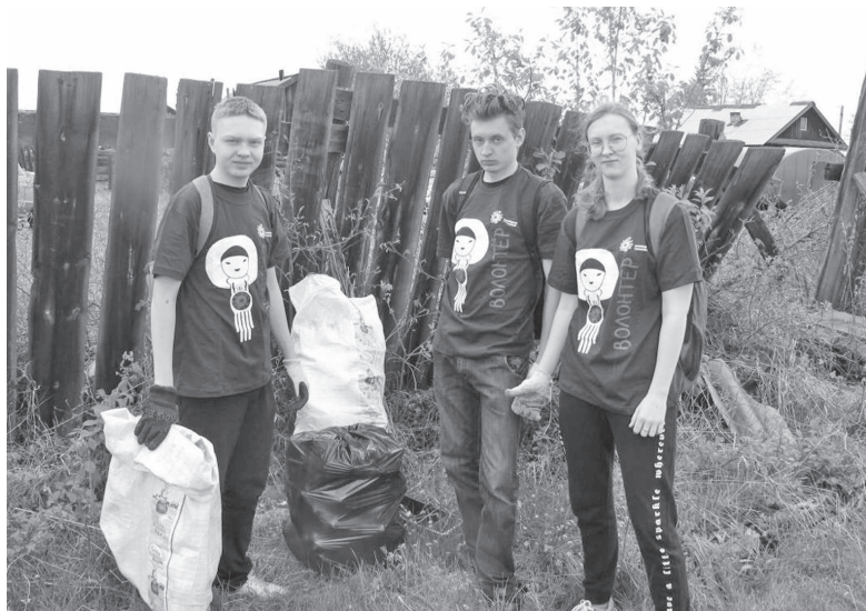
Мы - за чистое село

Работы носят системный плановый характер. Год от года количество собранной макулатуры все увеличивается. Если в 2014 году школьниками было собрано всего 1,5 тонны вторсырья, то в 2015 и в 2016 гг. объемы сбора увеличились до трех тонн ежегодно, а в 2017 и в 2018 годах ребята собирали уже по четыре тонны макулатуры в год. Таким образом, ванаварские школьники за прошедшие 5 лет собрали 310 деревьев. В 2019 году количество собранной 11-классниками ВСШ и 8-классниками Детского дома макулатуры составило пять тонн.