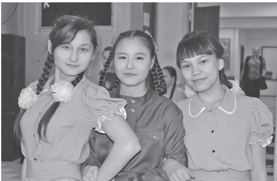
Фестиваль подружил юных участников