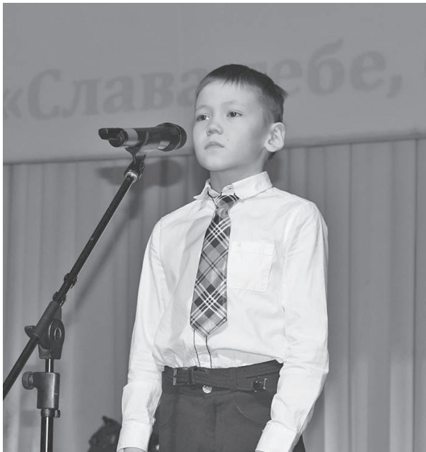
Малыши были рады выступить перед ветеранами