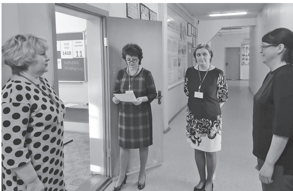
ЕГЭ для взрослых - по всем правилам