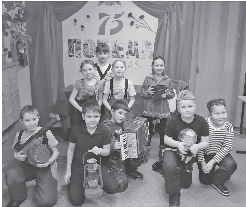
Ребята проявили взаимовыручку и смекалку

Н.В. МОИСЕЕНКО, специалист по социальной работе