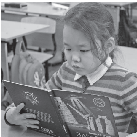
Мы любим читать!