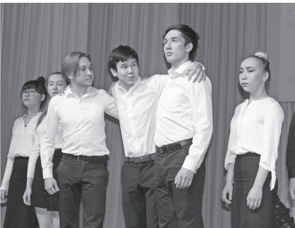
В этот день каждый присутствующий почтил память своих дедов и прадедов