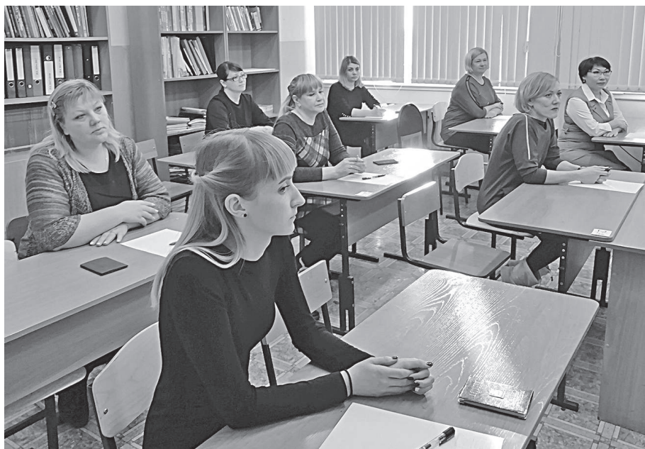
Родители прошли всю процедуру сдачи экзамена

Татьяна ВЛАСЕНКО По материалам МКУ «Эвенкийский архив»