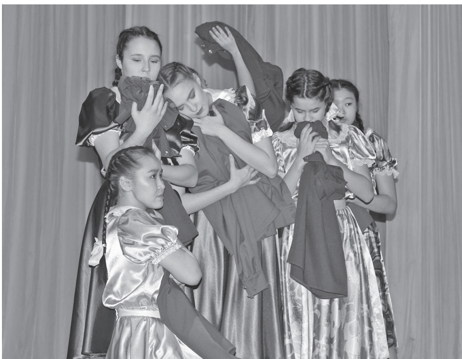
Многие номера были настолько трогательными, что вызвали самые сильные эмоции в зале