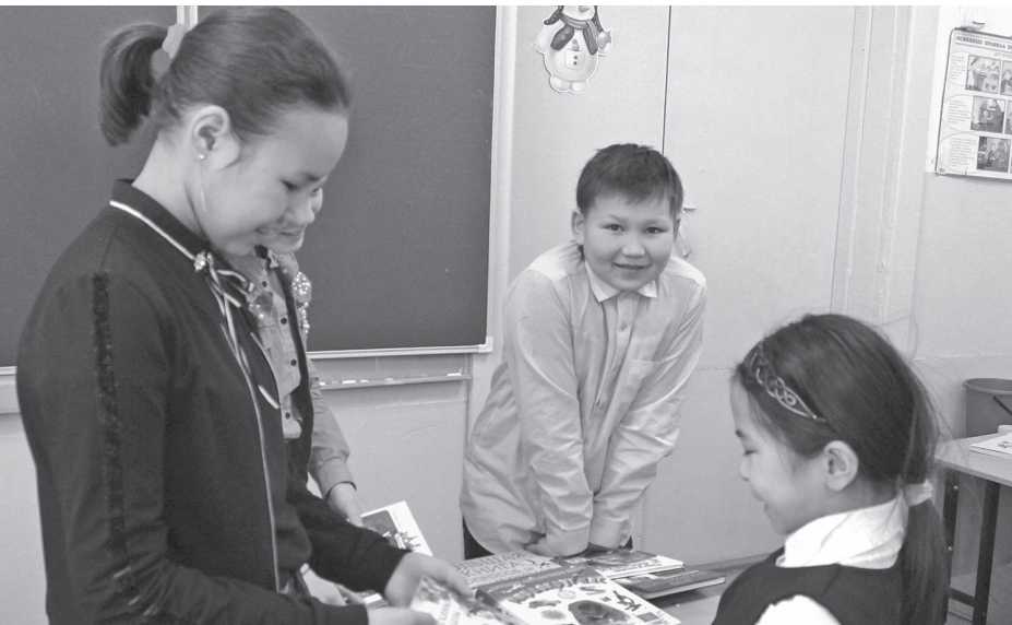
Хорошая акция подняла всем настроение

Целью и задачами акции были: воспитание духовно-нравственной личности, развитие у юных граждан Российской Федерации навыков добровольчества через участие в творческих акциях, привлечь обучающихся к чтению, популяризировать книгу на бумажных носителях, воспитать чувство ответственности и уважения к книге.