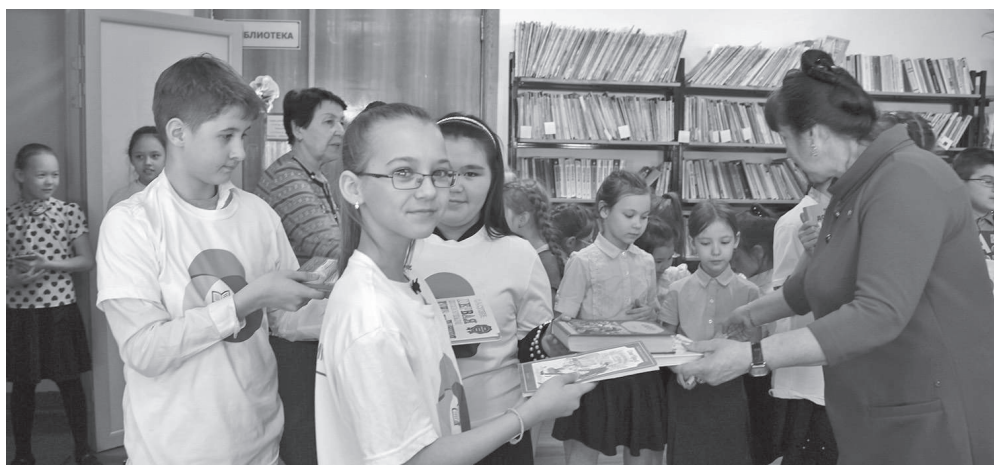
Книга - лучший подарок

В 2012 году появилась замечательная дата для книголюбов. 14 февраля стал Международным днем книгодарения. Главная идея праздника - вдохновлять людей по всему миру дарить хорошие книги и показать, что бумажное издание остается актуальным подарком и не теряет своей ценности даже в век цифровых технологий.