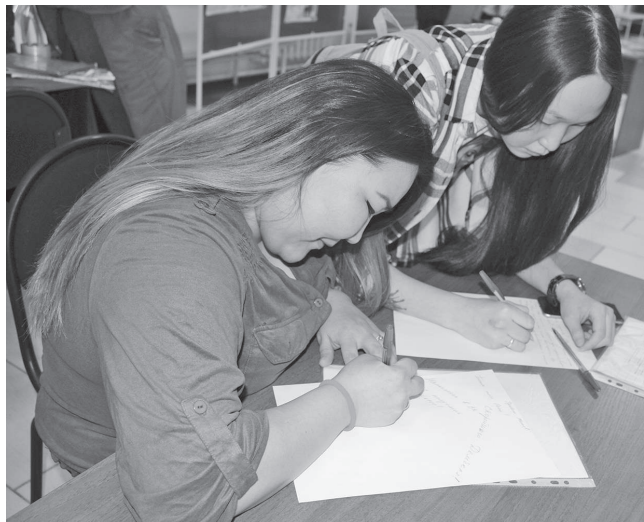
Акция «Письмо солдату»