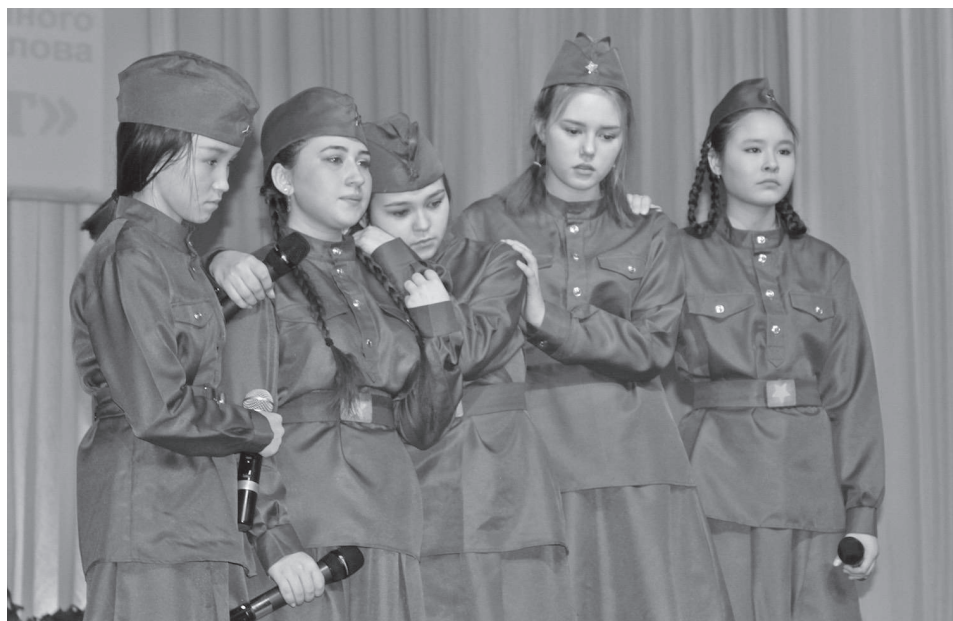
Учащиеся Туринской средней школы-интерната