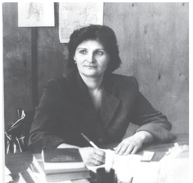
Любимой профессии посвящено 40 лет трудовой биографии

- Работу корректора я считаю очень ответственной, поэтому курьезов и промахов стараюсь не допускать, хотя случается всякое, никто от этого не застрахован. А вот когда, приехав в Туру, я устроилась наборщиком в типографию газеты «Советская Эвенкия», так как место корректора было занято, то в один из первых рабочих дней произошел нелепый случай. Я получила задание набрать текст бланка и, приступая к набору, лихо выдвинула кассу со шрифтом... Все литеры и