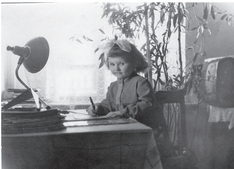
Будущий корректор «за работой» 1964 г.

- Да, очень! Я с раннего детства люблю читать, у нас дома была большая библиотека, много книг, журналов, газет. И даже телевизор не мог заменить общения с литературой. В школе любимым предметом был русский язык, по нему всегда получала пятерки, и если иногда