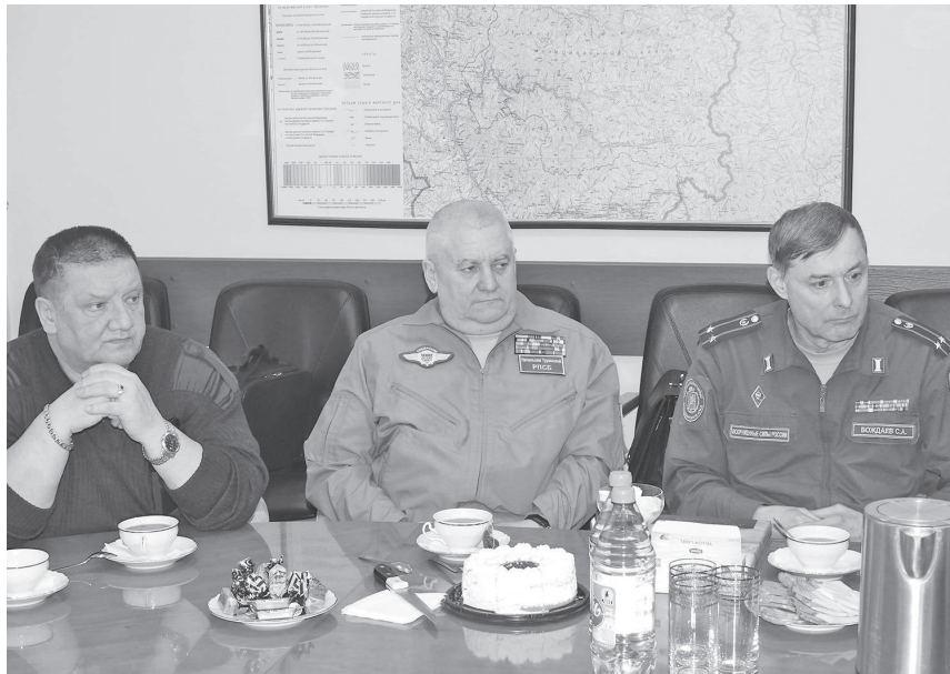
Многие воины-интернационалисты ведут активную общественную деятельность