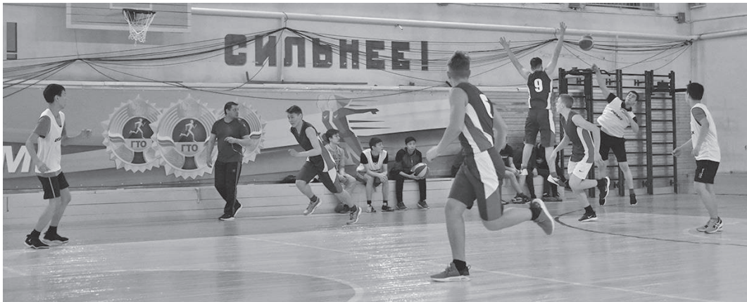
В игре было много ярких моментов

В Ванаваре прошел ставший уже традиционным блиц-турнир по баскетболу, посвященный празднованию Дня воина-интернационалиста.