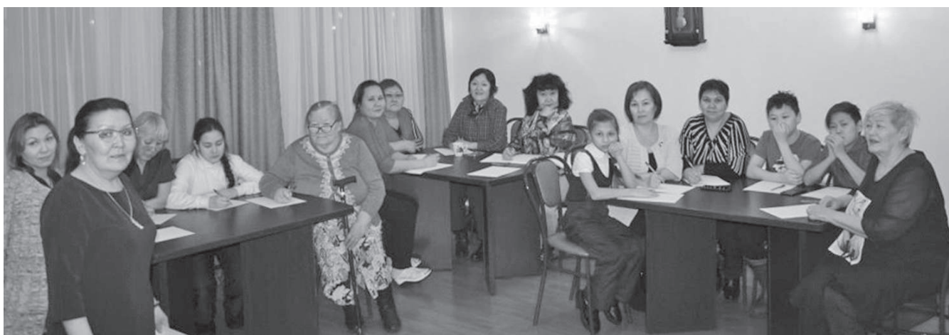
Турудылэ тангиттула эвэнкил диктантэвэ дукунарэ

Ге республикады акция «Республика Саха (Яку- тия) Долборды асукан тангучил тэгэл турэнди- тын диктантэвэ дукудап орирэ. Нунган аяврил турэр Международнай- дутын тырганидутын тэдевдерэн