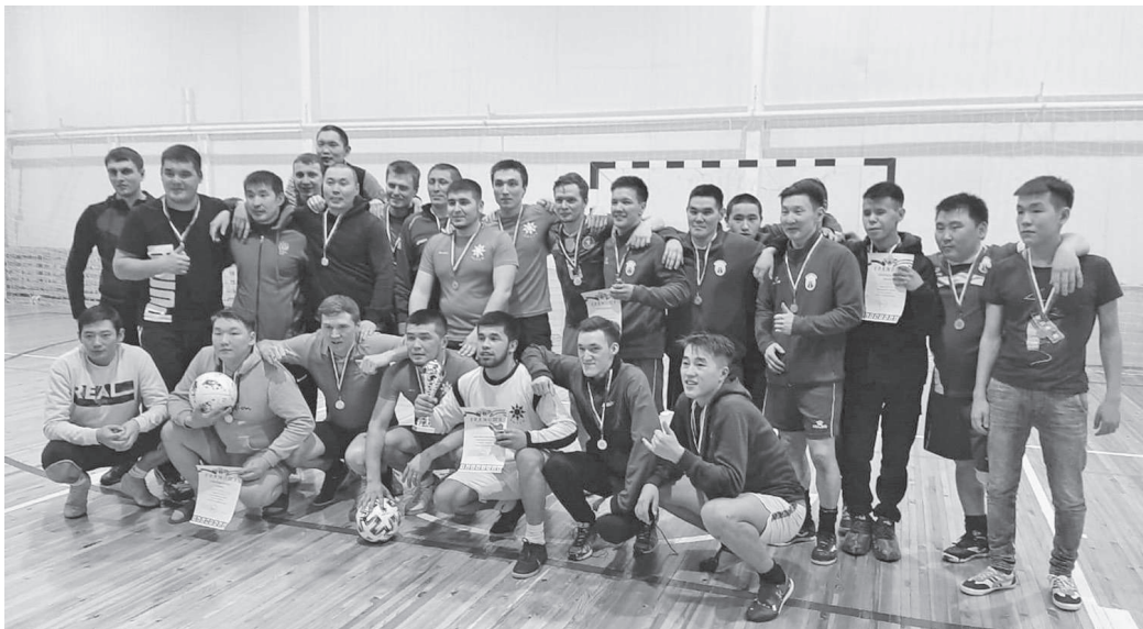
Гостями турнира стала команда из Суринды