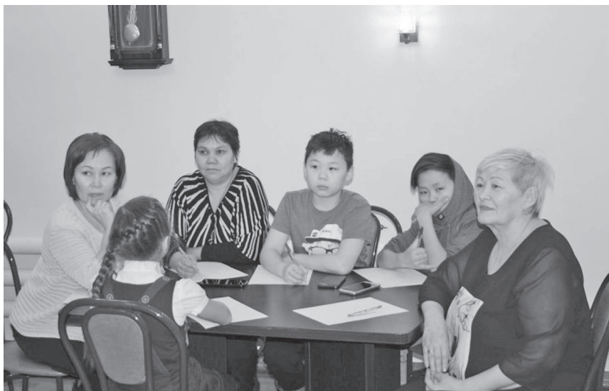
Эвэнкил аямамат дукурва долчатчара

Аннганиныкин митнгиду дуннэдут асу- кан тангучил бивкэл Международнаитын тырганинын бивки. Нунганман дюрдэр элэкэсиптыду гиравунду бегаду арчадья- вил. Эр аннганиду-да гүлэсэгду Туруду индерил эвэнкил таргачинма диктантэвэ дукудьячатын. Долборды асукан тангучил эвэнкил турэндитын дюрдягиду гиравун- ду бегаду Турудыду дулугуду книгалва тангитту диктантэвэ дян туннга эвэнкил, эвэнкилкар дукудьячатын. Эвэнкил дулу- гудук алагувкиттук А.Н.Немтушкин гэр- бидин гэрбивчэдук дюр бээткэр, умукэн асаткан, Турудыдук дулугудук алагувкит- тук умукэн асаткан тадук КМНС хэгдыгун, кунгакадыдук гүлэкэндук «Кучикамкура» гэрбичидук аичимнитын, дулугу книгалва тангит хавамнилин, кунгакадыдук гүлэ творчествадукин алагумнитын, хавадукви дэрүмкитчэри, олан, алагумни, кунгака- дыдук музыкальнэйдук алагумни-онемни тадук хунгтул эвэнкил дукудьячатын. Никаткуду эвэнкилкенду дян аннганилин бичэн, упкаттук эвэнкилдук сагдытмарду дяпкундэр аннганилин бичэтын. Мэнн- гивэл турэнмэл сарил илэл, мэннгивэл турэнмэл алагумнил дукурва тангдьяча- тын. Илэлду диктантава дукудьярилду, сертификатылва буденгэтын. Диктант ачин тамана одянган. Нги-дэ хунгту илэ