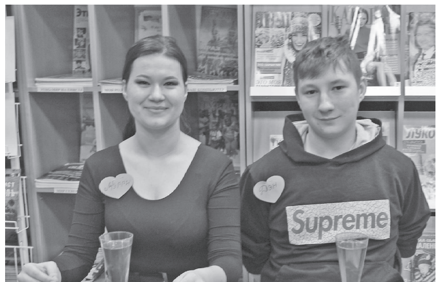
Участники книжных викторин пожелали, чтобы такие позитивные встречи стали традиционными

Сегодня перед библиотекарями стоит сложнейшая задача: по-новому организовать работу с читателями, наполнить ее атмосферой сотрудничества и взаимного доверия, увлечь чтением, познакомить с лучшими образцами художественной литературы. Поэтому необходимо показывать людям, что в библиотеке бывает весело.