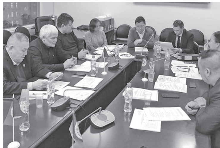
Участники поддержали предложения Ассоциации, задали интересные вопросы

Члены комитета по делам Севера и коренных малочисленных народов Законодательного Собрания Красноярского края приняли участие в селекторном заседании рабочей группы по подготовке предложений о внесении поправок в Конституцию РФ.