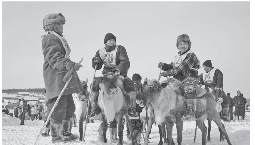
На свой профессиональный праздник оленеводы из тайги приезжают в поселок

Поселок Суринда является, пожалуй, одним из самых самобытных и интересных для туристов мест Эвенкии с ярко выраженным национальным колоритом. Именно здесь проживает 98% эвенков, ведущих традиционный образ жизни, и именно здесь легко можно увидеть чудесного друга эвенка - оленя. Суринда - идеальное место для проведения большого праздника Дня оленевода.