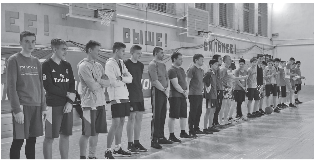
Четыре команды вышли на старт