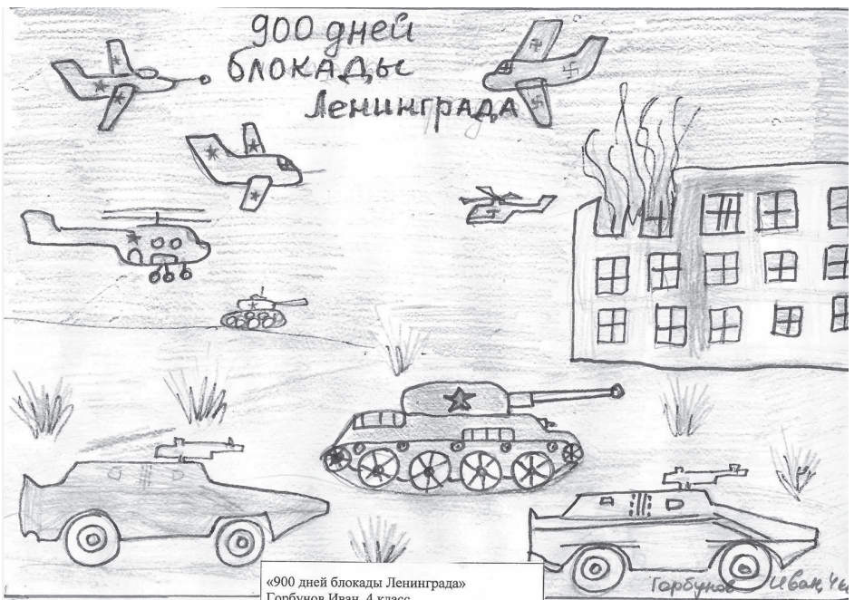
2 место - Иван Горбунов