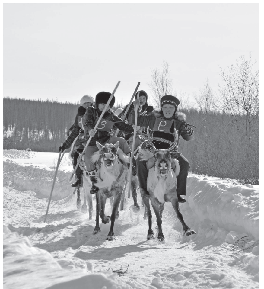
День оленевода - один из самых колоритных и ярких праздников Эвенкии, и к нему готовятся основательно

Татьяна ВЛАСЕНКО По материалам МКУ «Эвенкийский архив»