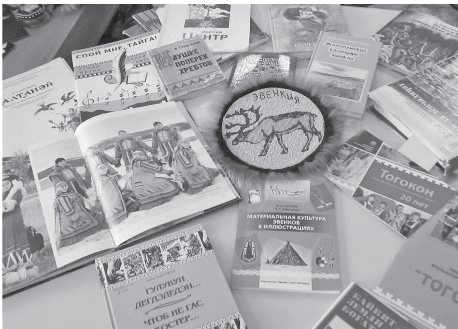
Читайте больше книг!