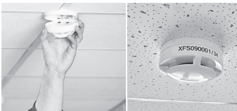
Дымовые извещатели являются эффективной мерой предосторожности при возгорании

В предшествующий период 2018- 2019 гг. в России отпраздновали 125-летие со дня образования Всероссийского добровольного пожарного общества», 100-летие со дня образования Советской пожарной охраны, 370-летие со дня образования Пожарной охраны. В 2020 году исполнится 30 лет МЧС России.