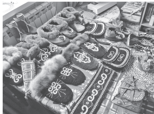
Книга состоит из основных эвенкийских терминов декоративного творчества