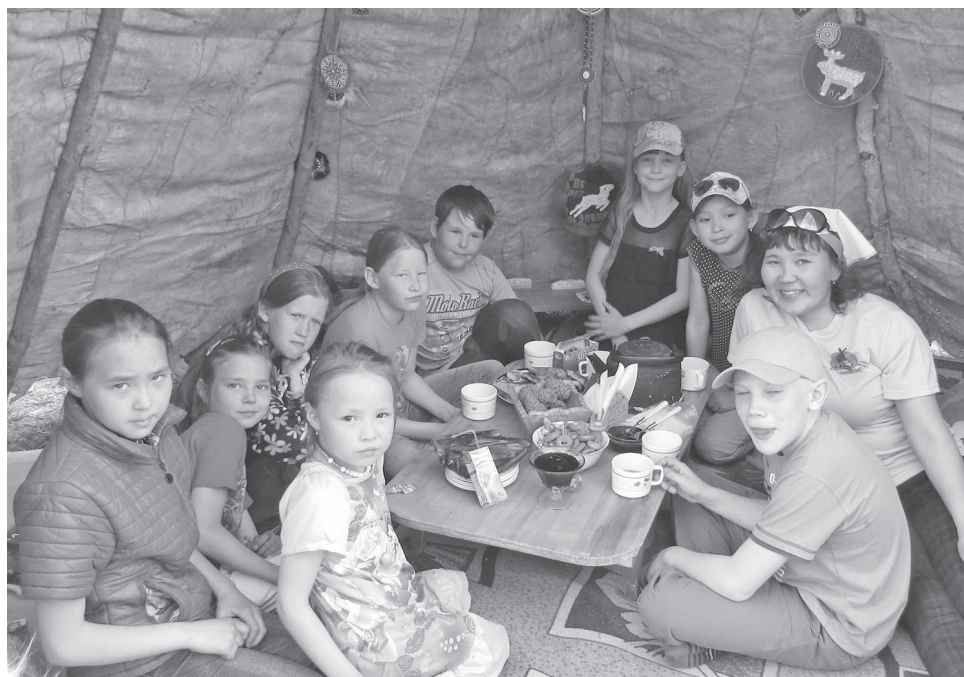
Здесь проводится множество интересных мероприятий