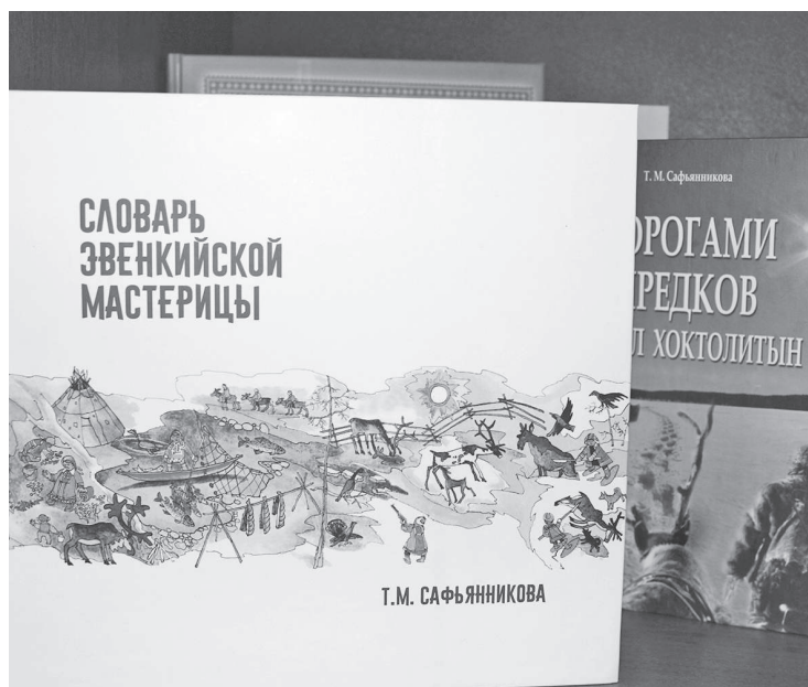
Важно сохранить эвенкийский язык!

В районном центре в различных учреждениях состоялась презентация новой книги Тамары Михайловны Сафьянниковой «Словарь эвенкийской мастерицы». В условиях постепенного ухода родного языка из разговорной речи молодого поколения эвенков это издание особо актуально. В нем представлены слова, фразы и предложения из жизни таежников на эвенкийском языке с переводом на русский. Сегодня на страницах «ЭЖ» мы предоставляем слово автору издания.