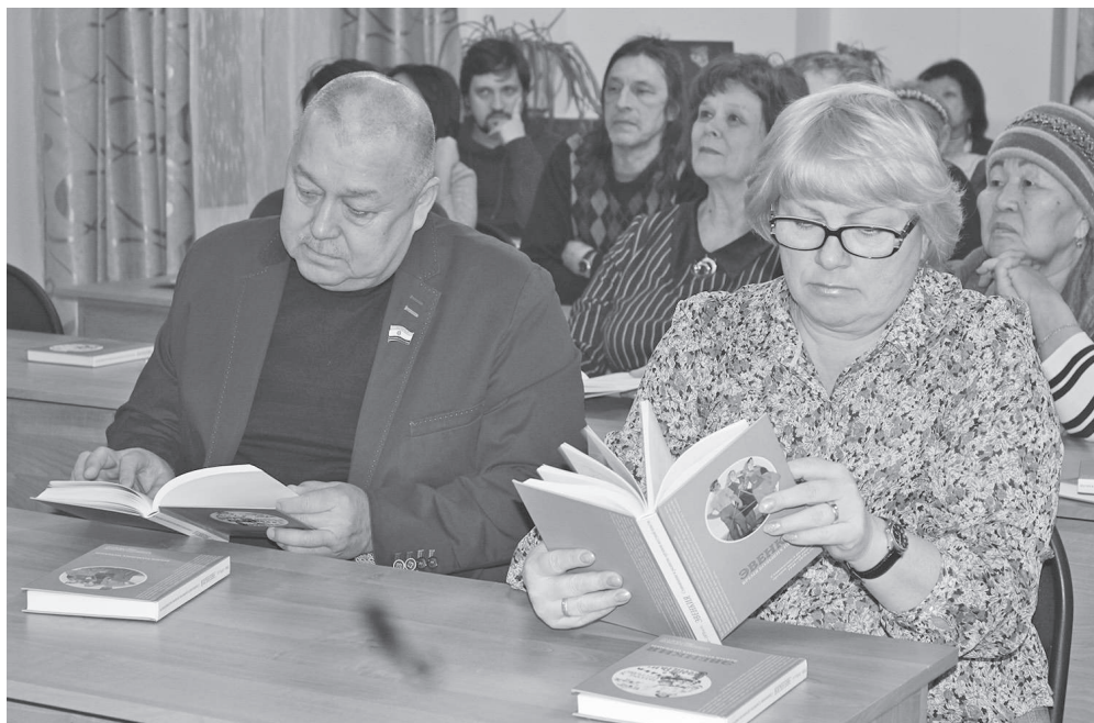
Экскурс в историю...