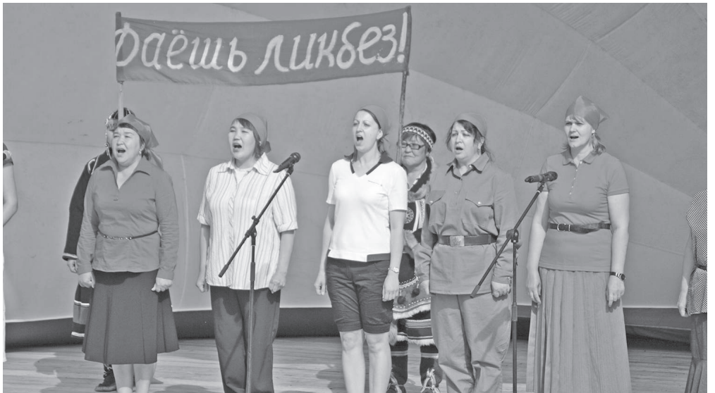
Мы несем культуру в народ!

Мне, как библиотечному работнику, бывает очень обидно и стыдно за то, что современные дети школьного возраста не знают, кто такие А. Гайдар, Н. Островский, Н. Носов... Мои пожелания молодому поколению: читайте больше книг! Плохих книг не бывает, есть плохие читатели.