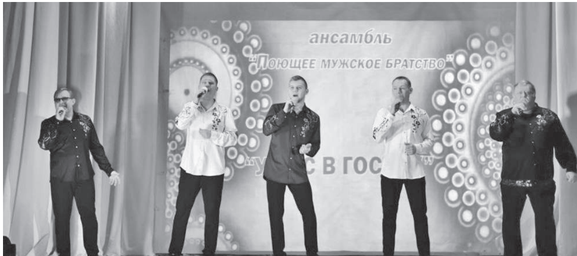
Прозвучали знакомые, любимые песни

Они представили вниманию зрителей яркую насыщенную программу. Под восхитительное исполнение красивых задорных песен хотелось плясать, а от сольных номеров просто «мурашки» бежали по телу. В репертуаре ансамбля присутствуют песни различных направлений, но их объединяет то, что они относятся к популярным, любимым народом. Им хочется подпевать и аплодировать.