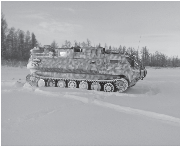
Ургэпчувэ хававэ-да одянарактын, тырганил сигилгэмэл бирэктын, тугэрилдули хоктолдули упкатва тэвулвэ дюгудерэ.