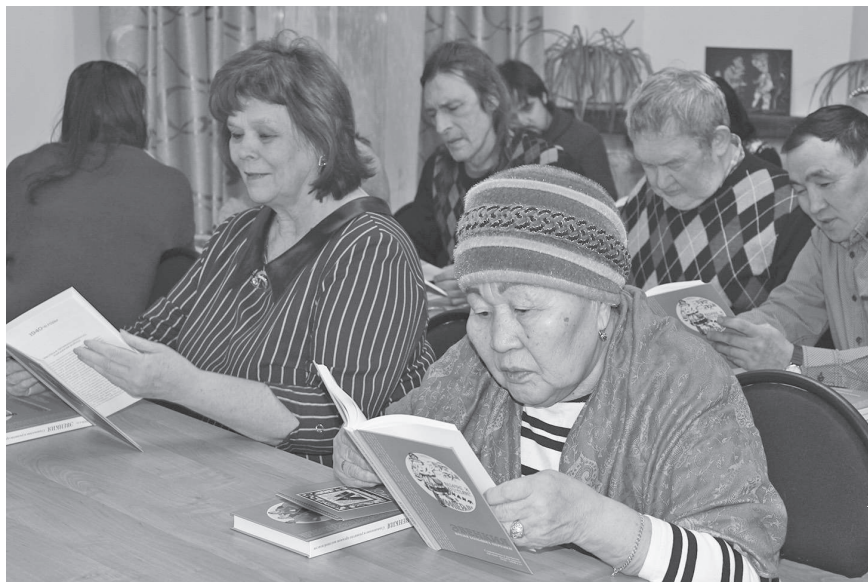
Книга вызвала большой интерес среди населения