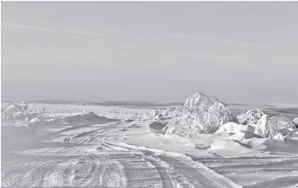
Хэгды сингилгэн буурэкин, хэгдыл машинал аят нгэнэдедэтын, хоктолво омнил тырганиыткин хоктолво дучангидянгкил.

Тугэрил хоктол кэтэвэ аннганилва митнгиду дол- бордылду дуннэлду соткулди хоктолди биси. Нунгар- дулитын адытанэлвэ тэвулвэ нгэнэвуктэденгкил.