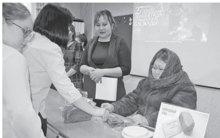
Акция «Блокадный хлеб»

В России в очередной раз вспомнили знаменательное событие, изменившее ход Великой Отечественной войны. Ровно 76 лет назад была прорвана блокада Ленинграда. К этой дате в библиотеках Эвенкийской ЦБС были организованы памятные мероприятия, участниками которых стали 323 жителя района.