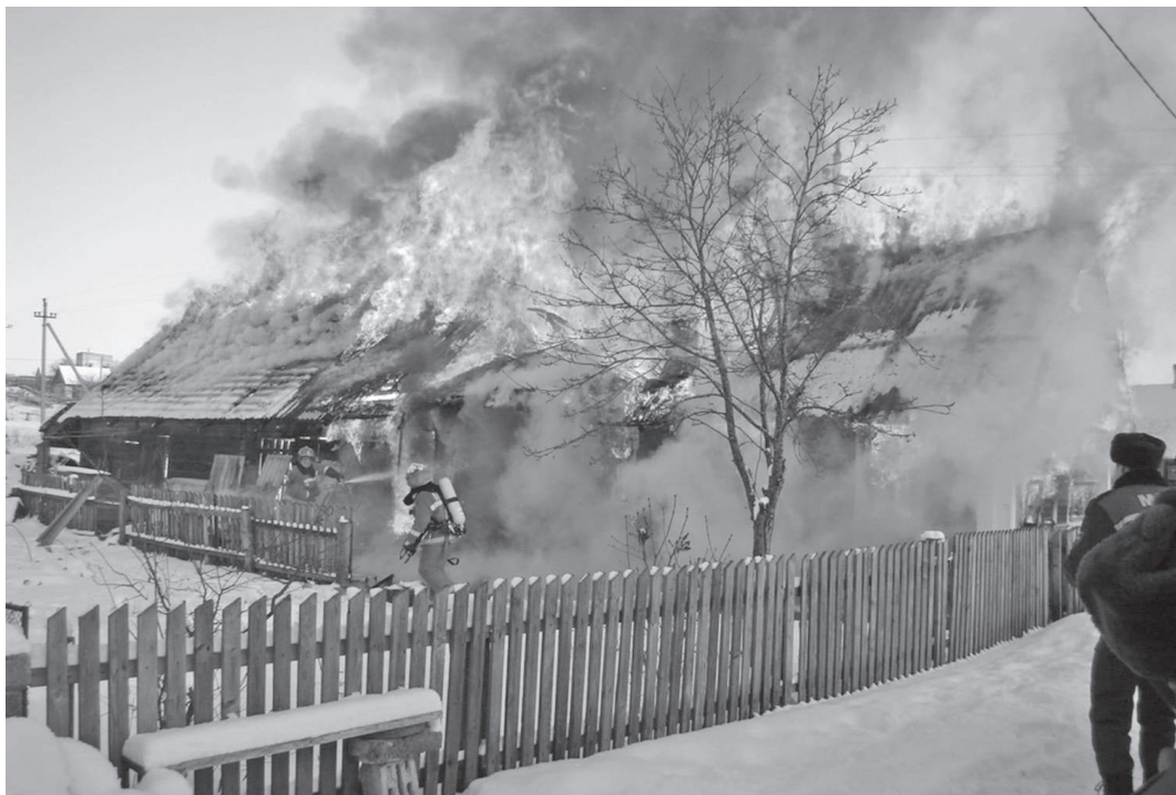
Большое количество бытовых пожаров происходит по вине самих граждан

Знаменательные даты пожарной службы - это не только праздничные мероприятия, но и масштабная работа с населением по профилактике бытовых пожаров в жилом секторе и на объектах с массовым пребыванием людей. С января 2020 года учреждение федеральной противопожарной службы перешло на функционирование в новой организационно-штатной структуре, соответственно сменилось наименование отряда на 9-й пожарно-спасательный отряд федеральной противопожарной службы государственной противопожарной службы Главного управления МЧС России по Красноярскому краю, в состав которого вошли пожарно-спасательные части: ПСЧ-71 п. Тура, ПСЧ-72 с. Байкит, ПСЧ-73 с. Ванавара. Несмотря на проведенные организационно-штатные мероприятия, функции и задачи подразделений пожарной охраны на территории Эвенкийского района остаются неизменными, а именно, в соответствии со ст. 4 Федерального закона от 21.12.1994 ФЗ №69-ФЗ «О пожарной безопасности», основными задачами пожарной охраны являются: организация и осуществление профилактики пожаров; спасение людей и имущества при пожарах, оказание первой помощи.