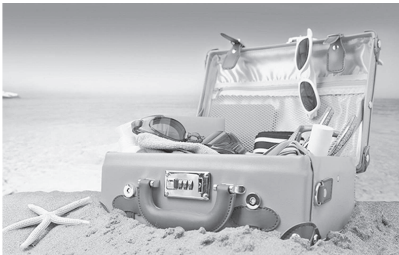
Рано или поздно отпуск придет!

Все мы действительно часто думаем об отпуске, особенно в напряженные и загруженные работой периоды. Возможно, освободиться получится еще не скоро, но попробуем не только мечтать, а даже начать подготовку к отдыху – это приятно и полезно. Чтобы отпуск получился по-настоящему радостным и полезным, отнестись к его организации нужно максимально серьезно и обстоятельно.