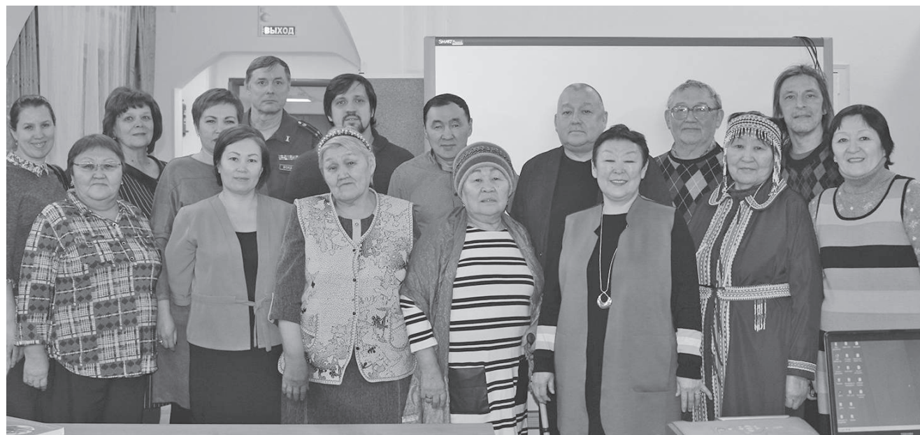
Новое издание вместило огромное множество архивных свидетельств