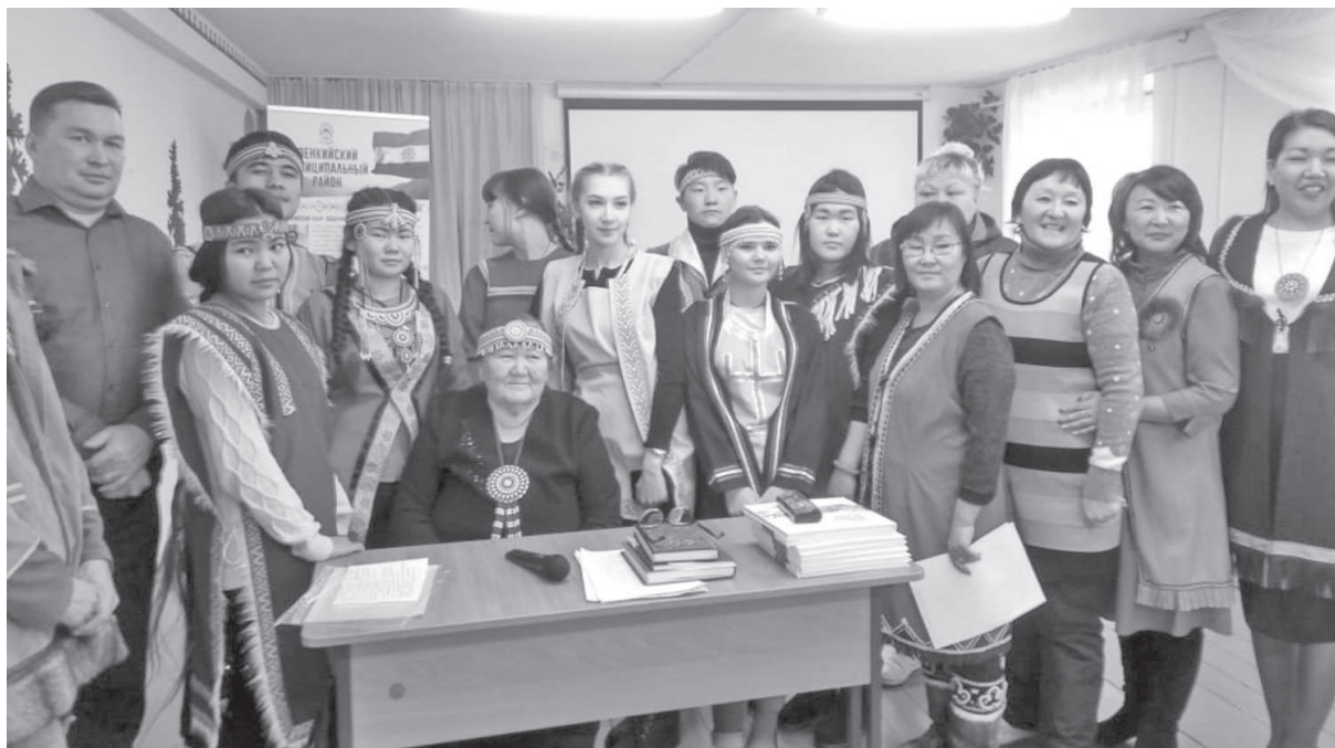
На презентации в Туринской средней школе-интернате