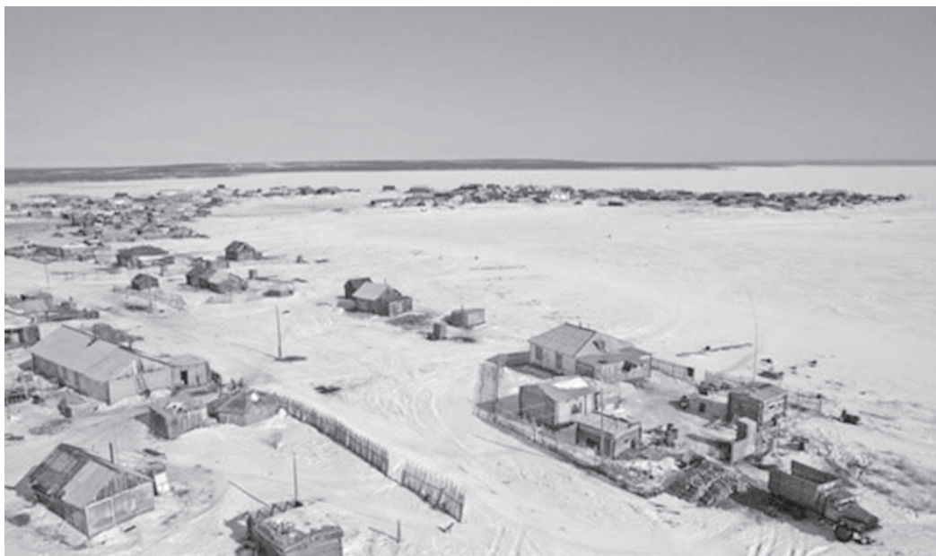
В самом северном поселке района - Есее - появится сотовая связь

Обеспечение надежной связью всех населенных пунктов Эвенкии в настоящее время является одной из приоритетных задач районной власти. В настоящее время из 23-х поселений района только в трех, самых крупных, существует и функционирует мобильная коммуникация: в райцентре Туре, Байките, Ванаваре.