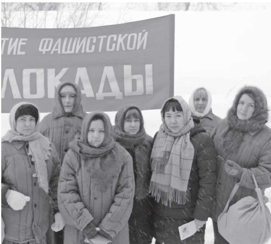
Сохранение памяти о героях - это самый доступный способ выразить им свое отношение

Главная цель акции «Блокадный хлеб» - желание сохранить память о трагедии, с которой столкнулись ленинградцы. В блокадном Ленинграде хлеб был высшей ценностью. За буханку люди были готовы отдавать любые семейные ценные вещи. Потеря карточки на выдачу суточного пайка являлась трагедией.