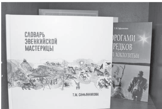
Эвэды олан турэрукин