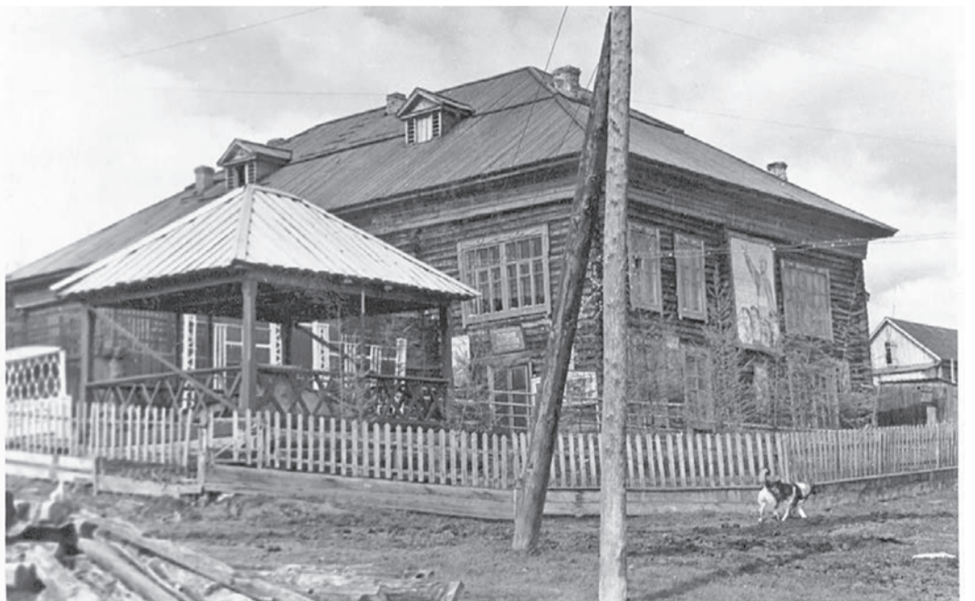
Байkitский клуб, где размещалась райбиблиотека, 1953 г.