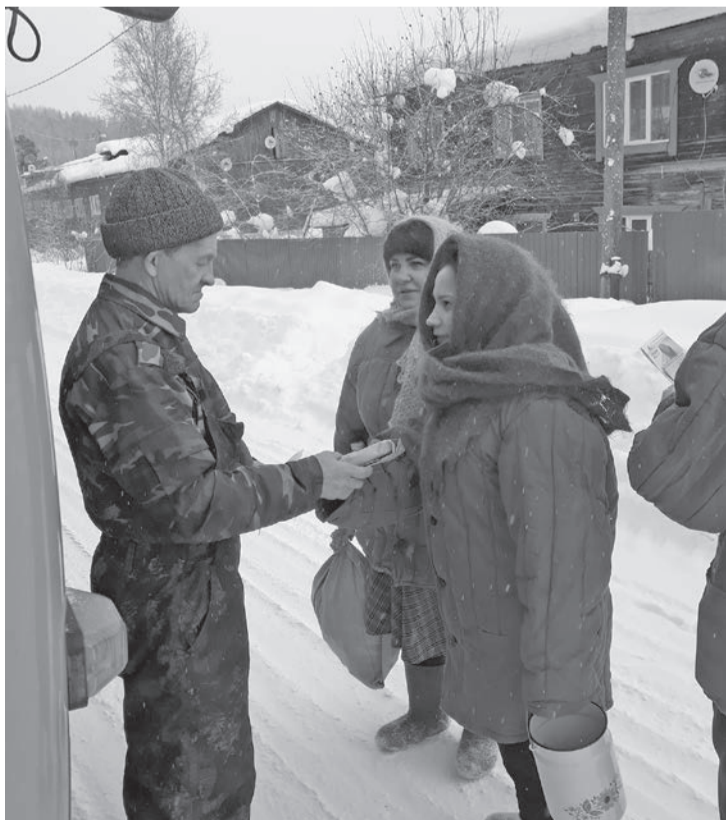
Блокадный хлеб как символ стойкости и мужества