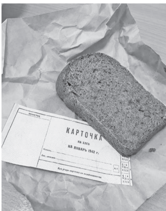
Каждый, кто брал в руки кусочек черного хлеба, символически прикасался к истории своей страны

Январский день 2020 года, в который жители п. Тура вспоминали великий мужественный город Ленинград, был наполнен различными мероприятиями. В школах прошли уроки памяти, где ребята еще раз увидели страшные кадры кинохроники и услышали, как жил и работал осажденный город на Неве. В туринских магазинах «Луч» на ул. Борисова и «Горячий хлеб» на ул. Кочечумская были организованы акции «Блокадный хлеб». Такие же акции прошли в стенах Эвенкийского многопрофильного и Туринского медицинского техникумов. Каждый житель Туры, беря в руки кусочек черного хлеба, осязаемо прикасался к истории своей страны. Да, этот «блокадный хлеб» 2020 года по рецептуре, конечно, совсем не тот, колючий и горький 1942 года, но он хотя бы символично дал благополучным жителям Эвенкии приблизиться к военному времени и осознать масштаб подвига ленинградцев. Тот блокадный хлеб имел в своем составе пищевую целлюлозу - 10%, жмых - 10%, обойную пыль - 2%, выбойки из мешков - 2%, хвою - 1%, ржаную обойную муку - 75%. Использовалась также коревая мука (от слова «корка»). Когда в Ладогe тонули машины, везшие муку в город, специальные бригады ночью крючьями на веревках поднимали мешки из воды. В середине такого мешка часть муки оставалась сухой, а внешняя промокшая часть при высыхании превращалась в твердую корку. Эти корки разбивали на куски, измельчали и перемалывали. Коревая мука давала возможность сократить количество других малосъедобных добавок в хлебе. Так из чего же был этот хлеб, хлеб блокады?