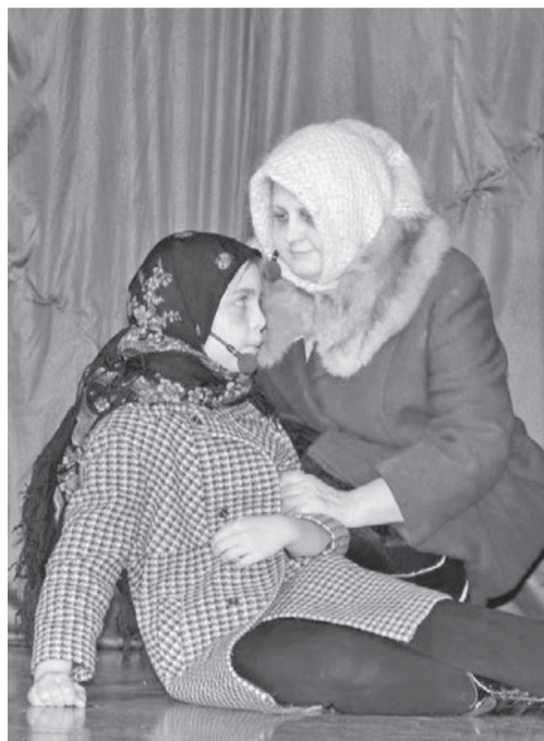
У многих, кто смотрел спектакль, наворачивались слезы

В этот воскресный день в Ванаварском Доме культуры собралось практически все село. Мероприятие, организованное творческим коллективом