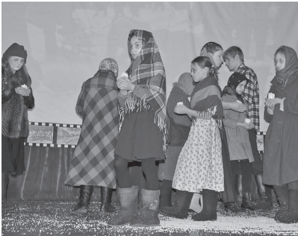
Фрагмент постановки: ленинградские тяжелые дни

И еще одна акция «Блокадный хлеб» прошла в с. Байкит. Ее провели сотрудники управления молодежной политики, спорта и реализации программ общественного развития администрации ЭМР и студенты КГБПОУ «Эвенкийский многопрофильный техникум» в магазине ПК «Байкитский №4».