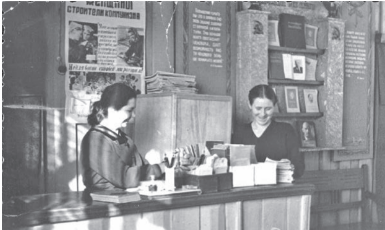
Читателей здесь всегда встречают с улыбкой