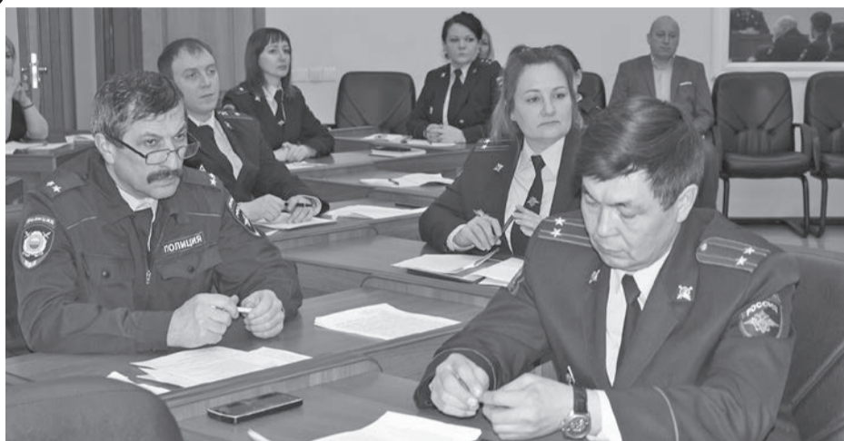
Кадровое обеспечение Отдела - один из актуальных вопросов последних лет

Штаб Отдела МВД России по Эвенкийскому району