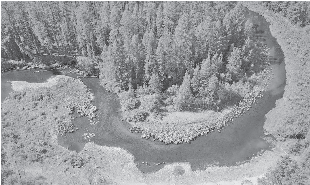
Заповедник «Тунгусский» является особо охраняемой территорией

Как все особо охраняемые природные территории, заповедник «Тунгусский» является объектом общенационального достояния. Во время пребывания здесь необходимо следовать определенным правилам охраны и использования окружающей среды и природных ресурсов. Надзор за соблюдением заповедного режима осуществляют сотрудники ФГБУ «Государственный заповедник «Тунгусский». Об этом подробнее в следующем материале.