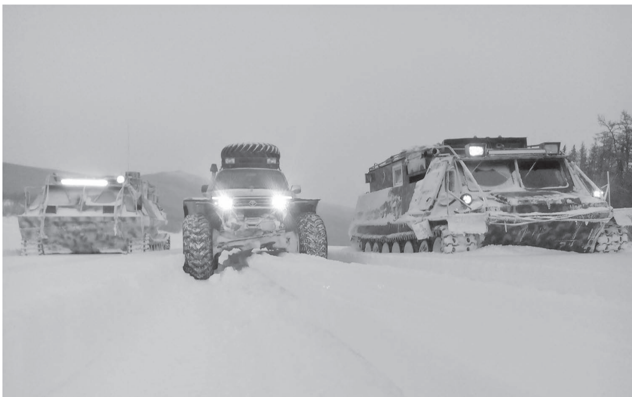
Обустройство зимних автомобильных дорог и обеспечение завоза грузов по ним – важнейшие направления деятельности районной власти

Зимники уже многие десятилетия для нашей северной территории остаются главными артериями доставки разнообразных жизненно необходимых грузов.