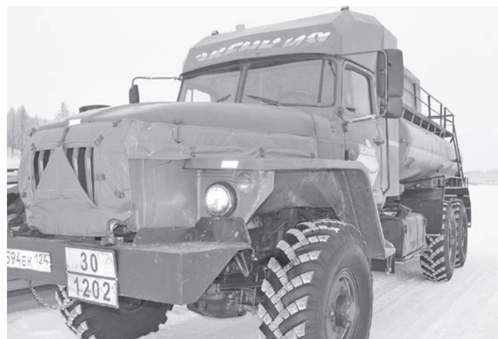
Несмотря на проблемы, связанные с погодными условиями, доставка грузов по зимникам идет в штатном режиме