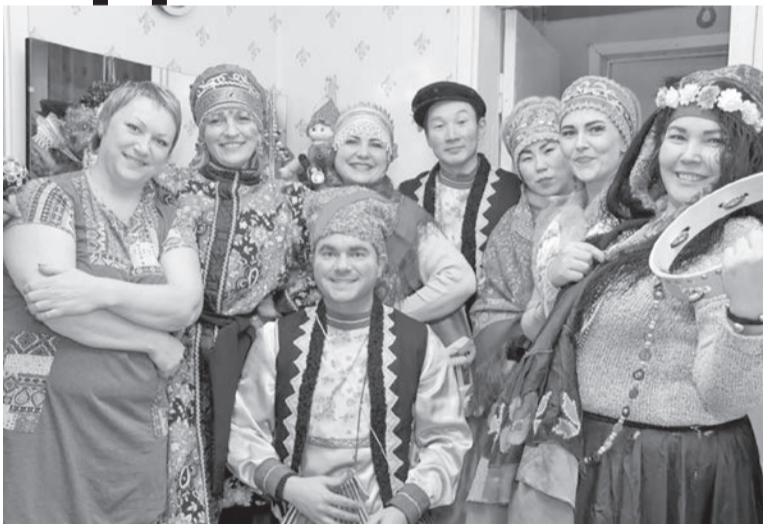
Заряд хорошего настроения холодной зимой!