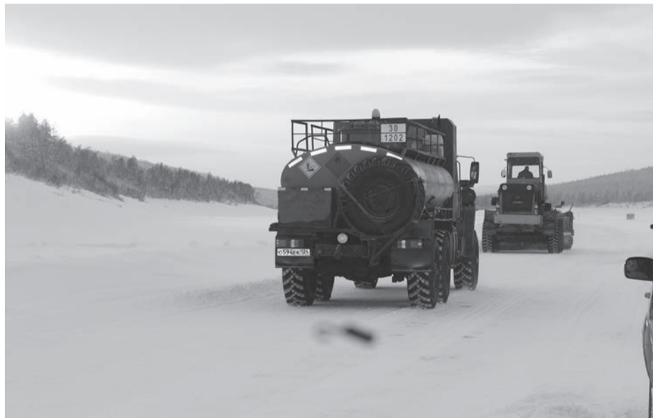
В настоящее время в Эвенкии открыты все направления автодорог, а их около 30