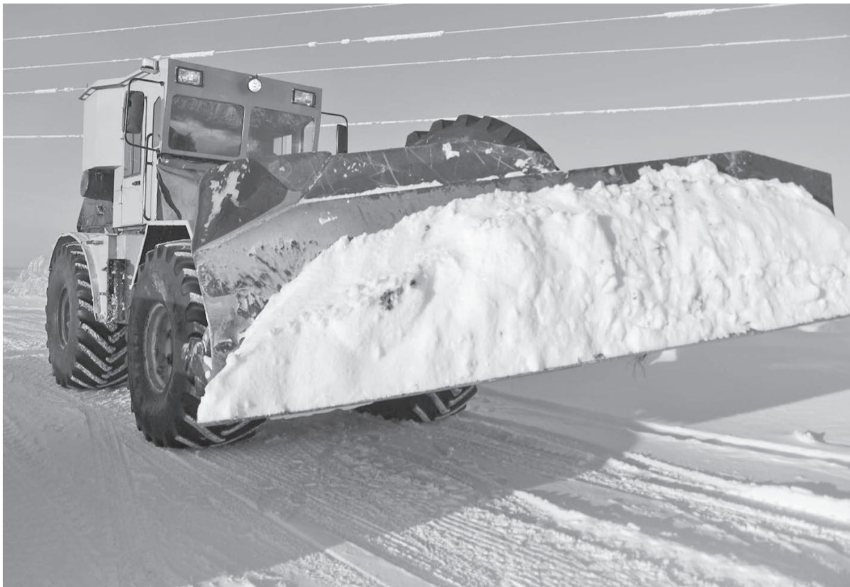
Работы по содержанию зимников включают в себя, прежде всего, их расчистку