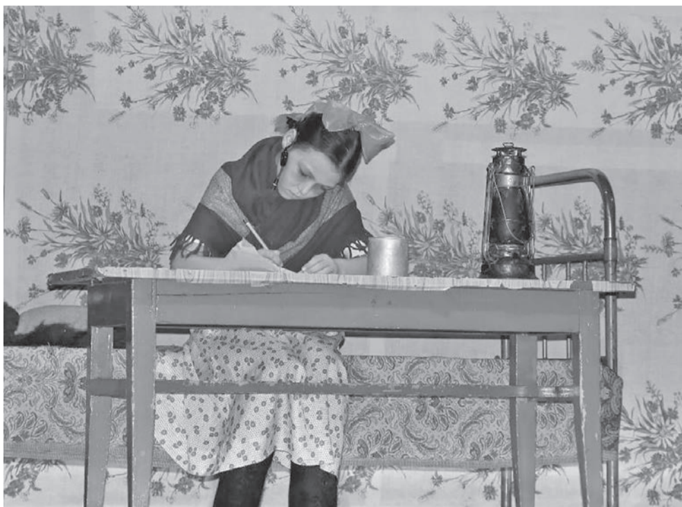
Из дневника Тани Савичевой: «Умерли все. Осталась одна Таня...»