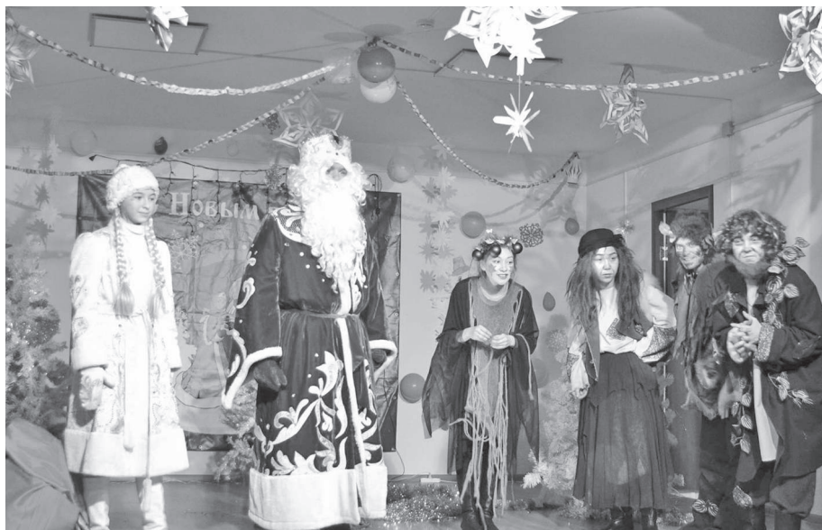
Дети были очень рады!

Этот визит жителям Нидыма, и особенно детям, всегда доставляет много радости. Сказочный сюжет новогодней истории с обилием интересных и забавных персонажей вызывает у юных зрителей массу эмоций. Перипетии лесных приключений Деда Мороза, Бабы Яги, Лешего и Пенька, закончившиеся, как и положено в новогодних сказках, полной победой добра, которое олицетворяли лесные жители, над злом в образе браконьеров, в финальной части привели к тому, что Дед Мороз с помощью волшебства зажег огни на елочке и исполнил желания всех персонажей. Как всегда, дети из зрительного зала очень активно помогали главным героям, ругали браконьеров и танцевали под веселую финальную песню. Все остались довольны. Завершилась поездка творческого коллектива групповыми фото нидымских детей с персонажами сказки и большой куклой - символом года.