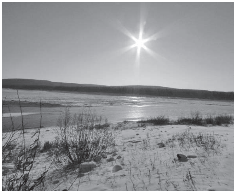
Ветер и лед, но никто не поймет тепло эвенкийской земли...

Красноярский музыкальный коллектив существует с конца 80-х в направлении фолк-эстрада-поп-рок. Он не только записывает и исполняет свои песни, но занимается обработкой русских народных мелодий с бережным сохранением их истинного духа, а также работает с патриотической авторской песней. А еще значительная часть творчества группы посвящена Северу. «Заполярный роман», «Эвенкия», «Хатанга» и другие песни очень любимы эвенкийцами.