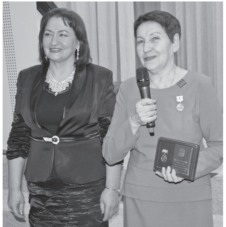
На праздничном вечере чествовали ветеранов педагогического труда

Остались позади юбилейные хлопоты, а вместе с ними переживания, бессонные ночи, несколько месяцев напряженного и кропотливого труда. Байкинская средняя школа гостеприимно распахнула двери для всех, кто пожелал поздравить ее коллектив с 90-летием. Праздник, посвященный этой солидной дате, состоялся в самом конце минувшего года.