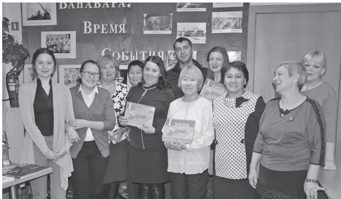
Фото на память о теплой встрече

В этот раз желающих познакомиться с прошлым села было так много, что все места в читальном зале библиотеки оказались заняты. Коллектив библиотекарей и ванаварские архивисты подготовили большую выставку фотоматериалов из прошлого и настоящего родного села и выставку краеведческой литературы на тему истории заселения и развития с. Ванавара. Пришедшие на мероприятие жители с интересом с ней ознакомились.