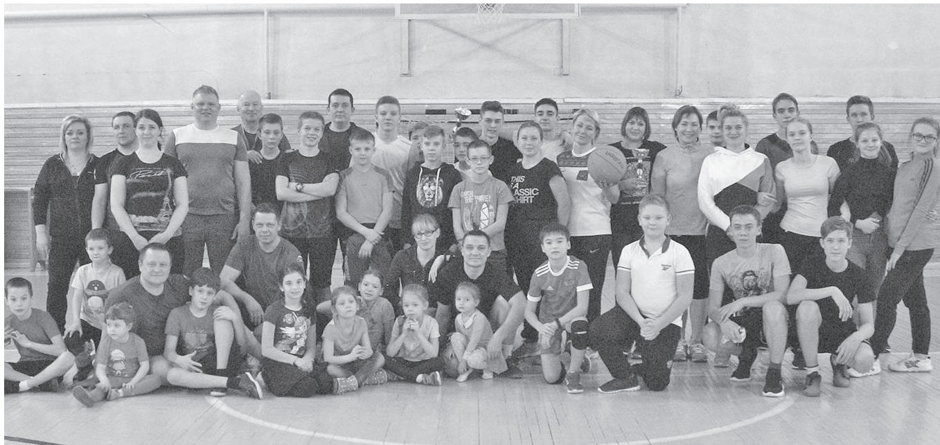
Совместный активный досуг укрепляет семью

Ванаварский филиал детско-юношеской спортивной школы в своей работе уделяет много внимания не только своим воспитанникам, но также системно пропагандирует здоровый образ жизни в семьях юных спортсменов.