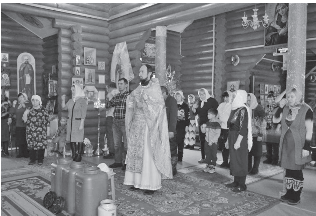
Крещенский сочельник в Свято-Тихоновском храме в с. Байкит