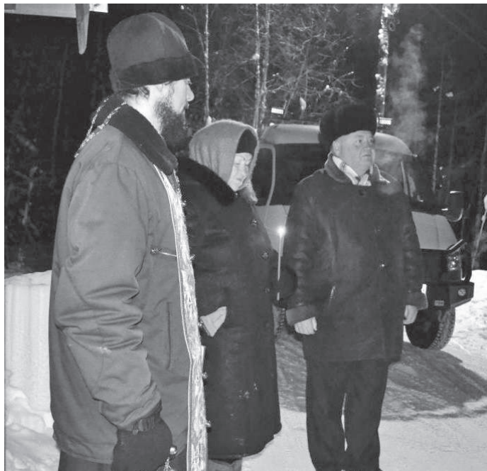
Верующие пришли к источнику в полночь