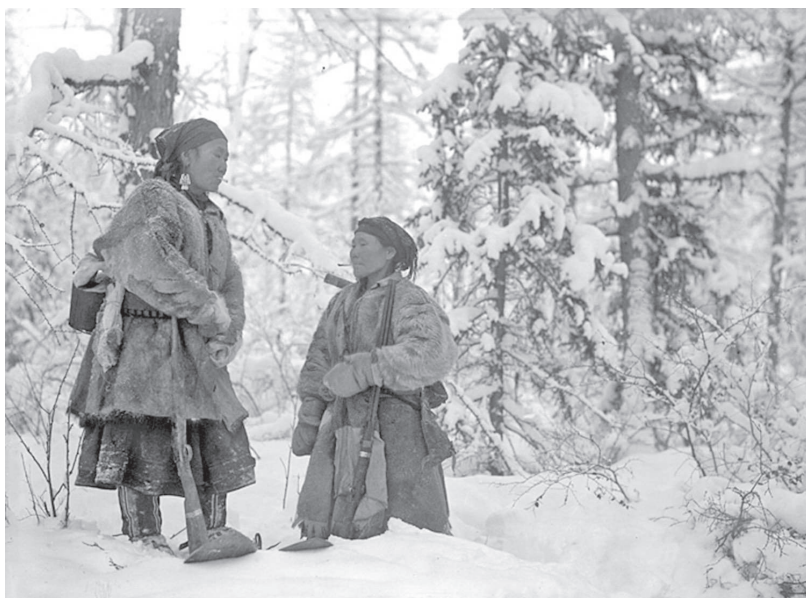
Асал бултакитту арчалдыра

Гетыкинду илэду делум мэннгин бивки. Асиду-да мэннгин делум кутун бисин. Кутучи бидэви аси мэнми, эдыви, хутэлви сот аявдемэчин бисин. Кутучи асиэсалин кутут гарпадявил. Аси кутучи бивки кэргэндун ая бирэкин, хутэлин авгарал бисикитын