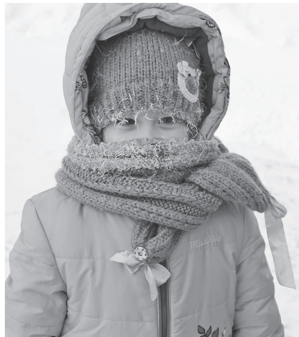
В Эвенкии крещенские морозы достигали и до минус 45-50 градусов, но при любой температуре северяне идут к символической иордани и умываются святой водой из проруби