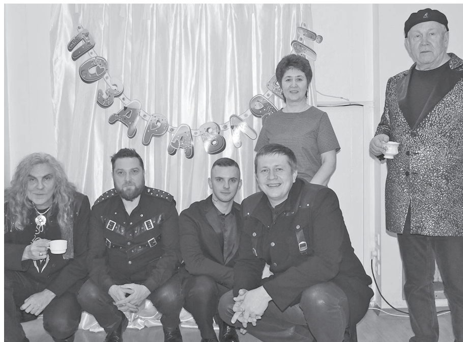
Эвенкийцы всегда рады приветствовать «Яхонт» на своей земле