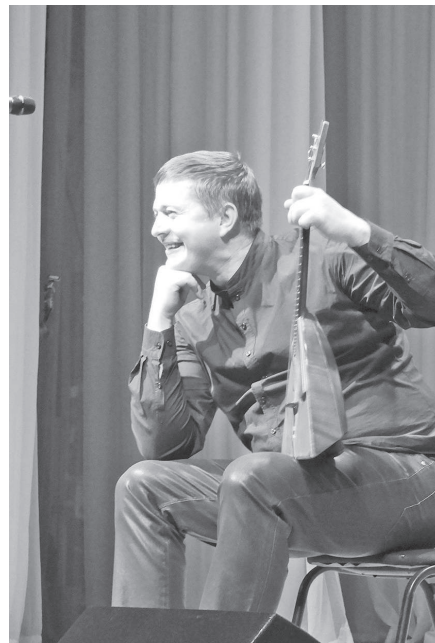
Песни группы очень патриотичны и пронизаны любовью к родному краю