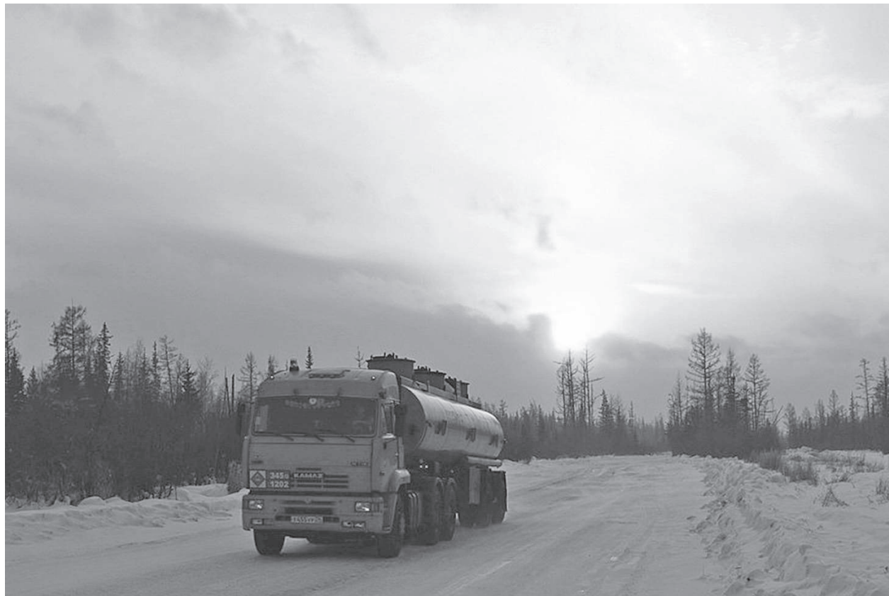
Доставка нефтепродуктов продолжится до окончания эксплуатации зимников

С середины декабря в Эвенкийском районе начался завоз нефти и нефтепродуктов по зимним автомобильным дорогам.