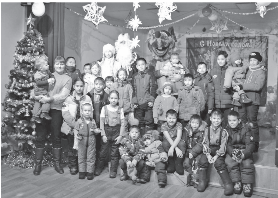
ТЮЗ - в Нидыме

Ежегодно по традиции коллектив Театра юного зрителя посещает с «Новогодней историей» поселок Нидым.