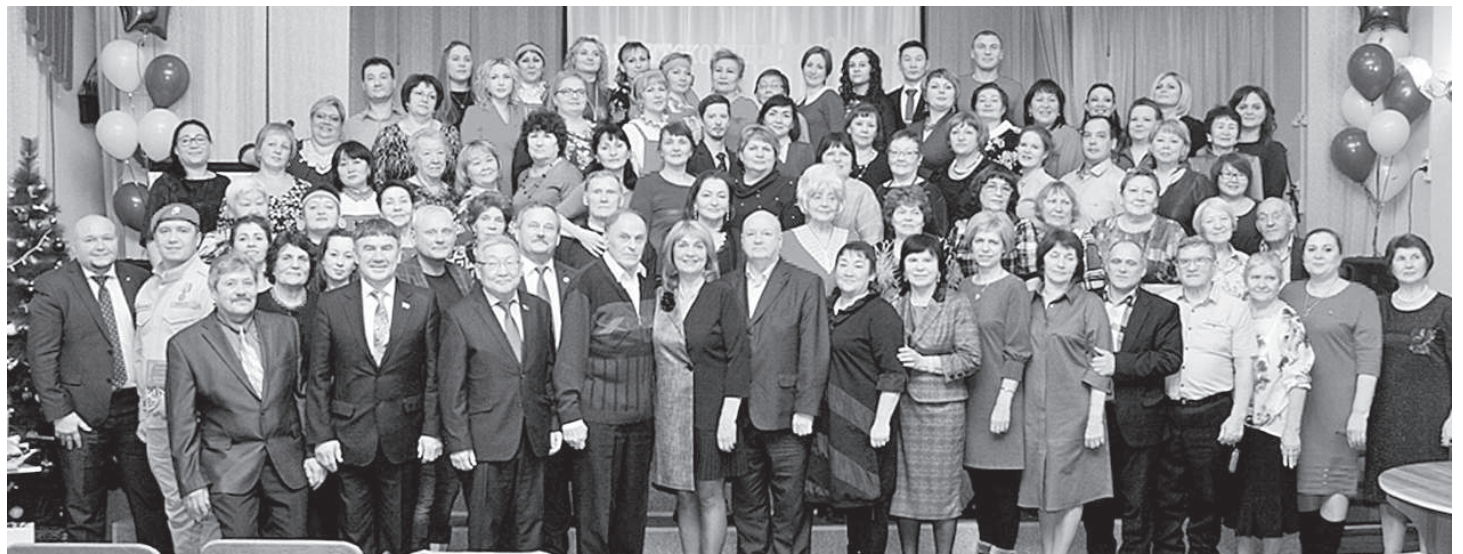
Юбилей получился ярким и запоминающимся для всех его участников!

Остались позади юбилейные хлопоты, а вместе с ними переживания, бессонные ночи, несколько месяцев напряженного и кропотливого труда. Байкинская средняя школа гостеприимно распахнула двери для всех, кто пожелал поздравить ее коллектив с 90-летием. Праздник, посвященный этой солидной дате, состоялся в самом конце минувшего года.