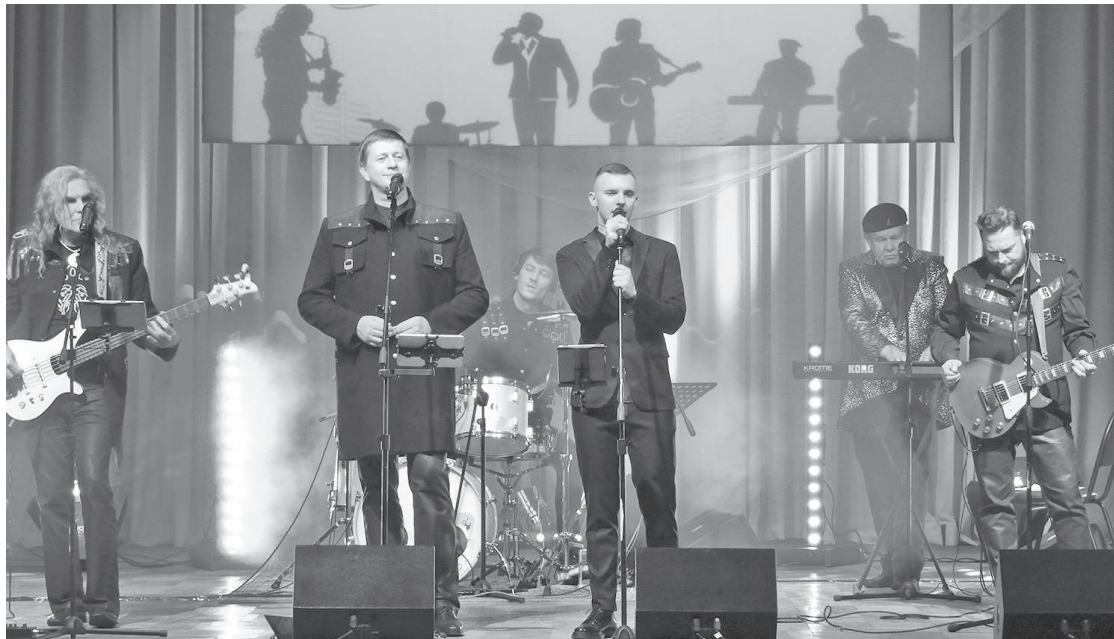
«Мы желаем вам добра!»