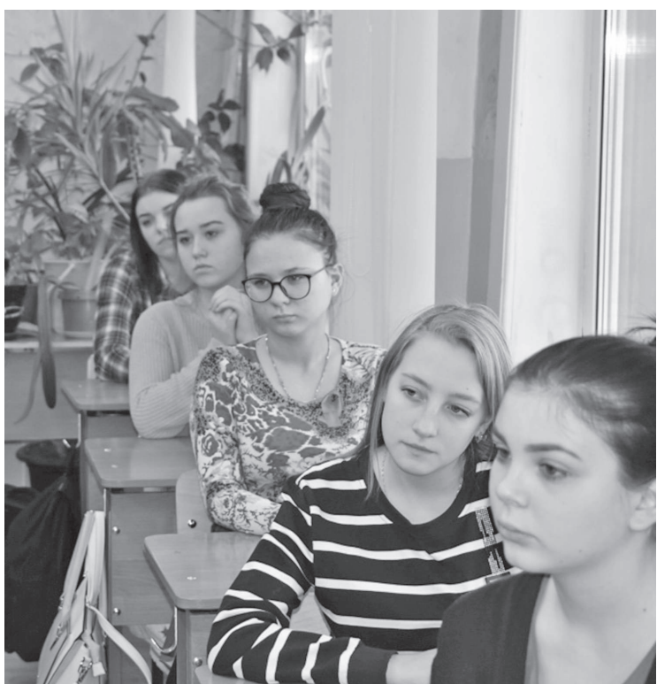
Каждый человек выбирает сам жизненные принципы

В декабре специалисты молодежного центра «Дюлэски» с. Бай-кит провели среди старшеклассников акцию, посвященную борьбе со СПИДом.