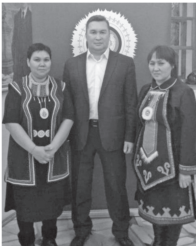
Важнейшая задача педагогов - сохранение эвенкийского языка

Чтобы быть профессионалом в своем деле, нужно непрерывно учиться. Один из способов совершенствования – это участие в специализированных семинарах, конференциях, съездах. Делегация учителей Туринской средней школы-интерната им. А.Н. Немтушкина приняла участие в одном из таких форумов.