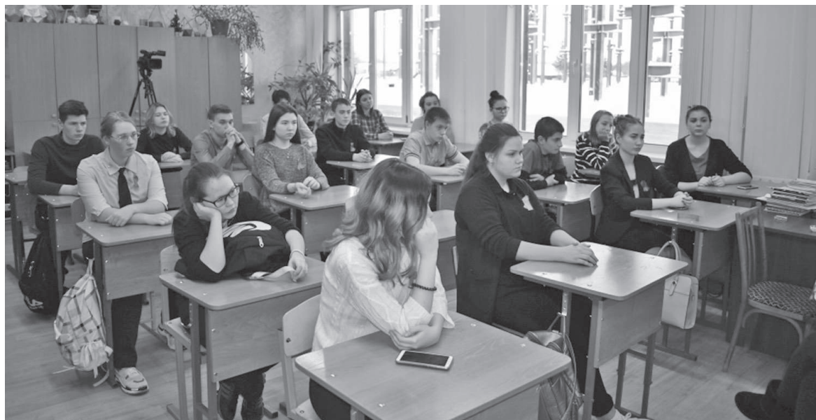
Привлечь внимание молодежи к острой проблеме - в этом основная задача организаторов

Ребятам выдали красные ленточки, которые являются международным символом движения против СПИДа, памяти об ушедших людях.