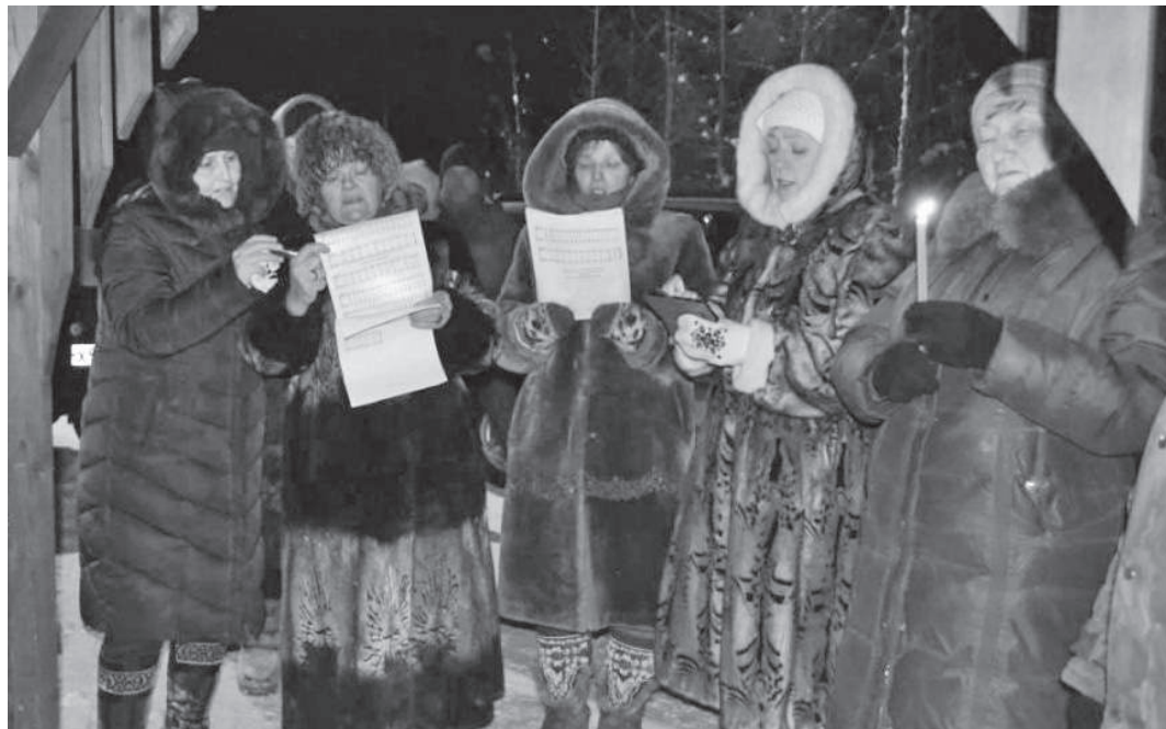
Особую атмосферу создавало пение певчих на морозном воздухе