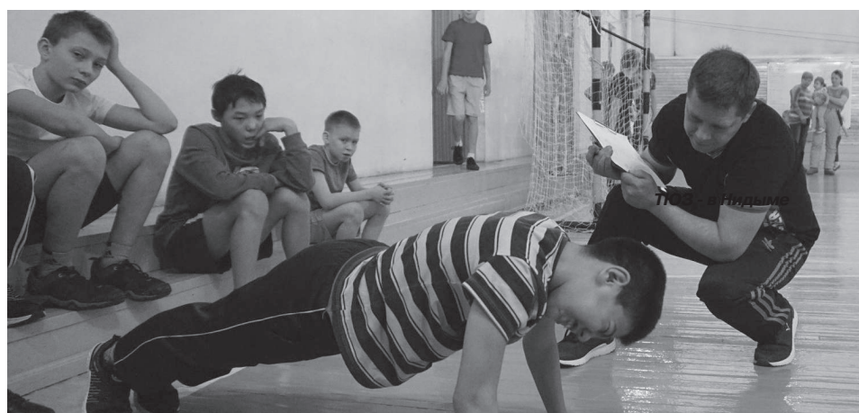
Участники соревнований выложились по полной

Отдел экологического просвещения ГПЗ «Тунгусский»