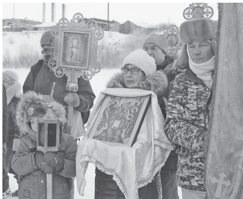
От Свято-Троицкого храма прихожане крестным ходом отправились к набережной поселка