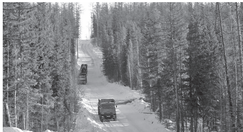
Автозимники в Эвенкии - дороги жизни

МКУ «Управление автомобильных дорог по Эвенкийскому муниципальному району» информирует пользователей зимних автомобильных дорог о том, что сегодня завершена работа комиссий по вводу в эксплуатацию участка автозимника «Тура-Байкит-граница Богучанского района» на участке 22-389 км.