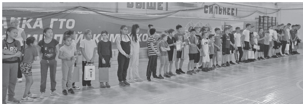
Совместная акция заповедника «Тунгусский» и ДЮСШ

11 января в России отмечается День заповедников и национальных парков. Именно в этот день в 1917 году был образован первый государственный заповедник России - Баргузинский, имеющий целью сохранение популяции баргузинского соболя на Байкале.