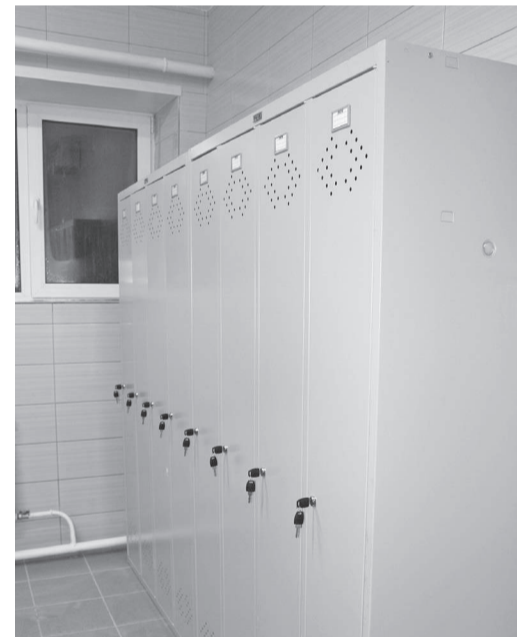
Помещения туринской общественной бани значительно преобразились