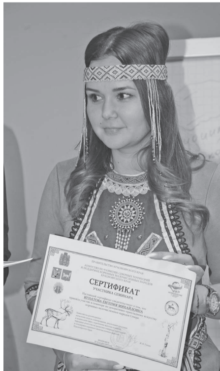
Каждый участник провел мастер-классы и рассказал о своих методиках