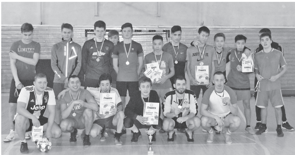
Соревнования организуются и с целью проведения свободного времени с пользой

В декабре прошли ежегодные соревнования по мини-футболу на кубок молодежного центра «Дюлэски». Соревнования не собрали большого количества команд, но ярких моментов было много.