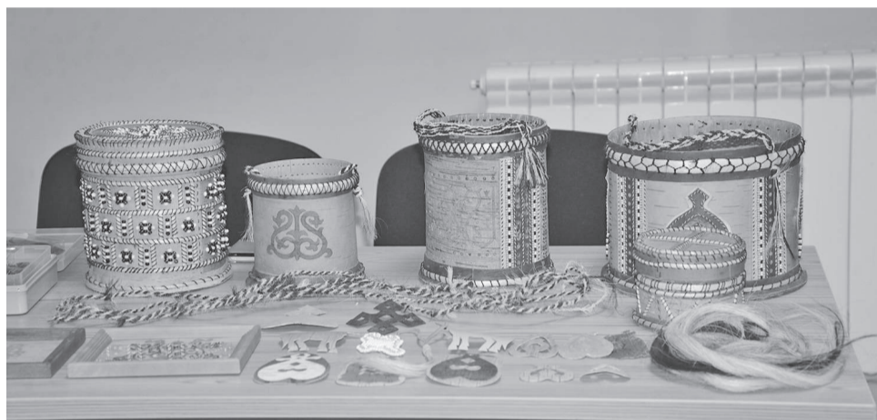
На мероприятии были представлены изделия декоративно-прикладного искусства из Эвенкии, Таймыра, Якутии