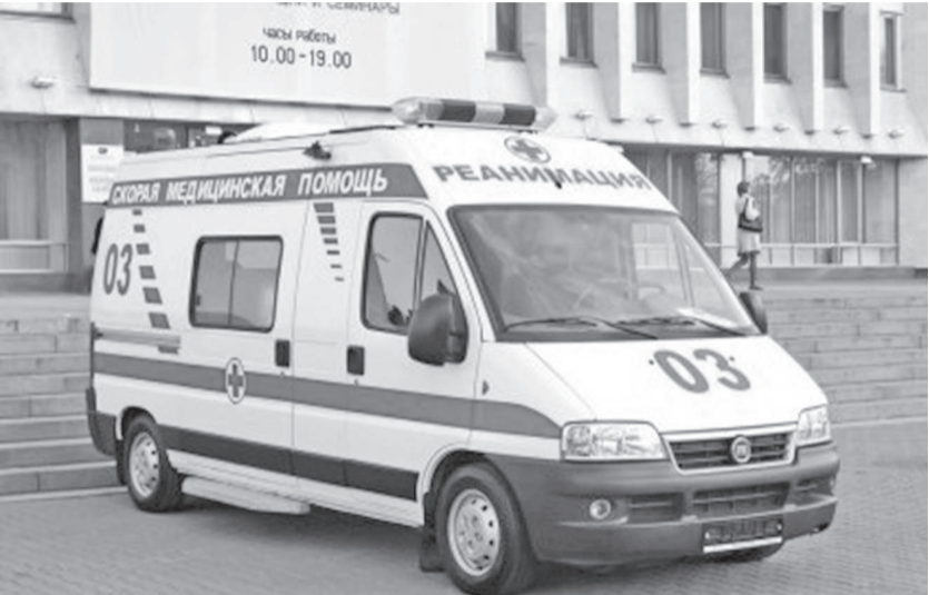
Машина «Элэкэсипты бэлэгэн»