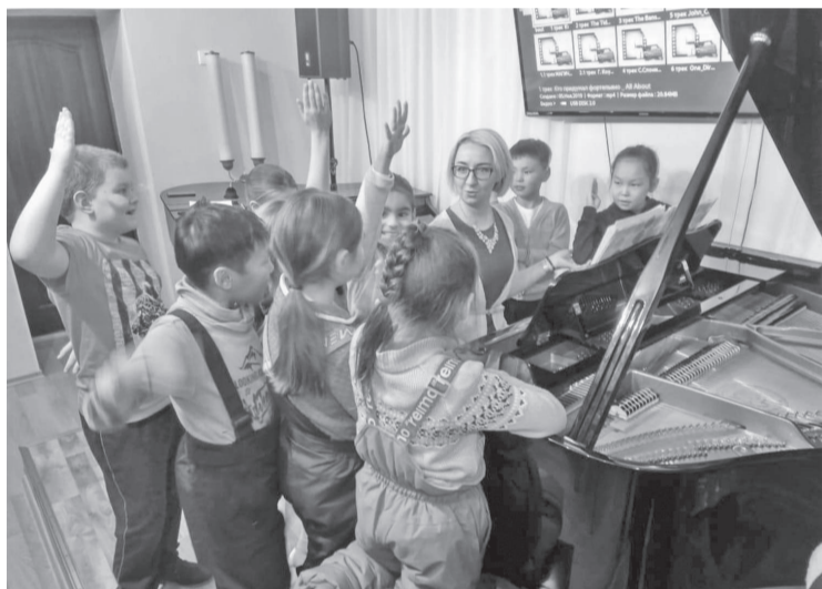
Музыкальные отделения очень популярны среди детей