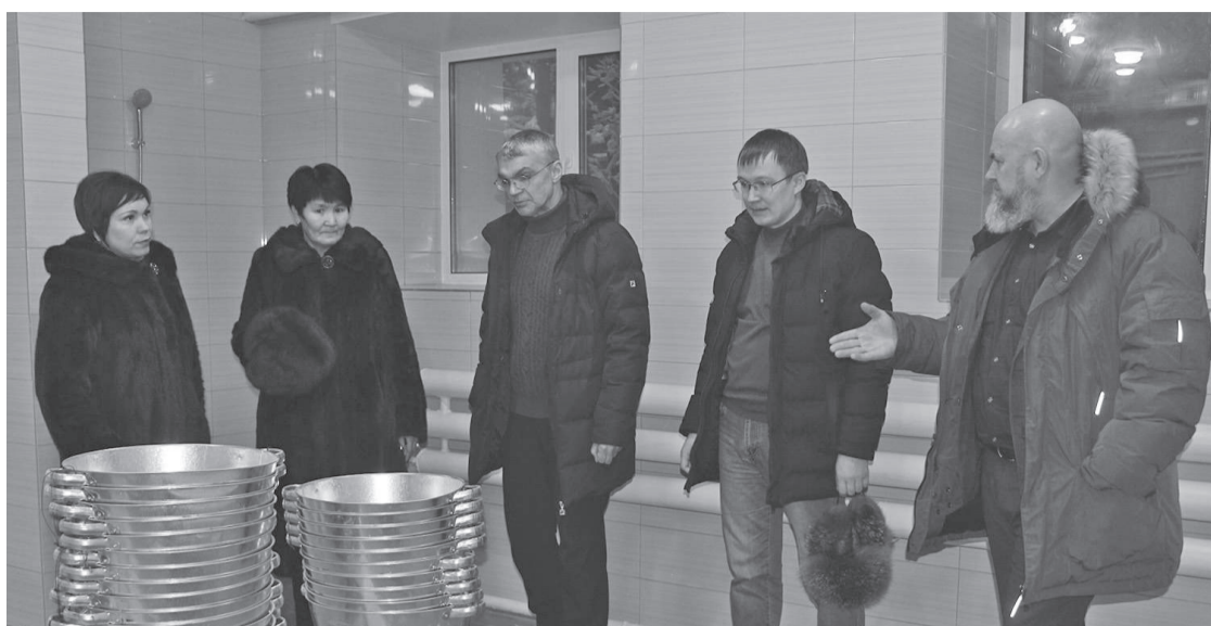
Ремонт объекта находился на контроле депутатов районного и поселкового Советов

Перед Новым годом в п. Тура завершили работы по капитальному ремонту общественной бани по ул. Кочечумская, 40а, которая вновь открылась для посетителей.