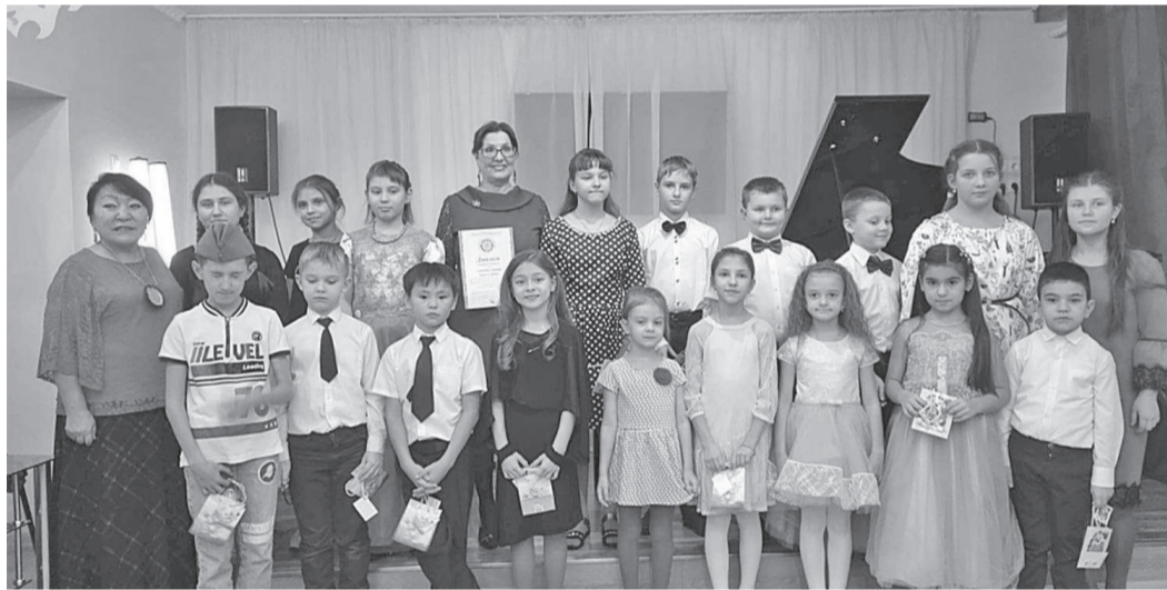
Учащиеся и педагоги Эвенкийской школы искусств участвуют во многих творческих мероприятиях за пределами района

С 1 сентября вновь закружилась веселой, красочной каруселью насыщенная творческая жизнь школы. Уже с начала учебного года дети под руководством своих преподавателей участвуют в различных фестивалях, конкурсах, концертах и выставках детского творчества. В школе работают опытные, квалифицированные мастера своего дела, развивающие эмоциональный интеллект своих учеников посредством музыки, танца и живописи.