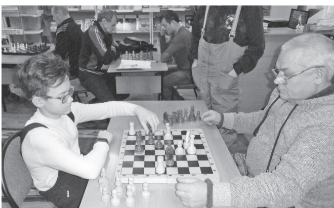
Шахматам все возрасты покорны

В Туре состоялось командное первенство по шахматам. Турнир проходил в здании Центральной библиотеки.