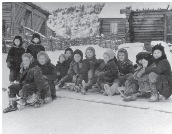
История Эвенкии богата событиями, о которых мы будем рассказывать в новой рубрике в течение года