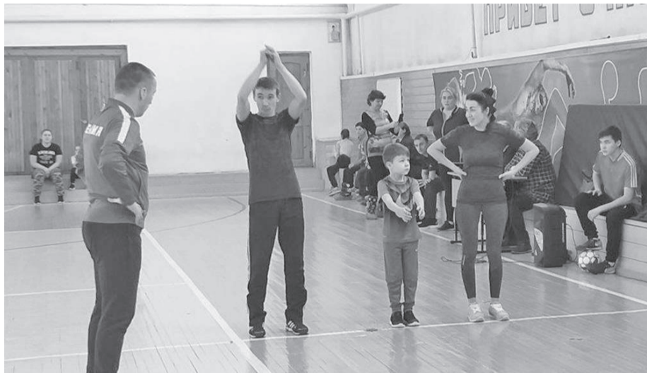
Каждая семья старалась достигнуть высокого результата

В конце минувшего года в селе Ванавара состоялись спортивные эстафеты, в том числе и среди молодых семей.