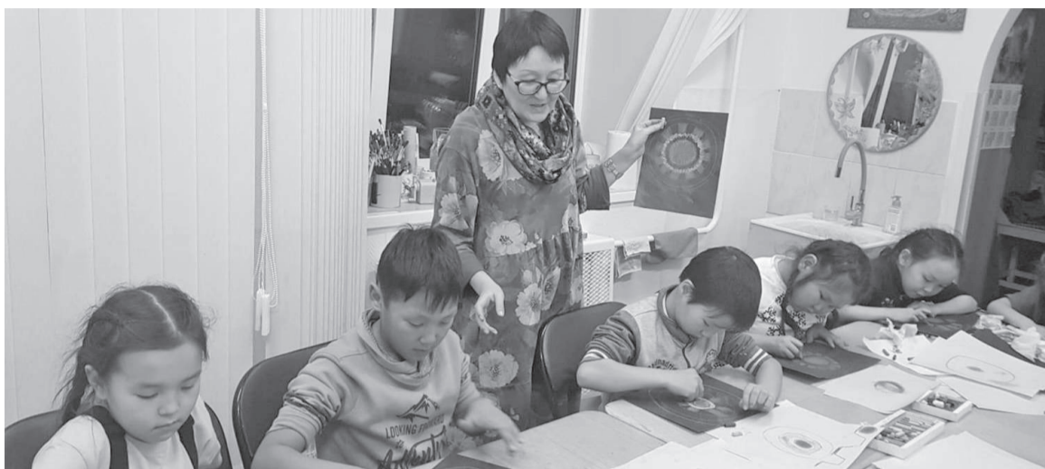
В художественном классе дети постигают мир изобразительного искусства