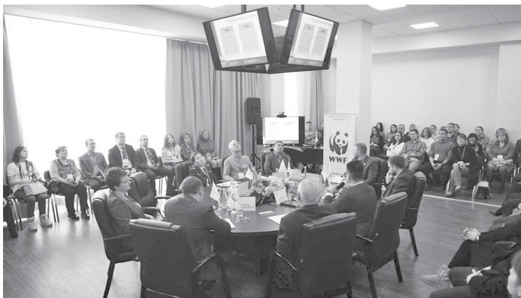
Участниками данного масштабного мероприятия стали и представители Эвенкийского района

Борьба за чистоту воздуха, технологии управления отходами и вопросы сохранения уникальных видов животных – в Красноярске на площадках Сибирского федерального университета состоялся первый Енисейский экологический форум. Участниками масштабного мероприятия стали эксперты в области экологии, депутаты Законодательного Собрания края, представители органов власти, в том числе и Эвенкийского района, а также бизнеса, науки и общественности.