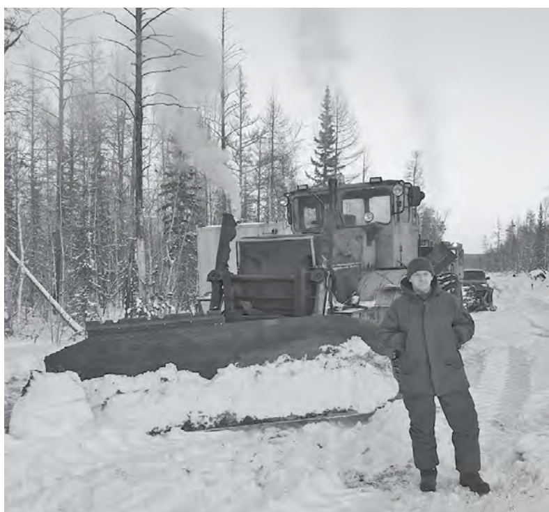
Работа по строительству зимних дорог продолжается