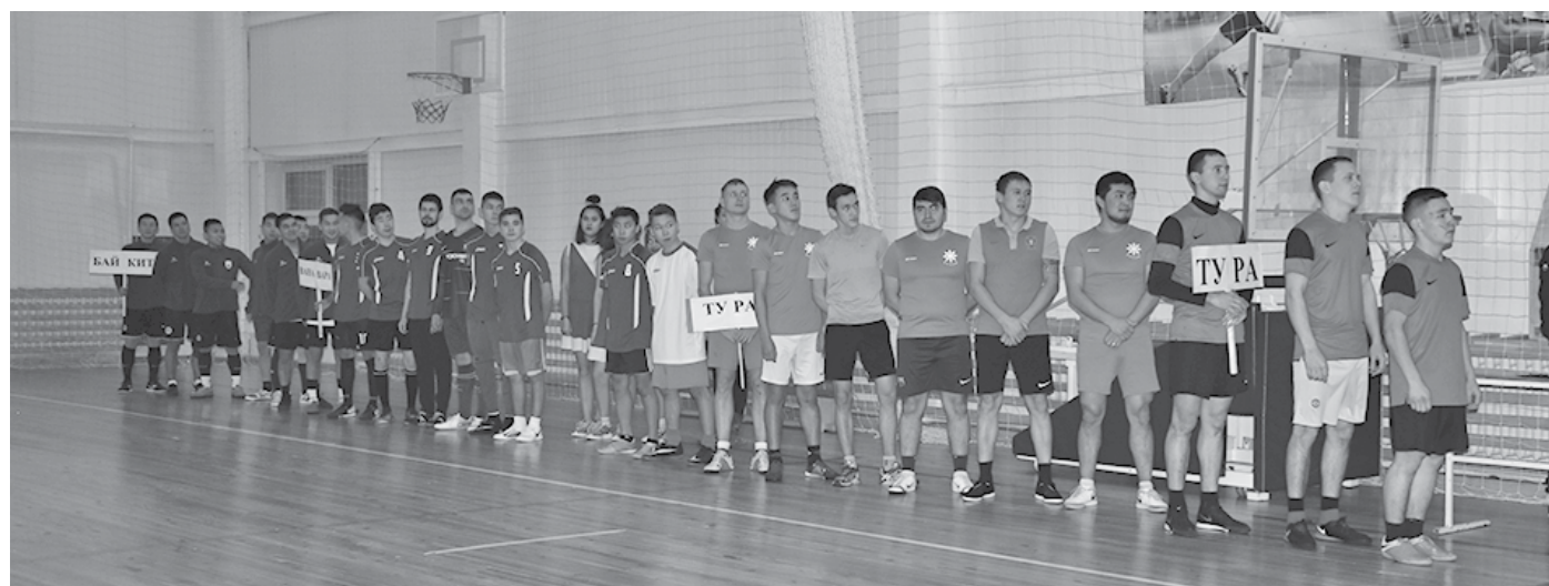
Всем призерам и чемпионам соревнований были вручены медали, грамоты и ценные призы

С 25 по 28 ноября в п. Тура прошло первенство Эвенкии по мини-футболу среди мужских команд. Традиционно соревнования собирают большое количество участников и зрителей. В этот раз как обычно в районный центр прибыли команды из с. Байкит и Ванавара.