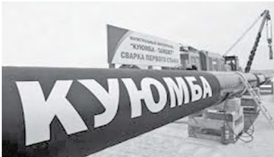
Газопровод «Куумба-Тайшет» Красноярскаду 85

Хатапты историян. Эси-тырга би сунду, гиркил, тали улгучэндэм. Су Красноярскый край историяван, бугаван салдегасун. Упкатту дуннэлду гербалтын биси. Красноярскый край гербадун бэюн лев онёвчо.