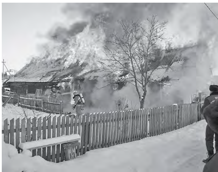
Безопасность – превыше всего!

В сильные морозы, которые сейчас стоят за окном, многие поддерживают тепло в своих домах при помощи не только печей, но и электрообогревателей. В целях предупреждения пожаров напомним жителям Эвенкийского района правила пользования электроприборами.