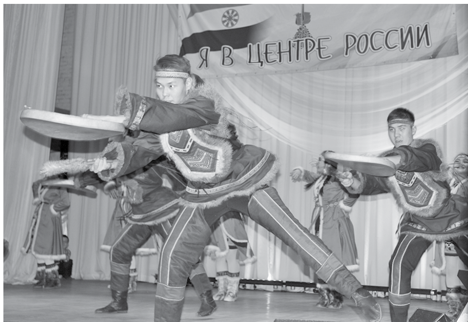
Жителей поселка порадовало выступление ансамбля эвенкийского танца «Гулун» из Бурятии. Наши гости планируют посетить Эвенкию еще раз