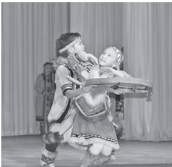
На сцене солисты ансамбля «Юность Эвенкии»

Завтра у Красноярского края юбилей. Славному региону исполняется 85 лет. К этой знаменательной дате во всех городах и районах состоялись праздничные мероприятия. Напомним, Красноярский край образован 7 декабря 1934 года. Сегодня это второй по площади регион России и один из ведущих по запасам полезных ископаемых. В крае проживает более 2,8 млн человек.