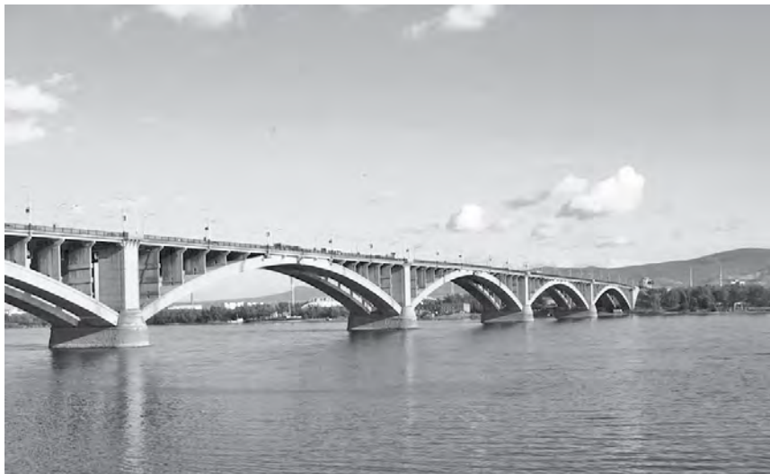
Бераду Енисейду дагалтак такэлавунмаора