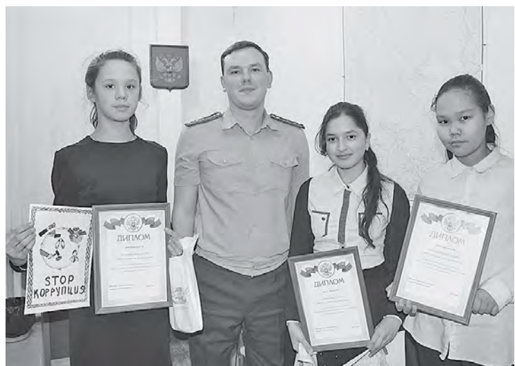
Награждение участников в Туре