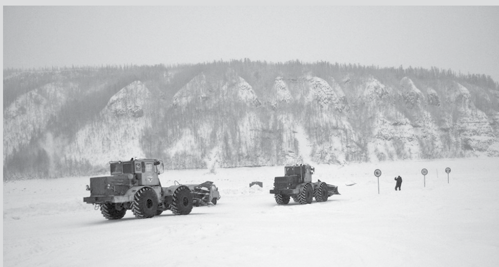
О датах ввода в эксплуатацию автозимников будет сообщено дополнительно

По состоянию на 02.12.2019 года автозимники в направлениях Северо-Енисейского, Богучанского, Кежемского районов Красноярского края и г. Усть-Илимска Иркутской области находятся в стадии устройства.