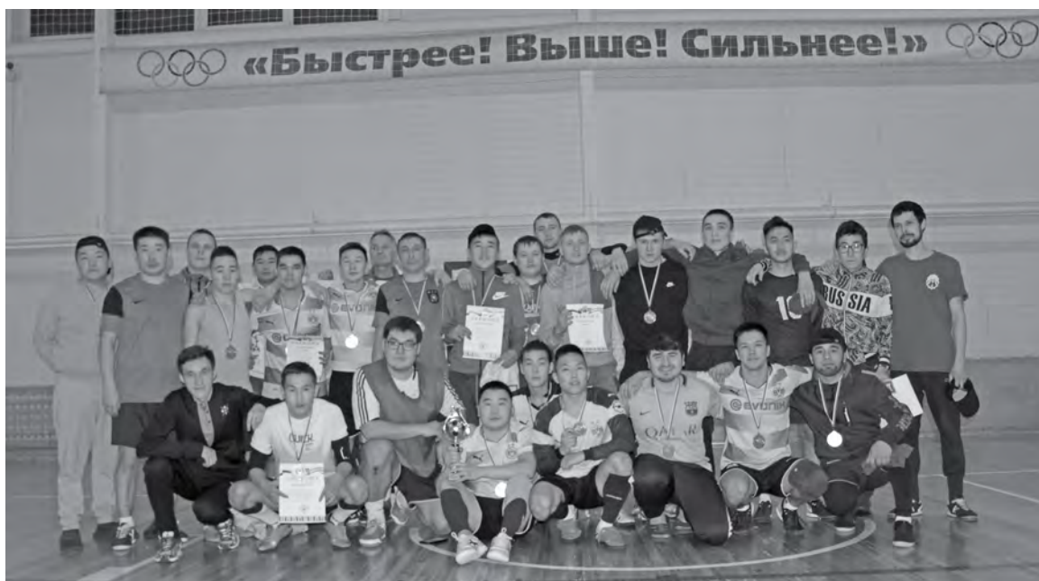
Главное - участие!

С 25 по 28 ноября в п. Тура прошло первенство Эвенкии по мини-футболу среди мужских команд. Традиционно соревнования собирают большое количество участников и зрителей. В этот раз как обычно в районный центр прибыли команды из с. Байкит и Ванавара.