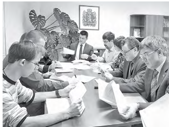
На сегодня границы рыболовных участков утверждены

На этой неделе в краевом центре состоялось заседание комиссии при министерстве экологии и рационального природопользования края по определению границ рыболовных участков на территории нашего региона.