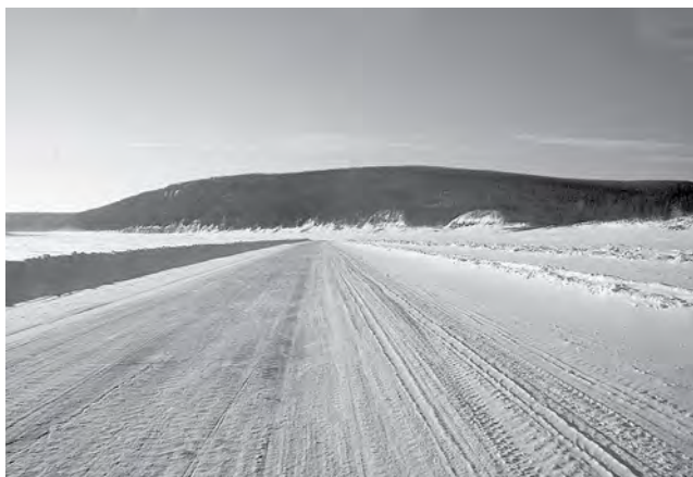
За выезды на лед вне ледовых переправ предусмотрены штрафы

Только за прошедшие сутки их открылось шесть. В целом в зимний сезон 2019-2020 годов на территории Красноярского края планируется к открытию 134 ледовые переправы.