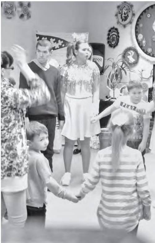
Игры и веселья