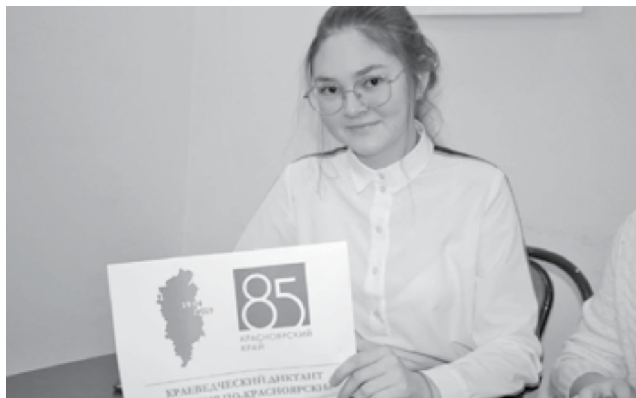
Диктант в честь юбилея нашего края