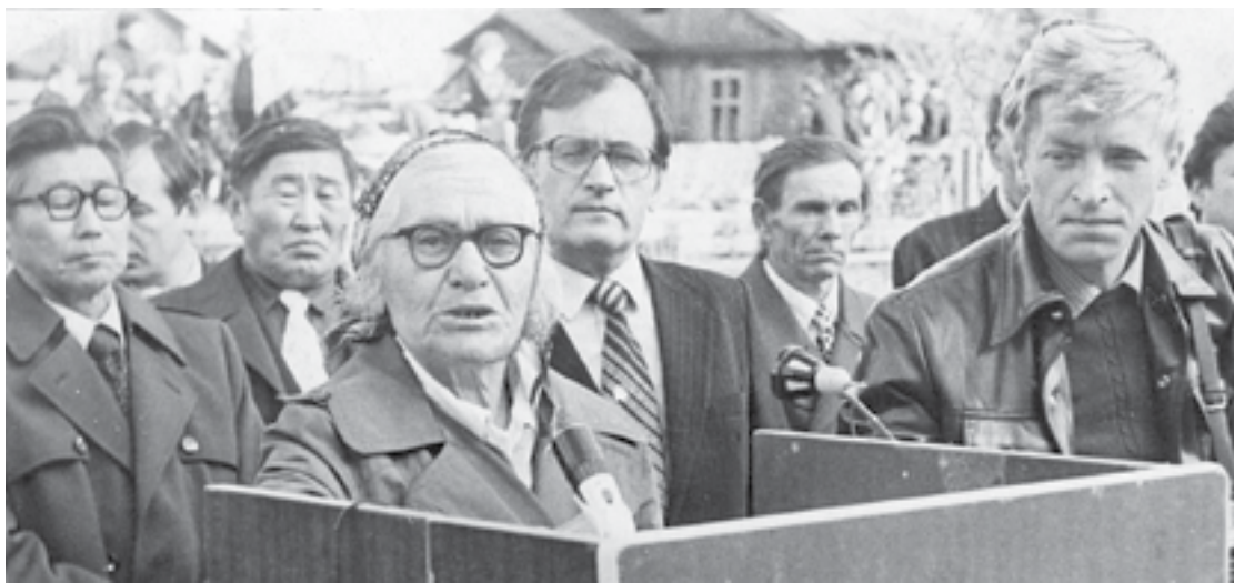
Репортаж ведет самый известный на Севере радиожурналист

брый эвенкийский дедушка, не спускал с рук и кормил внуку оленим мясом через бинтик. Папа очень много работал, накапливал опыт для дальнейшего продвижения в карьере. Вот тогда-то он и объездил всю Эвенкию, все поселки и оленеводческие бригады (причем в командировках был неделями). В итоге в 27 лет папу назначили председателем окружного радиокомитета.