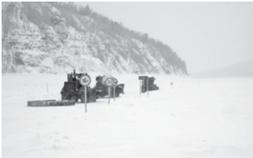
Не забывайте – безопасность превыше всего!

На водоемах Эвенкии продолжается интенсивный процесс ледообразования, чему способствует установившаяся морозная погода. Но при этом, на водоемах до сих пор остаются опасные места, где лед слишком тонкий, чтобы выдержать вес автотранспорта.