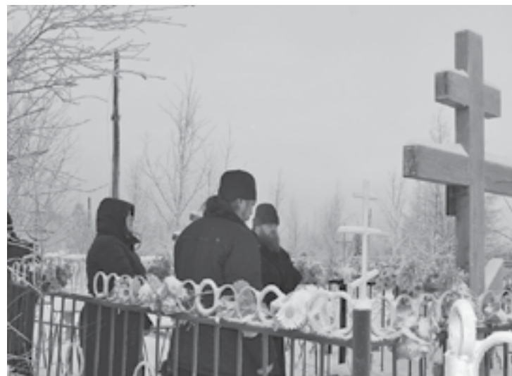
Владыка почтил память трагически погибшего отца Григория