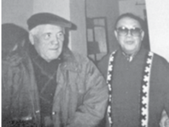
Алитет Немтушкин бакалдынду амурскаил Эвенкилду Нюгдеду