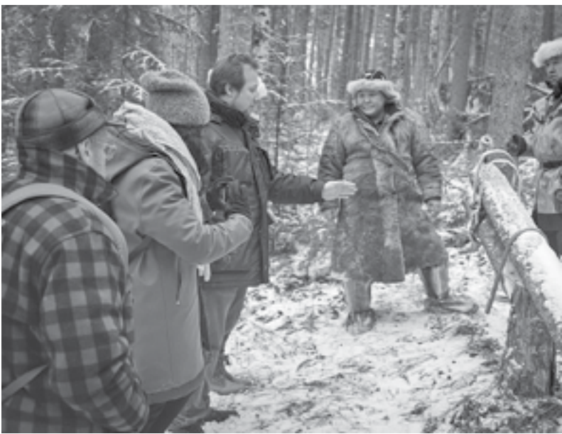
Объем заготавливаемых шкурок соболя в Эвенкии осуществляется только легально

Основной целью прошедшего круглого стола стало знакомство представителей вышеуказанных компаний с используемым способом добычи соболя охотниками Красноярского края. Группы компаний «LVMH» и «IFF» заявили о своей заинтересованности в мехе сибирского соболя, но при условии, что зверек был добыт гуманным способом.