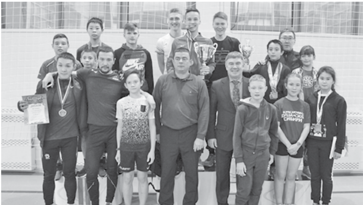
В общекомандном зачете в кубке Красноярского края по северному многоборью Эвенкия заняла 1-е место

20-23 ноября 2019 года в Красноярске состоялись кубок и первенство Красноярского края по северному многоборью. В борьбу за медали вступили около 70 спортсменов из четырех территорий Красноярского края - Эвенкии, Таймыра, Туруханского района и г. Красноярска.