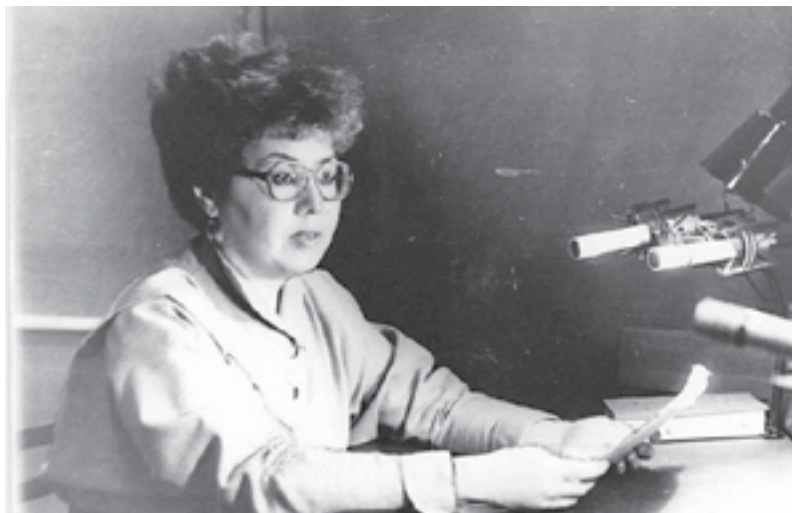
Звучит голос Эвенкии