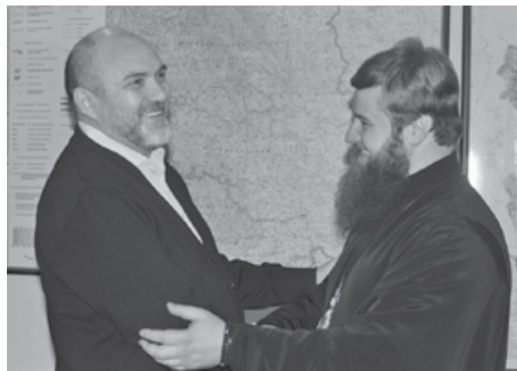
Поездки епископа по северным территориям обязательно будут продолжены

- Уважаемый владыка, каковы Ваши первые впечатления от эвенкийцев, от наших храмов?