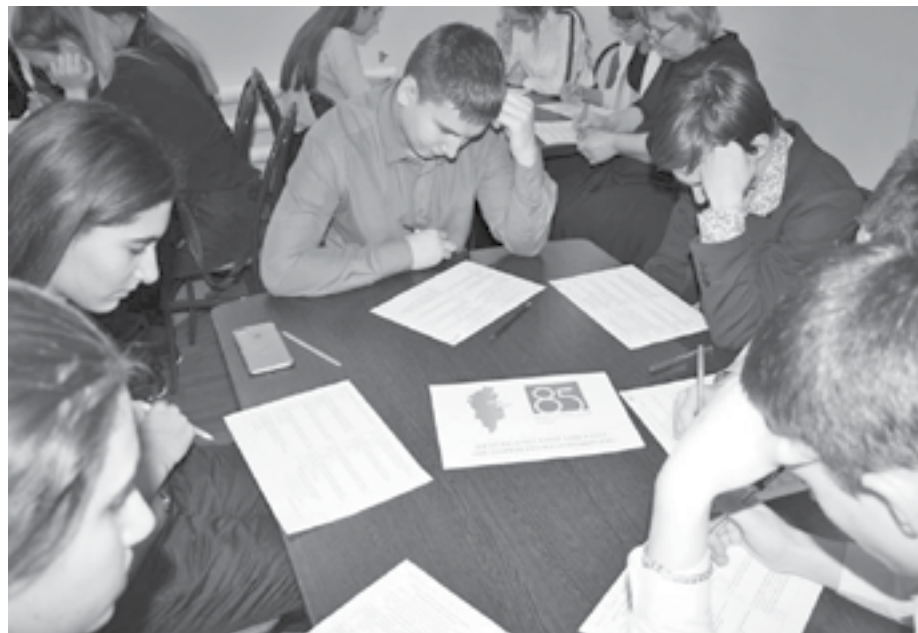
Знание истории – это сила!