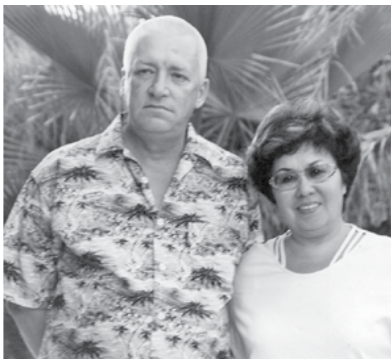
Вместе в работе и в жизни