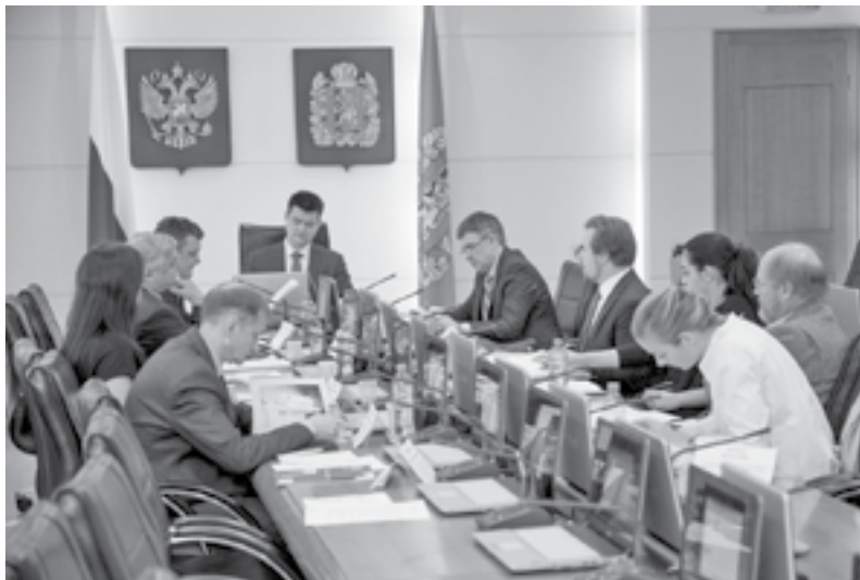
Круглый стол продолжался в течение двух дней

В Красноярске под эгидой министерства экологии и рационального природопользования края состоялся круглый стол по вопросам соблюдения законодательства в обороте дикого соболя. Почетными участниками мероприятия стали представители транснациональных компаний «LVMH» и «IFF», занимающихся производством предметов роскоши, включая меховые изделия.