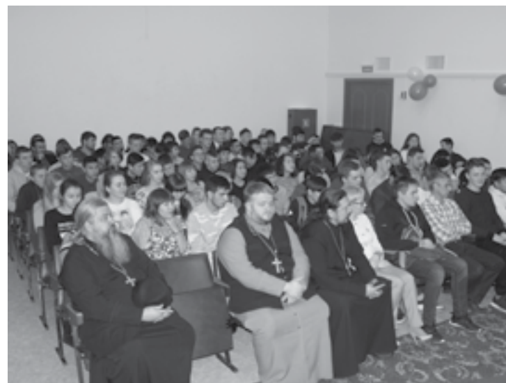
Одна из главных задач Преосвященнейшего Игнатия - работа с молодежью