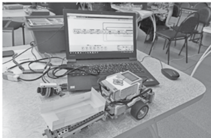
Активная подготовка по внедрению новых программ продолжается

Управление образования администрации ЭМР