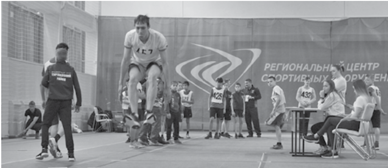
Все спортсмены были награждены памятными призами