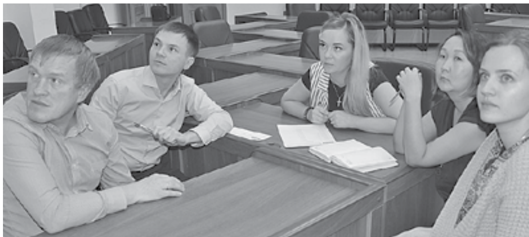
Команда администрации поселка Тура

Служба в армии - важный этап в жизни каждого молодого человека, отличная возможность проверить себя, понять, на что способен не только физически, но и морально. Удачи вам, наши эвенкийские солдаты!