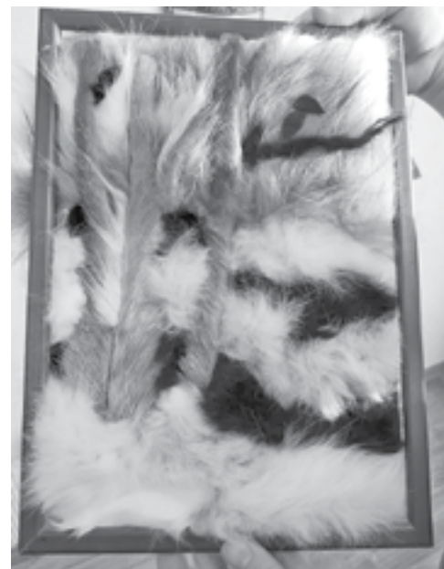
Первые работы сделаны на достойном уровне