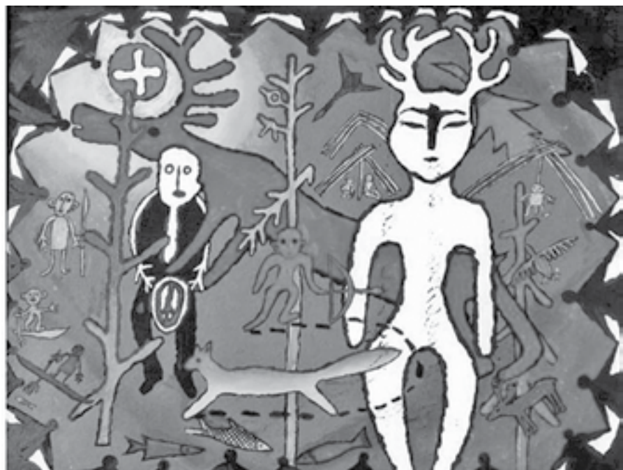
«Охотник Киревуль», В. Донченко, 2003 г.