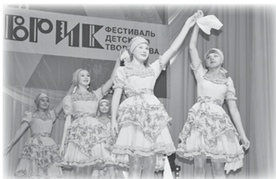
Хореографический ансамбль «Забава», с. Ванавара