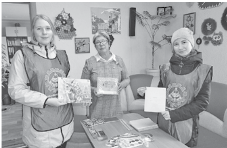
Каждый может поддержать семьи, нуждающиеся в помощи

Подведены итоги доброй акции «Помоги пойти учиться», стартовавшей в канун начала нового учебного года.