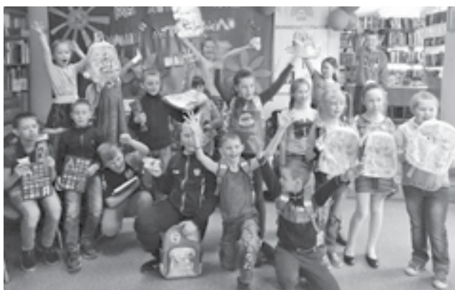
Районды книганги марафон п. Ванаварэду