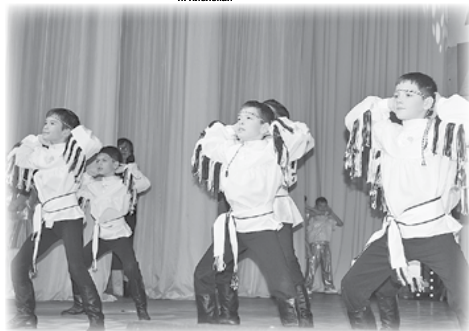
Хореографический ансамбль «Юность Эвенкии», ДШИ