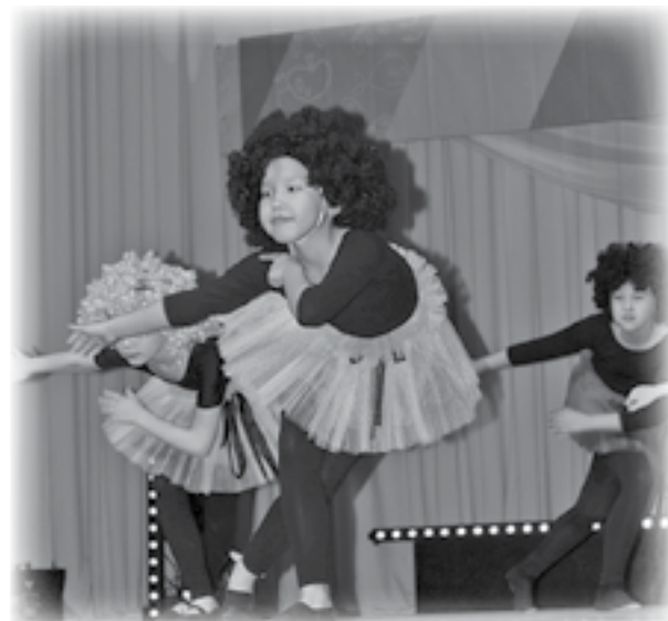
Детский танцевальный ансамбль «Бегакан», с. Байкит