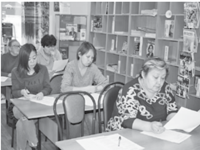
В акции приняли участие более 70 туринцев

По информации Центральной библиотеки п. Тура, в написании этнографического диктанта приняли участие более 70 жителей райцентра. Участниками акции стали старшеклассники и учителя средних общеобразовательных школ, сотрудники администрации района, коллективы Эвенкийского краеведческого музея, Эвенкийского лесничества, ГП КК «Губернские аптеки» и МСК «Медика-Восток», представители Всероссийского военно-патриотического общественного движения «Юнармия», пенсионеры.