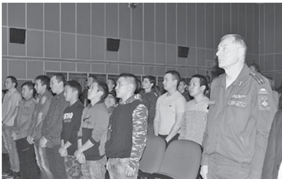
Очередные призывники уходят в армию

На дворе уже ноябрь, а это значит, что многим молодым парням время паковать чемоданы. Ровно на год они расстанутся с домом, чтобы освоить солдатскую науку.