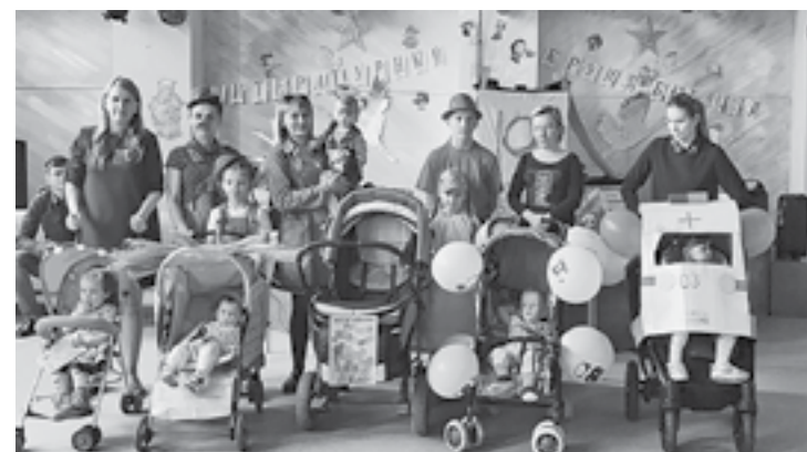
Районды книганги марафон п. Байкитту

Упкаттун Эвенкияду эси дян туннга тысачал нямачадыгын надан илэл ин- дерэ. Нунгардуктын дяпкундьяр процен- тал кунгакар аяврэ книгалва тангдыдавэр. Эр аннганиду конкурс «Аятку тангдари городты округ/ муниципальной район» краевойду центраду нгэнэчэн.