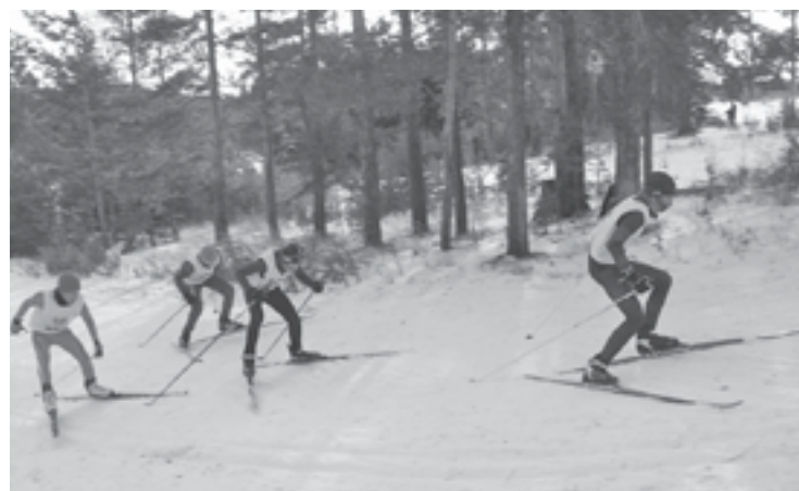
Ванавара и лыжный спорт - неразделимы!

В селе Ванавара лыжи - самый любимый вид спорта. Наверное, когда в результате климатических изменений здесь наступит вечное лето, ванаварцы все равно будут заниматься лыжами, пусть и роликовыми.