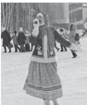
Народные песни для настроения

Звонкие голоса артистов районного культурно-досугового центра порадовали всех задорными народными песнями. На центральную площадь рядом со зданием администрации района вышло около 100 человек. Участники традиционной в День народного единства акции весело и с большим удовольствием провели время - водили хоровод, пели песни, общались друг с другом. Заряд бодрости и дух единства были обеспечены на весь день.