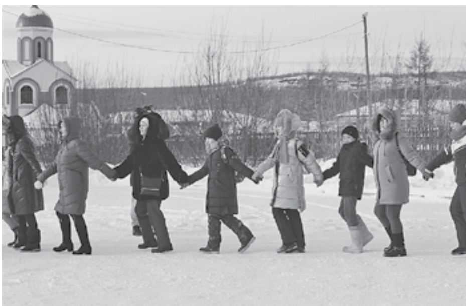
Вместе мы сильнее!

Утро 4 ноября в райцентре началось с массового празднества. Каждый желающий мог принять в нем участие - для этого всего лишь нужно было встать в большой дружный хоровод.