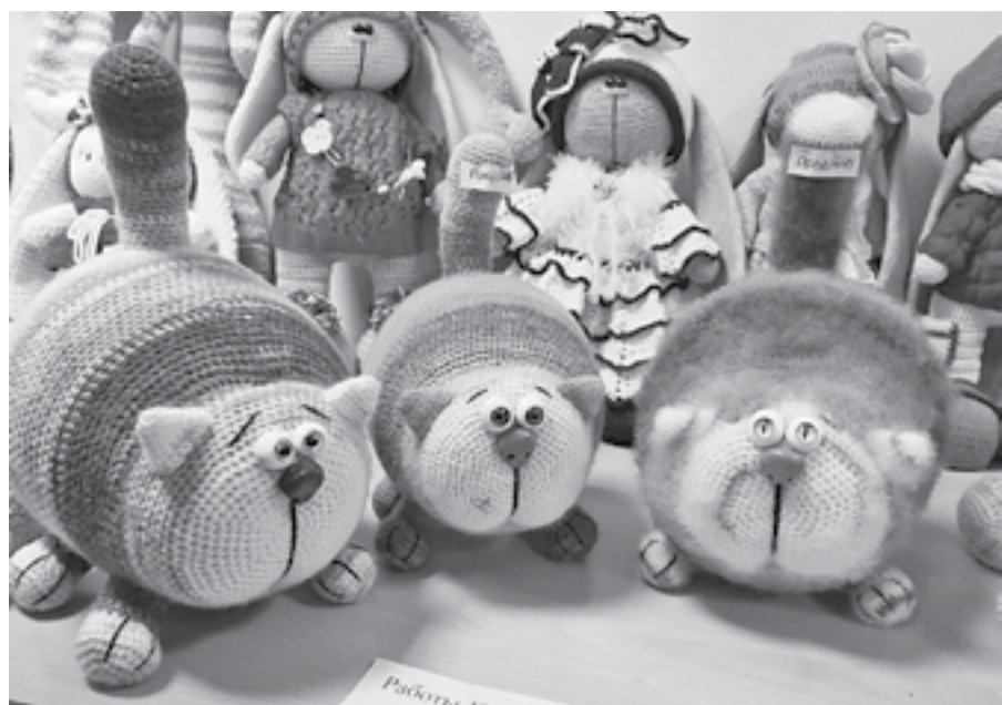
Забавные коты быстро обрели хозяев