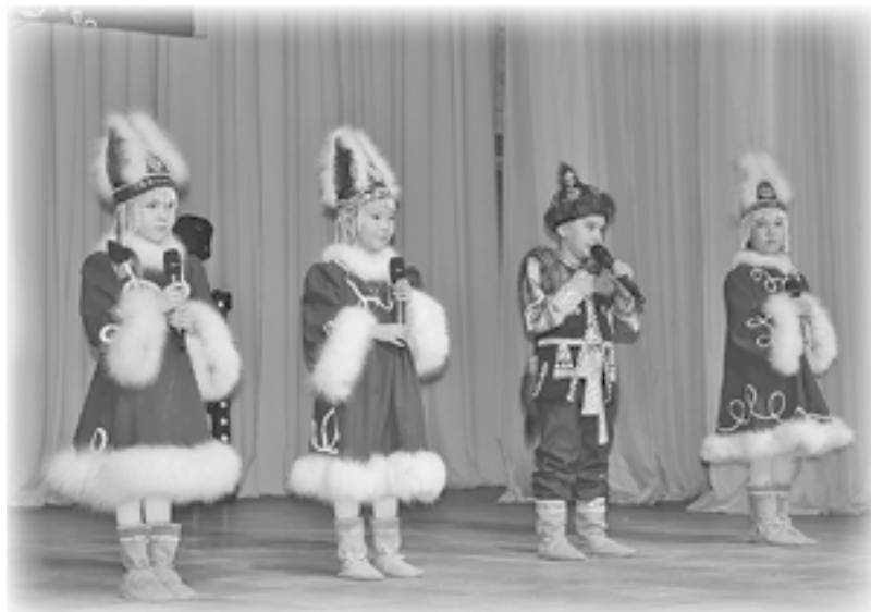
Детский образцовый ансамбль «Хотугу Сулус», п. Ессей