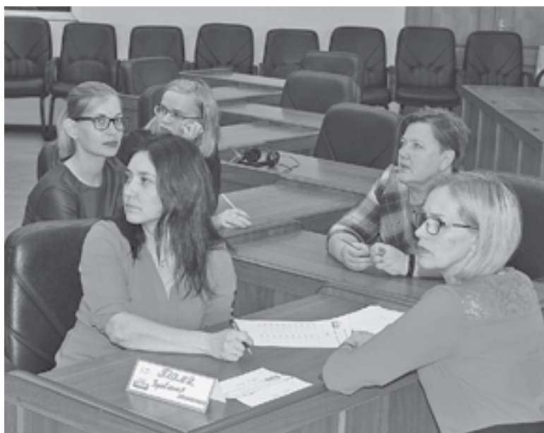
Команда управления экономики администрации ЭМР «Пламя»