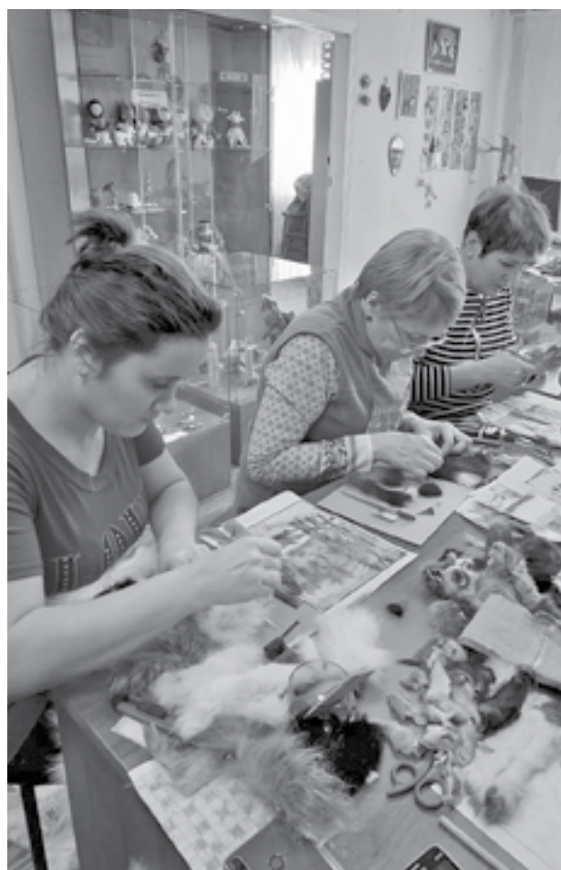
Мастерицы с успехом освоили методику создания картин