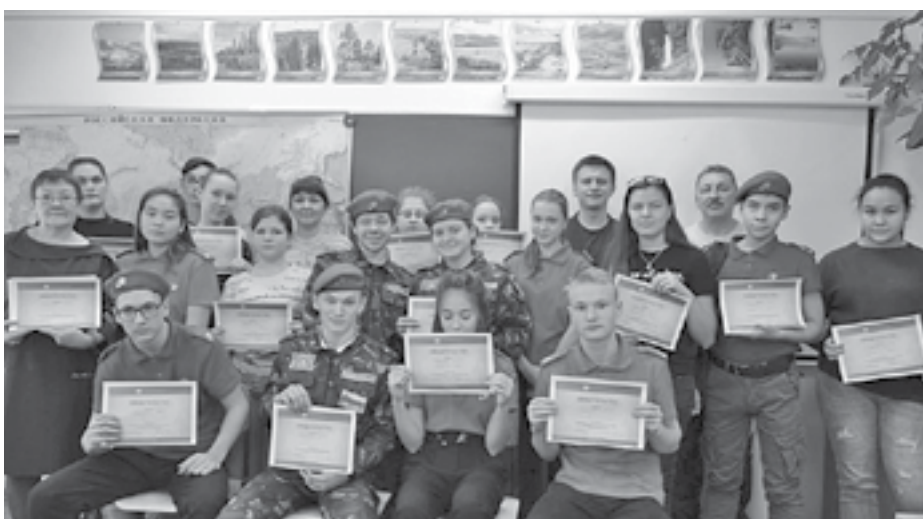
Знать историю России должен каждый гражданин страны

Второй год Байkitская средняя школа гостеприимно открывает свои двери для всех желающих принять участие в ежегодной международной просветительской акции «Географический диктант», проводимой по инициативе Русского географического общества и Президента России, Председателя Попечительского Совета Общества В.В. Путина.