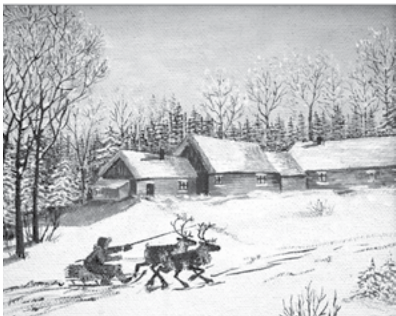
«Возвращение домой», В. Старцев