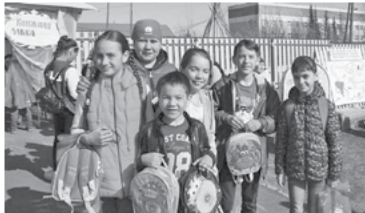
Районды книганги марафон п. Туруду