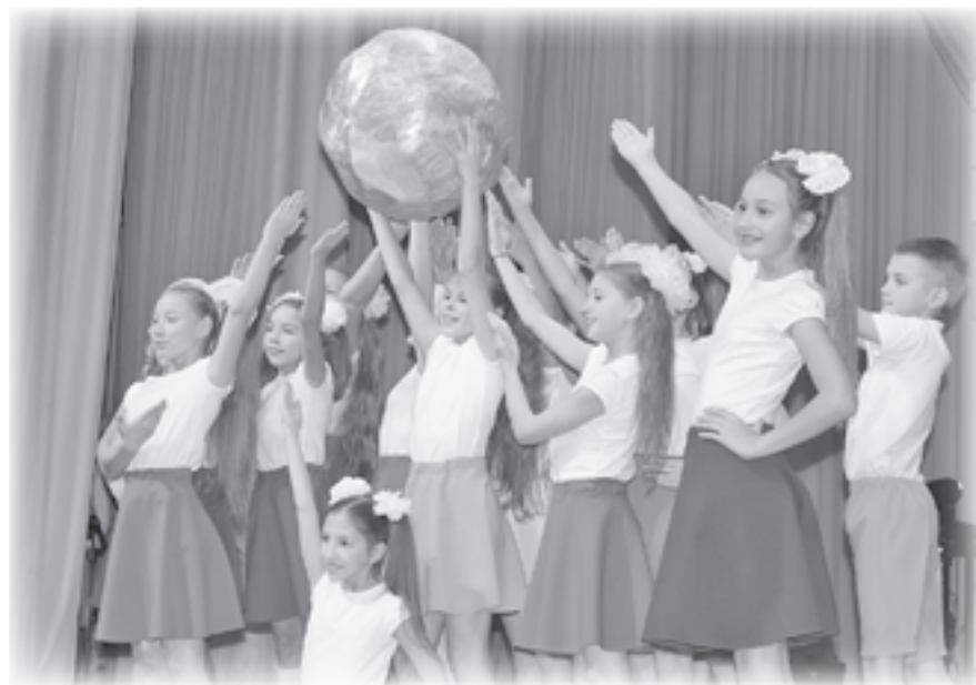
Младшая танцевальная группа «Переменка», ТСС