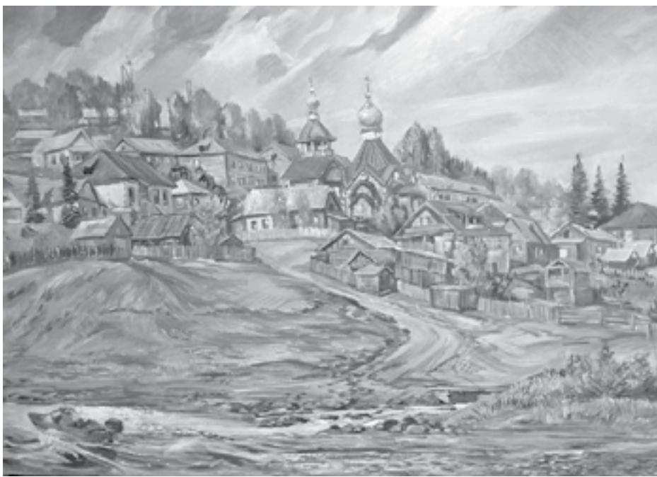
«Взгорье на устье Байkitика», А. Попов, 2011 г.