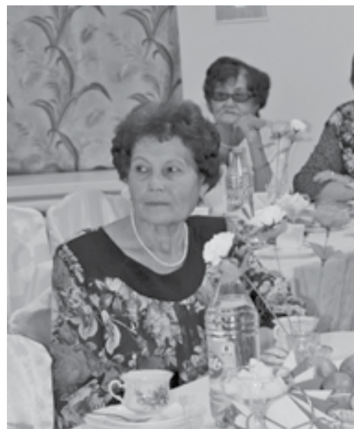
Мы должны помнить и уважать старшее поколение

Уважаемые эвенкийцы - представители старшего поколения!