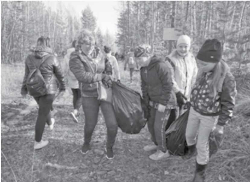
Акция прошла под руководством учителей

Ежегодно во всем мире проходит неделя международной акции «Очистим планету от мусора». Уже не первый раз к ней присоединяются государственный заповедник «Тунгусский» и Ванаварская средняя школа.