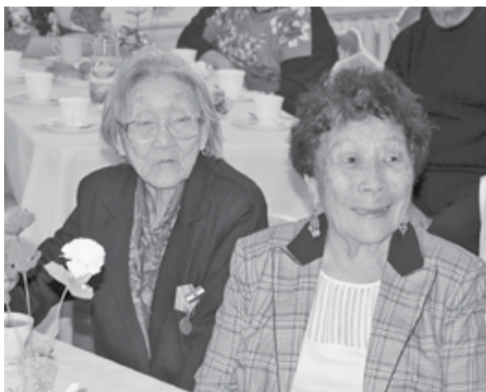
Встреча прошла в дружеской обстановке