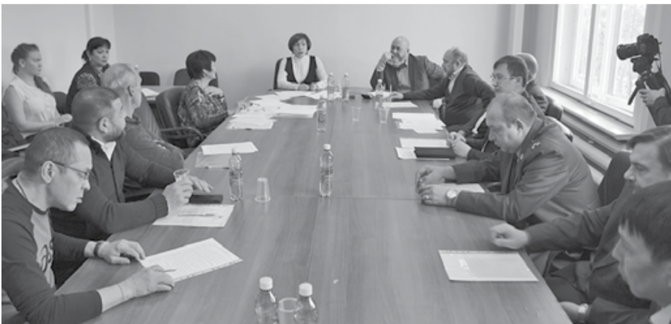
На первой сессии сформированы рабочие органы поселкового Совета депутатов

2 октября в районном центре состоялась первая организационная сессия Туринского поселкового Совета депутатов шестого созыва. Новый состав представительного органа был избран 8 сентября 2019 года.