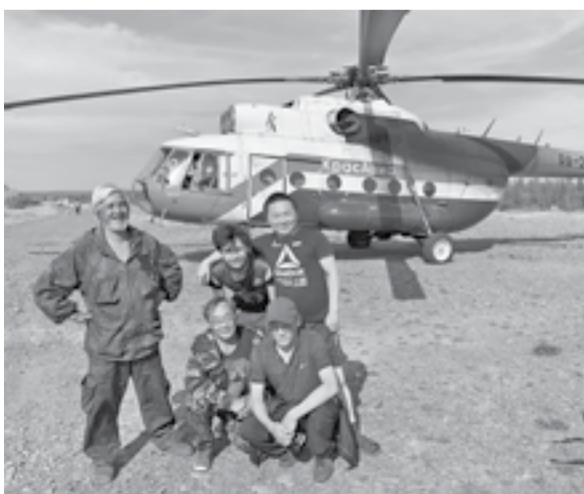
Проводы в п. Чиринда