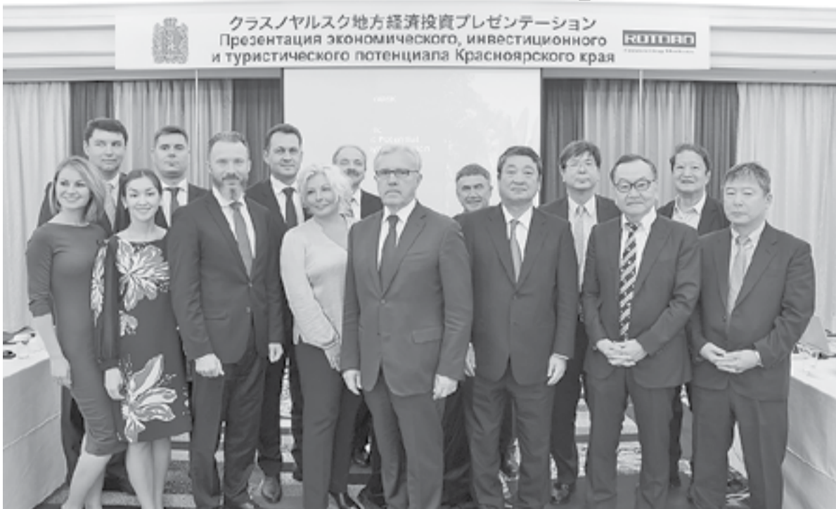
Делегация Красноярского края с партнерами из Японии

Визит состоялся в ответ на приглашение Японской ассоциации по торговле с Россией и новыми независимыми государствами (РОТОО) в ходе нынешнего Петербургского международного экономического форума.