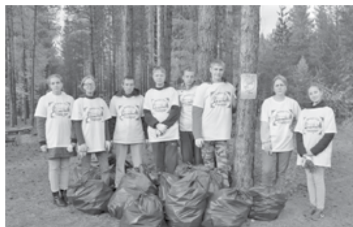
В ходе реализации проекта ребята убирались в лесных массивах