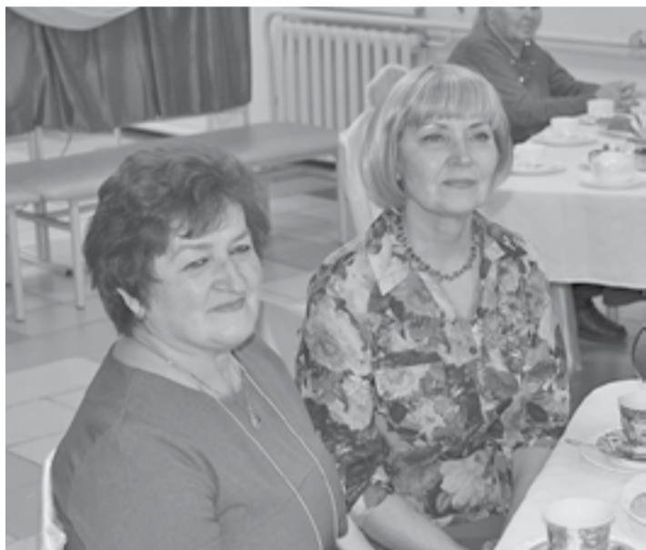
Для старшего поколения артисты дома культуры подготовили праздничный концерт

День пожилого человека принято отмечать повсеместно в первый день второго осеннего месяца - 1 октября, это торжество имеет международный статус.