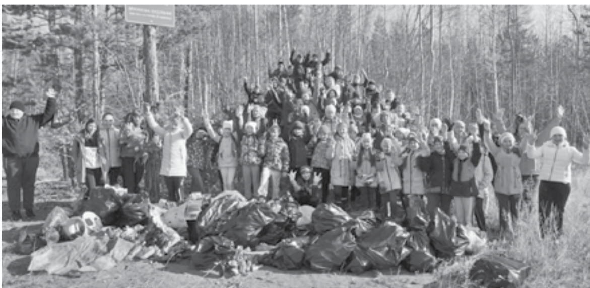
За один час дети собрали больше 30 мешков мусора

Р.В. ЖУРАВЛЁВ, начальник ОГИБДД ОМВД России по Эвенкийскому району майор полиции