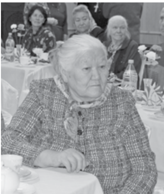
Каждому из присутствующих было уделено внимание