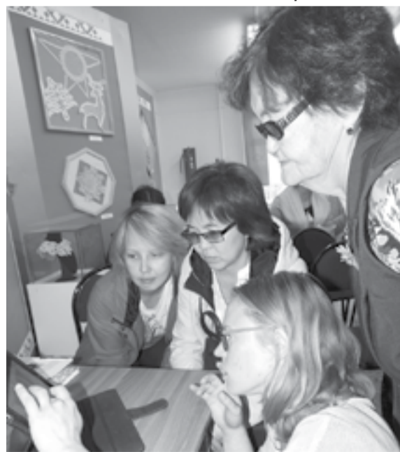
На встрече в краеведческом музее аспирантам задавали много вопросов