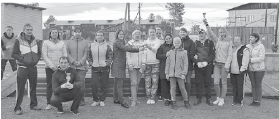
Главное не победа, а чистота родного села!