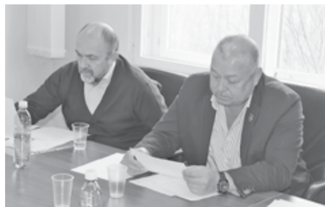
Руководители района пожелали депутатам плодотворной работы