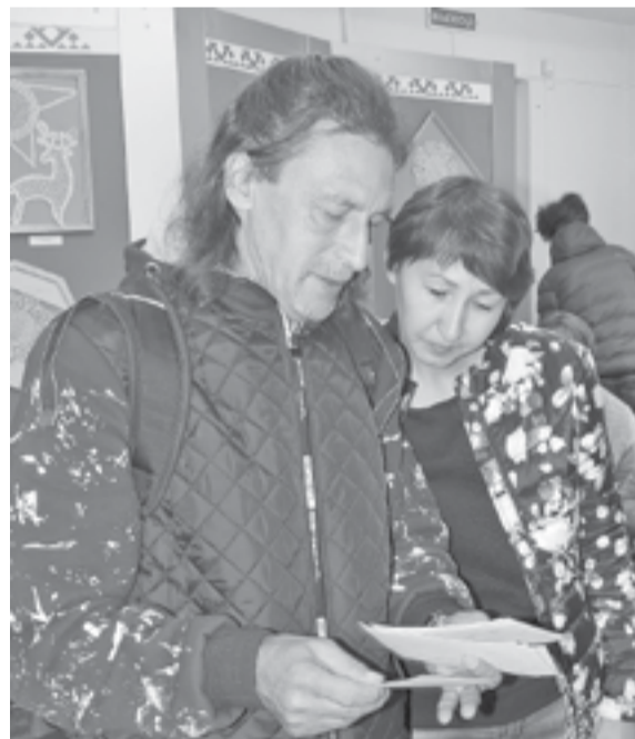
Презентация Оксфордского музея в Туре заинтересовала многих