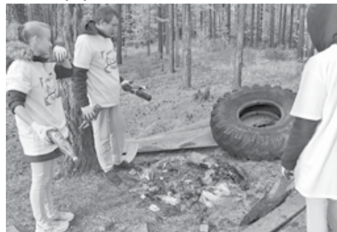
Возгорание оставленного после пикника мусора может стать причиной лесного пожара

В с. Ванавара завершилась реализация социально-экологического проекта «Огнеборцы», ставшего одним из победителей конкурса «Ванавара-2020» в мае текущего года. Напомним, основная цель проекта - создание одноименного отряда, в задачи которого входило информирование граждан о необходимости бережного отношения к нашей природе.