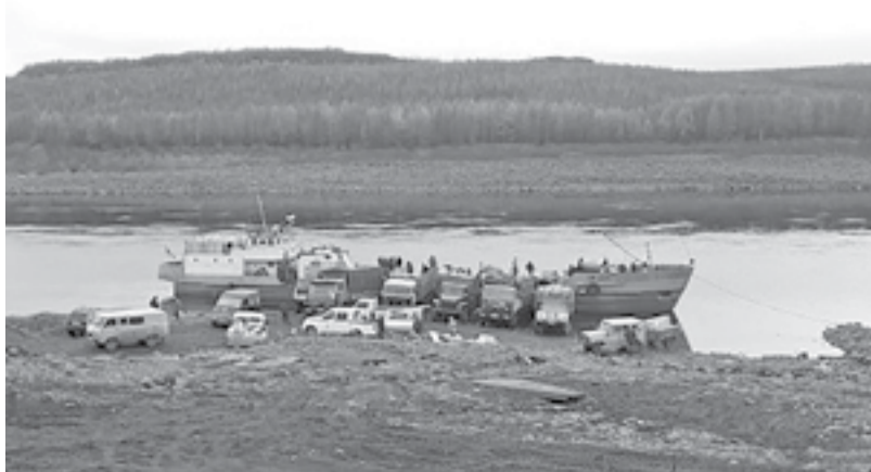
На подходе к Туре еще три судна

Поселки Илимпии продолжают прием осеннего речного каравана. Только за последнюю неделю в районном центре были разгружены три баржи, доставившие в Туру более 250 тонн продовольствия и товарно-материальных ценностей.