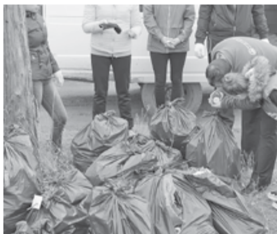
Общими усилиями собрано 83 мешка с мусором!

Каждая команда постаралась на славу. В результате общими усилиями было собрано 83 мешка объемом 120 литров и суммарной массой