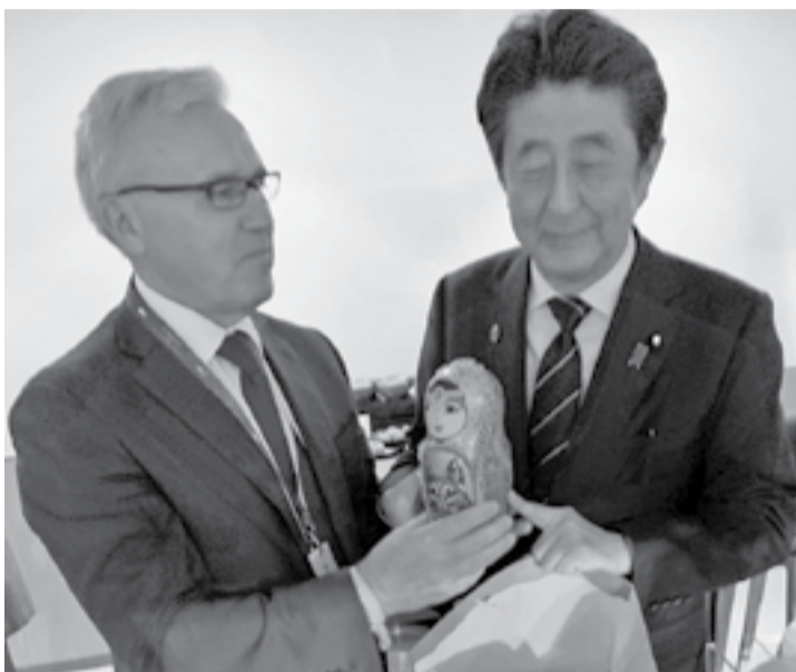
Эвенкийская матрешка теперь есть в коллекции премьер-министра Японии