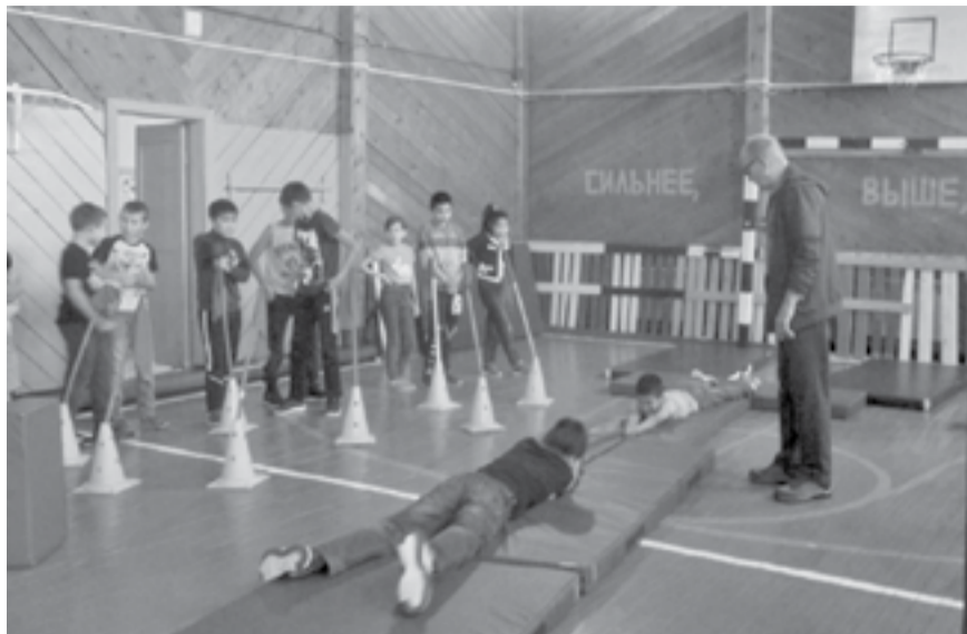
Ученики закрепили полученные знания на практике

В Полигусовской основной школе прошел урок безопасности, на котором ученики узнали о том, как действовать в различных ситуациях, угрожающих жизни и здоровью человека.