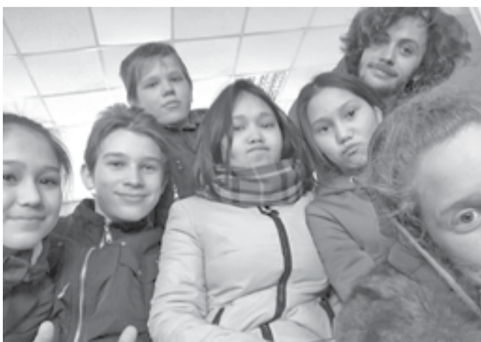
Дети Байкита с гостями из Оксфорда