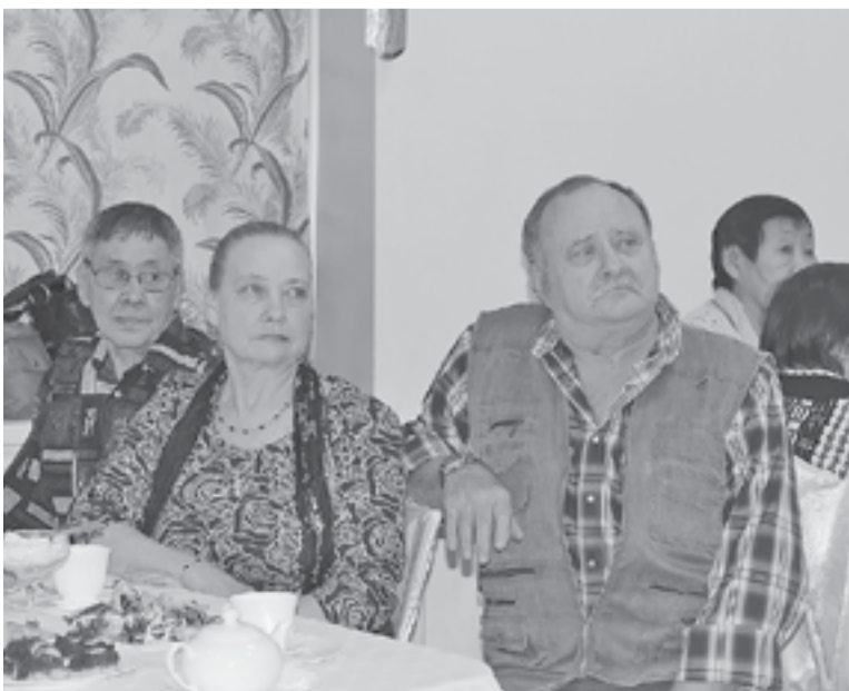
На праздник пришли семейными парами