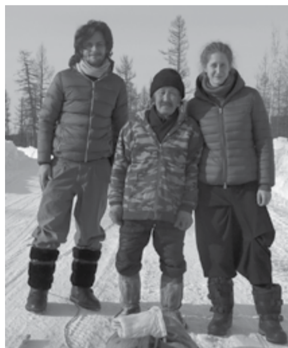
Молодые ученые с оленеводом п. Суринда