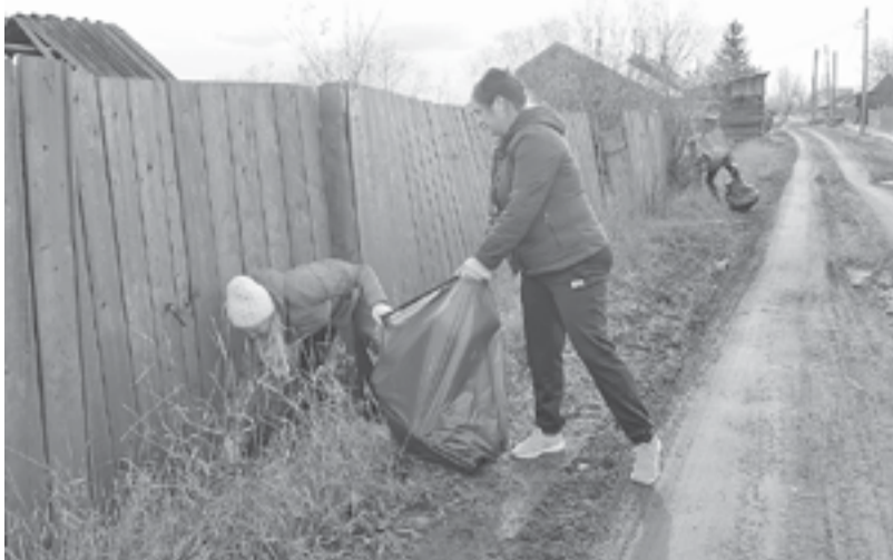
Ванаварцы состязались, кто больше соберет мусора за два часа

Необычные соревнования прошли в Ванаваре. Для участия в них от желающих не требовалось какой-либо специальной подготовки, в том числе спортивной, лишь - хорошее настроение и желание сделать мир немного чище.