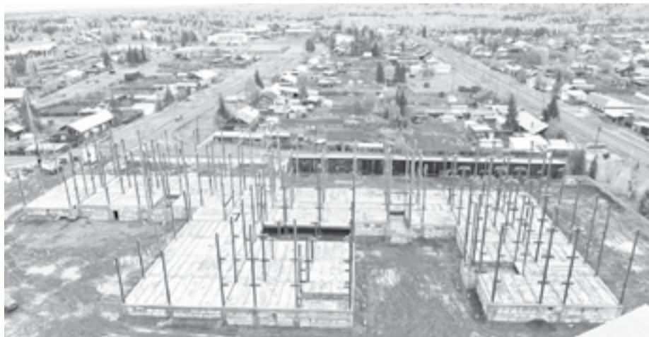
В следующем году на возведение здания предусмотрено 202 млн рублей