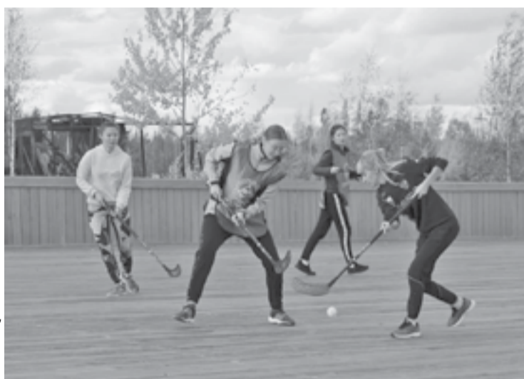
Популярность нового вида спорта – флорбола – в Ванаваре растет

В Ванаваре прошли открытые соревнования по флорболу (хоккей с мячом на твердом полу) среди мужчин и женщин. В соревнованиях участвовало не так много команд, как хотелось бы организаторам, но, тем не менее, игры получились зрелищными, а их итоги – непредсказуемыми.