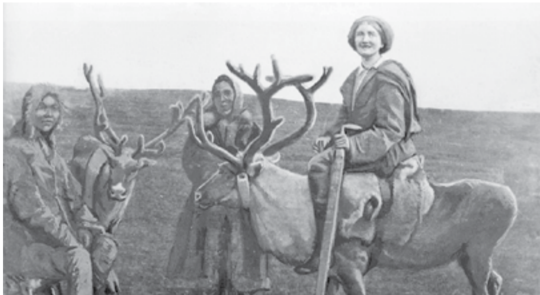
Английская ученая в Эвенкии во время экспедиции 1914 года