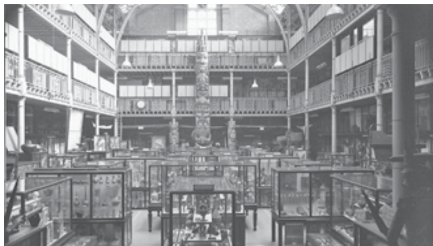
Оксфордский музей Питта Риверса хранит и эвенкийские экспонаты