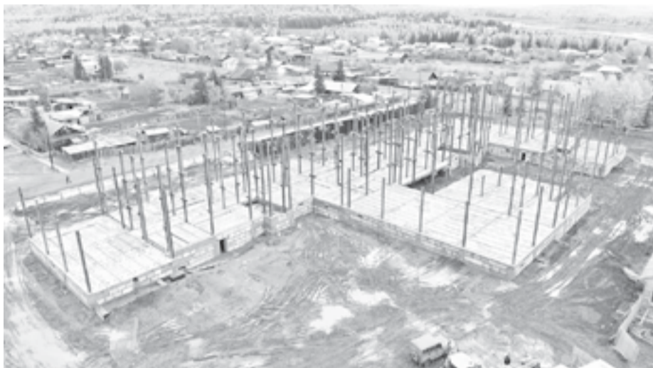
Завершается первый этап строительства школы, готовность объекта - 30%