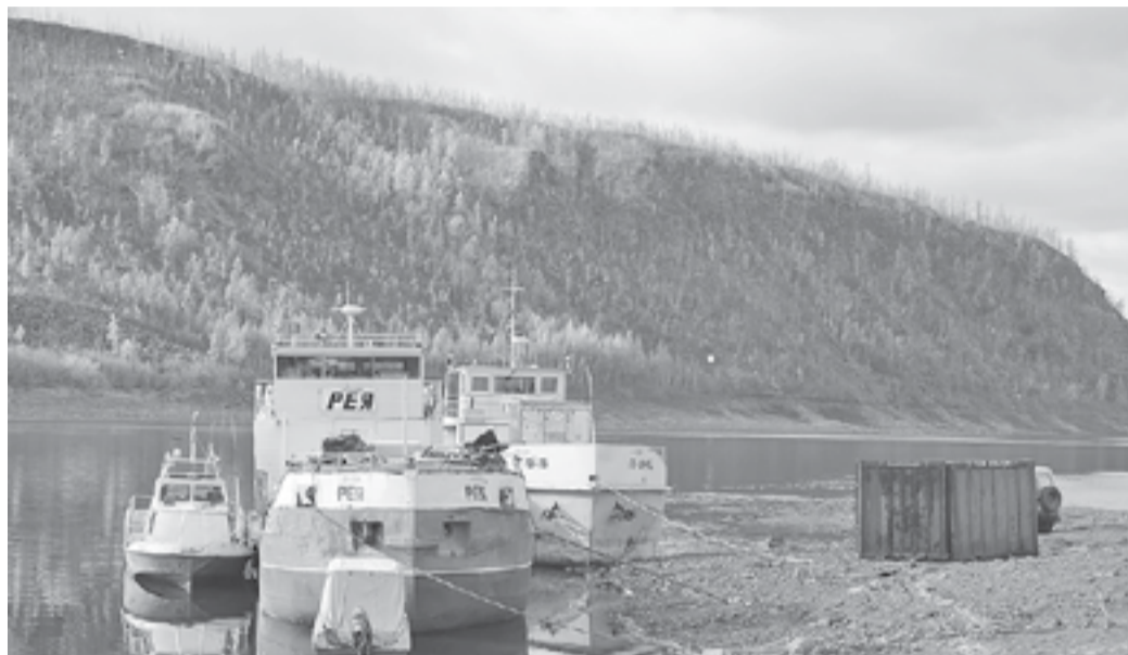
Уровень воды в Нижней Тунгуске в районе п. Тура поднялся до судоходных значений

После месяца ожидания Тура принимает, наконец, осенний караван. На этой неделе в райцентр Эвенкии по воде пришли две самоходки, на которых кроме прочего груза доставлено 60 тонн продовольствия, в том числе овощей. Продукты поступили на прилавки магазинов.