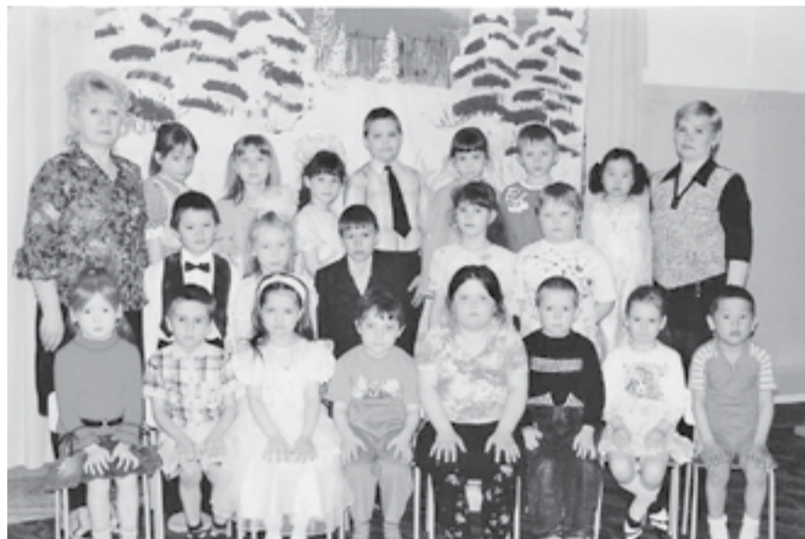
Детский сад «Малыш», с. Байкит, 2006г.