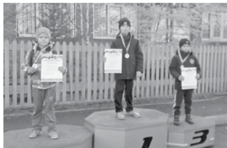
В забегах участвуют даже самые маленькие

Администрация МБОУ ДО «ДЮСШ ЦФКиС» ЭМР, управление молодежной политики администрации ЭМР