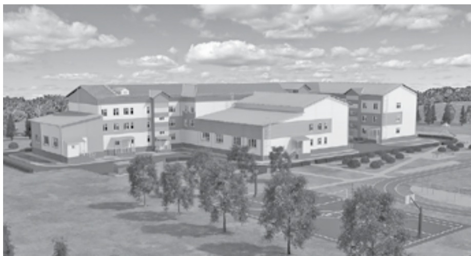
Новая школа будет просторной - площадью более 7 тыс. кв. м.