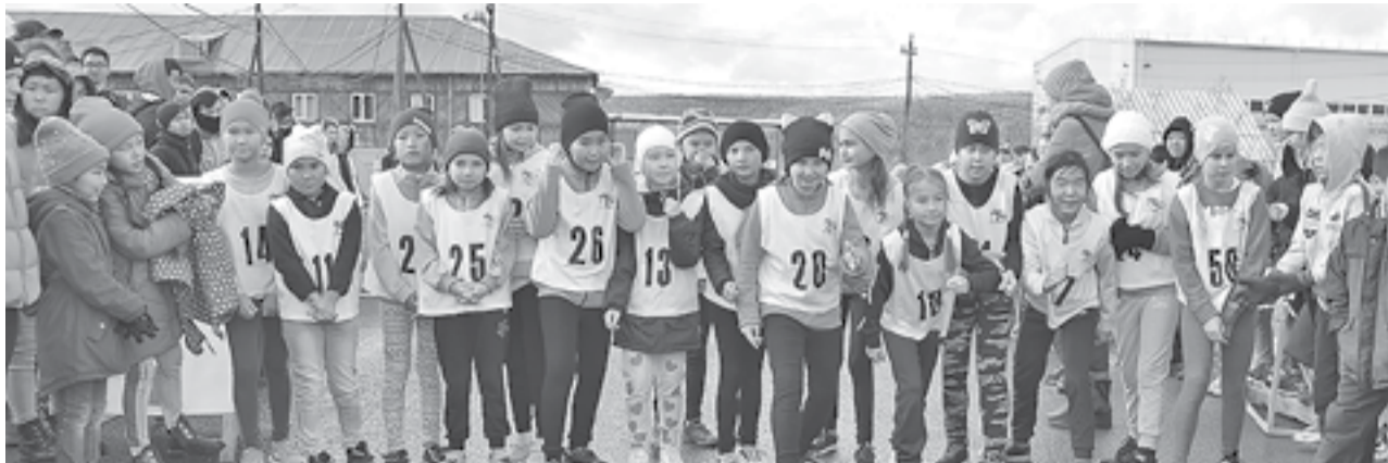
На старт! Внимание! Марш!

На минувшей неделе в районном центре прошел поселковый спортивный праздник «Кросс нации», который является ежегодным, мероприятием, проходящим в рамках всероссийской акции. В нем приняли активное участие большое количество школьников и взрослого населения п. Тура.