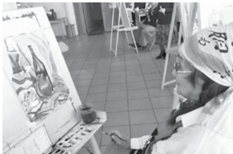
Зоневурин – соткул индун

Евдокия СИЛКИНА, газетадук «Эвэды ин» № 33, 6 сирудяндук бегадук 2019 аннганидук эвэдыт дукуран