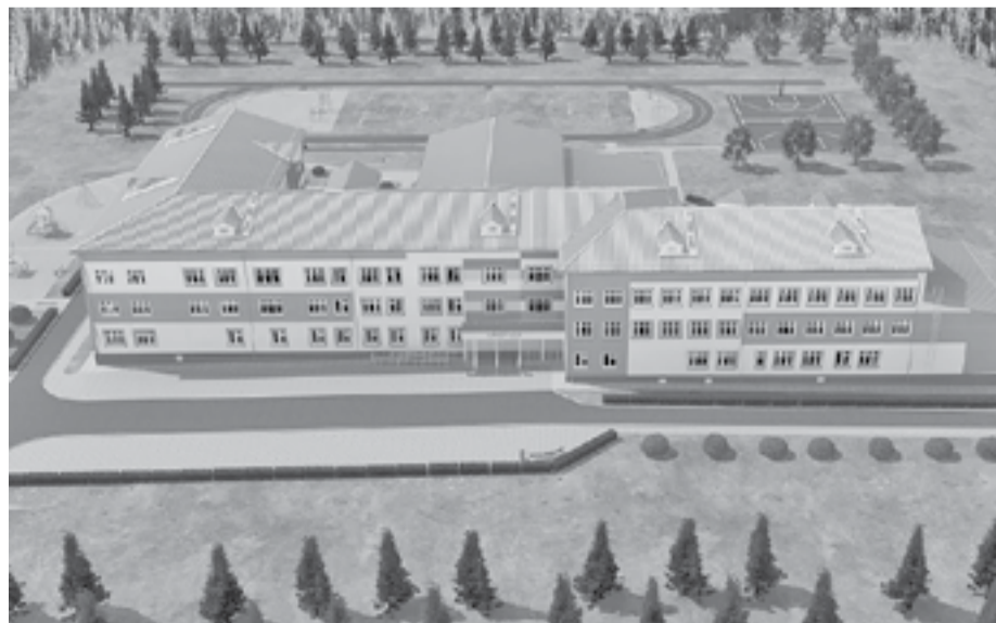
Второй этап строительства начнется уже зимой 2020 года