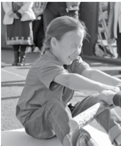
Азартное стремление к победе

В Туре состоялись «Северные игры» - традиционные соревнования на основе национальных видов спорта. С давних времен эвенки большое внимание уделяли физическому развитию детей. Их национальные игры были основным средством приобщения ребят к будущей трудовой деятельности - охоте, оленеводству, рыболовству, ведению домашнего хозяйства.