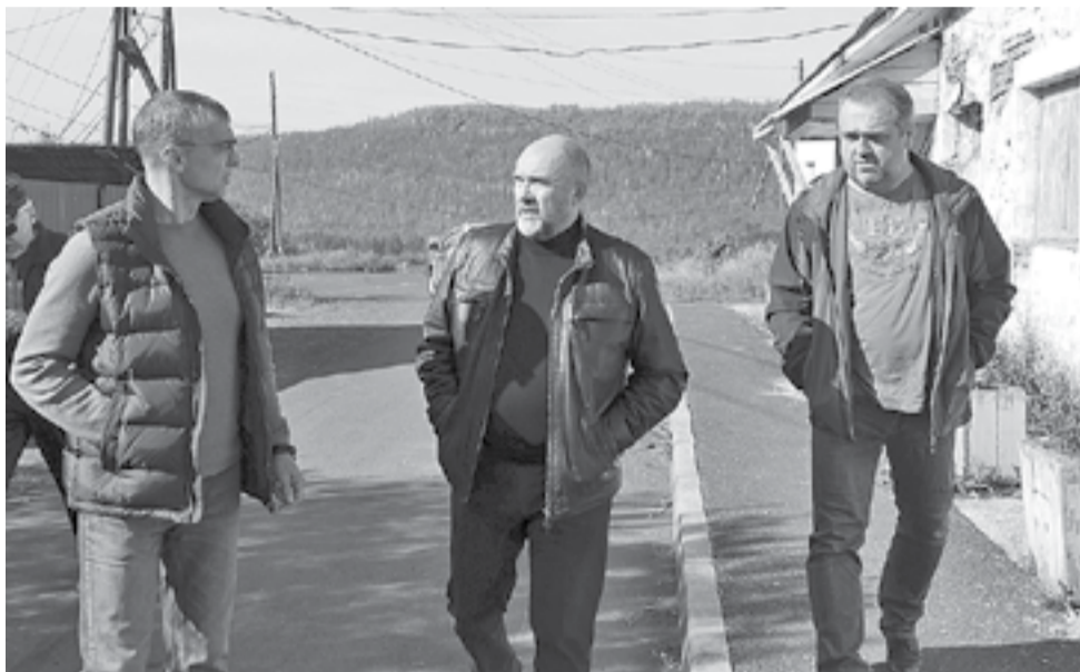
Руководителю территории доложили о ходе выполнения работ

В первую очередь комиссия посетила дошкольные учреждения. В Туринском детском саду № 5 «Лесной» рабочие завершают текущий ремонт системы водоотведения и гидроизоляции свайного поля, а в детском саду № 3 «Ручеек» - закончены работы по водоотведению, продолжаются работы по ремонту ограждения территории.