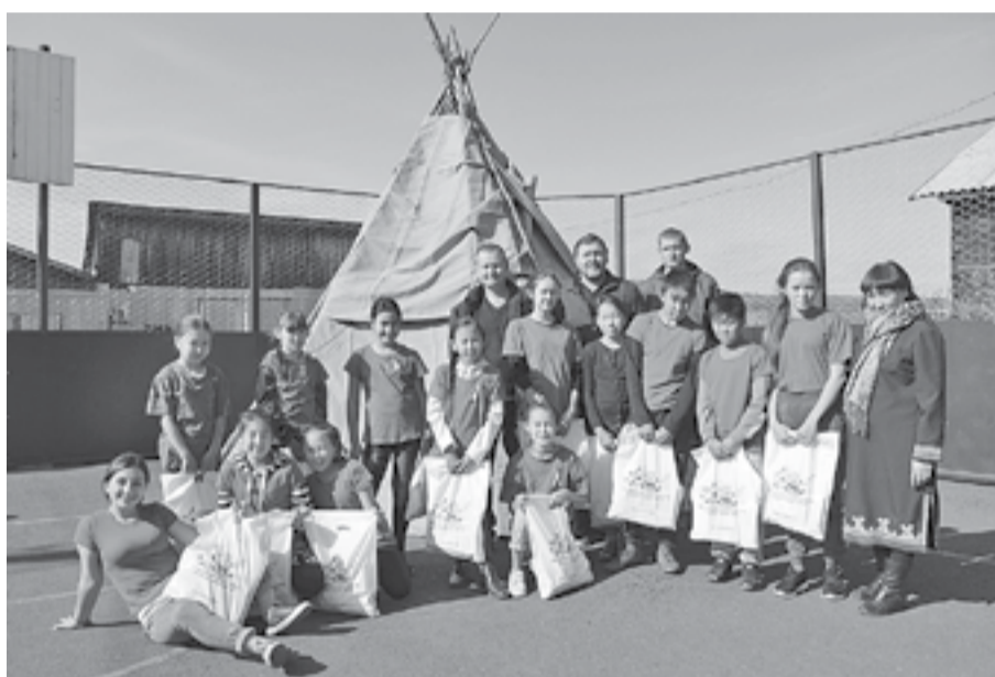
Северные игры становятся ежегодной традицией