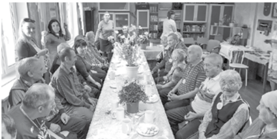
Праздничное чаепитие в ДИПИ

В Ванаварском Доме-интернате для престарелых и инвалидов проживает в настоящее время 60 человек, среди которых 35% - представители коренных национальностей. День аборигена здесь всегда празднуют сообща.