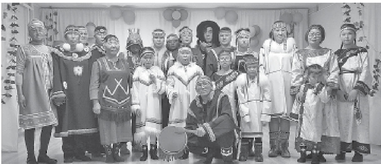
В сельском клубе - настоящий «калейдоскоп» северных народов

В одном из самых северных поселков Эвенкии – Чиринде – креативно подошли к празднованию Дня коренных народов мира. На концерте в сельском Доме культуры вниманию зрителей была представлена культура не только эвенков, но и других аборигенных народов Севера - нганасан, эвенов, чукчей, нанайцев и долган.