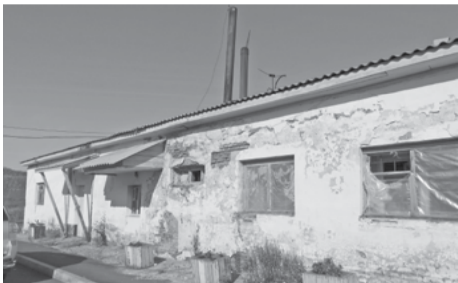
Общественная баня находится в удручающем состоянии и закрыта на ремонт