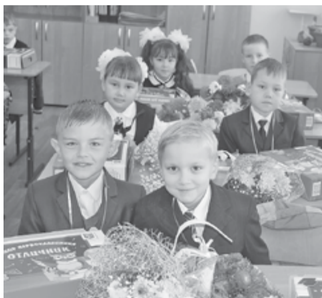
Школы Эвенкии встретили в этом году 255 первоклассников

мые дополнительные учебные материалы приобретают за счет финансовых смет учреждений.