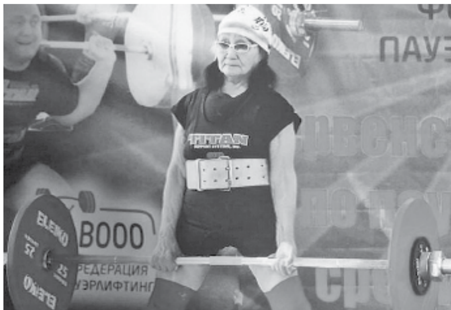
Она до сих пор выступает на турнирах, где занимает призовые места