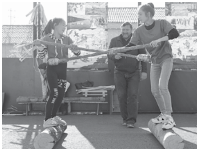
«Бой палками» - под силу не только мальчикам

Через игры эвенкийские дети приобретали самые важные практические и хозяйственные навыки, в которых прогнозируются и моделируются жизненные ситуации, умения и способности, необходимые человеку для жизнедеятельности.