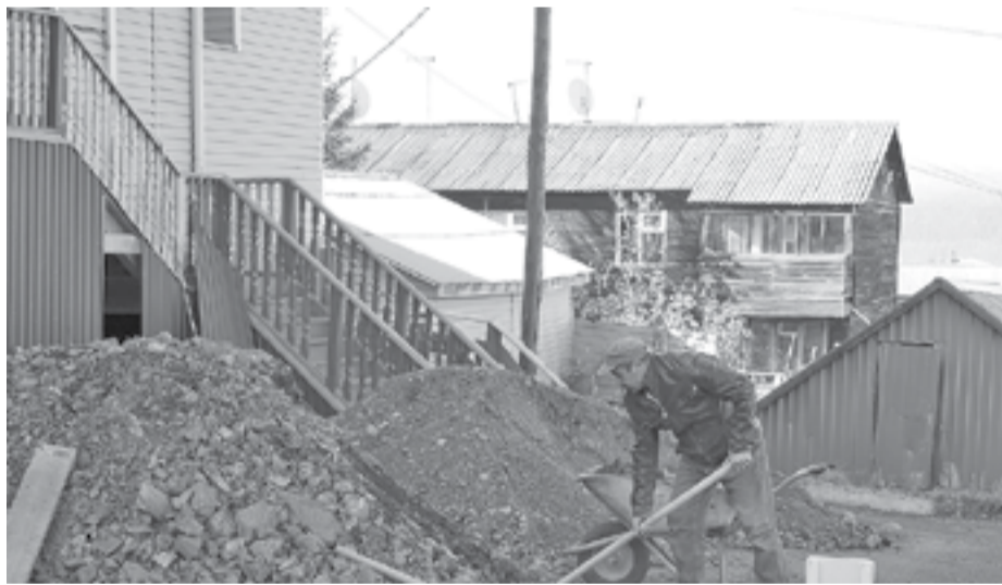
В ряде социальных объектов райцентра завершаются ремонтные работы