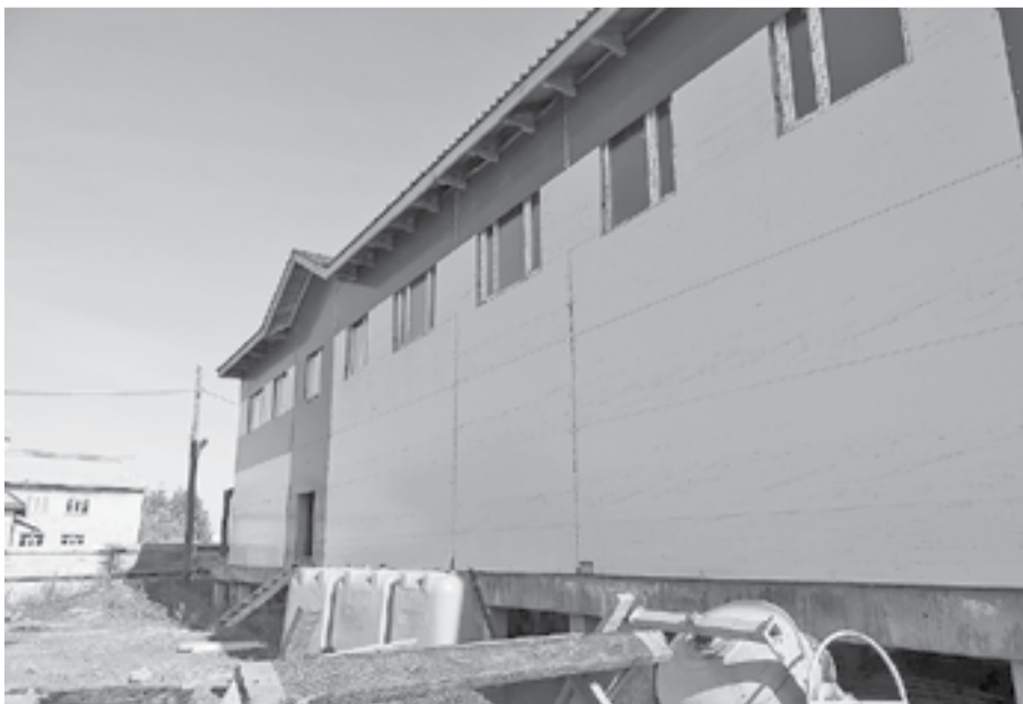
Возобновлено строительство многоквартирного дома в Туре по адресу ул. Борисова, 30