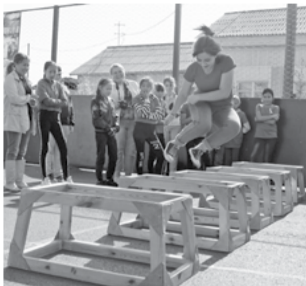
Прыжки через нарты очень популярны среди эвенков