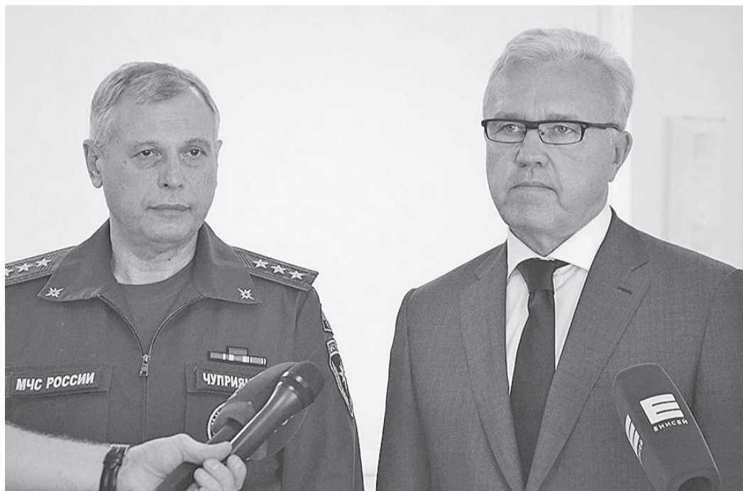
А.В. Усс: «Главное, удалось не допустить перехода пожаров на населенные пункты»