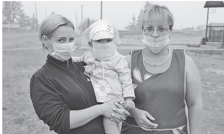
Маска - больше психологическая, чем реальная защита от дыма

Если печатные СМИ и телевидение, за которыми пристально следят задыхающиеся в дыму эвенкийцы, фиксируют успешную работу пожарных служб и ликвидацию десятков пожаров, то в населенных пунктах Тунгусско-Чунской группы поселений ситуация с задымлением почти не изменилась. Отраднo, что полностью ликвидирован пожар на территории ГПЗ «Тунгусский», но тот самый №113, расположенный на границе с заповедником, лишь частично локализован и по-прежнему укрывает небо своим дымом.