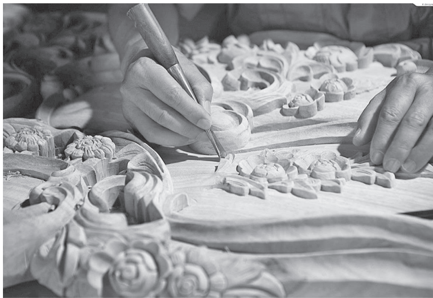
Красота рождается из кропотливого ручного труда