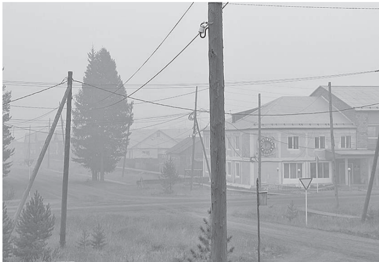
На ванаварских улицах сейчас мало прохожих

Прошла еще одна трудная неделя под темным небом. По-прежнему дым лесных пожаров не покидает многие эвенкийские поселения.