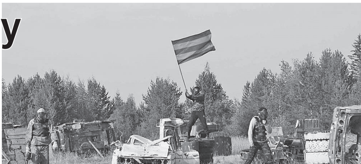
Захватить флаг соперника - «высший пилотаж» в игре пейнтбол

В минувшую субботу в Ванаваре прошел очередной открытый чемпионат по пейнтболу среди мужских и женских команд. Достаточно популярный вид активного отдыха в нашем селе собрал в этом году 12 команд, из них 8 - мужских и 4 - женских.