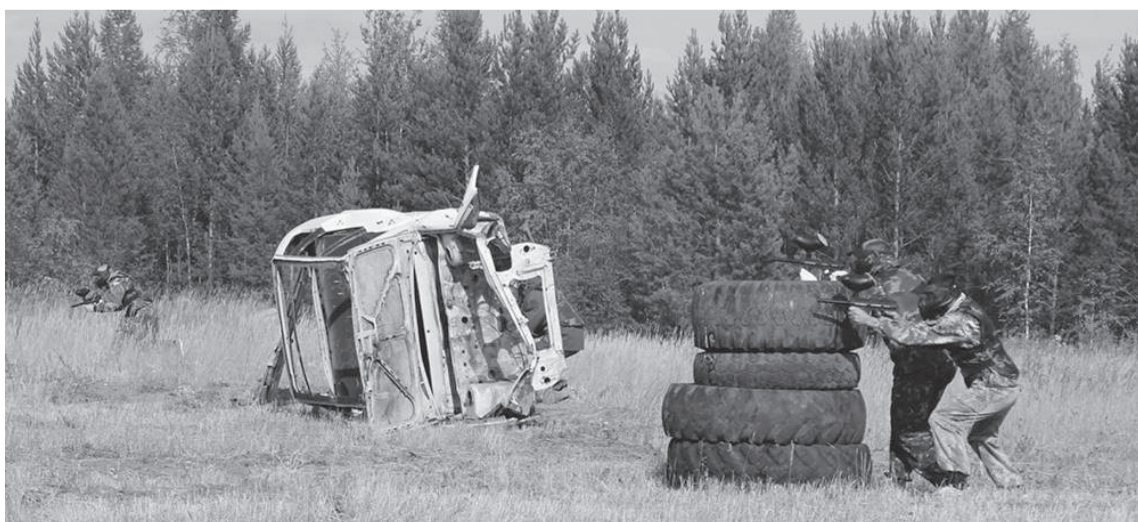
Чемпионом среди мужчин в четвертый раз (!) стала команда «V - значит наказывать»