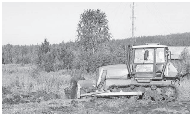
Новый трактор активно используют для обновления минполосы