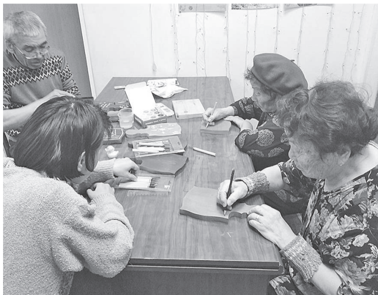
Работа в группе положительно влияет на эмоциональное состояние человека

В жизни каждого человека творчество занимает особое место, поскольку его проявления многогранны. Оно сыграло немаловажную роль в развитии истории и продолжает и по сей день вершить ее. Творчество уникально тем, что оно неповторимо, не копируемо, оно индивидуально.