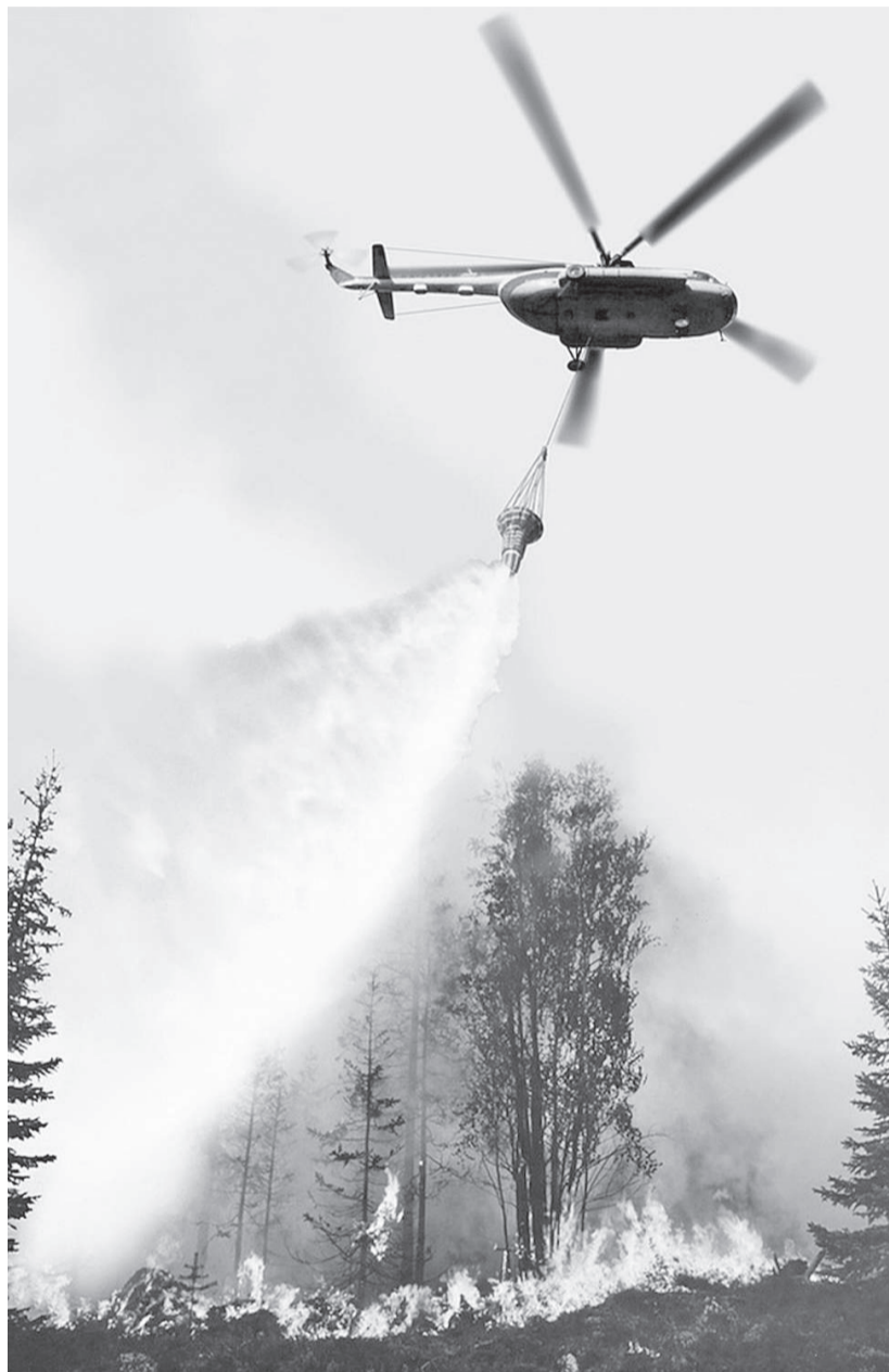
Площадь лесных пожаров значительно сократилась после активного применения гидроавиатехники