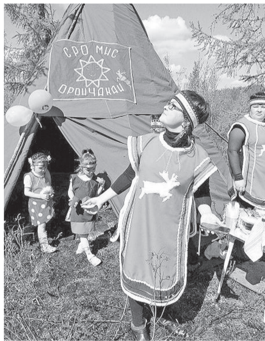
Чум родовой общины «Орончикан» на празднике Мучун

В Эвенкии, где жизнь сурова так же, как и климат, человеку сложно одному. В тундре живут семьями, родами - вместе легче кочевать, охотиться и ухаживать за оленями. И, даже переселяясь в поселок, эвенки всегда знают, где чьи, кто какого рода. Родами ведут свое небольшое дело, и такой вариант - самый надежный для Севера, где в принципе сложно найти работу.