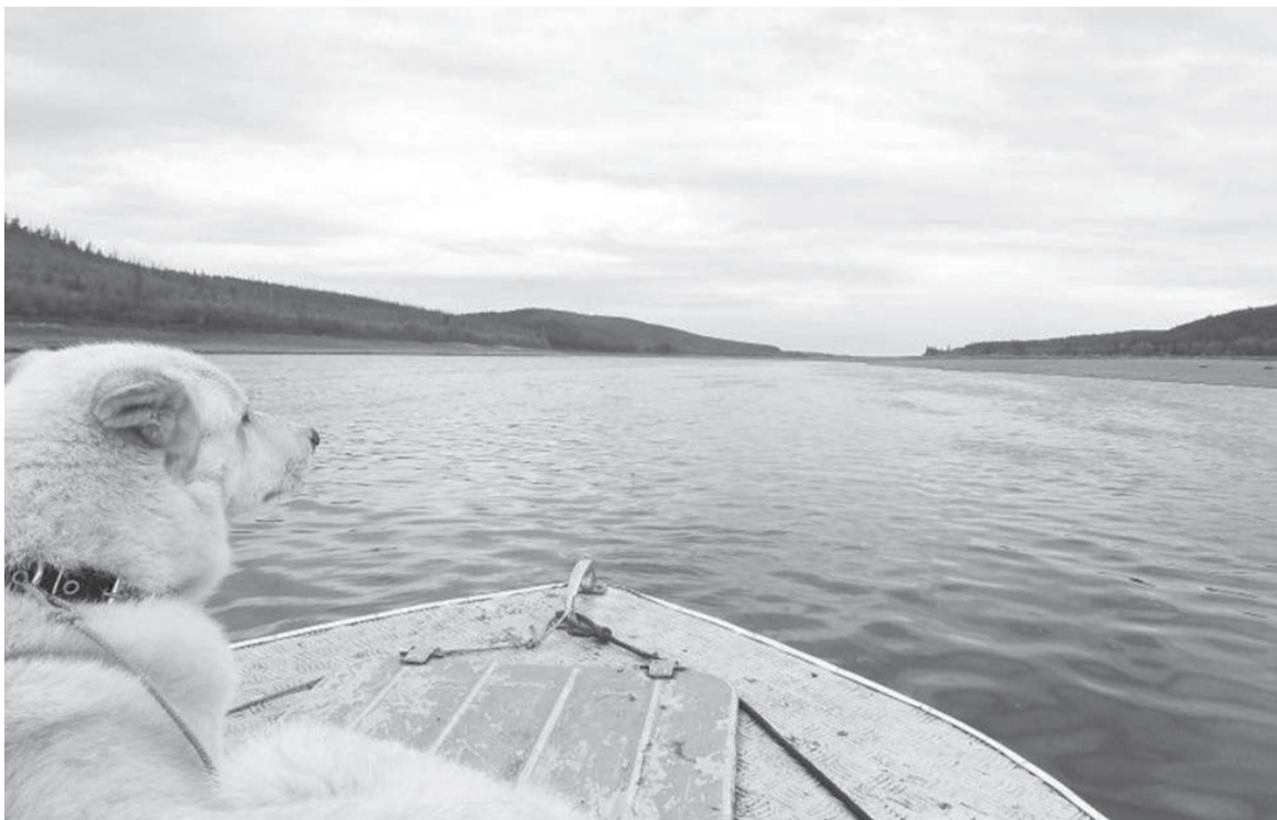
По водной дороге в Юкту

В этом году Красноярский край отметит свой 85-летний юбилей. В преддверии этого события журналисты газеты «Наш Красноярский край» отправились в командировки по всему большому региону. Как видят нашу территорию жители Красноярска, предлагаем узнать из следующего материала.