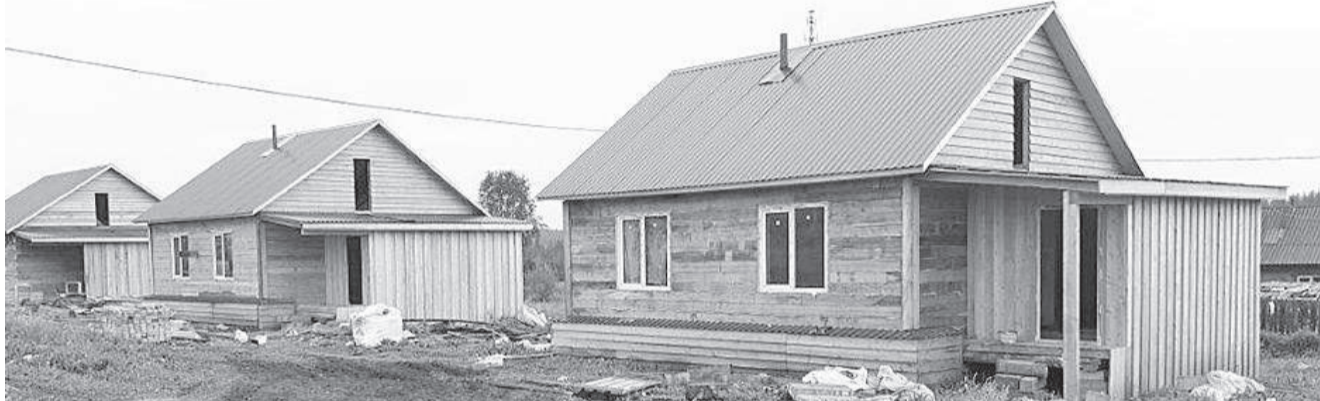
В поселке возводится новое жилье