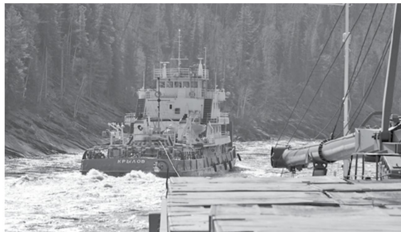
Профессионализм и хорошая организация работы позволили речникам выполнить все обязательства

Флот Енисейского речного пароходства успешно осуществил завоз жизненно важных грузов в поселки Эвенкии, расположенные на реках Подкаменная и Нижняя Тунгуски.