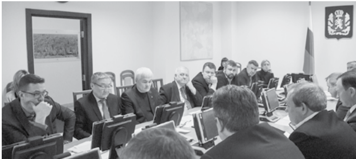
Законотворческая деятельность комитета в 2019 году была в основном посвящена расширению системы мер господдержки лиц из числа КМНС