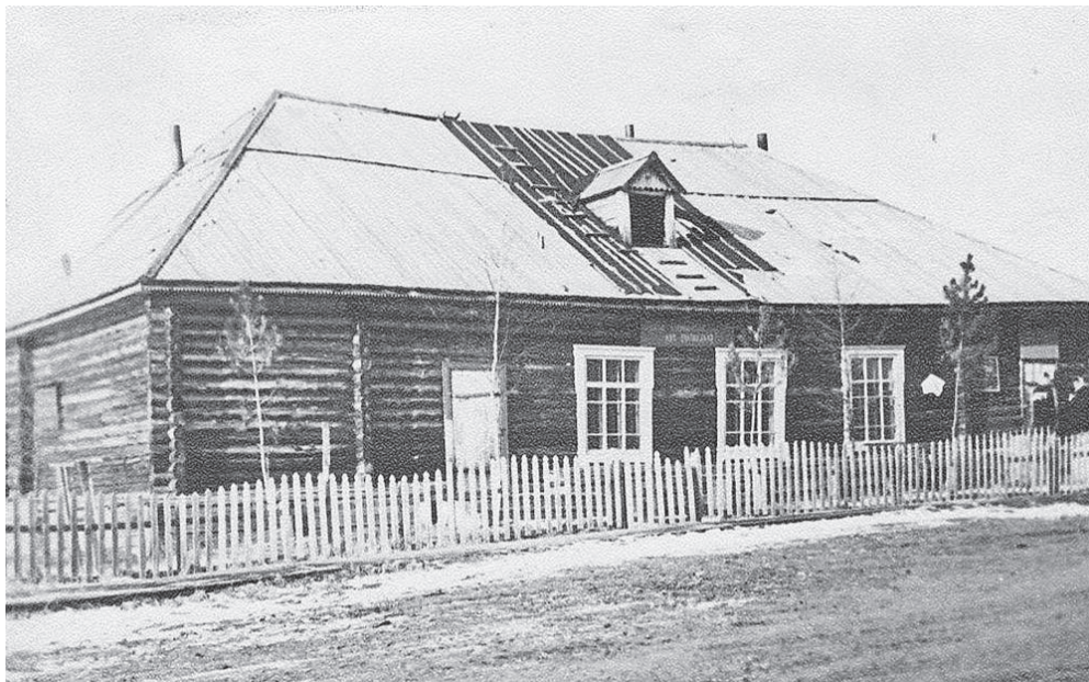
Красный чум п. Тутончаны 1970-1971 гг.

Конец двадцатых, начало тридцатых годов ушедшего века в Эвенкии. В 1927 году на реке Нижняя Тунгуска создается Туринская культбаза. После долгих исследований, опроса местного туземного населения было принято решение строить культбазу именно на р. Нижняя Тунгуска, т.к. местность занимала удобное положение: стояла на пересечении охотничьих маршрутов и являлась местом торгового обмена.