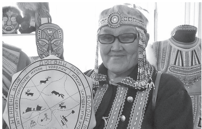
... и творческие встречи и концерты

На мероприятие в столицу Приамурья съехались 160 ученых-тунгусоведов из 10 стран мира. Междисциплинарная конференция объединила этнографов, антропологов, этноисториков, археологов, лингвистов и других исследователей. Все они заинтересованы в изучении тунгусо-маньчжурских народов, в число которых входят эвены, эвенки, орочоны и солоны.