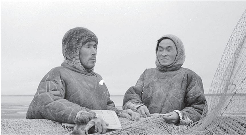
Все «живое серебро» сдавали в Фонд обороны

Администрация ЭМР Эвенкийский районный Совет депутатов Администрация поселка Тура Управление культуры администрации ЭМР Работники культуры Эвенкии Эвенкийская общественная организация ветеранов (пенсионеров) войны, труда, ВС и правоохранительных органов Красноярского края