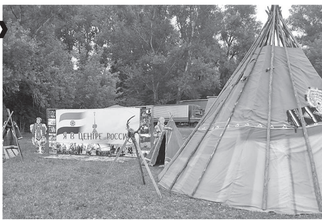
Материальная культура эвенков представлена в «этнопарке» фестиваля

С 11 по 14 июля в п. Шушенское уже в 16-й раз проходит фестиваль «МИР Сибири», являющийся одним из самых крупных отечественных событий в сфере этнической музыки и традиционных ремесел. На этот раз мероприятие посетили более 30 тысяч туристов из России и зарубежных государств. В этом году для гостей фестиваля подготовлена насыщенная музыкальная программа - приехали 75 артистов из 12 стран. Эвенкию на фестивале представляют самобытные мастерицы.