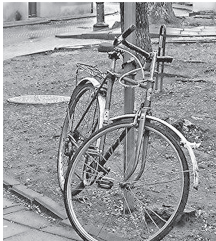
Не оставляйте свои личные вещи без должного присмотра!

Отдел МВД России по Эвенкийскому району в летний период прогнозирует всплеск преступлений, связанных с хищениями велосипедов. Анализ происшествий прошлых лет показал, что все преступления были совершены свободным доступом, то есть владельцы «двухколесных» оставляли их в общедоступных местах, без присмотра на продолжительное время.