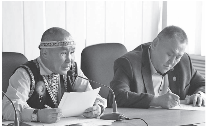
... круглые столы на актуальные темы...