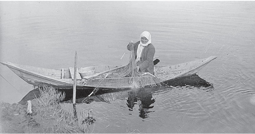
Эвенкийский округ, 1932 г. (автор М.К. Калашников)