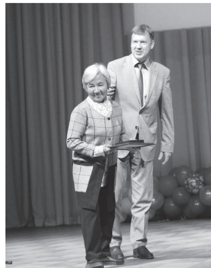
Награда в знак уважения общества за сохранение семейных ценностей

На торжественном вечере в Туре, посвященном всероссийскому Дню семьи, любви и верности, некоторые семейные пары были награждены медалью «За любовь и верность».