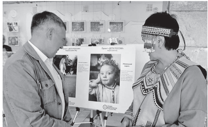
В рамках конференции состоялись выставки прикладного искусства...