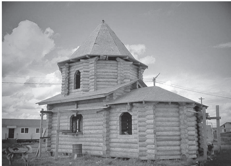
Силуэт храма Василия Великого уже виден