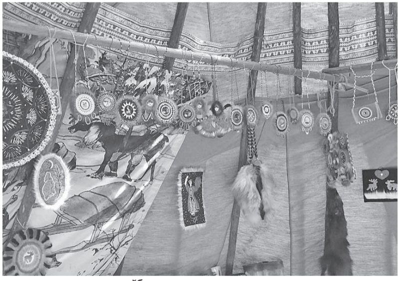
Участники эвенкийской делегации проводят экскурсии по стойбищу, дают мастер-классы по изготовлению кумаланов

На целых четыре дня участники и гости фестиваля погрузились в многоцветье национальных культур и традиций, где прошлое и настоящее сплетаются в неповторимом красочном узоре. Мелодии и ритмы экзотической музыки, звучание аутентичных инструментов, причудливый рисунок зажигательных народных танцев, полная творческая свобода и всеобщий радостный настрой создают атмосферу праздника и дают ощущение причастности к чему-то глубинному, истинно народному и потому подлинному. Несомненно, «МИР Сибири» - это площадка для самых ярких представителей отечественной и зарубежной этнической музыки. Впрочем, кроме главной сцены, где и выступают артисты, на фестивале много других интересных локаций: обрядовая поляна, ярмарка авторских изделий, беседка с лекциями, гастрономические ряды, этнопарк с презентацией культуры народов Енисейской Сибири и Севера. Отметим, участниками фестиваля «МИР Сибири» от Эвенкии стали