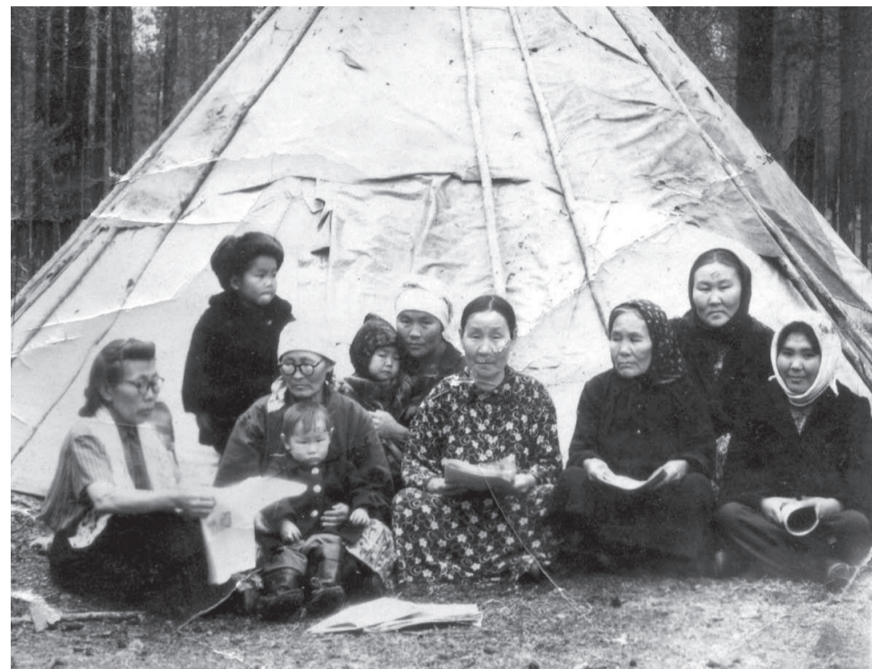
Передвижной Красный чум в стойбище оленеводов