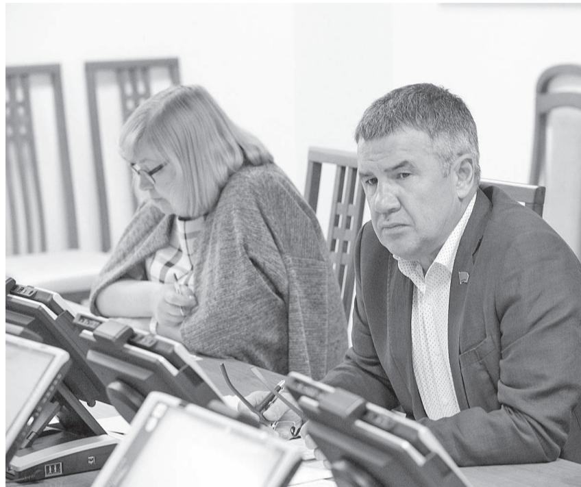
На заседании комитета по делам Севера обсуждали лимиты квот на добычу ДСО: край за сокращение, северные районы с этим не согласны

Вынести этот вопрос на заседание комитета потребовалось из-за того, что подготовленный министерством проект указа губернатора «Об утверждении лимита добычи охотничьих ресурсов на территории Красноярского края на охотничий сезон 2019-2020 гг.» при общественном обсуждении вызвал возражения и у жителей Таймыра, и у жителей Эвенкии.