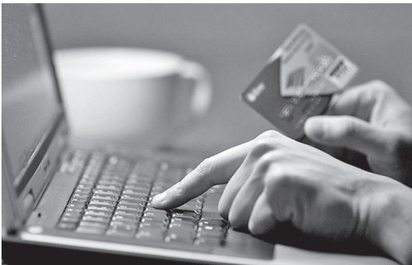
Не забывайте о собственной безопасности

В мире участились случаи дистанционных краж денежных средств с банковских карт посредством мобильного телефона и сети Интернет. Как не попасться на уловки мошенников, в материале следственного подразделения.