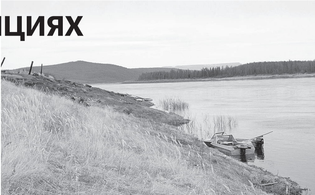
В водоемах национального округа водилось много рыбы

С прискорбием сообщаем, что 12 июля 2019 года на 83-м году жизни скончалась почетный житель Эвенкии, уважаемая наша землячка, мелодист, поэт, хранитель родного эвенкийского языка