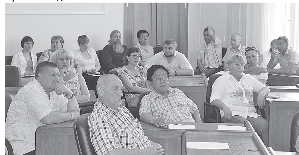
Депутат отчитывается об исполнении наказов избирателей, получает обратную связь