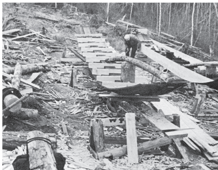
Строительство деревянных лодок, 1959 год