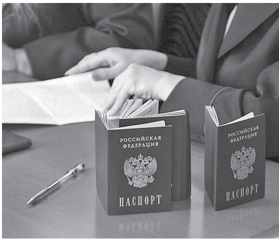
Участники госпрограммы получают различные преференции

Региональная программа переселения соотечественников реализуется на всей территории Красноярского края, кроме закрытых административно-территориальных округов и территорий с регламентированным посещением для иностранных граждан, а также Березовского, Шушенского, Таймырского Долгано-Ненецкого районов.