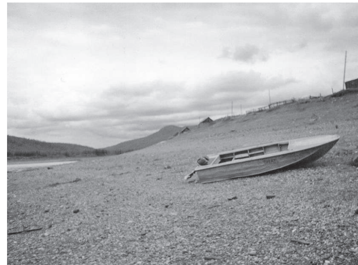
Крутой берег села

По данным филиала с. Байкит МКУ «Эвенкийский архив», других источников