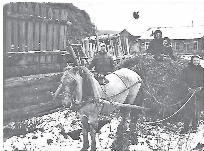
Подвоз сена, 1950-е годы

- 26 июня 1951 года решением исполкома Байкитского райсовета № 127, по просьбам колхозников Кумондинского и Куюмбинского колхозов, высказанных на общих собраниях от 29.09 1950 г. (протокол № 4 ф. Кумонда) и от 01.10.1950 г. (протокол № 1 ф. Куюмба) и учитывая дальнейшие перспективы в развитии сельского хозяйства, было решено удовлетворить просьбы этих колхозов о слиянии их в один колхоз и считать их с 12.06.1951 г. объединенным колхозом. Объединенный колхоз стал называться колхозом