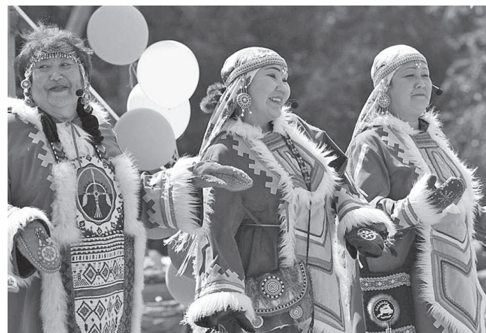
Девушки из ансамбля «Тогокон»

И вот этот день, 29 июня, наступил. На празднование 95-летия села в течение дня на лодках, воздушном транспорте начали съезжаться гости из близлежащих поселений, Байкита. Основная делегация в составе 22 человек (представители власти Эвенкийского района, руководители предприятий и учреждений, участники народного национального ансамбля «Тогокон», звукооператор МБУК БКС, фоторепортер и корреспондент села Байкит), в назначенное время на вертолете приземлилась на береговой авиаплощадке Подкаменной Тунгуски села Куюмба. Приехали не с пустыми руками: привезли награды, подарки, гостинцы.