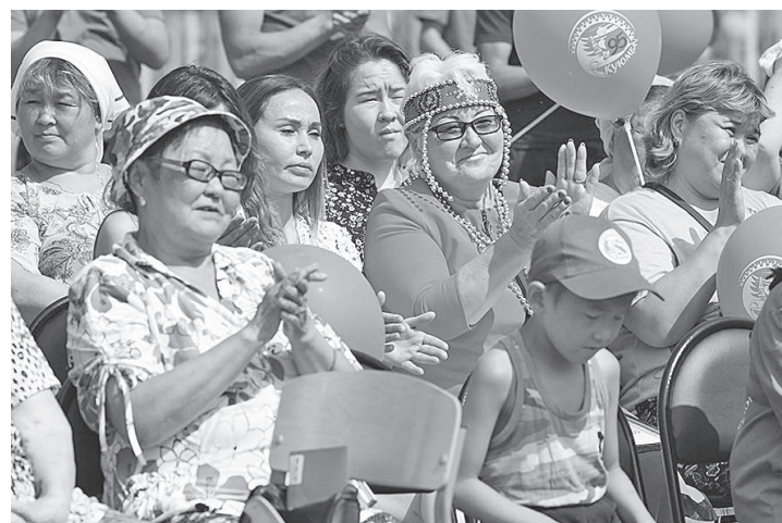
Зрители на аплодисменты не скупились