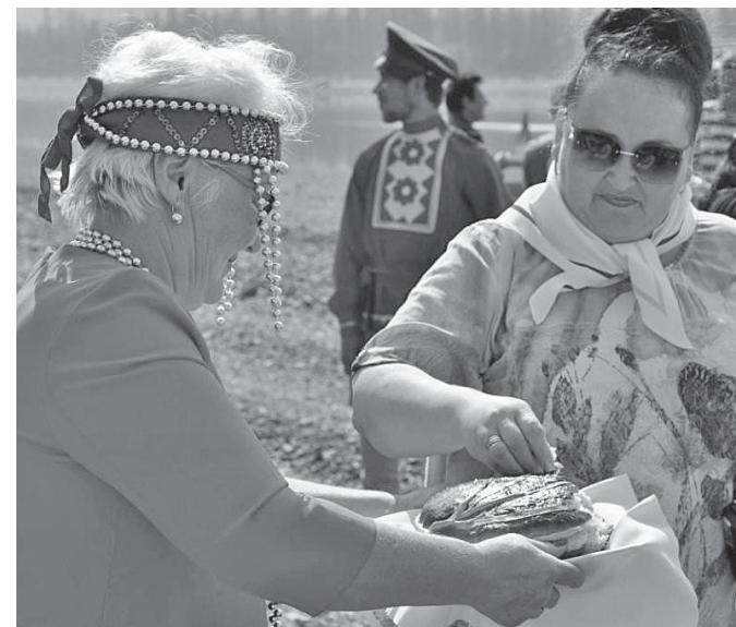
Встреча гостей хлебом-солью