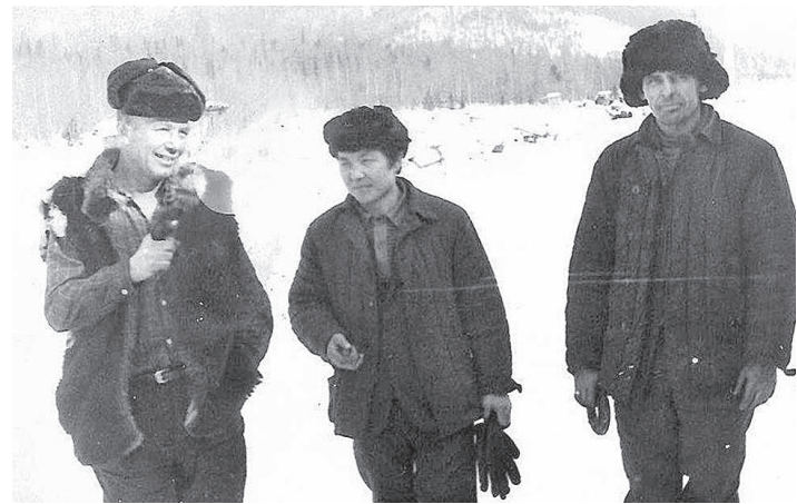
Вахтовики подбазы Куюмба