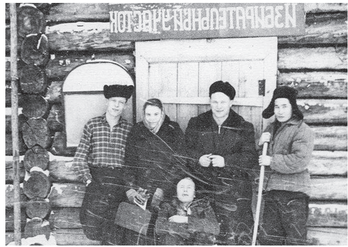
На избирательном участке ф. Куюмба, 1959 год