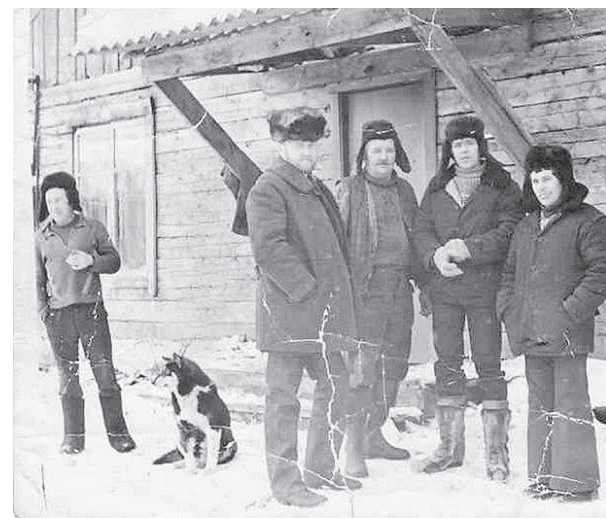
Рабочий персонал подбазы