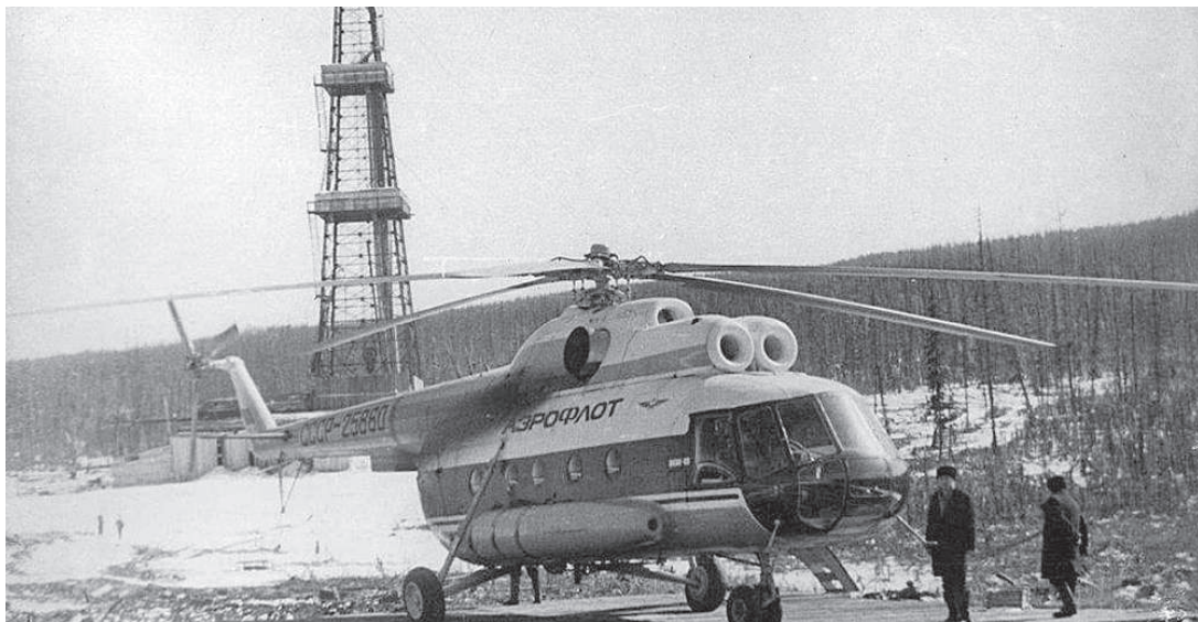
Куюмба-9, 1975 год