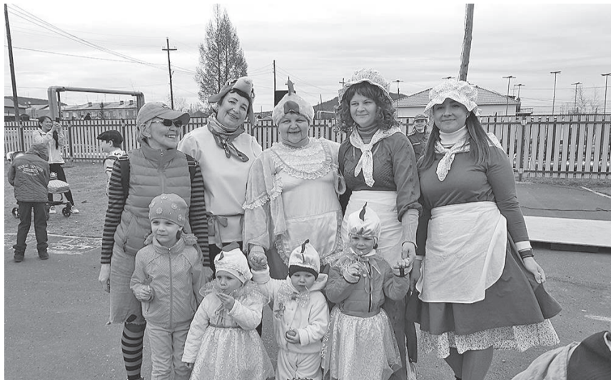
По-настоящему сказочные костюмы продемонстрировали не только дети, но и целые семьи

Яркий и красочный, согретый детским смехом и радостными улыбками праздник прошел 1 июня на детской площадке в центре Туры! Игровая поляна, костюмированное шествие, рисунки на асфальте, велогонки, дискотека, концерт и мультфильм - все это включил в себя День защиты детей для наших маленьких жителей.