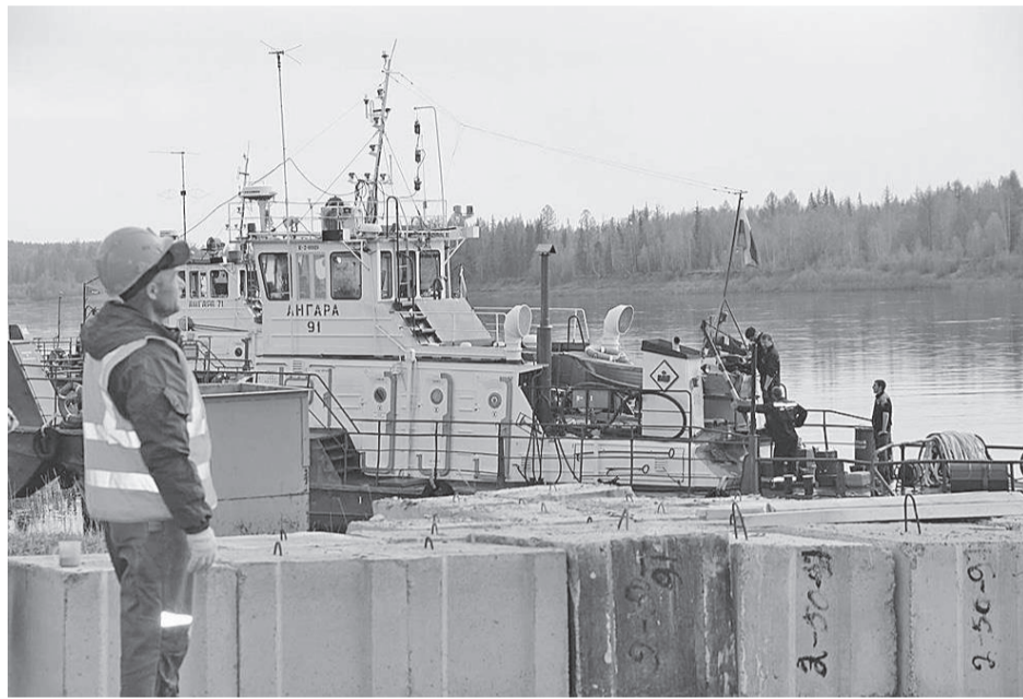
Разгрузка каравана прошла организованно

В Ванаваре практически завершена кампания по доставке грузов водным транспортом.