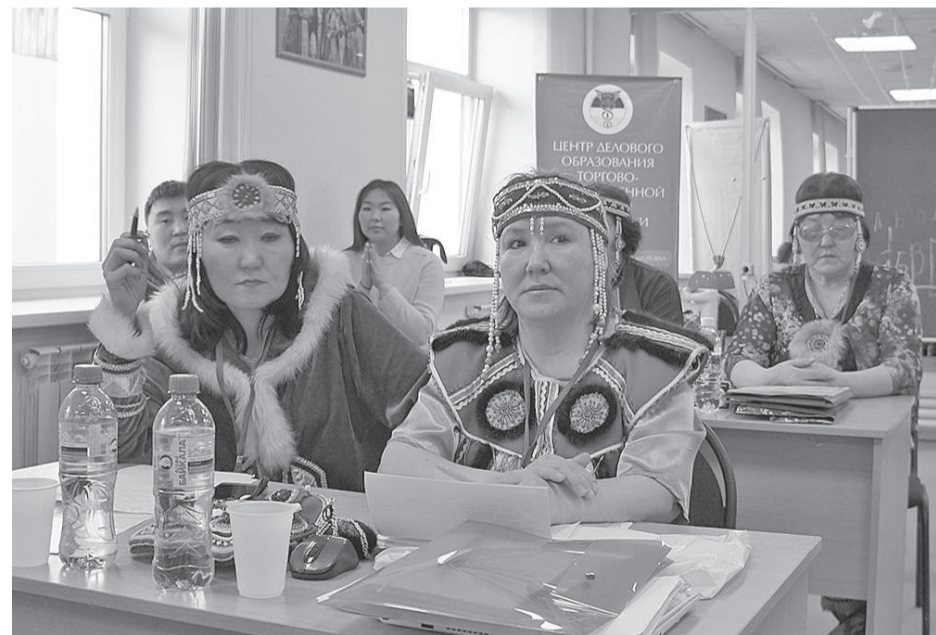
Семинар педагогов по языкам коренных малочисленных народов Севера

Организаторами фестиваля выступили министерство образования и науки республики Бурятия, Бурятский государственный университет совместно с Комитетом по межнациональным отношениям и развитию гражданских инициатив администрации главы Республики Бурятия и правительства Республики Бурятия, Центром делового образования.