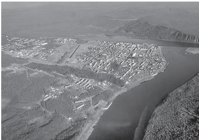
Эвенкия дулугун Тура