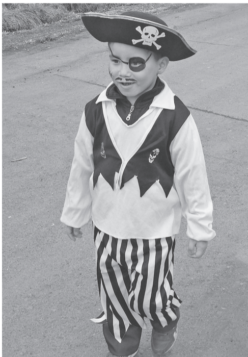
День защиты детей - самый веселый праздник для юных эвенкийцев

На пешеходной части возле магазина «Центральный», откуда и началось костюмированное шествие, ребята могли продемонстрировать свои интересные и по настоящему сказочные костюмы. А вот уже на детской площадке их встречали большие друзья малышей – ростовые куклы. Они развлекали юных зрителей конкурсами, танцами, играми и загадками.