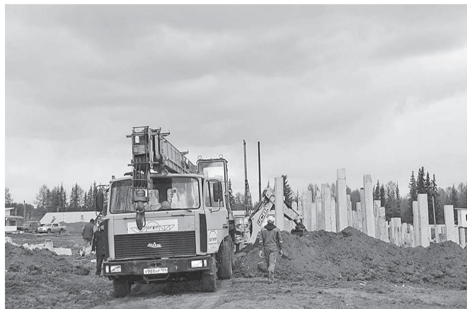
Работа на объекте кипит