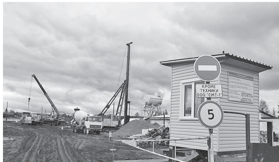
Въезд на стройплощадку ограничен