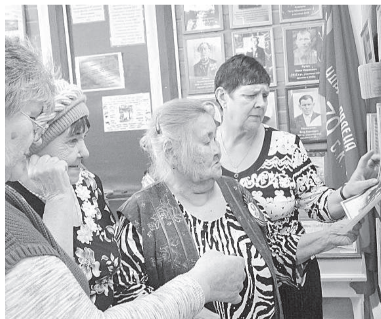
Старожилы села помнят многое...

раскрытию темы, и по стилю написания, и конечно, за свой личный взгляд на исторические события.