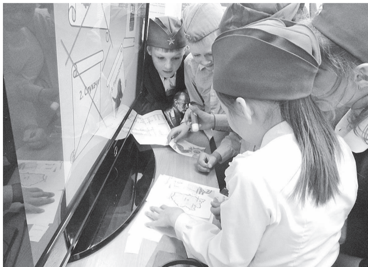
Викторина с учащимися Ванаварской средней школы

Благодарим всех участников конкурса! Каждое сочинение заслужило отдельного внимания и по