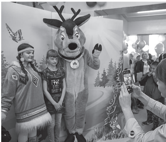
Олененок Орхэ – любимый и хорошо знакомый герой праздника

В фойе сельского клуба ребята могли украсить себя ярким аквагримом и сфотографироваться с ростовыми фигурами Орхэ и Оптимуса Прайма. Для особо любознательных здесь же открыли экспозицию, посвященную Юрубчено-Тохомскому месторождению, экспонатами которой стали манекен с полным обмундированием средств индивидуальной защиты работника «Роснефти», образцы керна, геодезические инструменты, карта лицензионных участков района. После праздника экспозиция отправилась в школьный музей, где в новом учебном году будут организованы уроки краеведения про историю освоения эвенкийских месторождений.