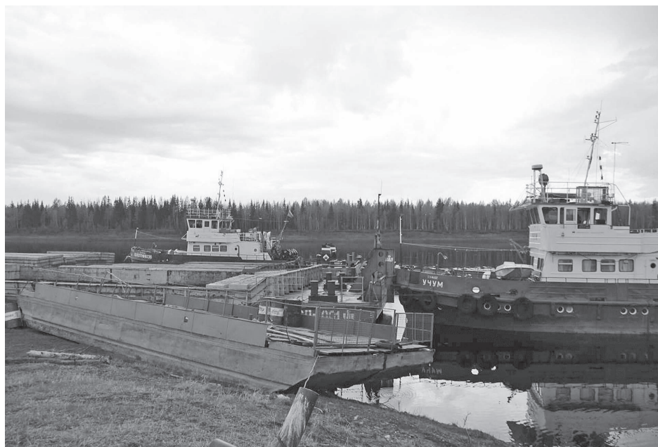
В Ванавару доставлено около трех тысяч тонн различных грузов