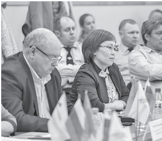
Представители районной власти и общественности

Но главным событием дня стало представление «Новые приключения олененка Орхэ» с давно знакомыми персонажами комиксов и настоящим трансформером в главной роли, интерактивным шоу гигантских шаров, познавательными химическими опытами и удивительным «Тесла-шоу» для более 400 детей и их родителей. По сюжету спектакля олененок Орхэ и шаманка Эйва наблюдают падение нового метеорита в Эвенкии. Это прилетел гость с далекой планеты, трансформер Оптимус Прайм. Когда ростовая фигура Оптимуса Прайма появилась на сцене, все ахнули: двухметровый трансформер выглядел совсем как настоящий. Выданные всем зрителям на входе светящиеся браслеты по команде зажались, и на лицах и маленьких, и взрослых гостей высветился неподдельный восторг от происходящего в зале. При помощи удивительных экспериментов из химии и физики Нефтяник и сами байкитские школьники сообща, прямо по ходу действия, изобретали волшебное топливо, чтобы помочь Оптимусу Прайму. Разумеется, у них все получилось. Природные кладовые Эвенкии творят чудеса.