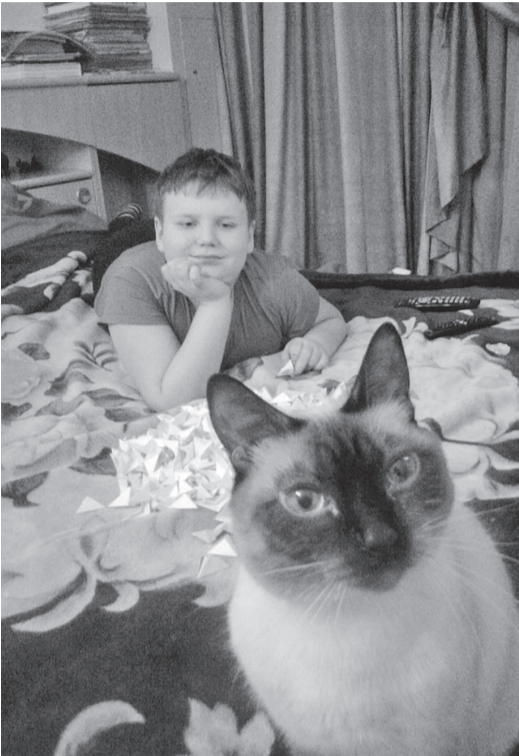
Хобби у нас на двоих