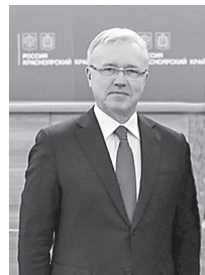
Губернатор Красноярского края А.В. Усс