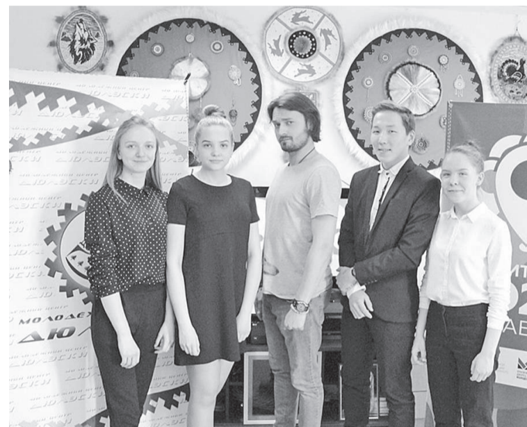
Команда проекта «Чистые гонки»