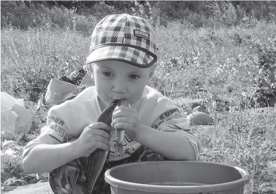
Пусть и не золотая, зато две