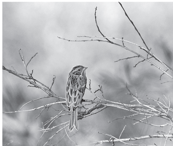
Адытанэ чипичал митту биси