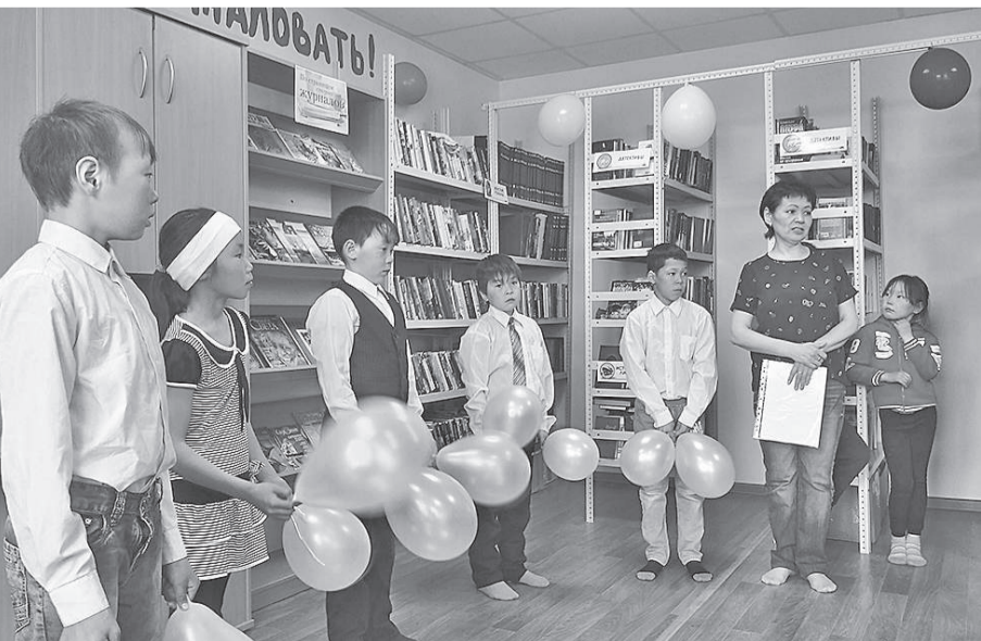
Дети прочли стихи и исполнили песни о своей библиотеке

На прошлой неделе, в Общероссийский день библиотек, в Эконде состоялось знаменательное событие – после капитального ремонта свои двери для посетителей распахнула сельская библиотека.