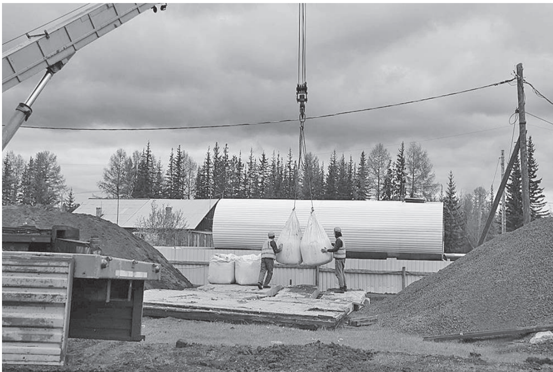
Речным флотом доставлены основные стройматериалы

На этой неделе в Ванавару по реке доставлен основной объем строительных материалов, и работы на объекте из подготовительной перешли в стадию возведения конструкций.