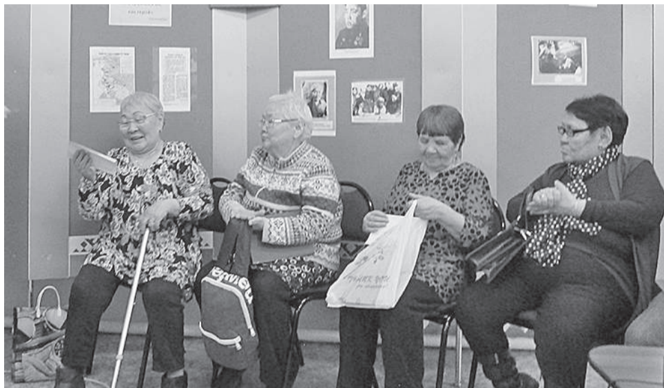
Слушатели филиала, несмотря на солидный возраст, спешили на лекции в любую погоду и при любых обстоятельствах

Завершился первый учебный год на факультете «Краеведение» в Эвенкийском филиале Красноярского краевого народного университета «Активное долголетие» на базе Эвенкийского краеведческого музея.