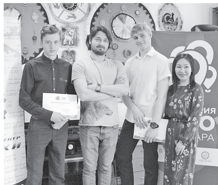
Команда проекта «Ванаварские единоборства»