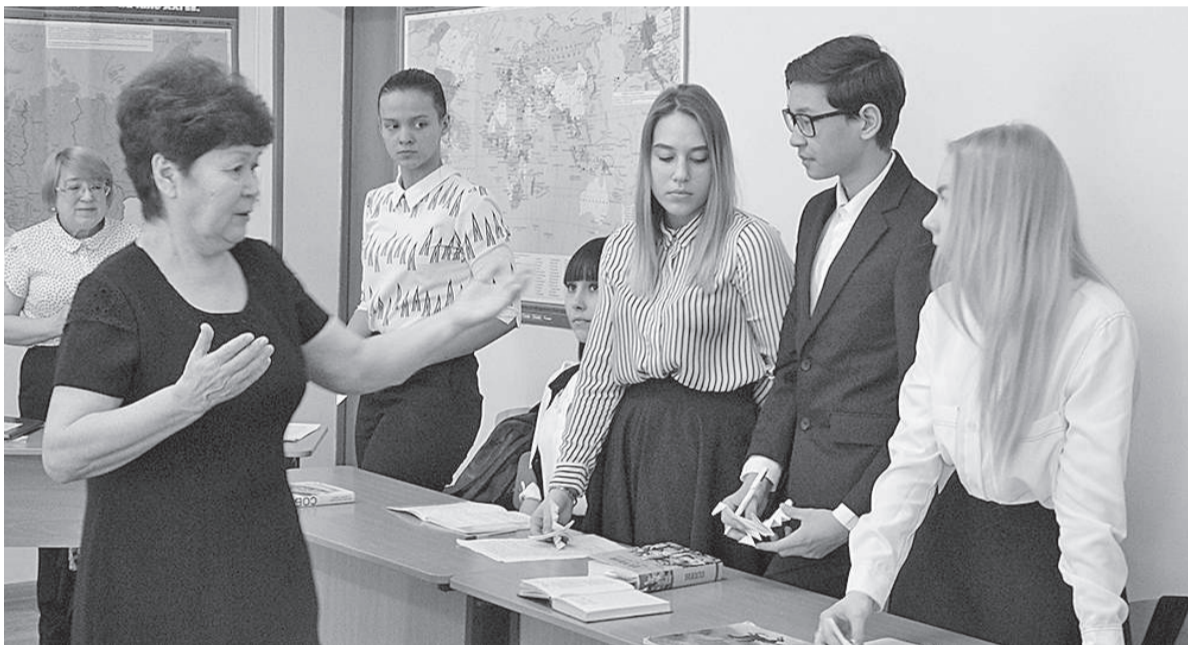
Затаив дыхание, ученики слушают учителя