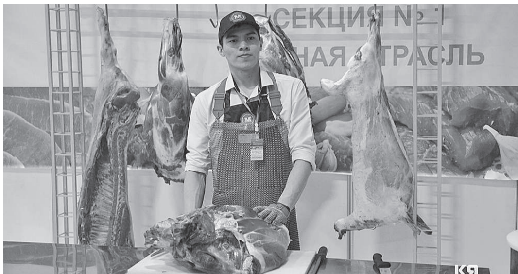
На площадках форума была представлена различная продукция, в том числе и мясная