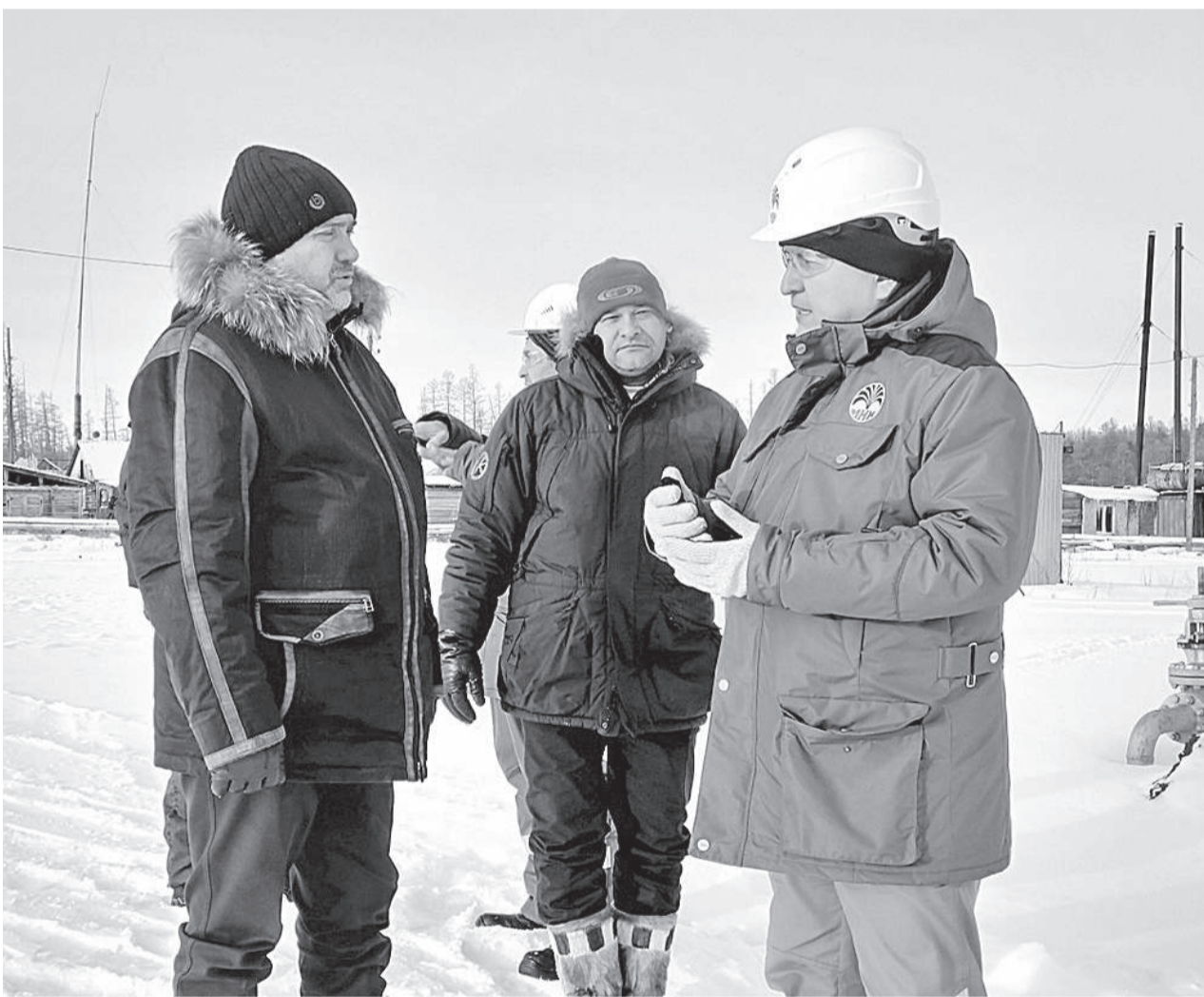
Нефтяники и районные власти находятся в постоянном диалоге, стороны заинтересованы в развитии территории

На Пайгинском месторождении, расположенном в Тунгусско-Чунской группе поселений, в текущем году возобновляется добыча нефти. Два лицензионных участка там сейчас обслуживает ООО «Иркутская нефтяная компания».