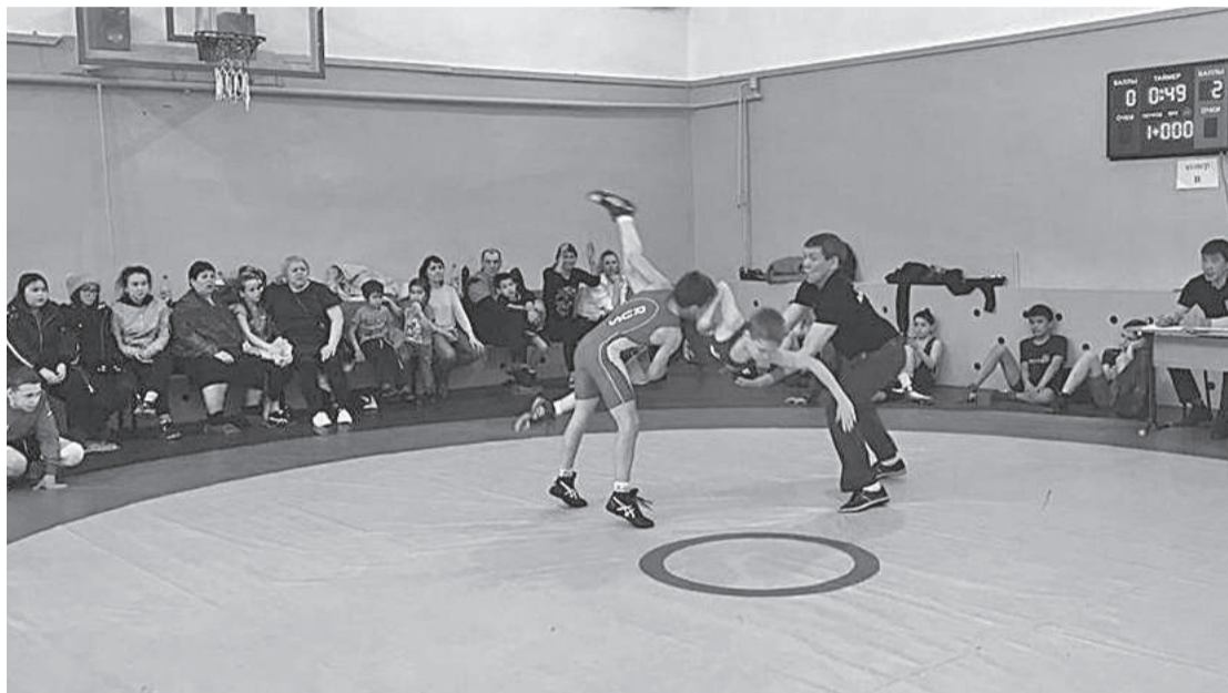
Накал страстей был огромен, каждый старался показать все свои способности

В апреле в Туре прошел большой спортивный праздник - первенство Эвенкийского муниципального района по вольной борьбе среди юношей и девушек, посвященное памяти Василия Смелякова.