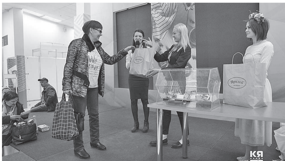
На форуме проходили акции и беспроигрышные лотереи