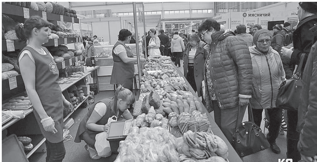
Совсем немного не хватило нашим представителям, чтобы войти в тройку лидеров

- Да, конечно, мы несколько не расстроены. На следующий год с удовольствием примем участие в форуме и постараемся привезти первое место. Все было очень интересно, много нового я узнала для себя и для нашего производства. Большое спасибо организаторам.