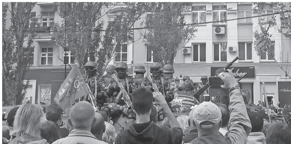
Мы помним тех, кто отдал свои жизни за нас

День Победы в очередной раз прошествовал по планете. Поклонились подвигу героев, победивших фашизм, люди многих стран, в том числе мужественные защитники своей культуры и права говорить на русском языке жители Луганской и Донецкой республик.