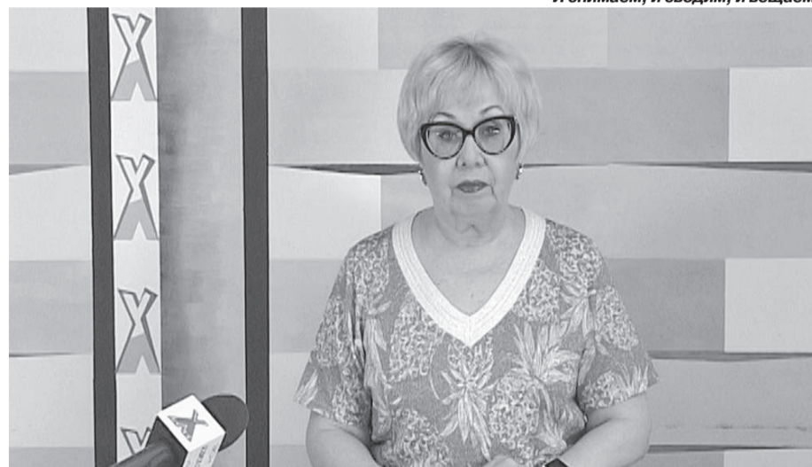
Лицо и голос эвенкийского телевидения

ли? Имеются ли в компании цифры эксклюзивного контента?