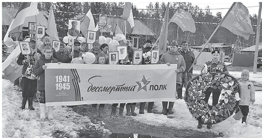
Жители Юкты с портретами дедов и прадедов прошли по улицам села