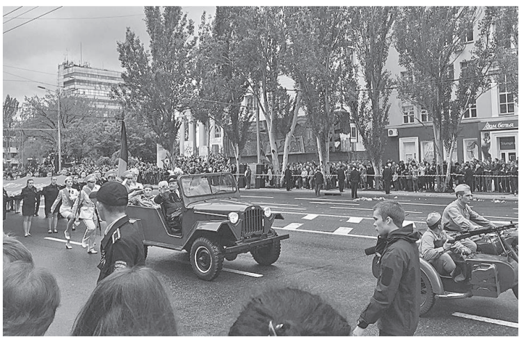
Всем - мирного неба над головой!

Татьяна ВЛАСЕНКО г. Донецк