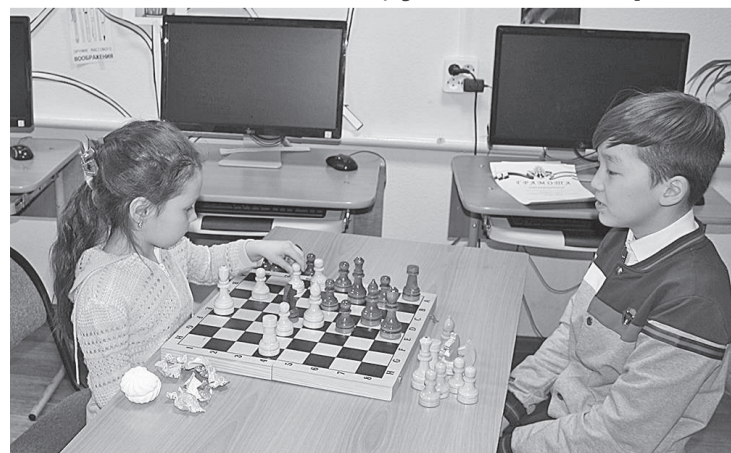
Все ребята добились высоких результатов