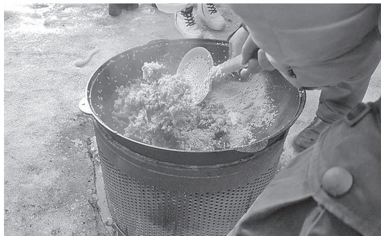
Блюда участников кулинарного состязания получились разными, у каждого был свой рецепт