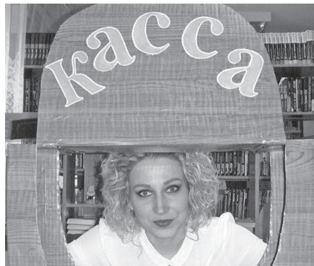
Каждый желающий мог попробовать себя в роли актера

Библиотека превратилась в храм Мельпомены, и темой акции стало «Весь мир – театр».