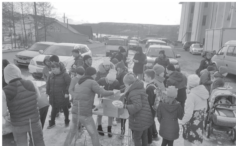
На фестивале плова голодных не осталось!

В день проведения в райцентре турнира по вольной борьбе им. В. Смелякова на площади у районного культурно-досугового центра был организован первый фестиваль плова.