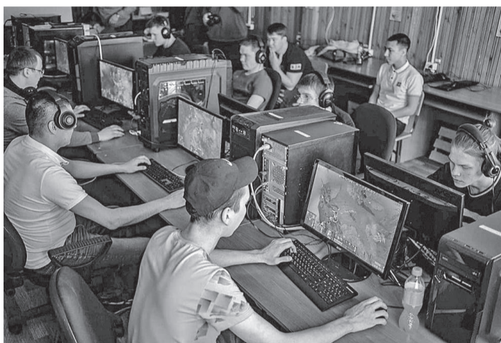
Напряженные матчи длились два дня

В нашем поселке Тура впервые прошел официальный киберспортивный турнир «Кибер Тура». Турнир состоялся в дисциплине «Dota 2».