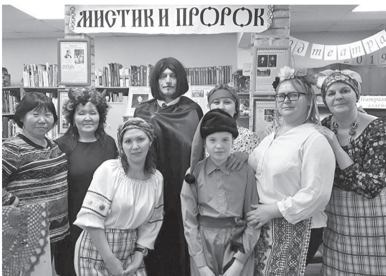
Ночь Н.В. Гоголя

Библионочь объединила людей всех возрастов, позволив взглянуть на библиотеку другими глазами.