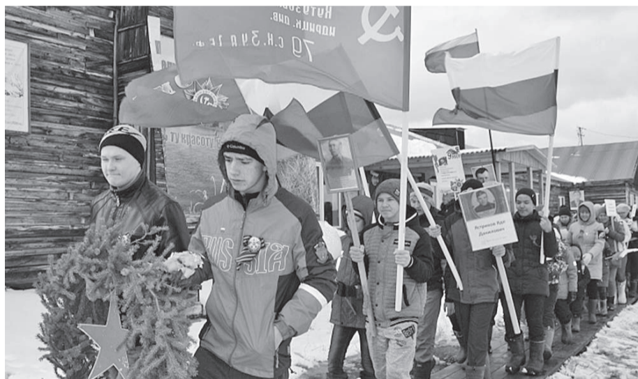
Молодежь п. Стрелка-Чуны почтила память фронтовиков