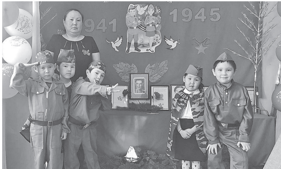
Воспитанники детсада «Чипкан» показали театрализованное действие на военную тематику