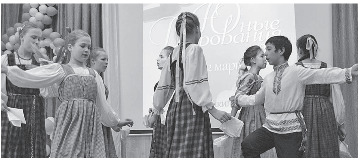
Фольклорный ансамбль «Сударушка» (диплом I степени)