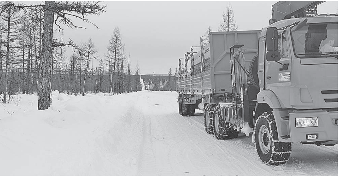
Несмотря на сложные погодные условия, в поселки Эвенкии завезено все необходимое

В Эвенкии завершается сезон автозимников. Соответствующие постановления о прекращении эксплуатации большинства временных дорог подписаны администрацией ЭМР. В этом году зимники закрываются примерно в те же сроки, что и обычно.