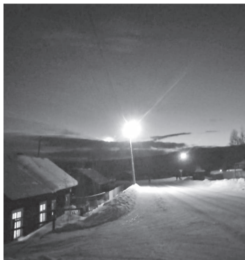
Неизвестный космический объект