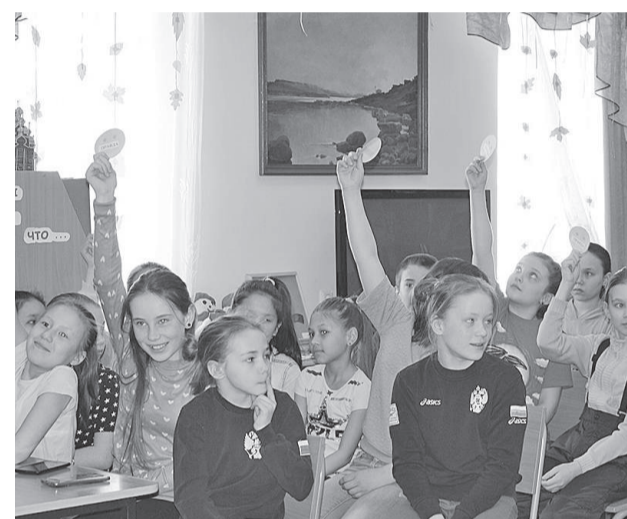
Все выступления были яркими, эмоциональными и очень понравились слушателям