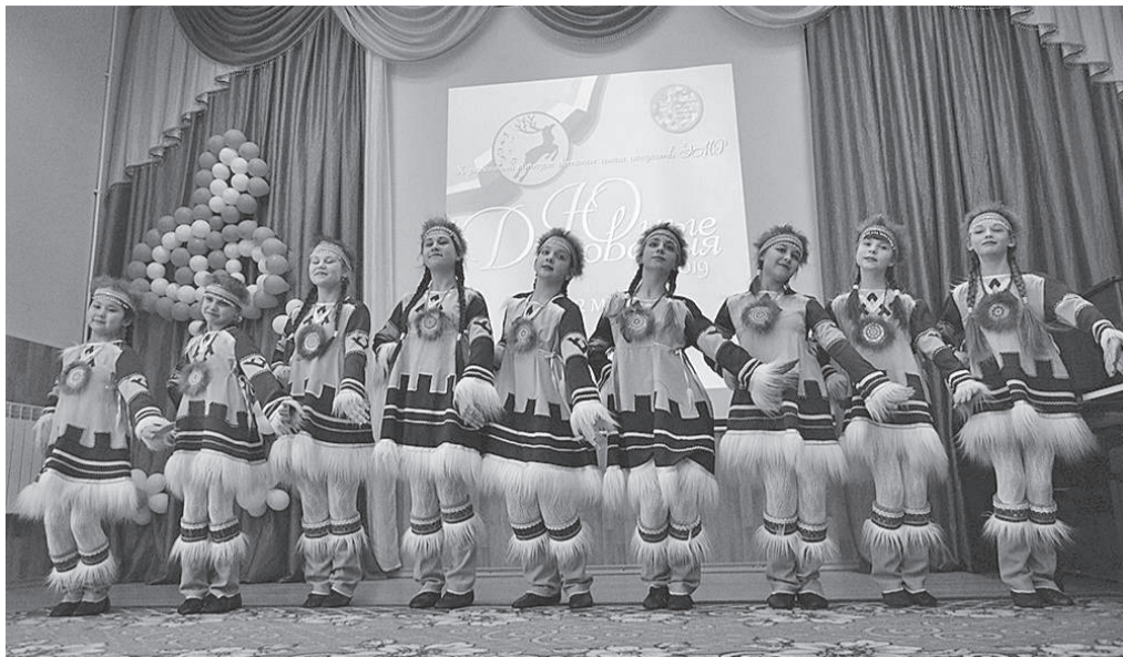
Вокально-хоровой ансамбль «Цветные капельки» (диплом I степени)

Чрезмерно кропотлив, тонок и, в какой-то степени, педантичен труд учителя музыки. Именно он вводит детей в мир прекрасного, знакомит учеников с красочным колоритом музыки и чарующими волшебными звуками. И в этом мире душа ребенка соперничает, трепещет, поет, становится духовно наполненной.