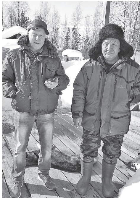
Научные сотрудники, прибывшие для исследования упавшего космического объекта, в суровых «таежных полях» Эвенкии

Журналисты газеты «ЭЖ» пообщались с исследователями сразу же после их возвращения из «таежных полей». Ответы на вопросы «Это метеорит?», «Как он выглядит?» и «Где его искать?» - в интервью с представителями науки.