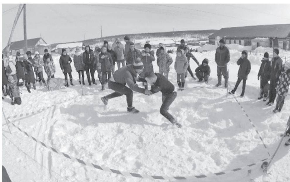
Победители получили достойные призы - бензопилы, спиннинги, планшеты и смартфоны

По древней традиции и в соответствии с годовым циклом эвенков суглан (родовое собрание) обычно проводится в период окончания зимнего и начала весеннего этапа производственного годовичного цикла технологии содержания домашнего северного оленя.