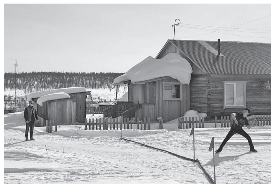
В ходе празднования Дня оленевода прошли соревнования по национальным видам спорта