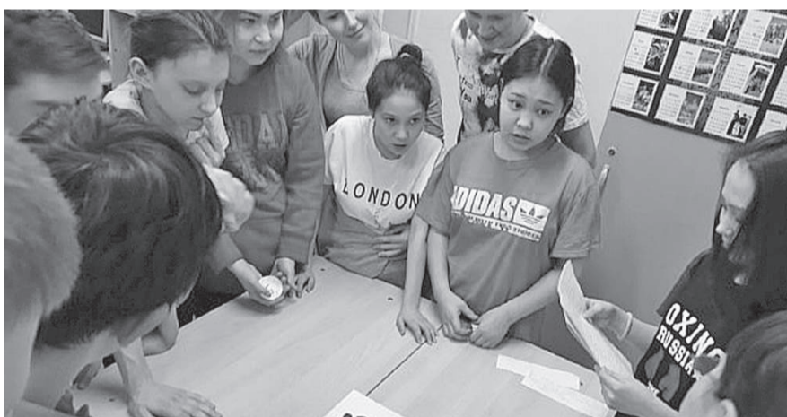
Байкиттыл кунгакар омактат методикат гэрбивчэт алагувдяра