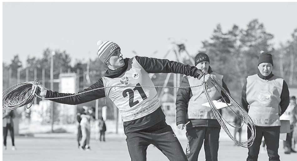
Эвенкийские спортсмены в составе краевой сборной показали превосходные результаты

В Якутске состоялся чемпионат России по северному многоборью. В соревнованиях приняли участие 164 спортсмена из девяти регионов России, в том числе из Красноярского края и Эвенкии.