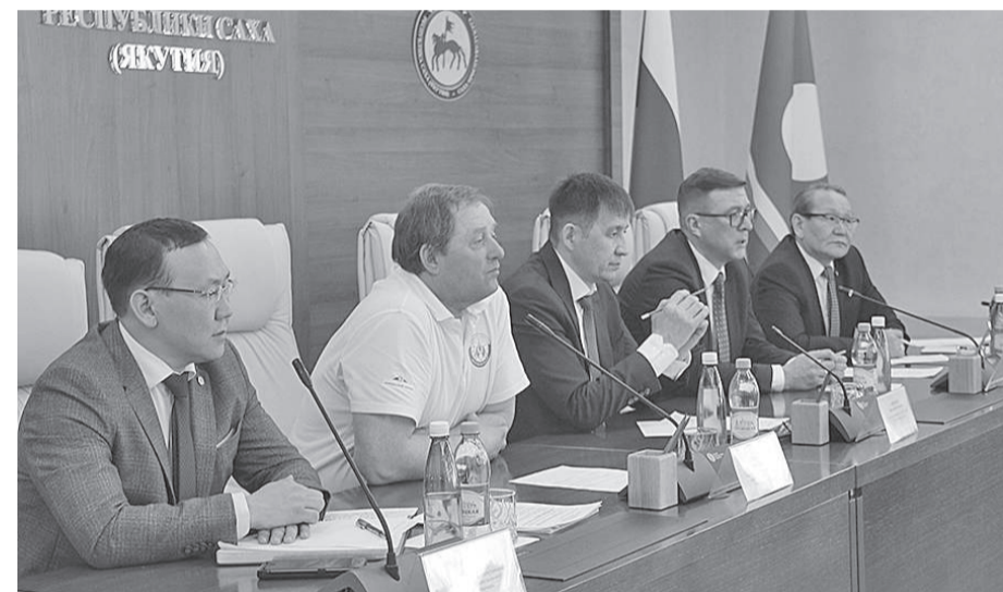
Расширенное заседание федерации северного многоборья России: намечены планы по развитию этого вида спорта