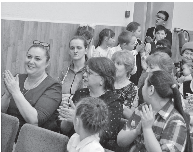
Гости и участники отметили хорошую организацию конкурса