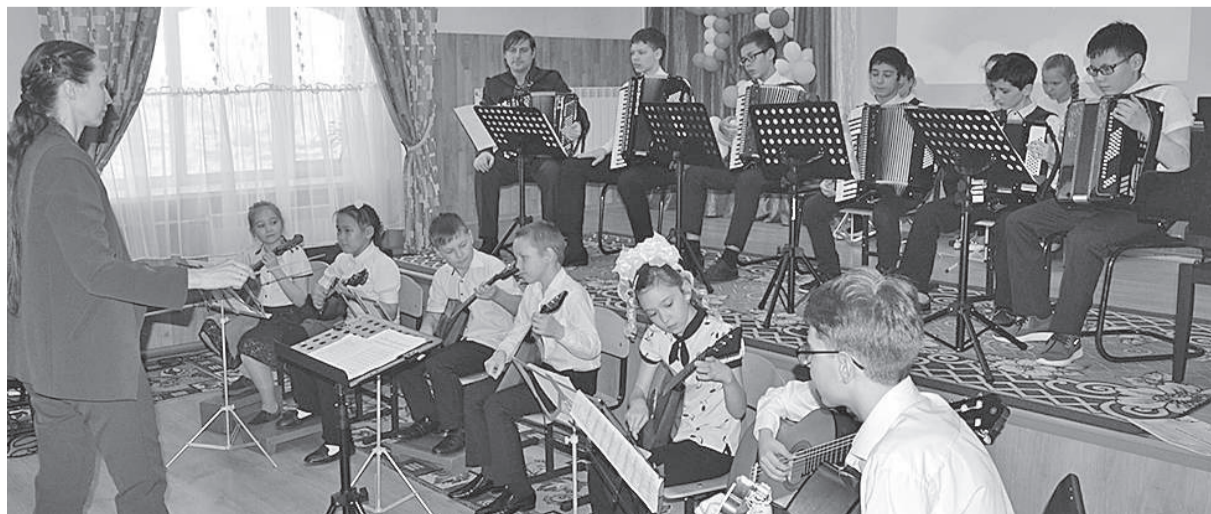
Лауреат I степени и обладатель Гран-при оркестр «Веселые ребята»