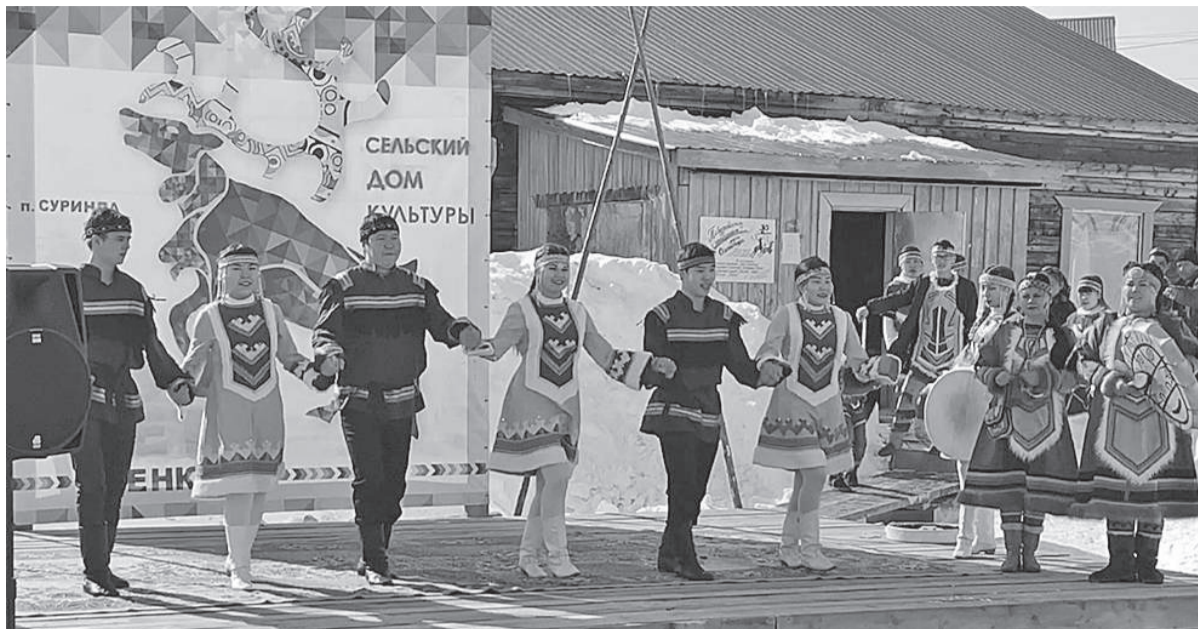
Артисты Байкитского Дома культуры порадовали суриндинцев интересной музыкальной программой

В п. Суринда прошли традиционные мероприятия, посвященные весеннему празднику Дню оленевода и 45-летию образования оленеводческо-племенного хозяйства «Суриндинский».