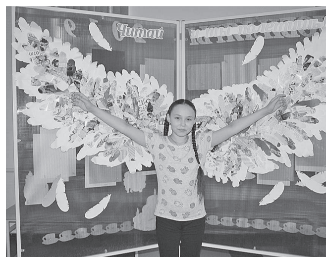
Большой отклик у гостей вызвал стенд «Читай, и ты полетишь!»

Время вновь отпраздновать «Книжкины именины». Неделя детской книги – это большой праздник! Праздник всех, кто с ней связан – писателей, читателей, издателей, художников-иллюстраторов, библиотекарей. Неделя детской книги стала достоянием нашей страны и проходит в каждом городе. Вот уже много лет она является главным праздником детского чтения.