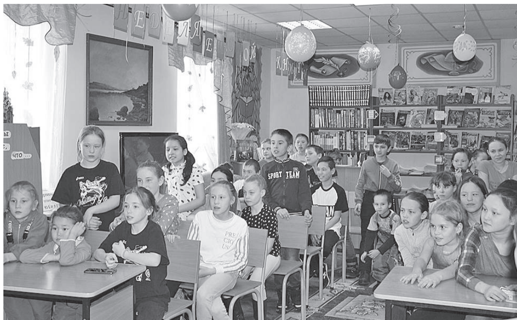
Вот и пришло время отпраздновать «Книжкины именины»

Открытие Недели детской книги в п. Тура традиционно прошло в ЭРКДЦ театрализованном шоу «Книги по свету гуляют». Перед концертом всем любителям чтения коллектив детской библиотеки предложил поучаствовать в викторине «Юбилейное ожерелье», а также представил выставку работ литературно-творческого конкурса «По страницам крыловских басен».