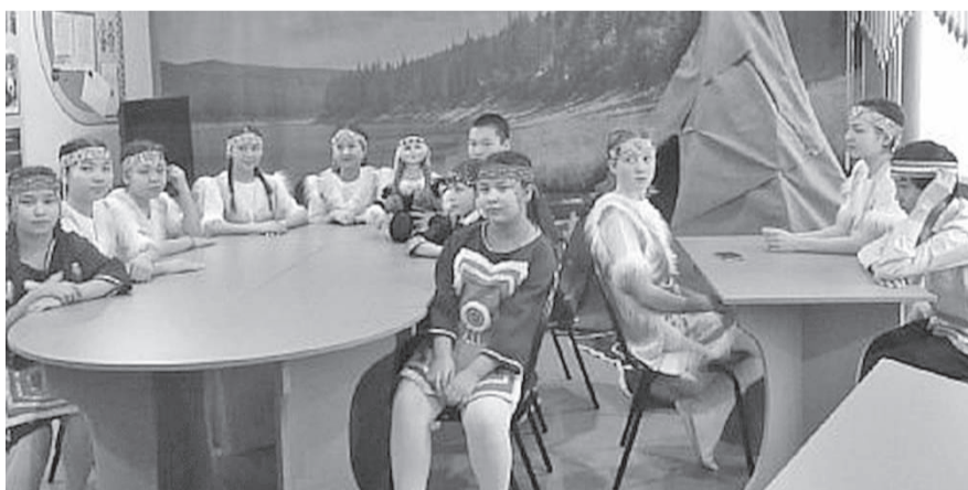
Кунгакар алагумнивал аямамат долчатчара