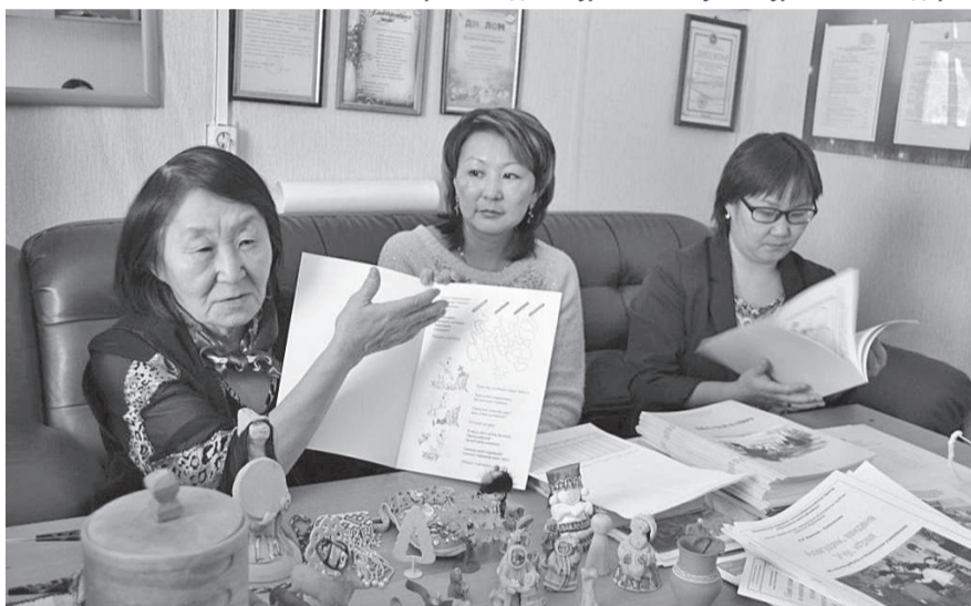
МКУ ДПО ЭПЦ методисталин хавадувар