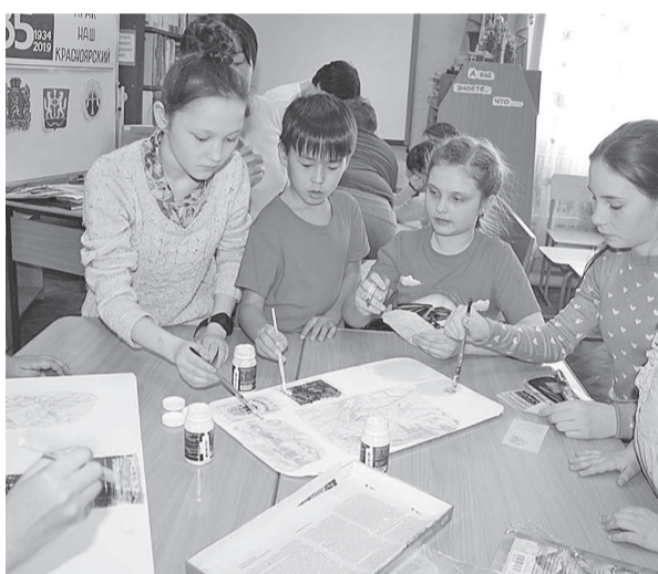
Увлекательные и динамичные игры