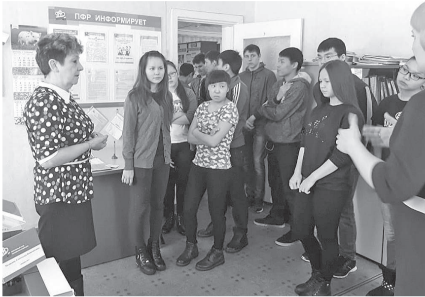
Гости Пенсионного фонда - ребята из Ванаварского детского дома

Клиентская служба (на правах группы) в с.п. Ванавара ГУ-УПФ РФ в ЭМР Красноярского края в процессе работы уделяет большое внимание вопросу ликвидации пенсионной безграмотности населения.