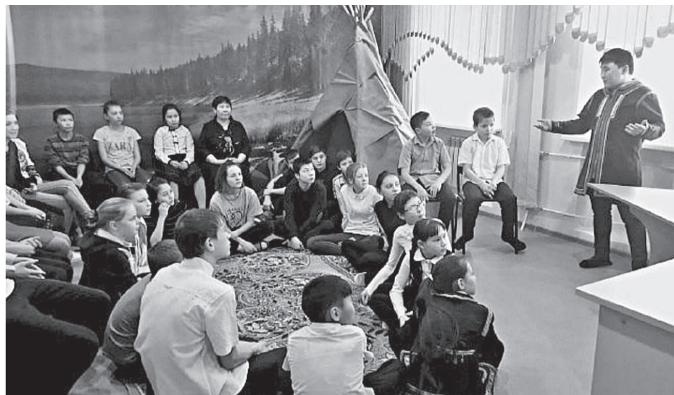
Модернизация системы образования затрагивает изменения и в стиле преподавания эвенкийского языка

В системе образования в последние годы происходят серьезные изменения: модернизируются программы, внедряются новые принципы обучения. Основная цель всех этих перемен – сделать так, чтобы Россия вошла в число 10 ведущих стран мира по качеству общего образования.