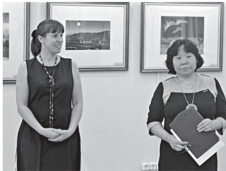
На открытии посетители узнали много нового из творческой биографии В.И. Мешкова