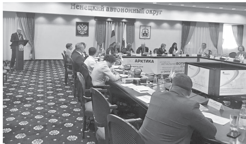
ВСНК презентовала в Ненецком округе грантовую программу по поддержке исследований, имеющих прикладное значение для Эвенкии

Также в рамках форума недропользователи рассказали о комплексе природоохранных мероприятий, реализуемых в Арктической зоне, о результатах наблюдений за морскими млекопитающими на лицензионных участках в Карском море, об экологической безопасности при выполнении геологоразведочных работ и о сохранении арктического биоразнообразия при осуществлении хозяйственной деятельности в условиях Крайнего Севера. Российские и зарубежные ученые выступили с докладами об оценке состояния экосистем Баренцева моря, о результатах многолетнего экологического мониторинга Печорского моря и о микробном препарате для очистки