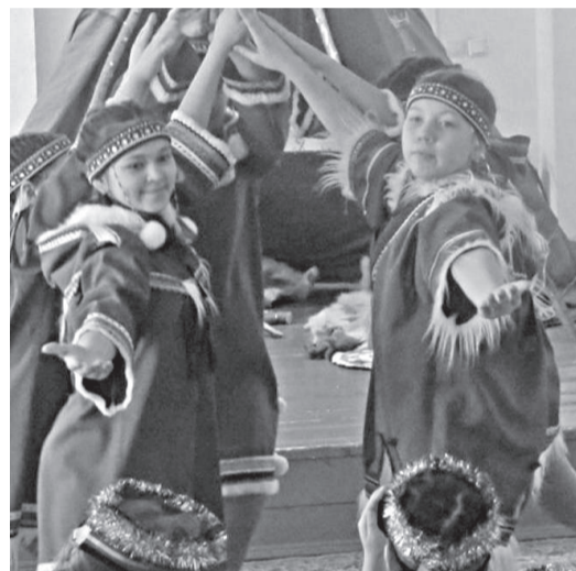
Теперь учащиеся не просто слушатели, а активные участники образовательного процесса. Родители отмечают – дети стали лучше излагать свои мысли

В рамках национального проекта «Образование» идет реализация девяти федеральных проектов, один из них – «Учитель будущего». До 2024 года по всей стране будет введена система аттестации школьных директоров, педагогов и психологов. Оценивать учителей будут не с целью «найти и наказать», а прежде всего, чтобы понять, как повысить качество преподавания в школах. Для этого и нужно получить объективные данные: как педагоги знают свой предмет, могут ли мотивировать ученика или, к примеру, выстроить индивидуальную образовательную траекторию. В ходе реализации проекта «Учитель будущего» не менее половины педагогов должны пройти переподготовку.