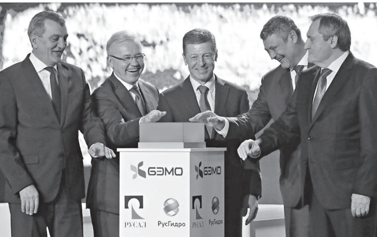
На форуме состоялся запуск второй очереди Богучанского алюминиевого завода, входящего в кластер Нижнего Приангарья

Красноярский экономический форум-2019, проходивший в этом году в формате Российского саммита конкурентоспособности, завершил свою работу.