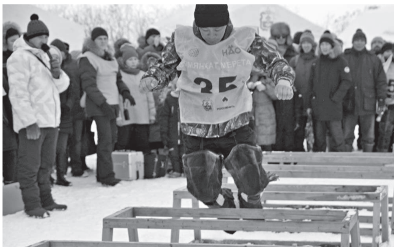
Традиционные состязания оленеводов Ненецкого округа «Сямяхат Мерета», что в переводе с ненецкого означает «Самый Быстрый»

ученых и нефтяников, поможет оценить реальное состояние всей популяции северного оленя - ключевого биологического ресурса российской Арктики.