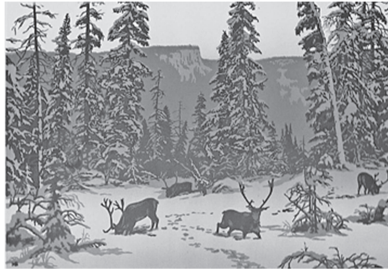
«В эвенкийской тайге»