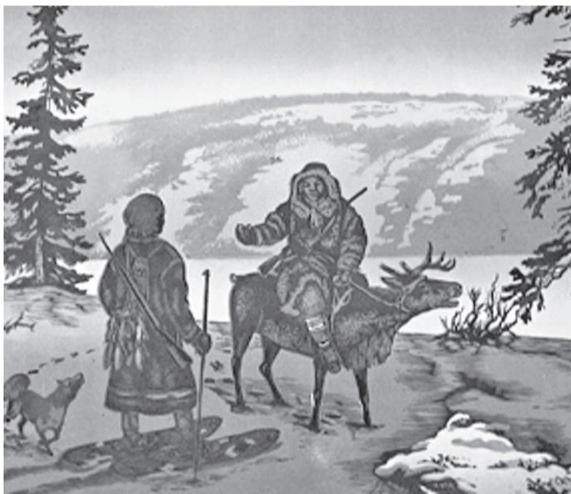
«Встреча на промысле»