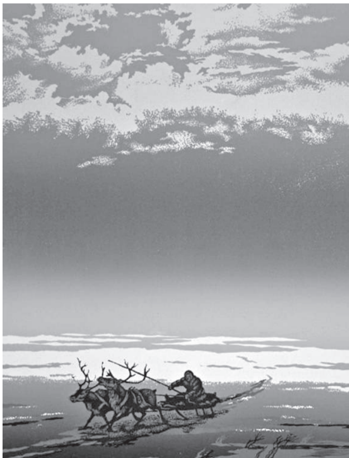
«К далекому другу»

Открытие выставочного зала стало возможным благодаря участию в краевом конкурсе на реализацию социокультурных проектов учреждениями культуры. В начале 2018 года наш проект «Певец Севера» был признан одним из победителей, и музеем из краевого бюджета предоставлена субсидия в размере более трехсот двадцати тысяч рублей.