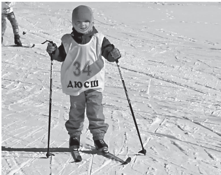
Вперед за победой!

Уже второй год подряд в с. Ванавара по инициативе коллектива Детско-юношеской спортивной школы и администрации села проводится всеобщий праздник здоровья под названием «Первенство села Ванавара по лыжным гонкам».