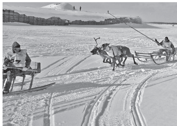
День оленевода собрал в этом году рекордное количество участников - более 70 оленеводов

акватории и прибрежной зоны арктических морей от разливов нефти и нефтепродуктов в условиях отрицательных температур в ледовой обстановке.