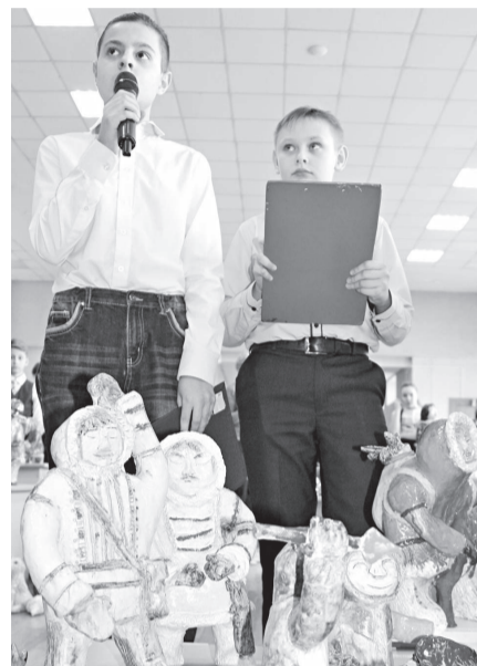
Школьники презентуют свои работы

В Красноярском краевом Дворце пионеров был реализован масштабный проект студии керамики, посвященный изучению культурных традиций коренных народов Сибири, «Северное сияние».