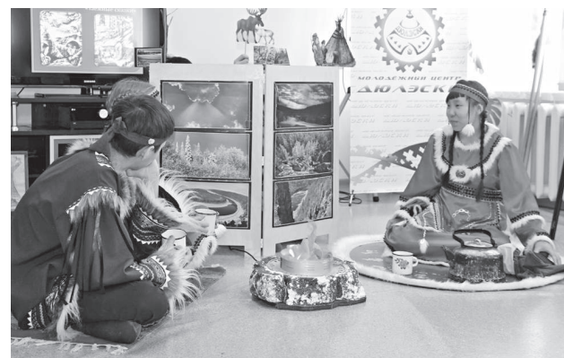
Ребята из «Сивэкэ» обыграли сказку «Олень и Лось»