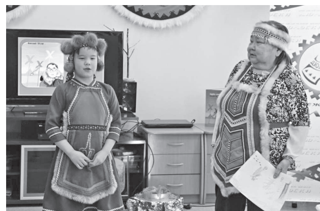
На сцене - гости праздника из п. Стрелка-Чуны