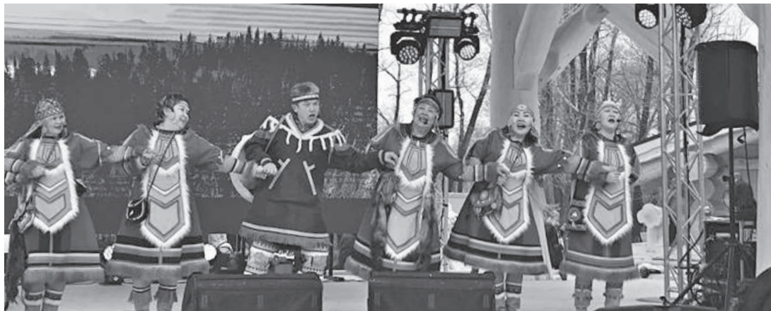
Национальный эвенкийский колорит всегда интересен на любых форумах

Полный новых и счастливых впечатлений вернулся с Зимней универсиады ансамбль. Коллектив выступал на разных площадках: в этнодеревне, у эвенкийского стойбища, и на каждой из них зрители тепло приветствовали участников.