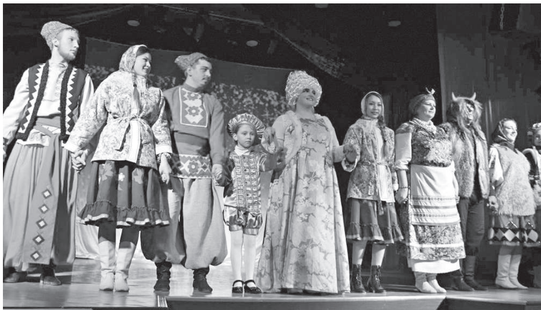
Финал спектакля «Вечера на хуторе близ Диканьки»