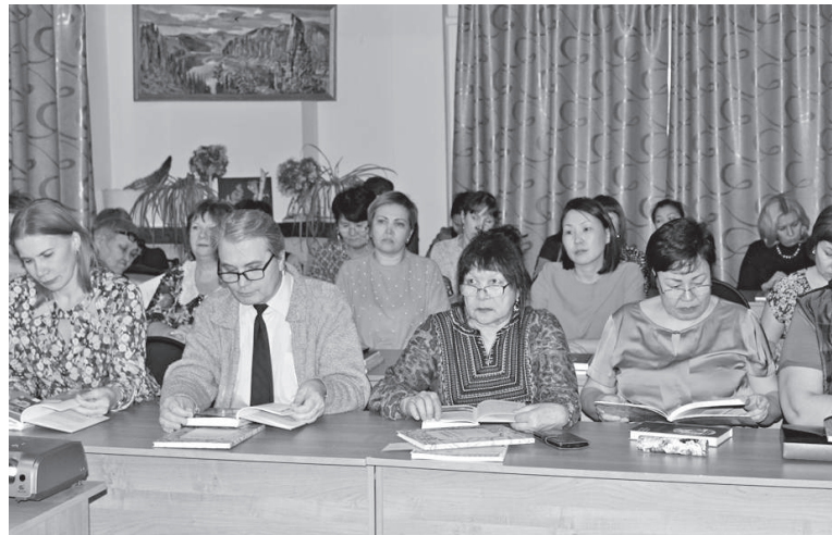
Матал омакталва книгалва ичэтчэрэ