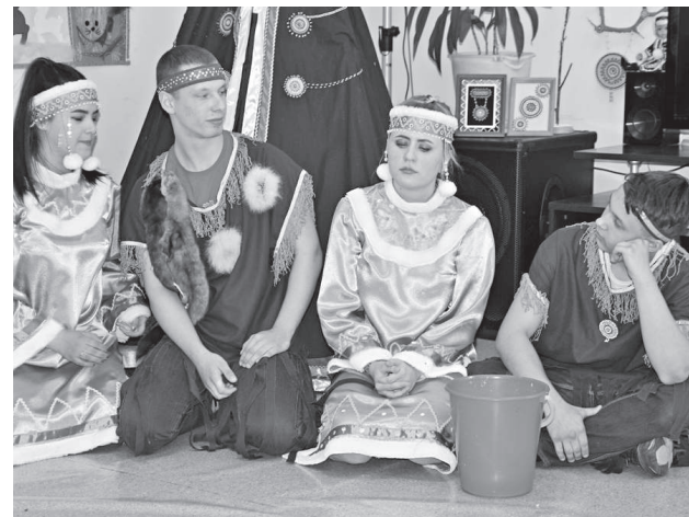
Команда «Юктудял» инсценирует эвенкийскую сказку «Женихи»