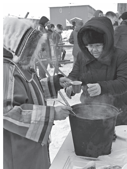
Согревающие блюда северной кухни