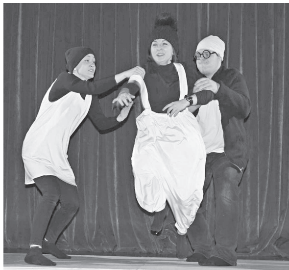
Сцена из спектакля «Ковчег»

председатель Эвенкийского районного Совета депутатов