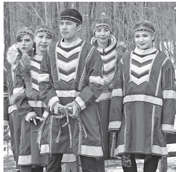
Студенты чтят национальные традиции

В Туринском многопрофильном техникуме прошло празднование Дня оленевода. Обстановка, наполненная ароматами вкуснейших блюд, смехом и эмоциями от развлекательной программы на свежем воздухе, пришлась по душе каждому из присутствующих на празднике.