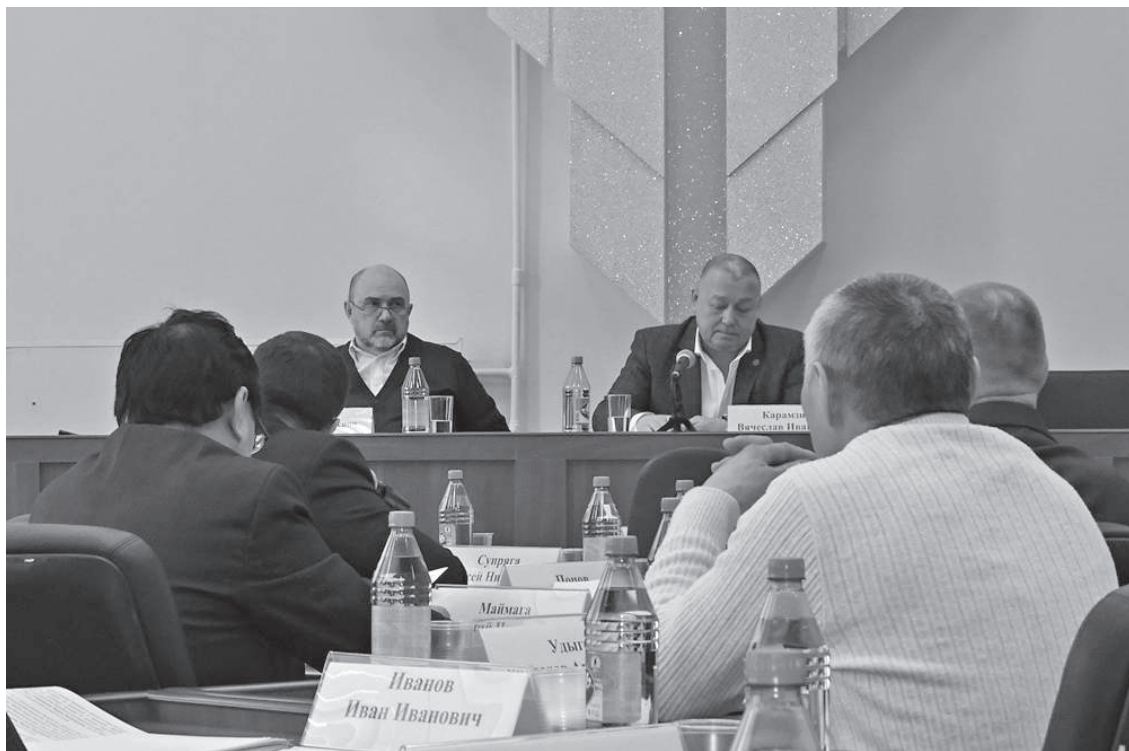
Депутаты обратились к Р.В. Кармазиной с инициативой внести правки в закон, касающийся вопроса жизнеобеспечения Севера

На сессии народные избранники вышли с обращением к депутату Госдумы РФ Р.В. Кармазиной о содействии внесения поправок в федеральный закон «О закупках товаров, работ, услуг отдельными видами юридических лиц». Отметим, подобный зако-