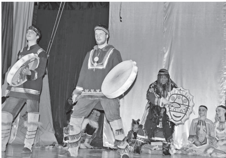
Сцена из спектакля «Северная сказка»

Год театра преподносит жителям Эвенкии новые приятные сюрпризы. В частности, в рамках объявленного Указом Президента Российской Федерации «О проведении в Российской Федерации Года театра» по инициативе управления культуры администрации Эвенкийского муниципального района в с. Ванава прошел первый районный фестиваль любительского театрального творчества «Театральный аргиш».