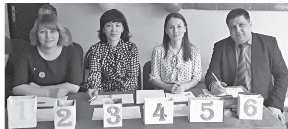
Беспристрастное, представительное жюри

Шести участницам конкурса, девочкам в возрасте от 12 до 15 лет, предстояло выполнить творческие задания, в ходе которых нужно было убедить жюри и односельчан в своей исключительности и доказать право претендовать на титул главной красоты поселка. Несмотря на свой юный возраст, девочки с удовольствием и достоинством демонстрировали свои таланты. Казалось, участницы конкурса совсем не волнуются, настолько уверенными были их выступления. Зато родители, бабушки, дедушки и все зрители переживали не на шутку!