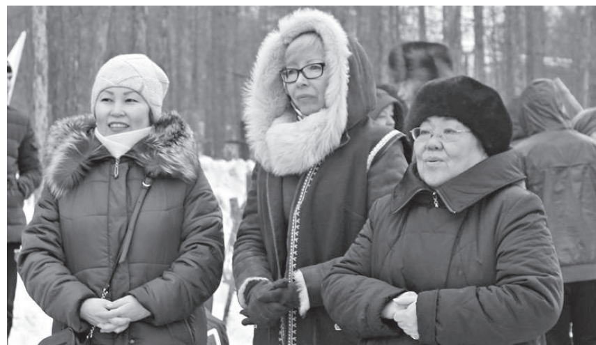
На праздник пришло много гостей

Пришедшие на народное гуляние с большим удовольствием принимали участие в спортивных состязаниях и веселых забавах, угощались национальной кухней – в общем, замечательно проводили время.