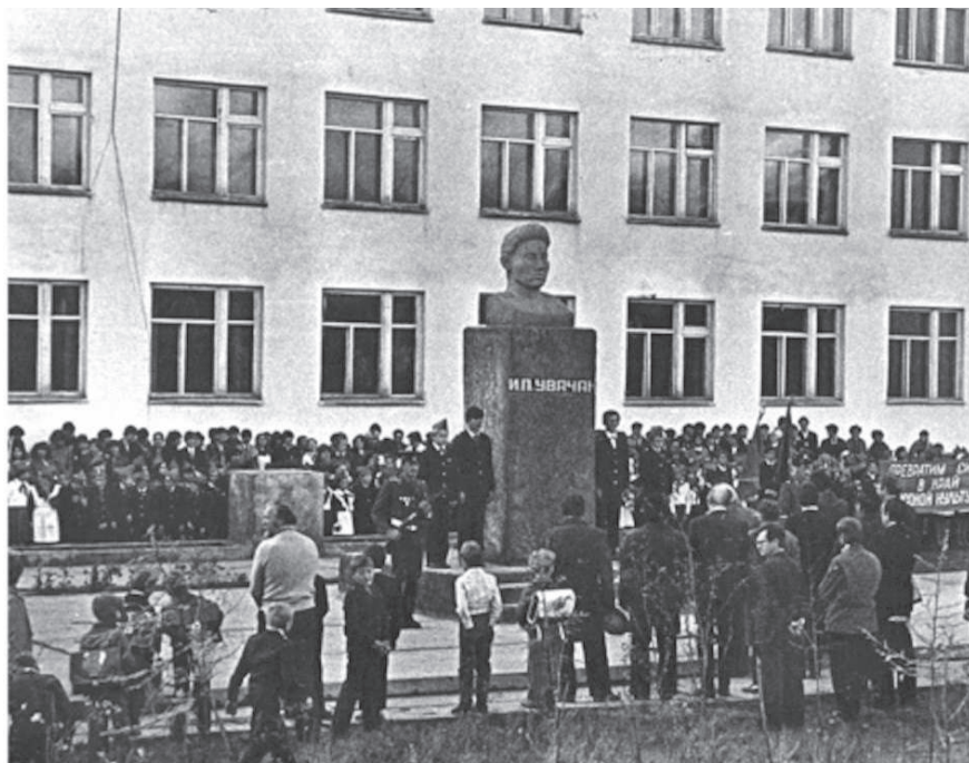
В Эвенкии помнят и чтят подвиг земляка: учреждения культуры и образования проводят мероприятия в память о Герое