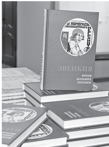
Книгал «Эвенкия. Хэгдылин хунгтупилин»