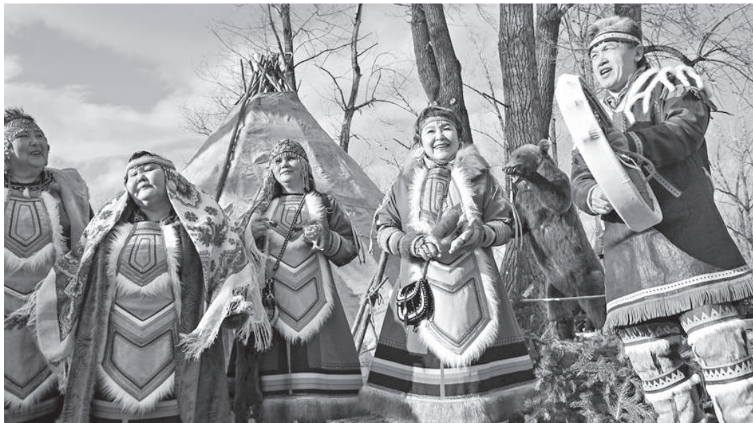
Эмоции от выступлений на Универсиаде переполняют артистов «Тогокона» и по сей день

Как мы рассказывали, Эвенкия с размахом представила на Студенческих играх свою национальную культуру. Сегодня хочется отметить народный ансамбль эвенкийской песни «Тогокон», который выступил на разных площадках Универсиады-2019. Под мелодичные песни с красивым обрядом гостеприимства в эвенкийском стойбище артисты принимали гостей. График выступлений был очень насыщенным.