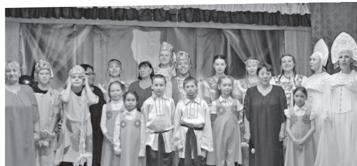
Дарим радость односельчанам!

Поселок Стрелка-Чуня - не просто эвенкийское поселение. Когда-то в период образования Эвенкийского национального округа именно в нем располагался центр Тунгусско-Чунского района. Целых пять лет, вплоть до 1935 года, в Стрелке-Чуне находились основные административные здания, была построена первая больница. Наверное, еще с тех далеких времен в поселке сохранился дух созидания и культуры.