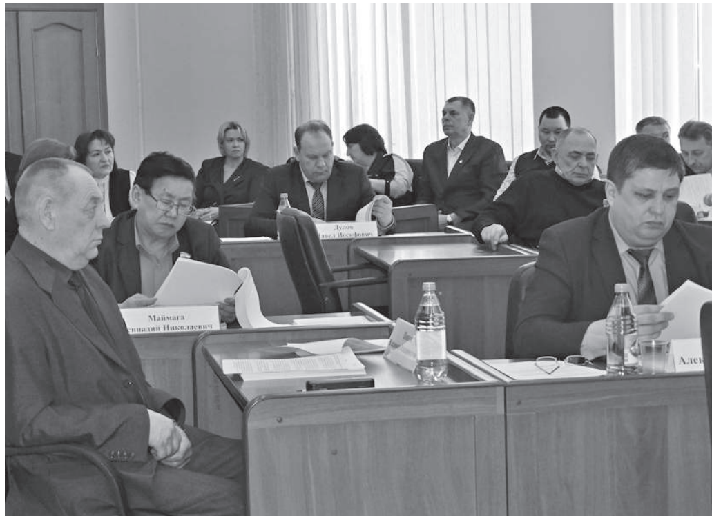
Администрация ЭМР доложила об итогах завоза нефтепродуктов, подготовке к весенне-летней навигации, строительных планах на текущий год, реализации перехода района на цифровое телевидение

нопроект уже находится на рассмотрении российских парламентариев - депутаты Самарской Губернской Думы инициировали законодательную инициативу о внесении поправки в части отмены предельного срока оплаты обязательств по договорам для субъектов крупного бизнеса. В действующей редакции закона, оплата должна быть произведена в 30-дневный период с даты подписания заказчиком документа о приемке товара (выполнении работы, оказании услуги). В свою очередь, эвенкийские депутаты в обращении просят отмену такого срока для всех хозяйствующих субъектов, осуществляющих свою деятельность в районах Крайнего Севера.