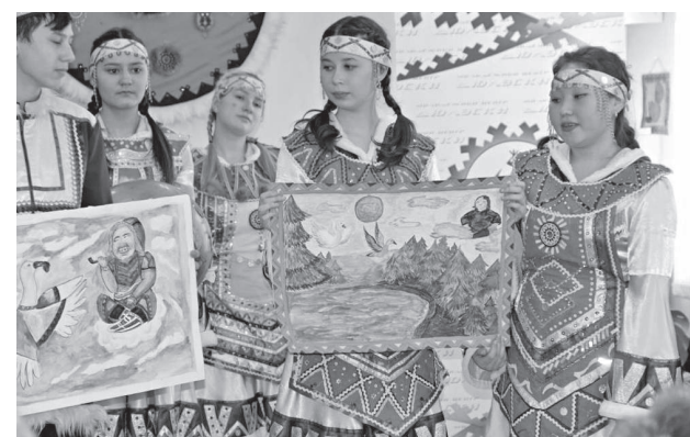
Четвертый этап конкурса - «Я рисую сказку»