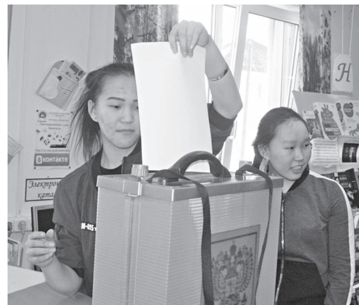
Учимся правильно голосовать

Ежегодно в третье воскресенье февраля в России проводится важное масштабное мероприятие по повышению правовой культуры юношества - День молодого избирателя. В текущем году избирательные кампании пройдут в 10 населенных пунктах Эвенкии. К этому событию, 27 февраля, в Центральной библиотеке п. Тура, в Центре деловой и правовой информации библиотекари совместно с секретарем Избирательной комиссии ЭМР провели правовой урок с элементами ролевой игры «Легко ли стать избирателем?».