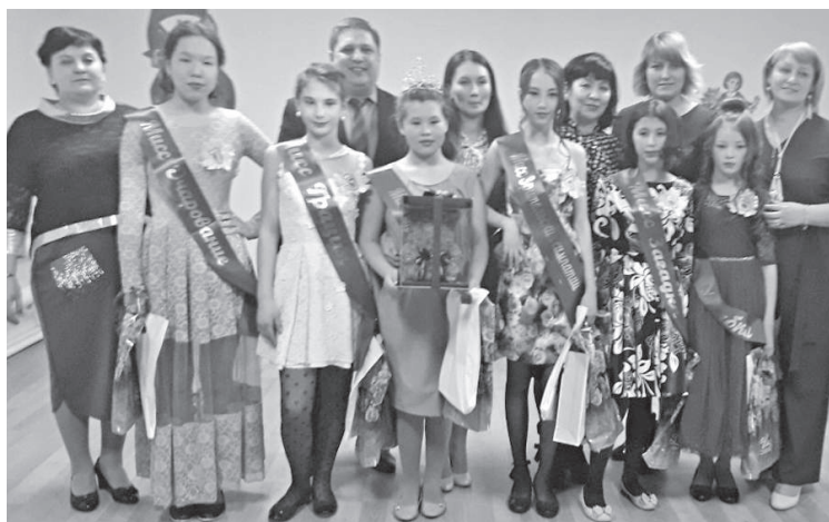
Нидымчанки убедили жюри в своей исключительности

В п. Нидым в местном доме культуры состоялся конкурс «Мисс Нидымчанка-2019». Это интересное и зрелищное состязание среди юных жительниц поселка не оставило равнодушным ни одного зрителя, присутствовавшего в зале в этот день.