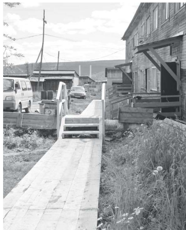
Постепенно во всех дворах п. Тура будут заменены тротуары

В разгаре жаркая и короткая пора летнего благоустройства поселков. В эвенкийской столице, можно сказать, работа кипит. Масштабы работ большие, планы - смелые, но вполне реальные.