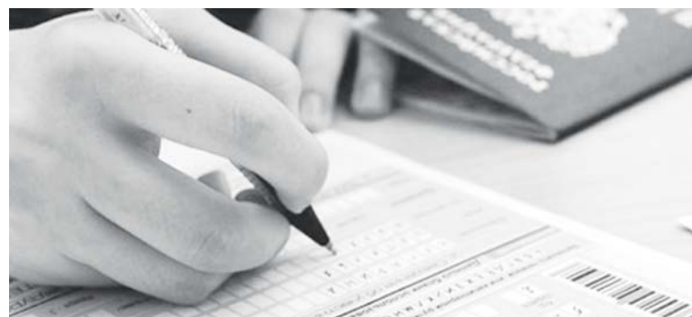
В этом году результаты ЕГЭ выше, чем в прошлом

Экзаменационный период вчерашними школьниками пройден, но свободно «выдохнуть» еще не время, ведь впереди - подача документов и поступление в вузы и ссузы. О том, какие результаты по ЕГЭ показали выпускники Эвенкии, читайте в нашем материале.