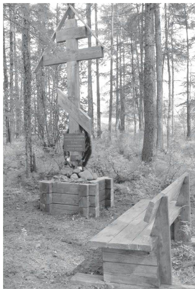
Поклонный крест на старом кладбище п. Тура

В рамках благоустройства заключен контракт с МП ЭМР «Илимпейские электросети» на установку уличного освещения на дорогах и во дворах. Выполнены