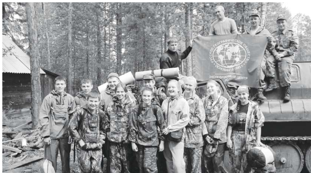
Юные участники взрослой экспедиции

Коллектив государственного природоохранного заповедника «Тунгусский» в течение многих лет ведет постоянную работу по экологическому воспитанию с учениками Ванаварской средней общеобразовательной школы. Ее цель - заложить в души ребят любовь к родной земле, бережное и грамотное отношение к природе, дать базовые знания о крае, в котором они живут.