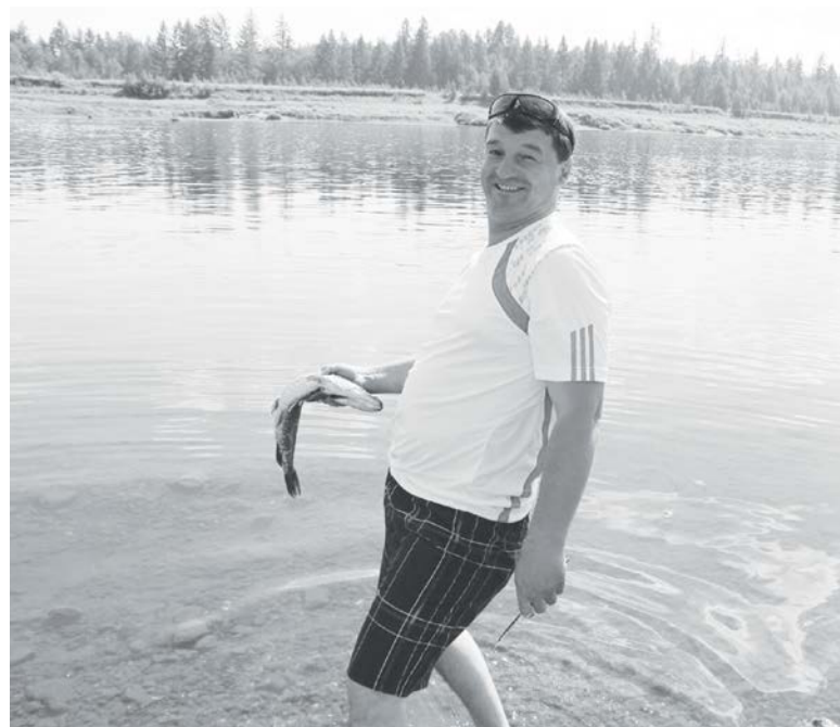
Рыбалка - это не занятие, это философия

Рыбалка! Что может больше волновать человека, для которого это занятие даже не хобби, а непреодолимая потребность, страсть, что-то подобное инстинкту! Зимой и летом на реке обязательно присутствуют рыбаки: покусанные комарами и мошкой, а в холодное время заледеневшие от ветра и морозца около своих лунок, но упорно не теряющие надежду на ту самую-самую чудо-рыбу, которая рано или поздно обязательно должна попасть на крючок.