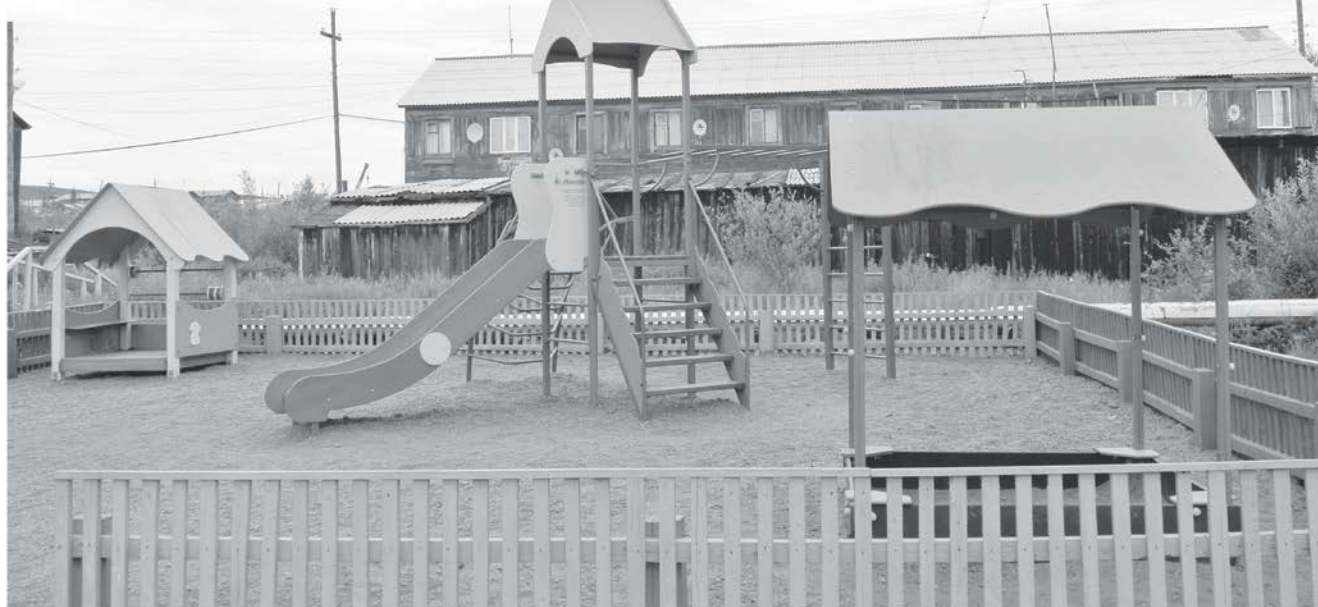
Этим летом планируется масштабная установка и дооборудование детских площадок

ного бюджета и частично за счет местного. Кроме того, мы вступили в федеральную программу, да и депутаты Туринского поссовета пришли к выводу, что дороже отремонтировать один аварийный дом, чем построить два новых. Поднимать вопрос о возможности купить квартиры в новых домах пока рано, в первую очередь идет решение вопроса по переселению из ветхого и аварийного жилья».