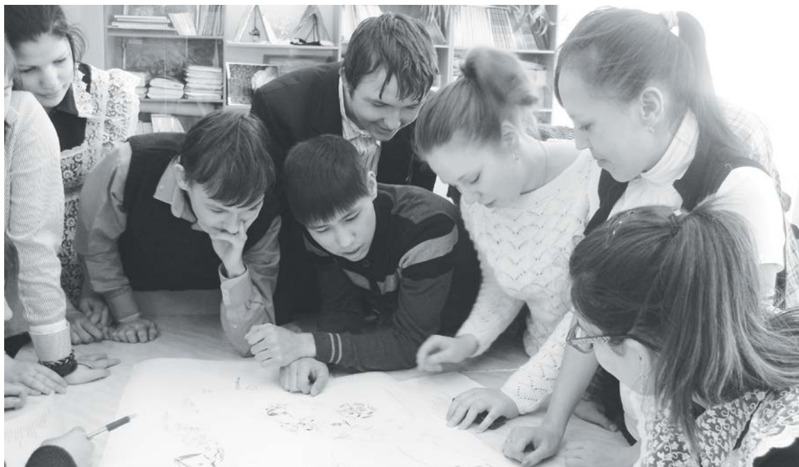
На начало 2015 года профориентационные мероприятия прошли во всех школах Эвенкийского района

Для развития профориентационной компетенции старшеклассников, приобретения учащимися социального опыта в общеобразовательных школах района проводились классные часы и встречи с представителями различных профессий, диспуты. Важной составляющей профориентационной работы стал «Фестиваль профессий», который состоялся в марте текущего года в Туринской средней общеобразовательной школе. В рамках фестиваля была организована презентация учебных заведений Эвенкийского муниципального района - КГБПОУ «Эвенкийский многопрофильный техникум» и КГБОУ СПО