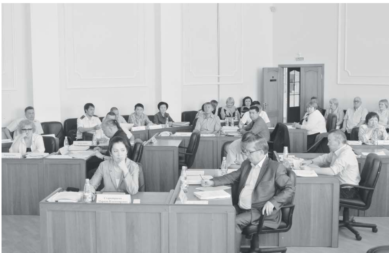
На сессии внесены важные поправки в Устав района