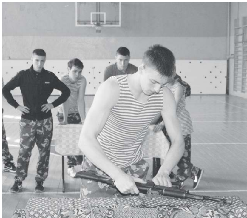
Соревнование «Огневой рубеж» - неполная разборка АК-47

В райцентре с успехом прошла традиционная районная военно-спортивная игра «Победа». В соревнованиях на ловкость и военную подготовку участвовали ученики средних общеобразовательных школ Туры, Байкита и Ванавары.