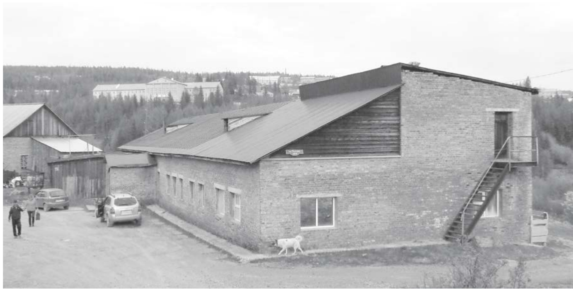
Модернизация оборудования бани позволит экономить сельскому бюджету до 300 тыс. рублей ежемесячно

...и как много нужно успеть сделать коммунальщикам и строителям! В Байките уже приступили к ремонтным работам. Большая часть ремонтируемых объектов будет сдана в эксплуатацию в обновленном виде уже в августе. Подробнее читайте в нашем материале.