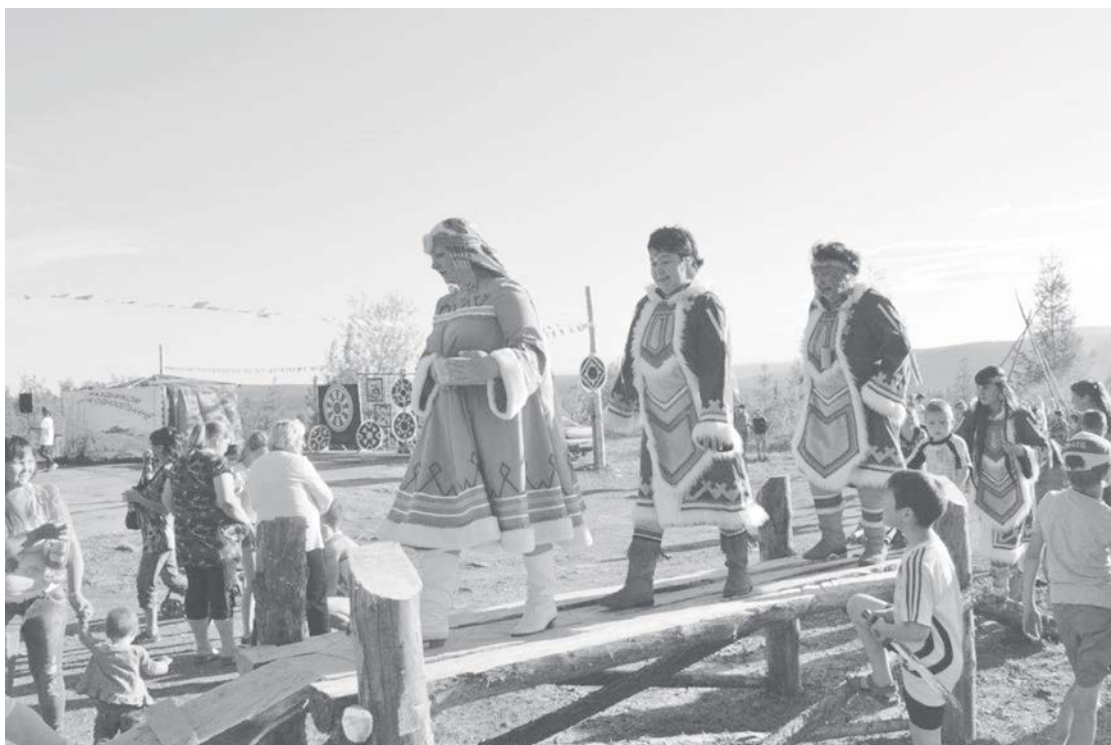
Обряд очищения прошли почти все жители села