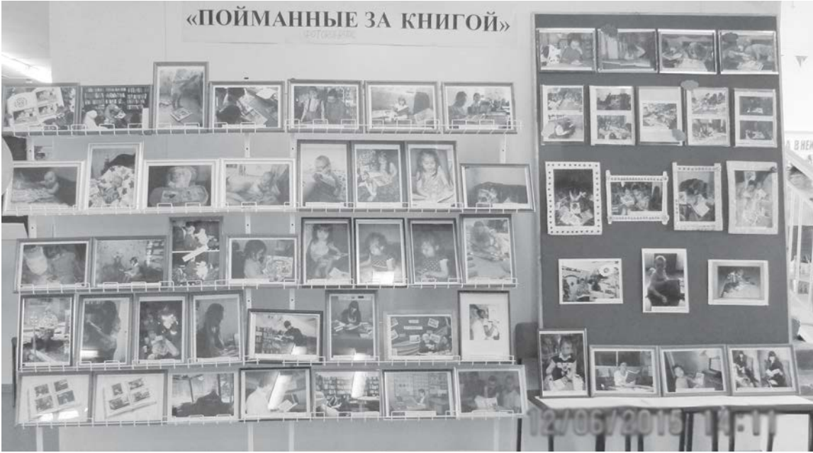
Фотовыставка из работ конкурса «Пойманные за книгой»