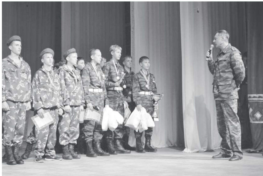
В военно-спортивной игре «Победа» проигравших нет