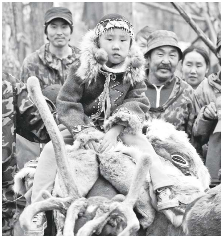
Ороово этэечимнилду 25,3 млн. руб. район бурэн

Илимпийскайду группадуг 14 снегоходылва ипкэчэтын: Туру бултамнилдун – 2, Эконда бул-