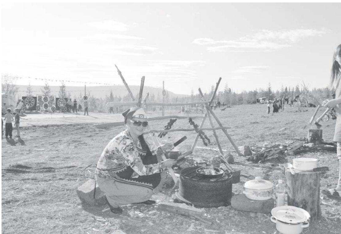
В Байките Мучун уже стал доброй традицией