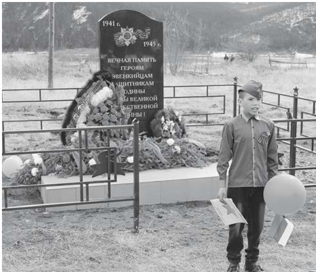
На открытии памятника воевавшим землякам