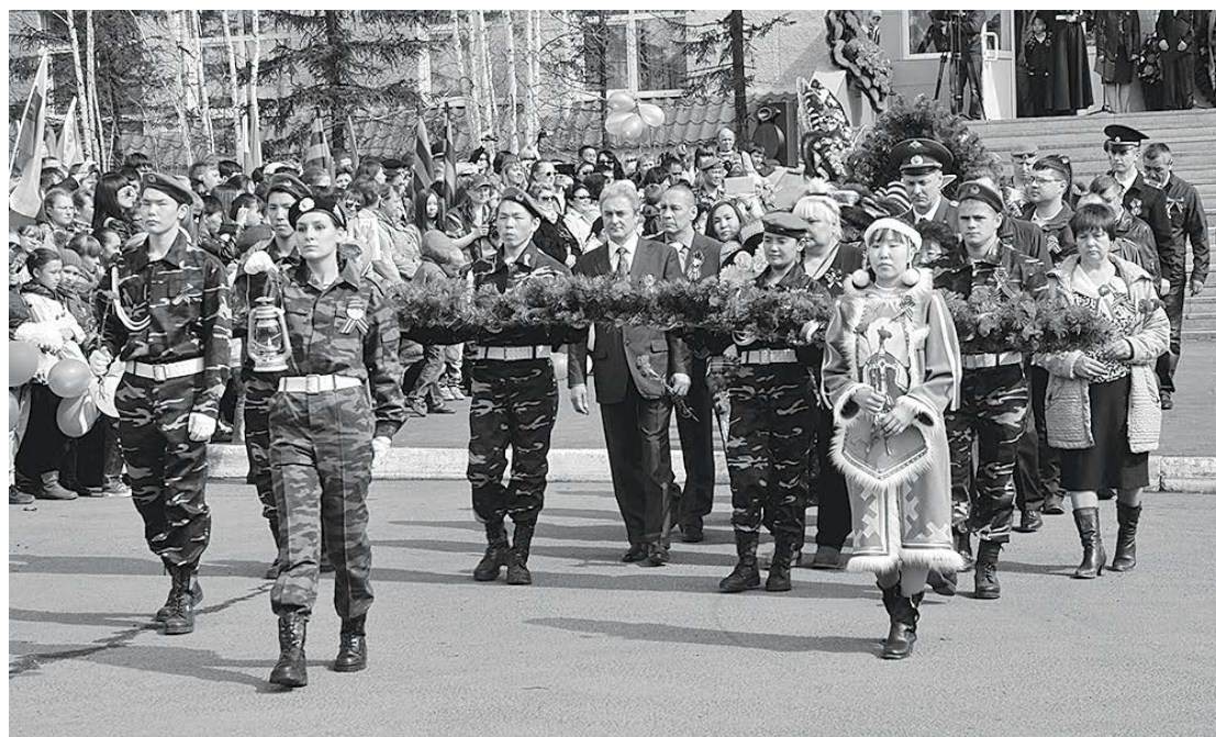
Возложение венков к памятнику воинской славы