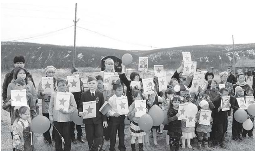
Нидымский «Бессмертный полк»

В п. Нидым торжественный митинг, посвященный празднованию 70-летнего юбилея Великой Победы, был ознаменован открытием памятника солдатам, ушедшим на фронт из Эвенкии.