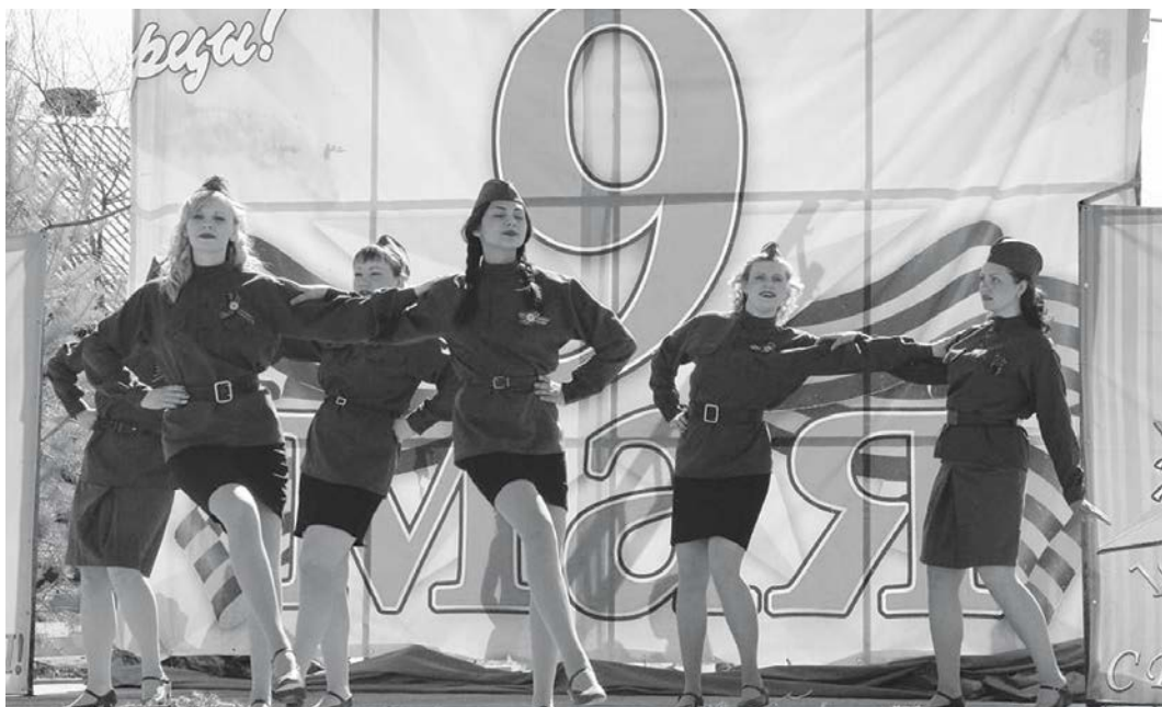
На праздничном концерте