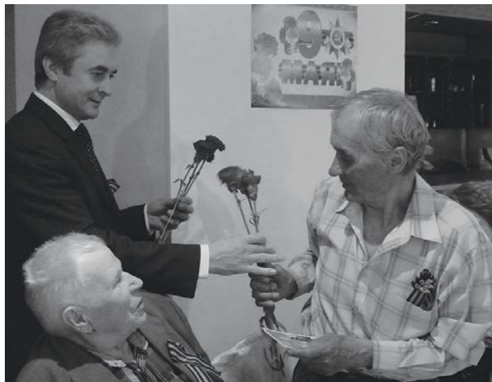
Поздравление от главы ЭМР

В дни празднования 70-летия Великой Победы в Туре состоялся прием главы Эвенкийского муниципального района для ветеранов и тружеников тыла.