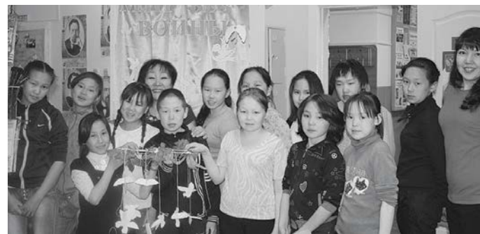
Ребята по всей Эвенкии приняли участие в краевых чтениях

Заявку на участие в чтениях подали более 370 учреждений из 51 муниципального образования Красноярского края от Норильска до Минусинска: библиотеки, школы, детские сады, детские дома и другие.