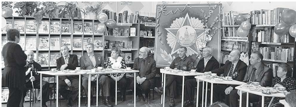
На встрече ветеранов в Байките

В Эвенкии состоялись краевые чтения «Читаем книгу о войне», организатором которых выступила Красноярская краевая детская библиотека. Мероприятие проходило одновременно во всех учреждениях-участниках акции накануне юбилея Победы - 7 мая 2015 года ровно в 12 часов.