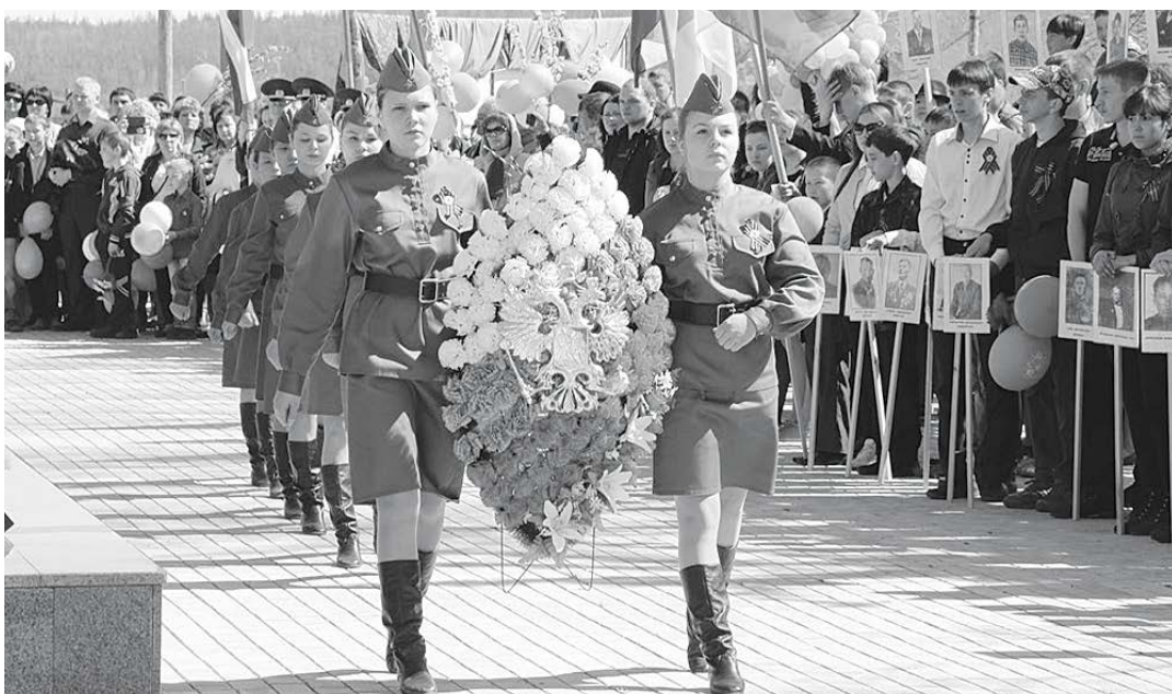
Возложение венков воспитанниками Ванаварского детского дома № 2