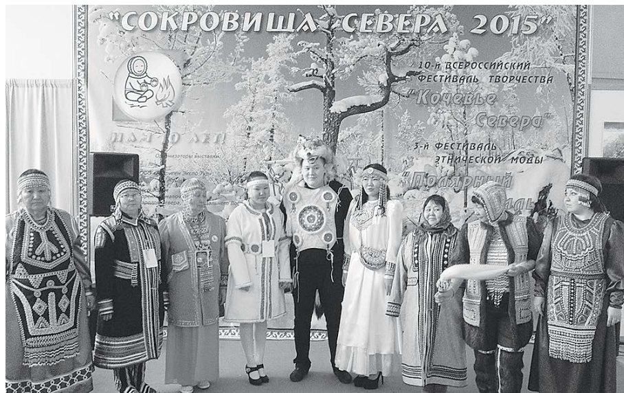
Представители Эвенкии стали призерами фестиваля «Сокровища Севера»

Подробнее расскажем еще об одной международной выставке – «Сокровища Севера-2015», в которой приняла участие весьма представительная делегация из Эвенкии, более того – наши экспозиции были высоко отмечены.