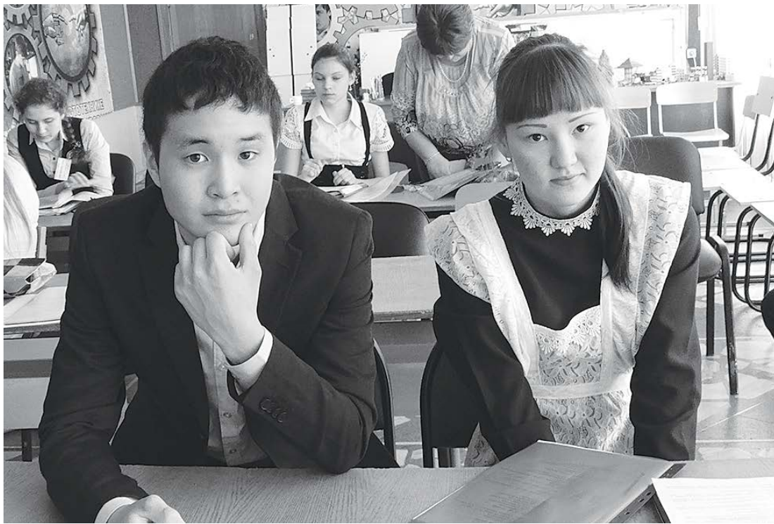
Работу туринских ребят отметили на краевом форуме «Молодежь и наука»