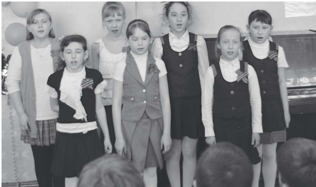
Дети очень ответственно подошли к своему выступлению

Нас встретили аплодисментами, видно, очень ждали. Всё торжественно, лица детей серьезные. Кругом шары, цветы, банты, рисунки на военную тему, лучшие тетради и поделки детей, а главное - тишина.