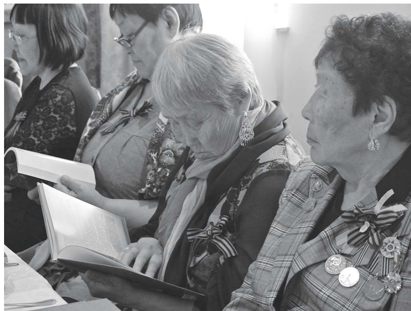
Ветераны по достоинству оценили новые книги