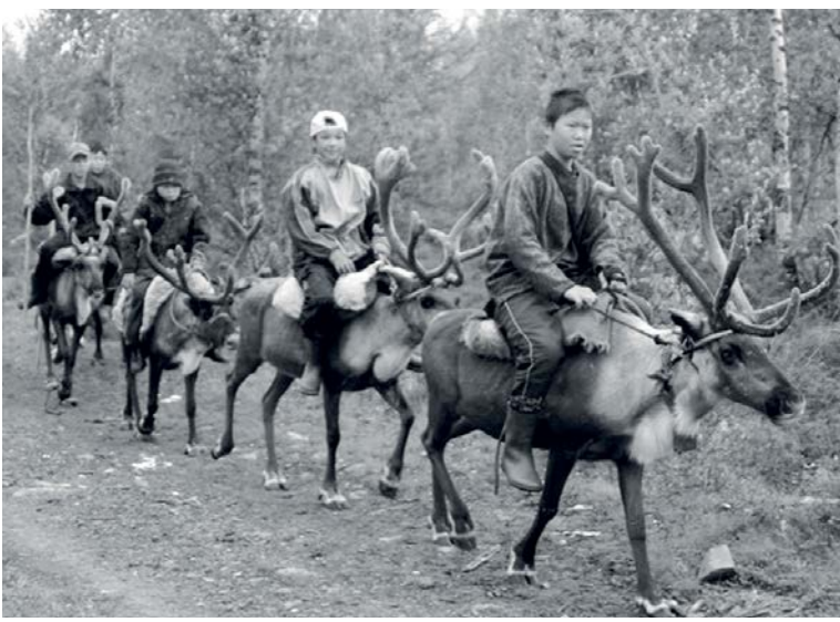
Ороорво этэечимнилдүлэ нүлгидирэ