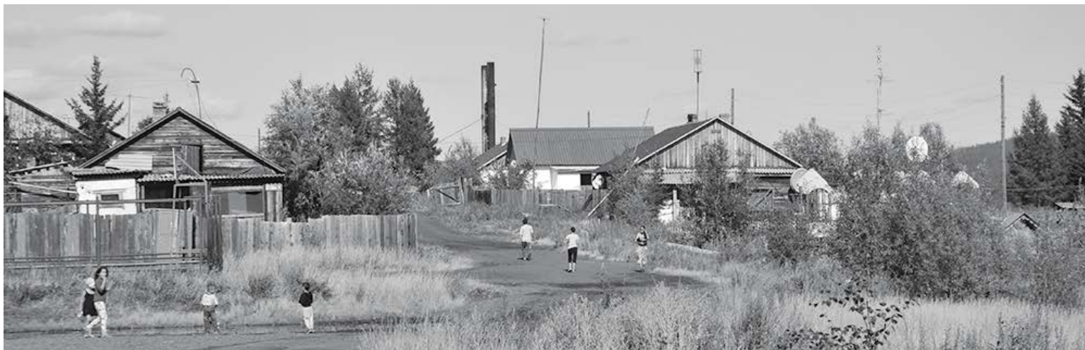
Этим летом в эвенкийских поселках начнется реализация проектов по благоустройству