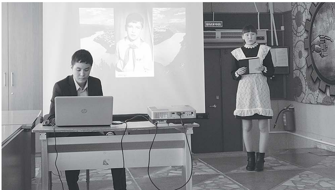
Презентация проекта «Не забывай, Россия, сыновей»