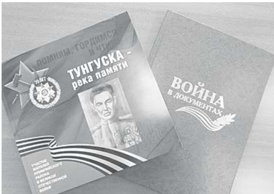
Чтобы помнить, какой ценой досталась Великая Победа...

В Туре состоялась презентация двух замечательных книг: «Война в документах» (МКУ «Эвенкийский архив») и «Тунгуска - река памяти» (МБУ «Эвенкийский краеведческий музей»). В обоих изданиях собраны материалы, так или иначе рассказывающие об участии жителей Эвенкии в Великой Отечественной войне.