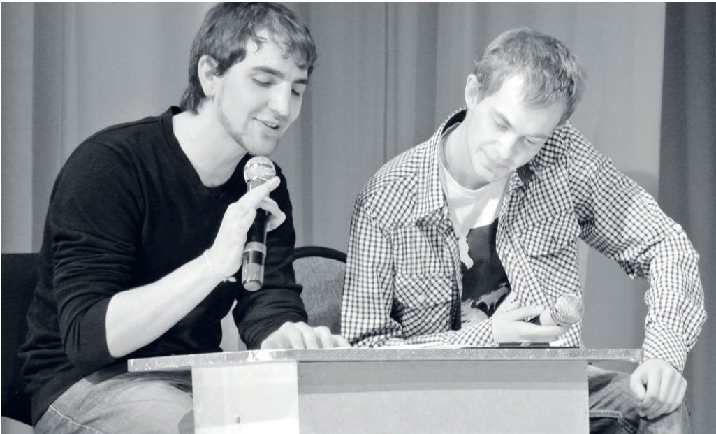
Сборная с. Байкит - команда «Пумпа-Лумпа»