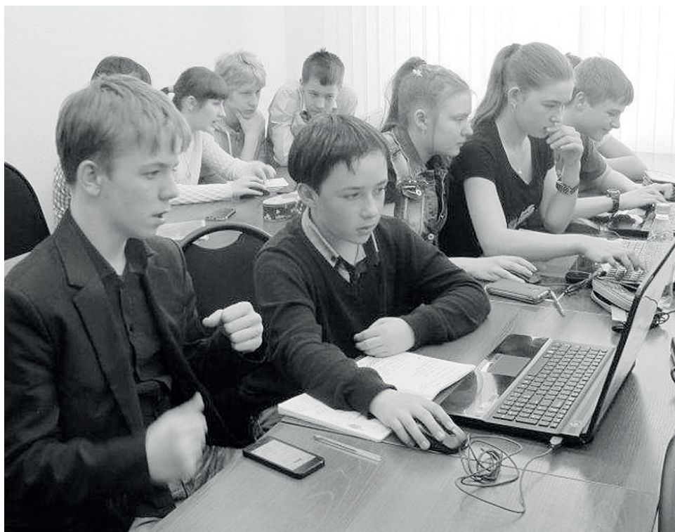
Сейчас в «Школе космонавтики» обучается 15 эвенкийских ребят