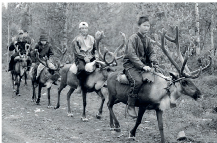
Проект «Юный оленевод», получивший финансовую поддержку, позволит школьникам освоить азы оленеводства