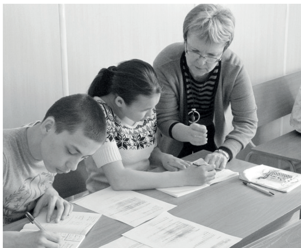
Занятия в интенсивной школе дают конкретные перспективы в дальнейшем образовании