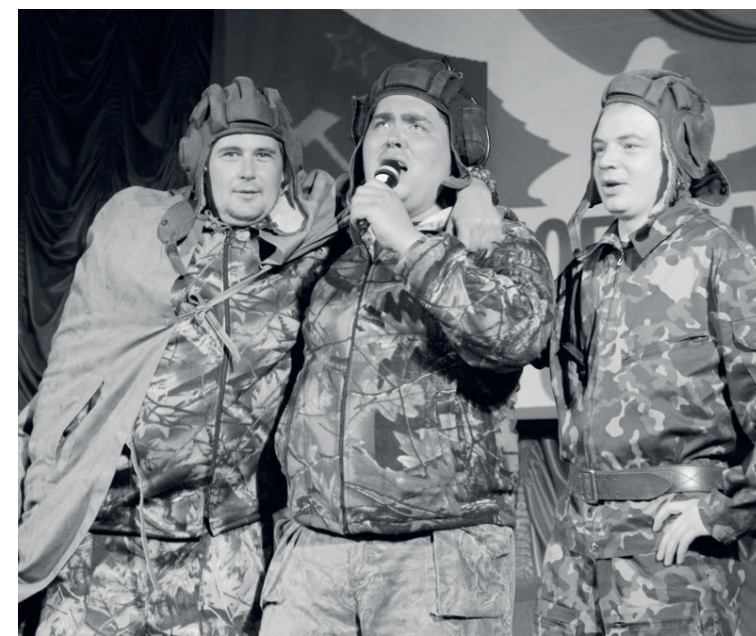
«Три танкиста» (МП «Ванавараэнерго»)