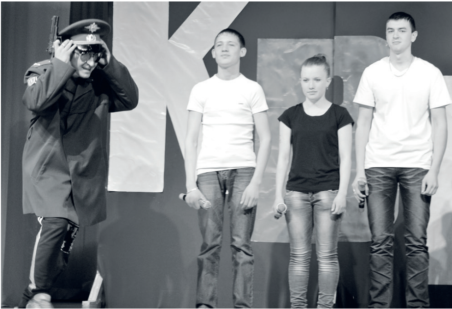
Туринская команда «ФаZZа»