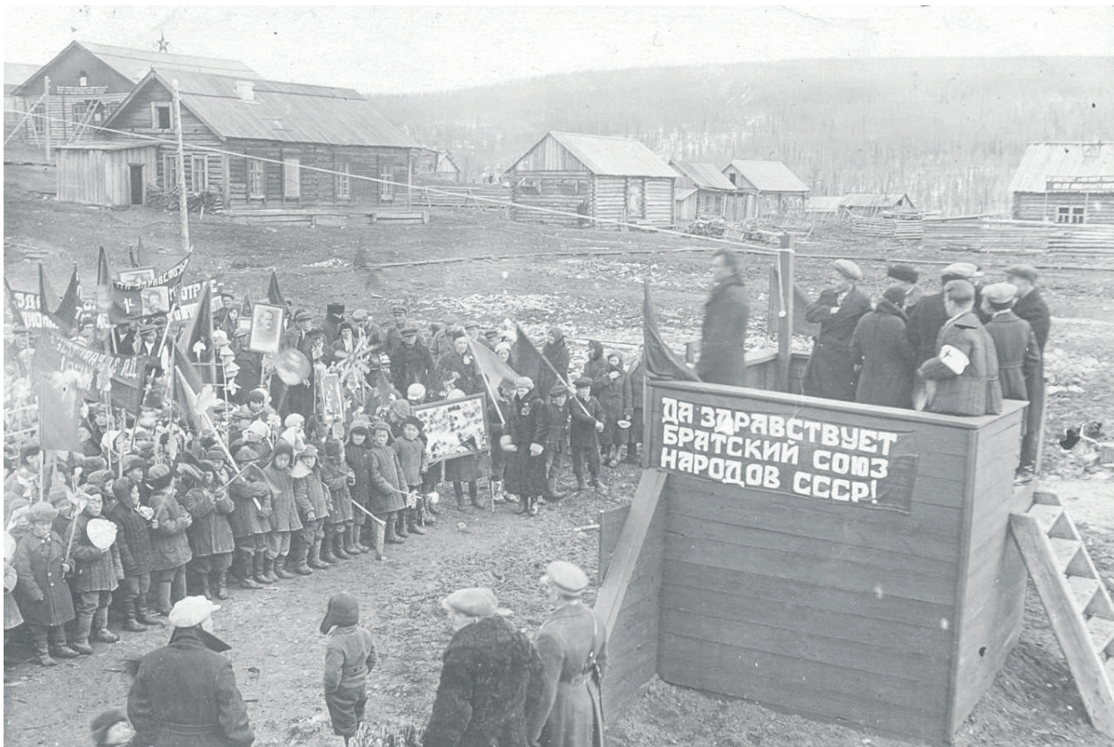
Первомай в Байките, 1938 г.

Администрация Эвенкийского муниципального района поддерживает инициативу Международной организации труда и призывает работодателей, работников и профсоюзы повсеместно провести информационно-разъяснительную кампанию, организовать различные мероприятия, которые бы послужили созданию здоровых условий труда на рабочих местах, снижению риска производственного травматизма и профзаболеваний, продвижению культуры и пропаганды безопасного труда.