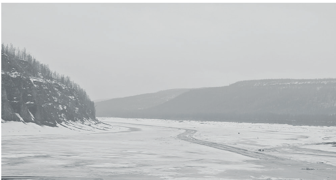
На Нижней Тунгуске по прогнозам ледоход должен начаться приблизительно 10 мая

Реки Эвенкии еще скованы льдом, но пройдет буквально две-три недели и по ним в поселки района начнется доставка жизненно важных грузов. Речная навигация в Эвенкию в этом году обещает быть спокойной – по прогнозам специалистов уровень воды в наших водных артериях будет умеренным. Подробнее в нашем материале.