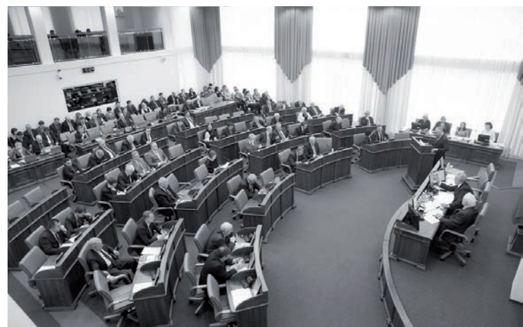
Краевой суглан заседаниен

государственнаилнун, местнай самоуправление органилнунин край дуннэнгилдун бидерилнун, хавалилдыдяран. Край правительствадун гунмуврэн 1 июньдула бегала 2015 аннганиду мероприятиел планилватын он КМНС край дуннэлдун билденгэн дукувка. Туги-дэ олломикилва, бултакичилва дуннэлвэ тангивка, тала коренноил илэл хавалдядатын; краевой госпрограмма подпрограммаван «Здравоохранение часки бодовдэдон» дукувка. Аичимнил аятмарит, омактат КМНС илэнгилвэн айтчадатын. Омакталва аиткичилва гулэлвэ гулэсэгилду, иду коренноил илэл индерэ, орорво этэчимнилвэ агили нулгиктэдерилавэ, олломимнилвэ, бултамнилва