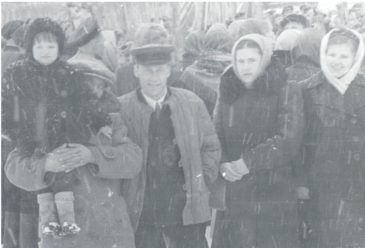
Первомай в Байките, 1947 г.