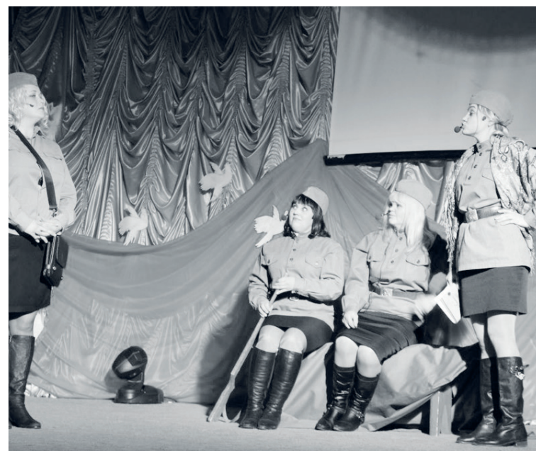
«Девчонки поры огневой» (коллектив КЦСОН)