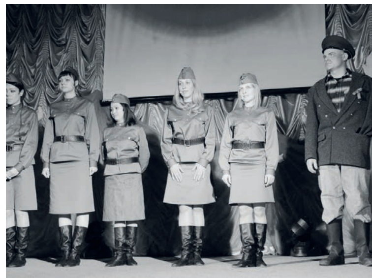
«А зори здесь тихие» в исполнении педагогов Ванаварского детского дома