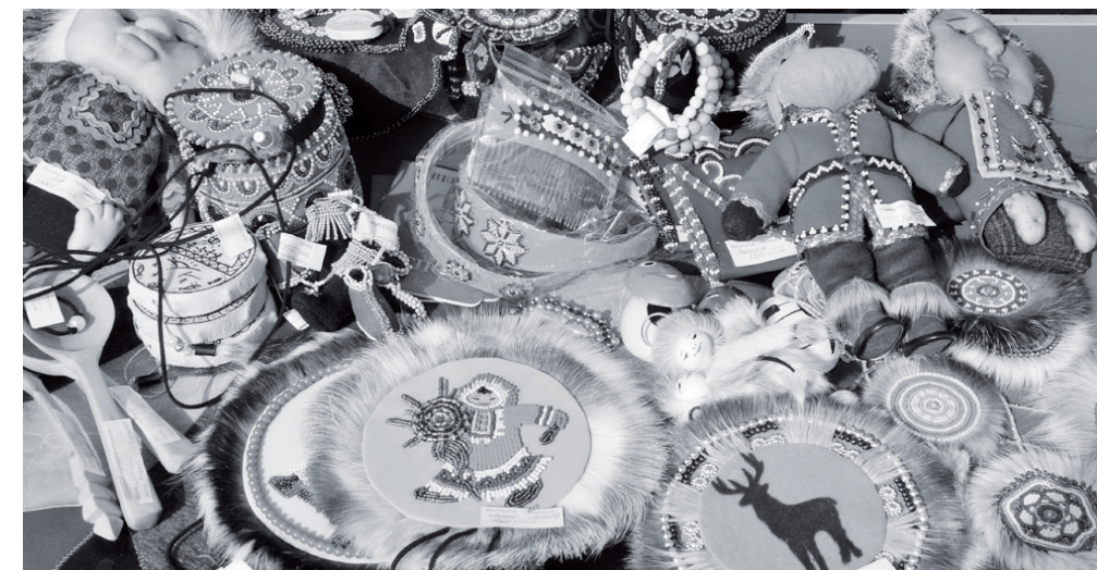
Яркая выставка ДПИ

Все гулянье развернулось на площади перед отделением ОАО «Сбербанк России». Артисты ЭРКДЦ сумели не только создать праздничное настроение, но и позабавить жителей массой развлечений и вместе с озорными скоморохами весело проводить Зиму и встретить Весну-красну.