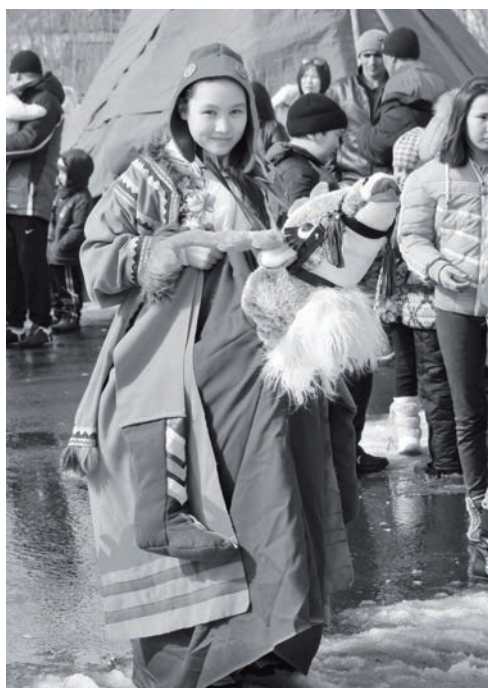
Ряженные - заведут ритм народных гуляний

В минувшую субботу в поселке Тура широко и весело прошел традиционный народный праздник проводы Зимы. Организаторами народного гулянья выступили администрация поселка Тура и Эвенкийский районный культурно-досуговый центр.