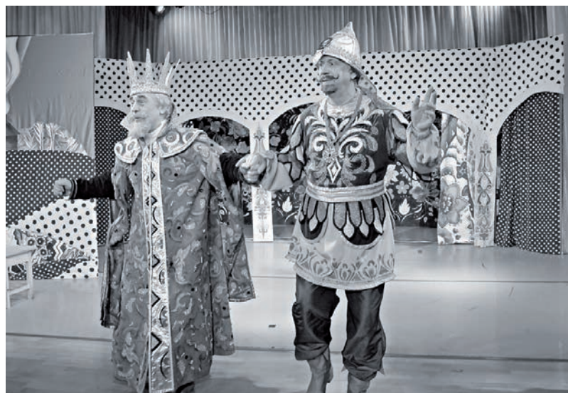
Сцена из спектакля «Емелино счастье»

В мае в Туру приезжает Красноярский музыкальный театр! Жителям и гостям райцентра представляется редкая возможность получить удовольствие от игры профессиональных и, как говорится, столичных актеров.