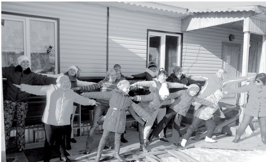
Ванавара: зарядка на свежем воздухе

В рамках акции «День борьбы с сердечно-сосудистыми заболеваниями» специалистами МБУ «Комплексный Центр социального обслуживания населения» Эвенкийского муниципального района в Туре, Байките и Ванаваре провел соответствующие мероприятия.