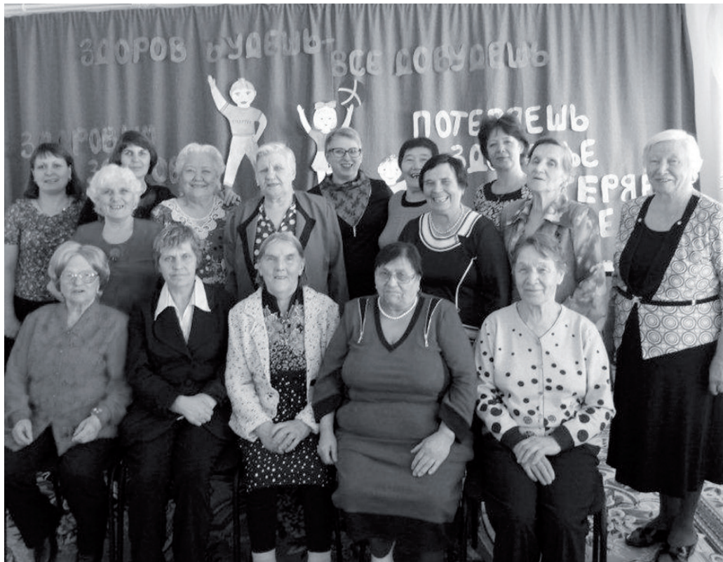
День здоровья в Байkitском филиале КЦСОН