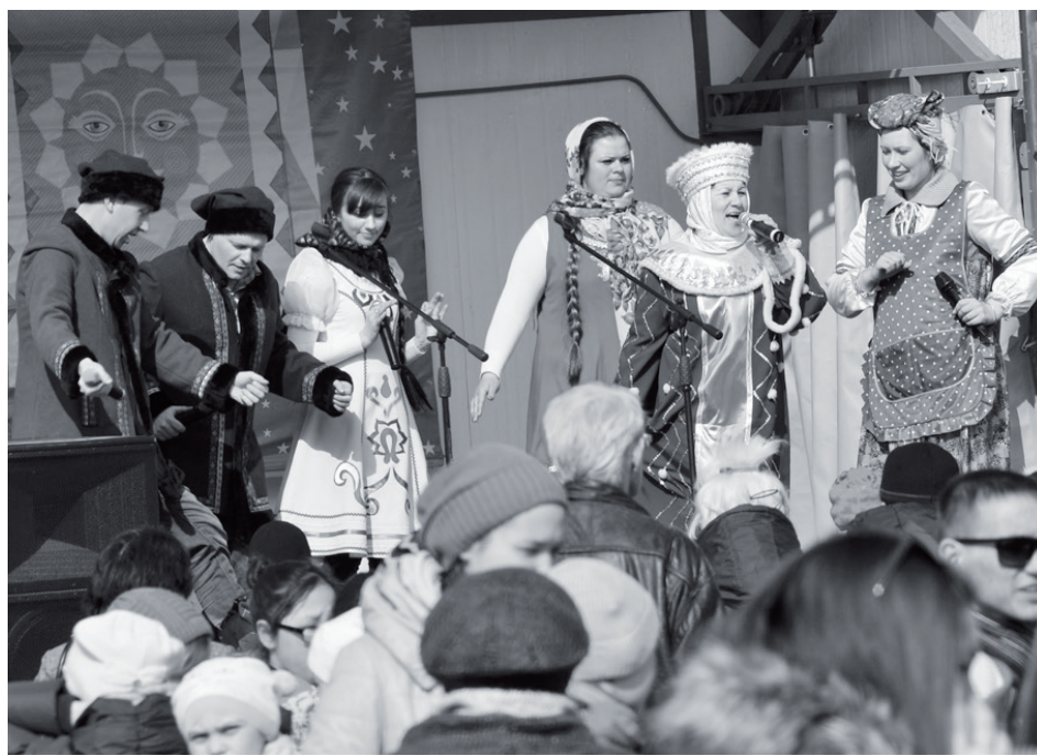
Праздник в разгаре