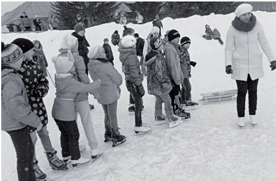
К состязанию готовы