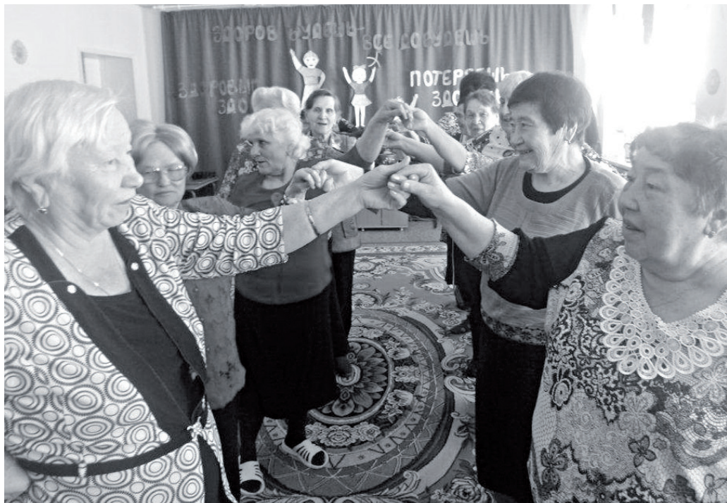
Движение – путь к здоровью