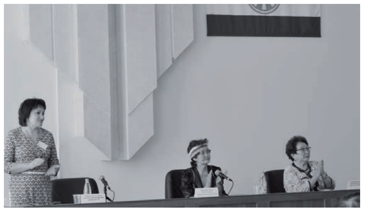
Конференцияла 54 илэл эмэчэтын

этэечимнилду-да хавамнилтын абулитчара, алагумнил эвэдывэ турэнмэ кунгакарнун алагудярил абулитчара-да. Эси алагумнил оматалди стандарталди хавалдяра, таткичил планилдугтын урокил региональнэй компонентатын «Наследие» ачин оча. Туг-дэ кунгакар амтылтын энгил хутэлвэр эвэдыт турэтчэдэтын алагура. Научно-практическойдула конференцияла 54 илэл эмэчэтын. Тар таткичилду эвэдывэ, якодыва турэнмэ алагудярил, кунгакадыл гулэл алагумнилтын 18 Эвенкия гулэсэгилдукин, администрация хавамнилин, общество организациалдукин, тадук хунгтул эмэчэтын. Конференцияду турэрвэ гунчэтын 16 илэл. Часки аятмарит Эвенкияду эвэдывэ турэнмэ, эвэнкил культураватын одёдедэвэр, научно-практическойду конференцияла бичэл илэл гэлэдерэ: Край законодательнэй власть органилдун Законоилва «Об административно-территориальных единицах с особым статусом» тадук «Закон о сохранении, изучении и развитии родных языков коренных малочисленных народов, проживающих на территории Красноярского края». Химатмэрит тар дюрвэ хэгдылвэ документалва овка. Исполнительная власть органилдун Хулукукэрду гулэсэгилду илэлду хавалэтын бакавка. Район хэгдыгулдугтын силбавка организацияла, учреждениелвэ лучадыт, эвэдыт гэрбидэтын. ЭМР образование Управлениедун Образовательнэйлду учреждениелду гунилкэ, региональнэйлдук базиснаилдук учебнаилдук планилдук эдэтын эвэдывэ