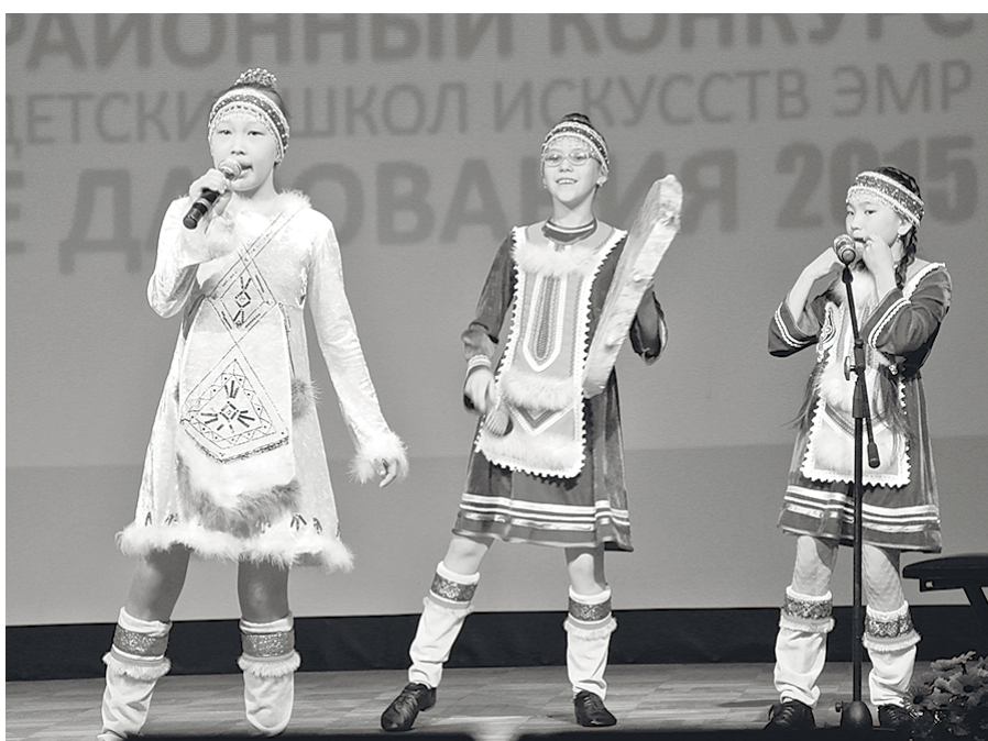
Национальный инструментальный ансамбль «Дылачакан», п. Тура