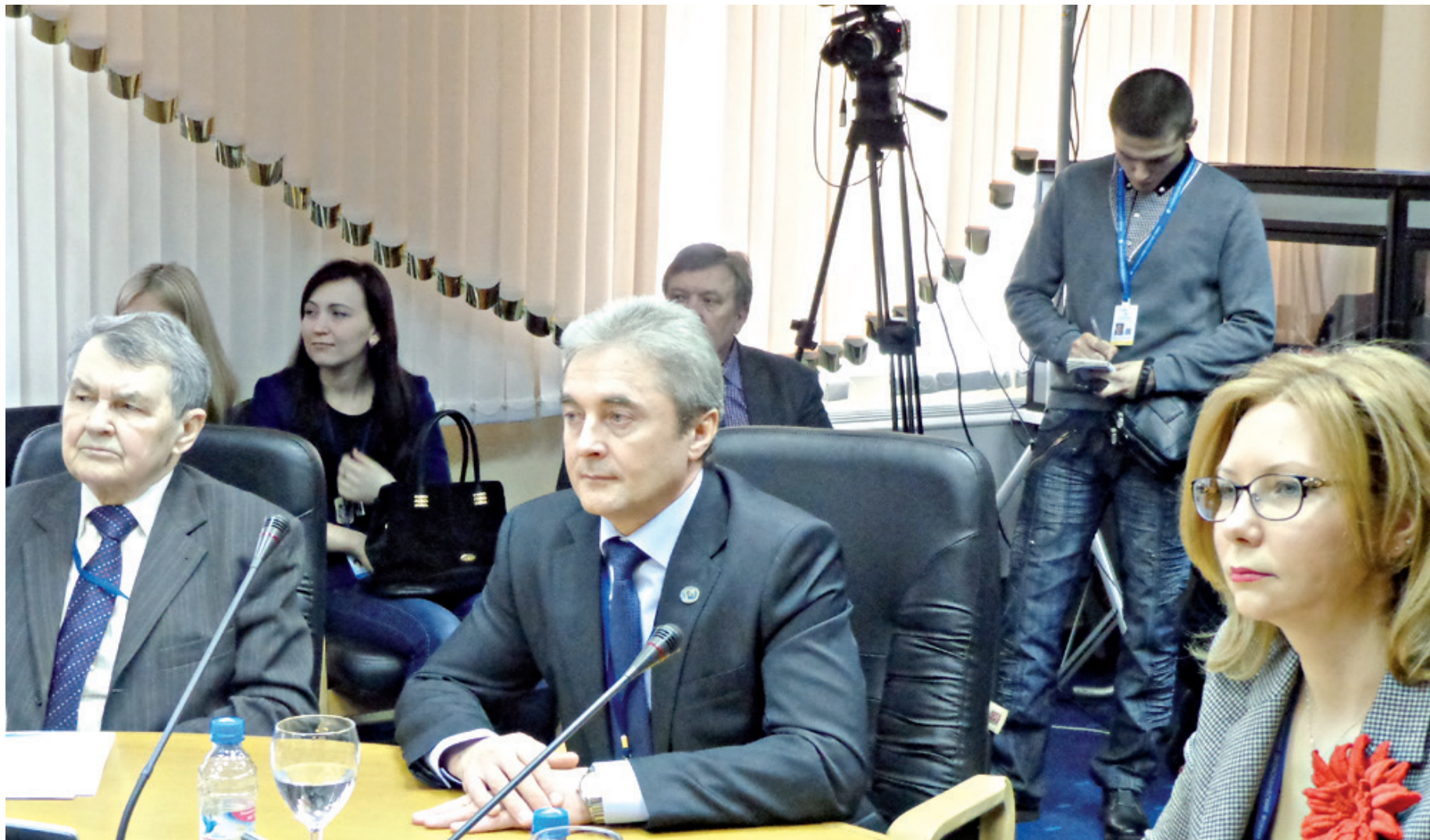
Глава ЭМР – член краевого Арктического Совета

будут направляться на переработку, остатки обезврежены и захоронены.