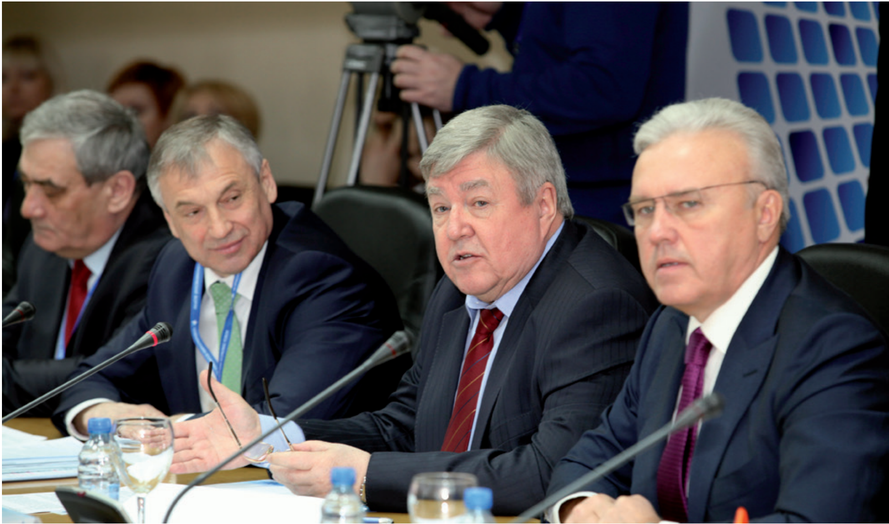
Президиум круглого стола «Освоение Арктики»

25-28 февраля в Красноярске проходил 12 Красноярский экономический форум. За это время площадки КЭФ посетили более шести тысяч человек из 35 стран мира и 54 регионов РФ. Ключевыми вопросами КЭФ-2015 стали сотрудничество России со странами Азиатско-Тихоокеанского региона, замещение импортной продукции товарами отечественного производства. Был рассмотрен ряд вопросов, касающийся северной тематики.