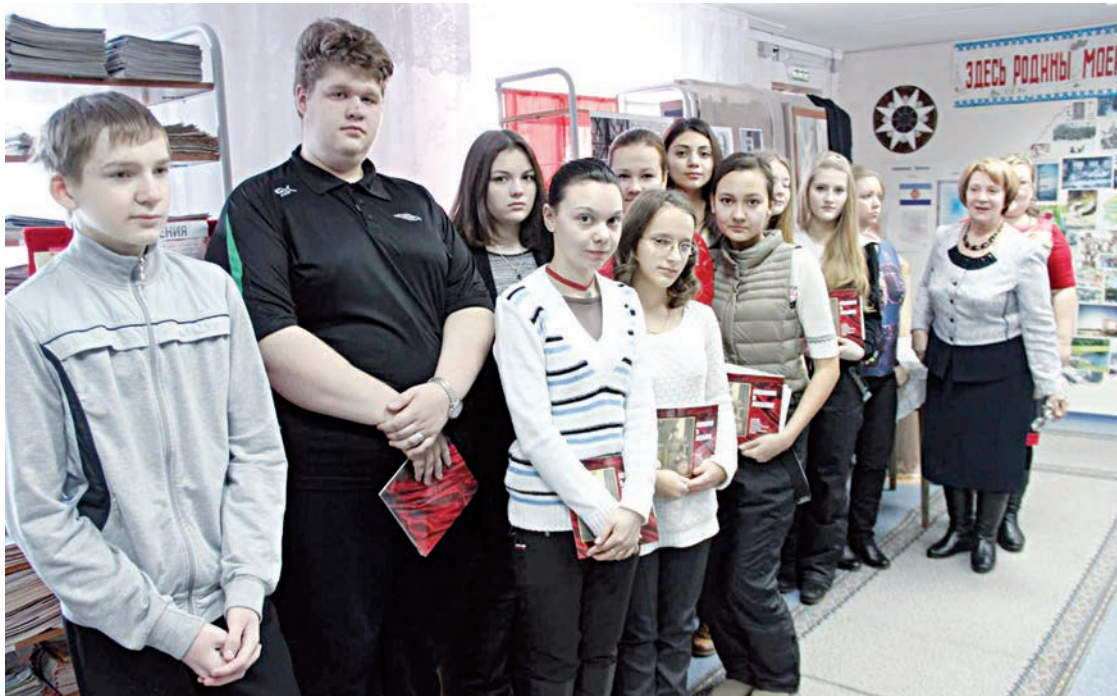
Урок краеведения для 10-х классов ВСОШ