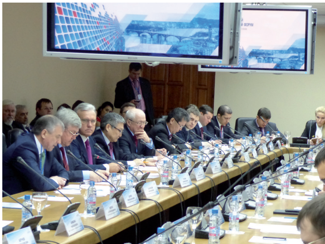
В ходе дискуссии были рассмотрены основные векторы развития Арктики