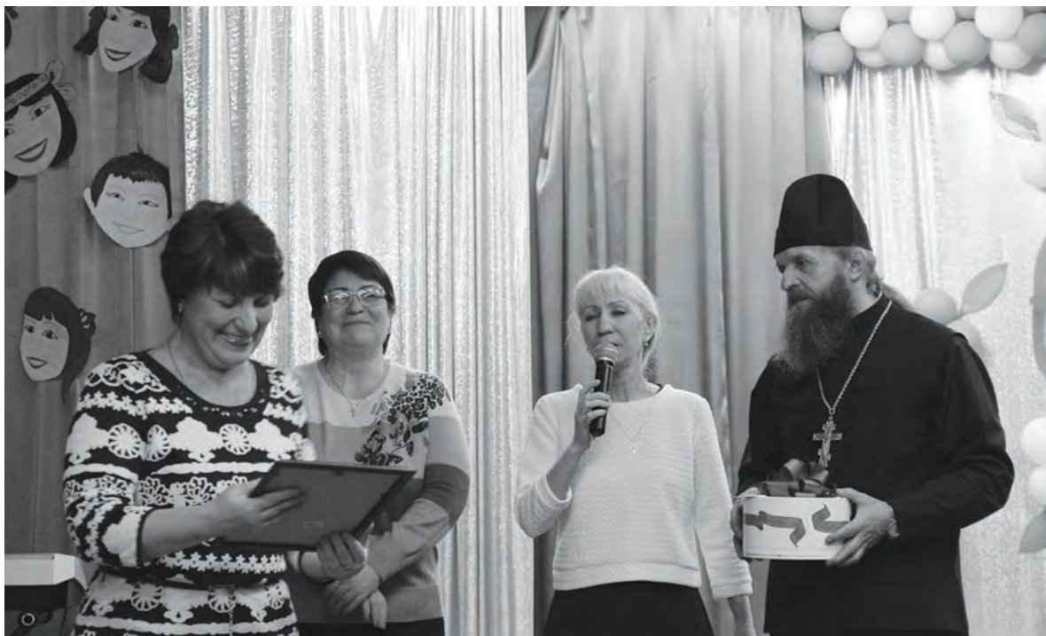
Поздравления от почетных гостей