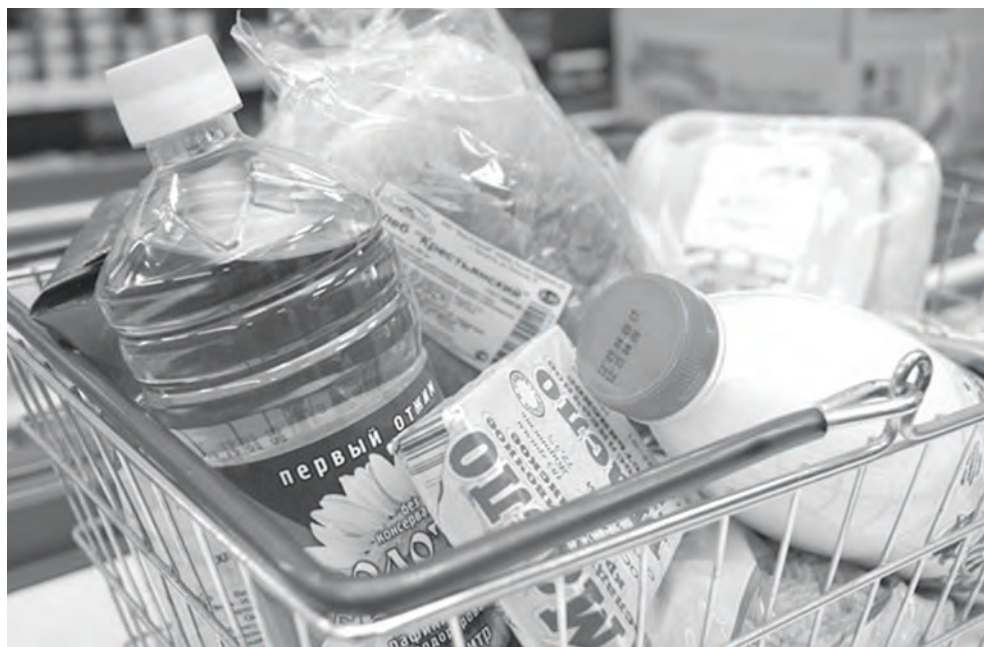
Расходы северян на продукты существенно возросли