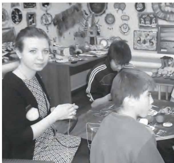
На мастер-классе по ДПИ