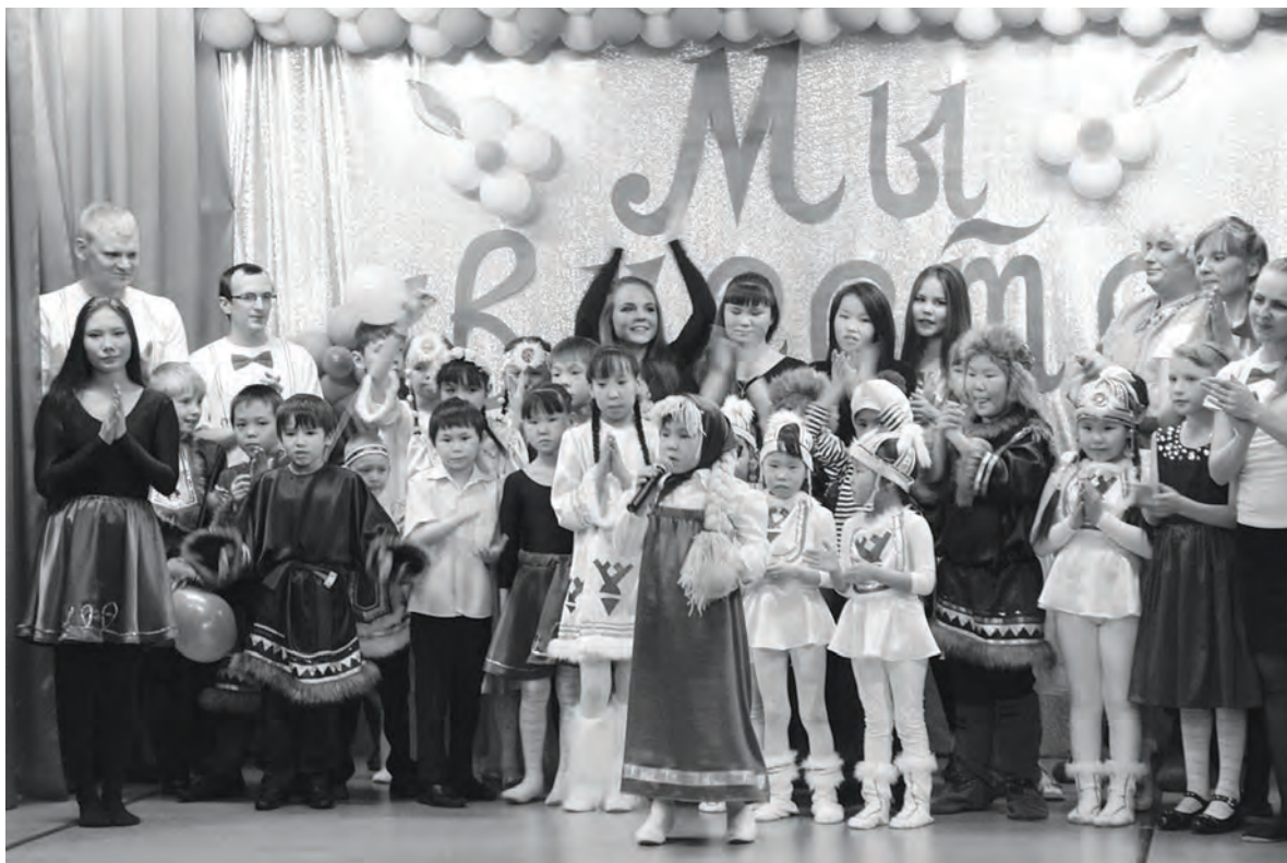
С днем рождения, наш общий дом!