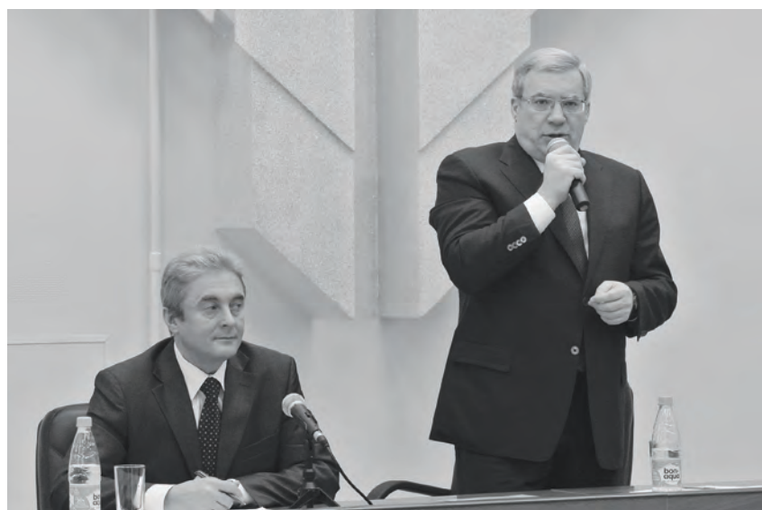
В числе поручений - решить проблему с чистой питьевой водой в райцентре

Перед районными властями стоит сложная задача по решению давней проблемы с чистой питьевой водой в райцентре Эвенкии. В числе поручений губернатора нашему району эта тема стоит в числе приоритетных. Так, в срок до 1 апреля текущего года правительству края совместно с органами МСУ ЭМР поручено подготовить предложения по улучшению качества водоснабжения населения п. Тура, в том числе по установке станций водоочистки и обеззараживания на действующих объектах водоснабжения, а также выполнению поисково-разведочных работ на питьевую воду в целях строительства водозаборных сооружений из подземных водоисточников. От-