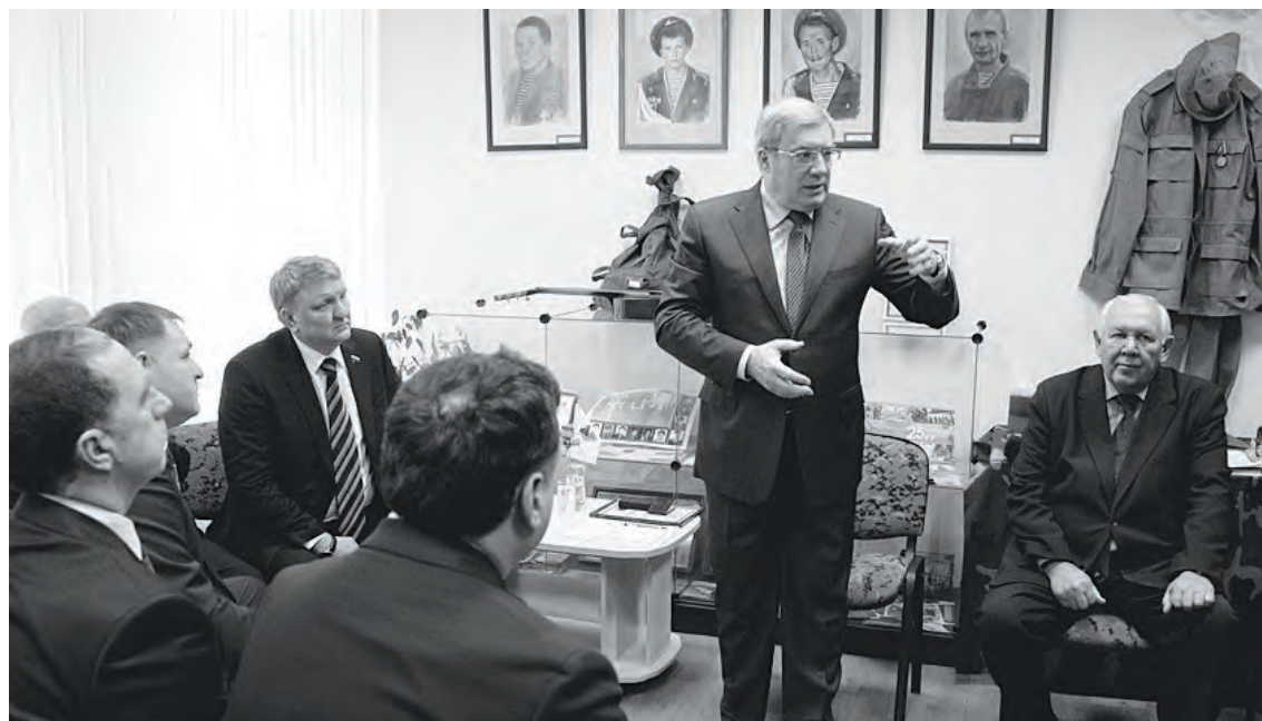
Губернатор на встрече отметил, что забывать о подвиге «афганцев» никто не вправе

В преддверии 26-й годовщины вывода советских войск из Афганистана губернатор Виктор Толоконский посетил музей афганской войны и встретился с воинами-интернационалистами.