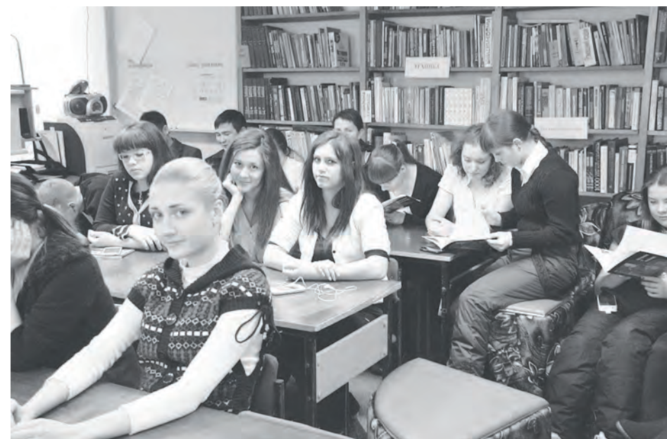
Юные участники встречи

Интересный урок истории и краеведения подготовили для учеников Ванаварской средней общеобразовательной школы сотрудники центральной межпоселенческой библиотеки в содружестве с МКУ «Эвенкийский архив». Мероприятие состоялось в здании центральной библиотеки прямо 27 января - в памятный день полного снятия Ленинградской блокады. Ученики 11-х классов увидели страшную хронику военных лет блокадного города и узнали много нового о великом подвиге ленинградцев. Сотрудники библиотеки не только рассказали ребятам о 872-х днях блокады, но и сумели воссоздать то время, оформив экспозицию кусочком черного хлеба - нормой на сутки в осажденном Ленинграде, печкой-буржуйкой, доской объявлений блокадного города и т.д. Присутствующие смогли также познакомиться с выставкой литературы из фондов Ванаварской библиотеки, посвященной блокаднему Ленинграду.