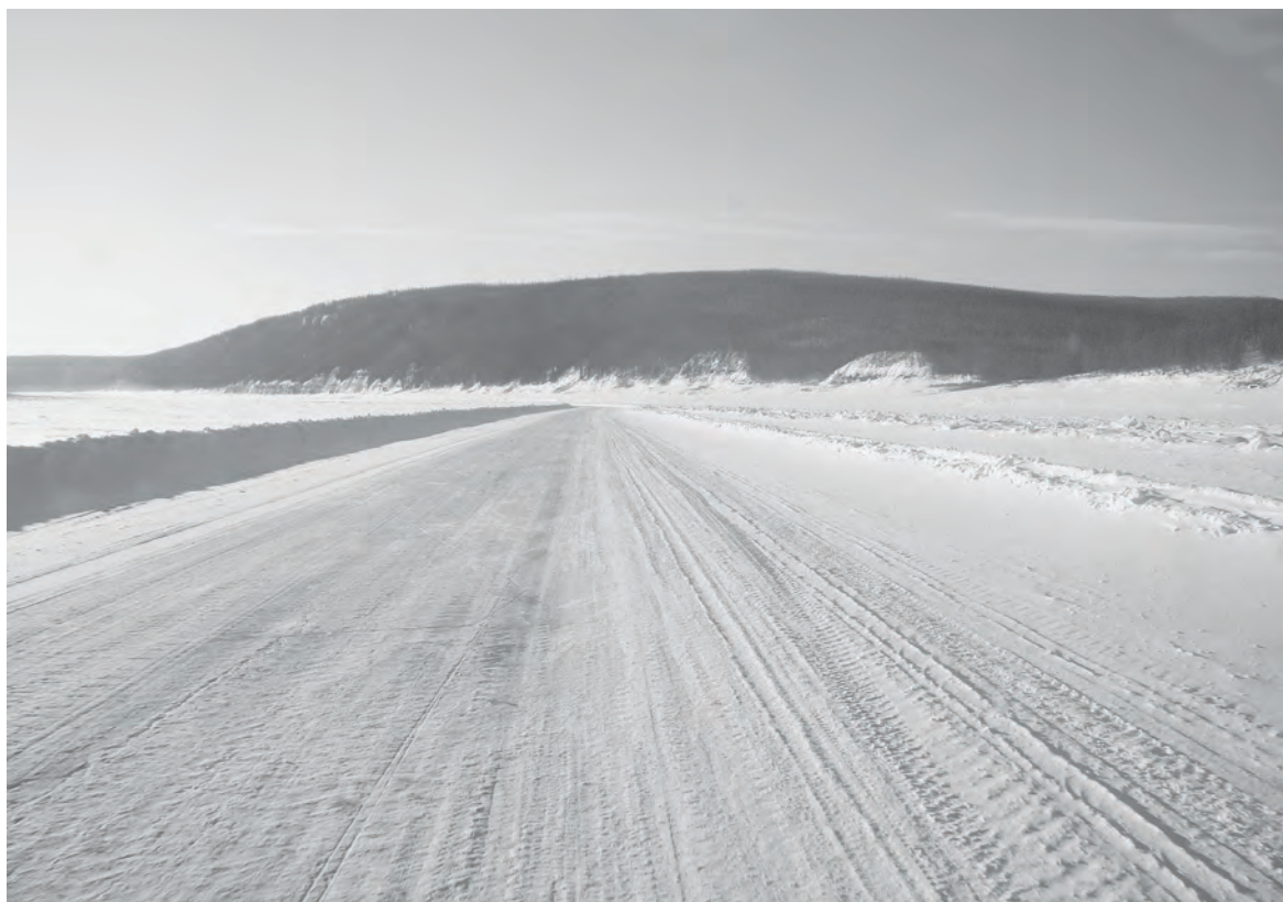
Слишком мягкая зима затрудняет строительство зимников: техника тонет

И вот в таких сложных условиях работали дорожные отряды... Надо отдать им должное, зимние дороги до наших крупных населенных пунктов - Туры, Байкита, Ванавары - были открыты в срок. Так, первые машины с грузом в райцентр прибыли в первой декаде декабря 2014