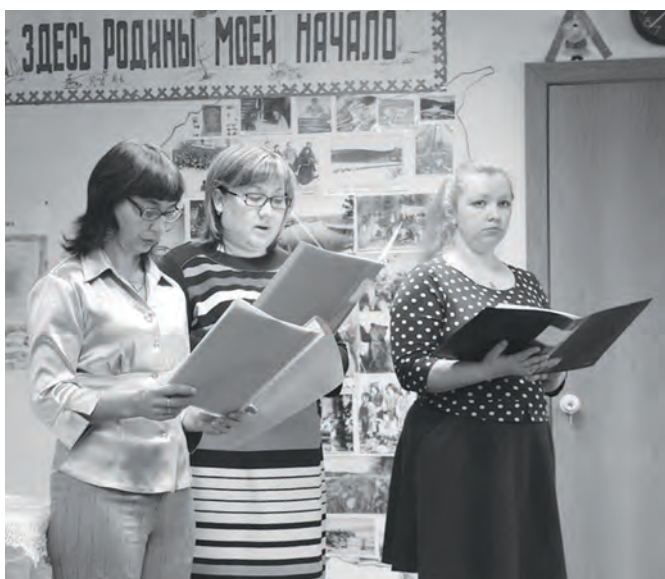
На мероприятии в честь снятия блокады Ленинграда

Совсем скоро весь мир будет праздновать 70-летний юбилей великой Победы над фашизмом. В Эвенкии, как и во всей нашей огромной стране, уже начались мероприятия, посвященные этой знаменательной дате.