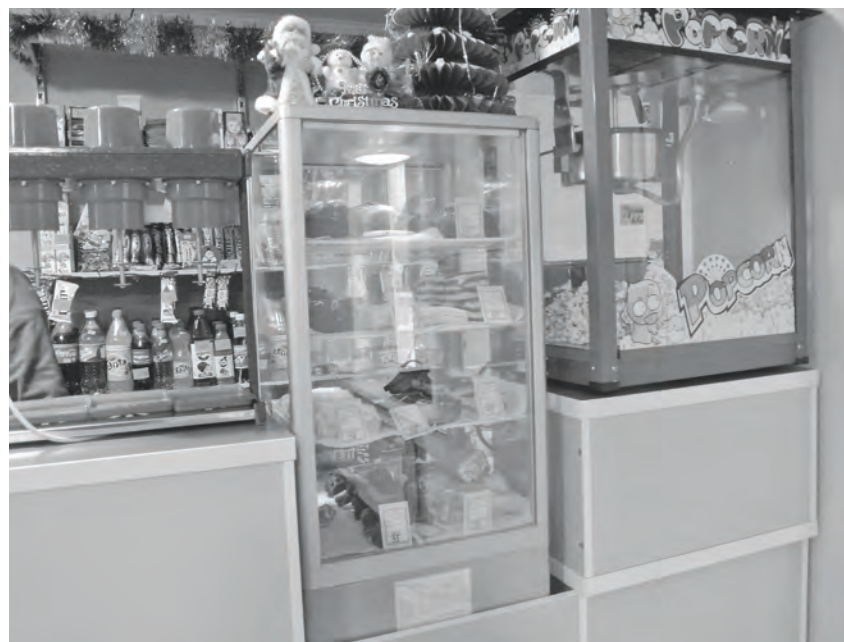
В скором времени на витрине появится и собственная выпечка