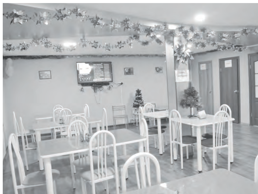
Уютный зал кафе «Солнышко»

Помимо этого в заведении предусмотрена возможность организации и проведения различных мероприятий и детских праздников.