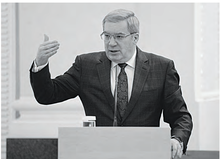
Организационные особенности управления развитием Эвенкии и Таймыра определяют до конца года