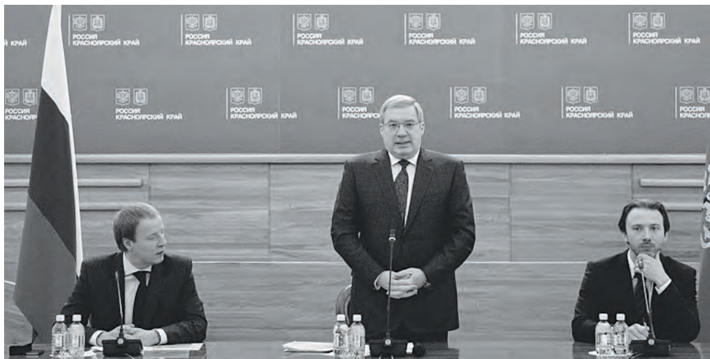
Губернатор считает, что нужно усилить экономические стимулы для ведения традиционной промысловой деятельности