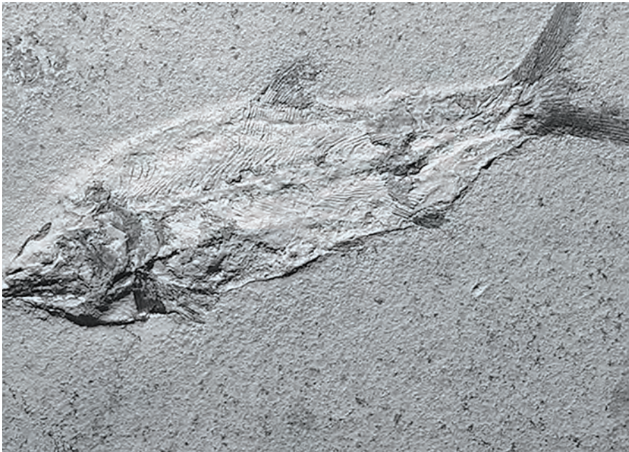
Окаменелость древней рыбы

Древнюю рыбу, останки которой были найдены на плато Путорана - территории Таймыра и Эвенкии - в 1972 году, английские ученые признали уникальным существом. Оно, как заявили британские палеонтологи в статье научного журнала Natura, сочетает признаки хрящевых и костистых рыб и претендует на роль предка всех челюстных животных, в том числе и человека.