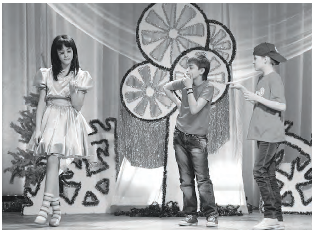
На сцене юные актеры ТЮЗа ЭРКДЦ