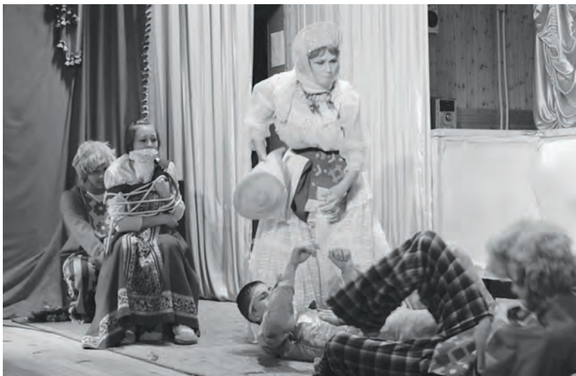
Сцена из сказки «Счастливый случай»