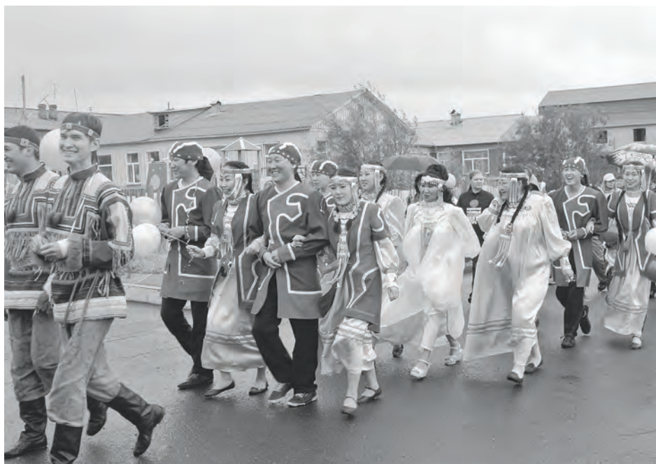
Шествие в национальных костюмах в День аборигена