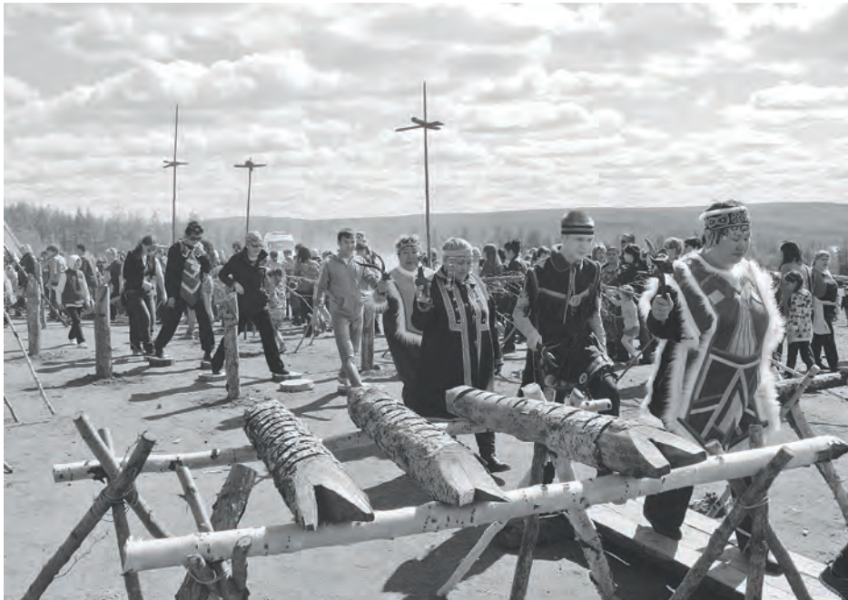
Обряд очищения на празднике «Мучун»