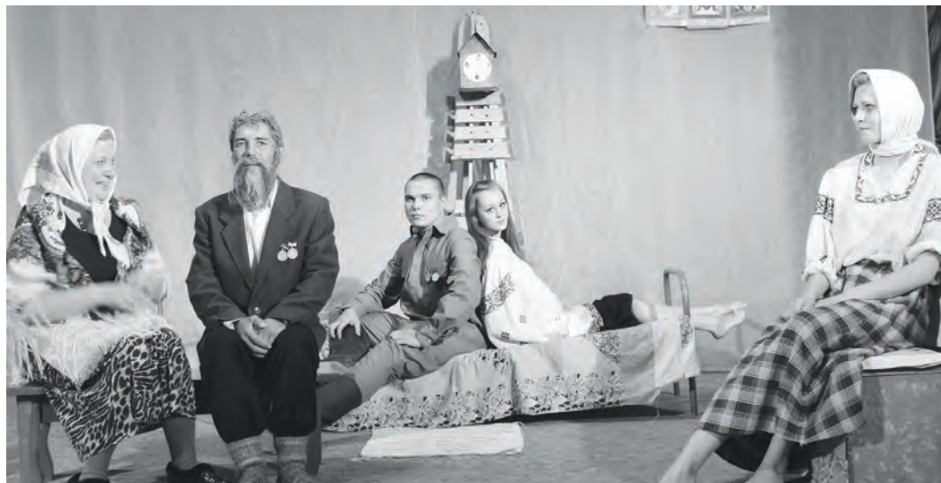
Участники спектакля «Святое дело, или Любишь, не любишь»

Почти двадцатидневный творческий вояж по гостеприимной эвенкийской земле состоялся летом. Как в истории управления культуры, так и в истории народного театра Байkitа такой длительный кризис осуществлялся впервые. Маршрут лежал через поселки Суринда, Нидым, Тура, Стрелка-Чуня, Ванавара и завершился в Байките.