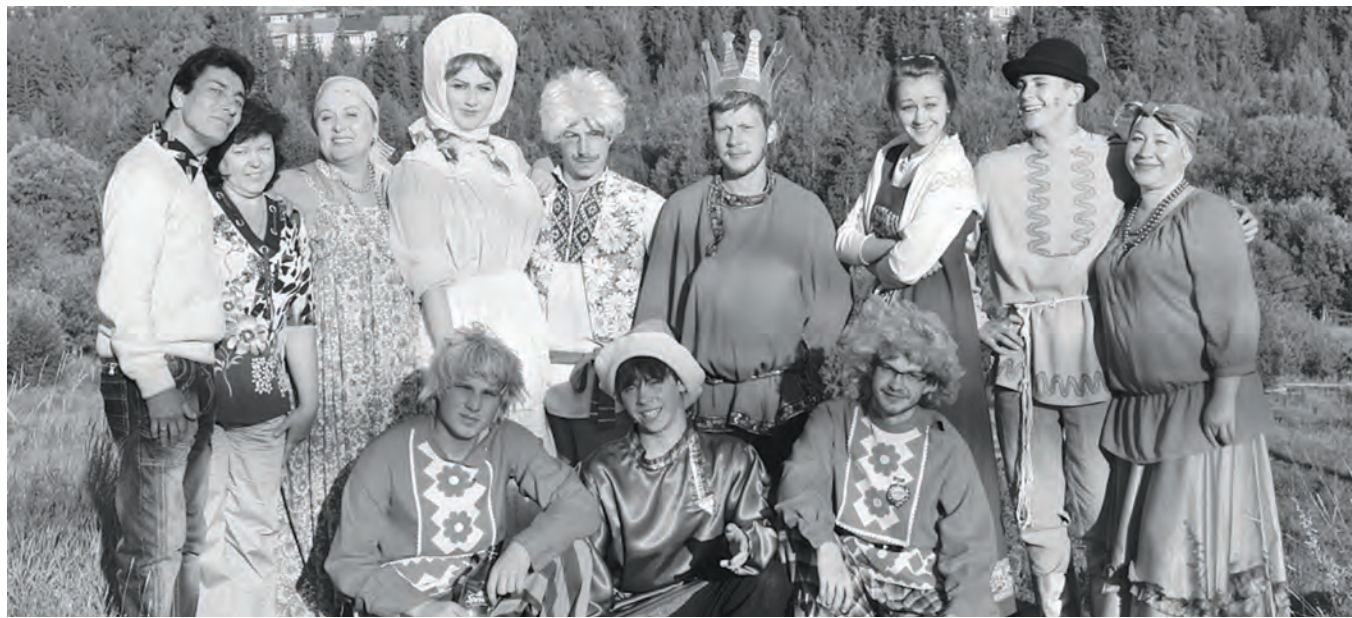
Актеры байkitского ТЮЗа

В рамках Всероссийского года культуры и в честь юбилея Народного театра Байkitа управление культуры администрации ЭМР организовало большое творческое мероприятие «Гастроли байkitского ТЮЗа по большим и малым поселкам Эвенкии».