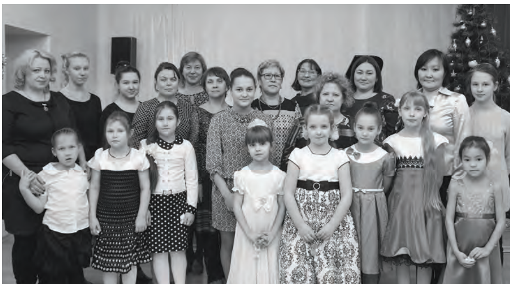
Общество любителей музыки