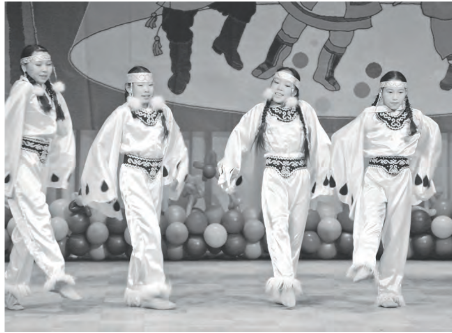
Детский образцовый ансамбль «Хотугу Сулус»