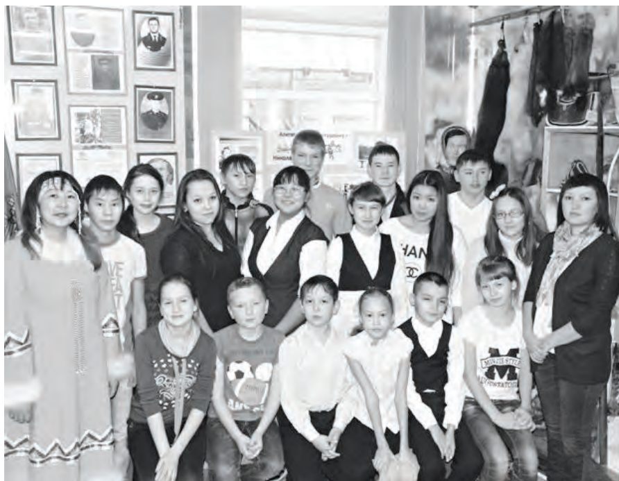
Изучаем творчество поэта