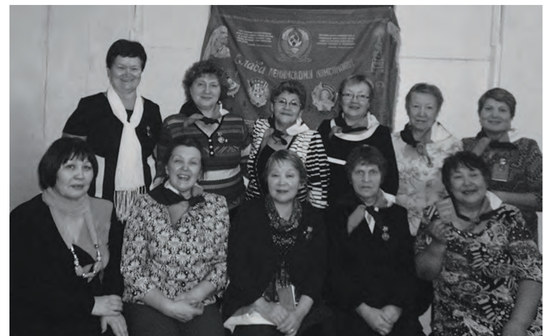
Бывшие комсомольцы Байкита

Но историю не перечеркнешь, не переписешь заново. В памяти народа навсегда останутся такие исторические вехи комсомола, как Каховка, Перекоп, Великая Отечественная, Днепрогэс, Целина, Космос, БАМ; немало добрых дел было сделано в свое время Эвенкийской окружной и Байкитской районной комсомольскими организациями.