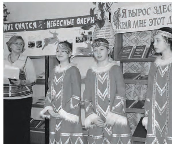
Читаем стихи любимого поэта