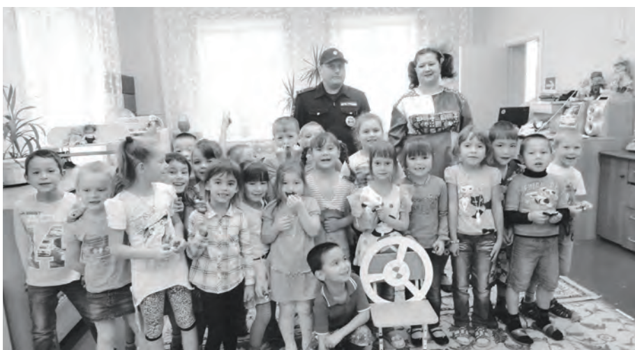
Даже такие малыши должны знать правила дорожного движения

МБУК «Эвенкийский районный культурно-досуговый центр» совместно с ОГИБДД ОМВД России по Эвенкийскому району провели очередную серию игровых программ, посвященных правилам дорожного движения.