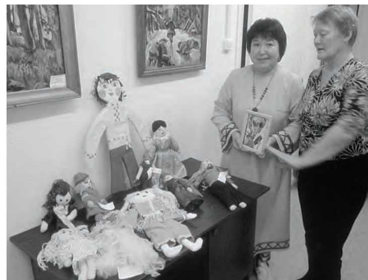
Самодельные игрушки от ЦДТ в дар музею

Байкитский краеведческий музей провел акцию «Ночь искусств».