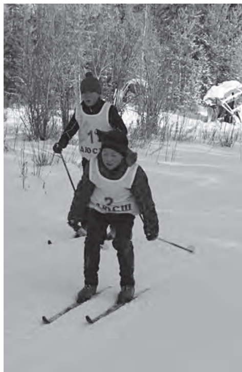
Все спешат к победе