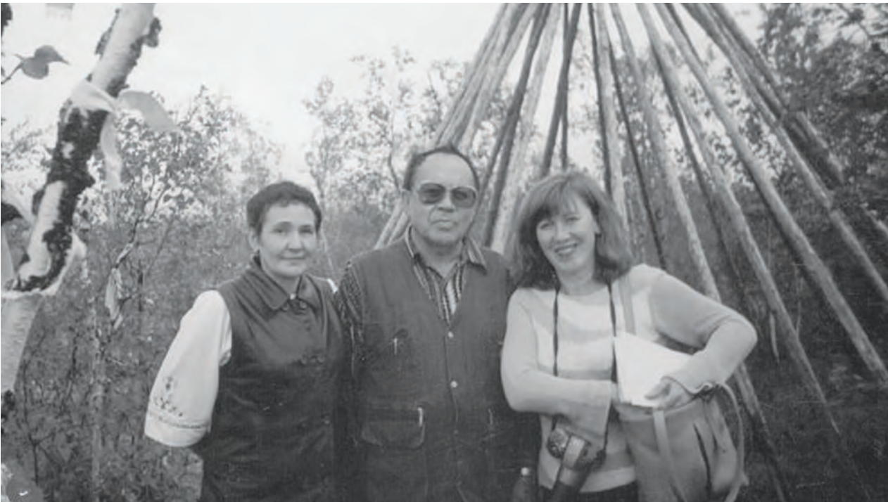
Встреча с земляками