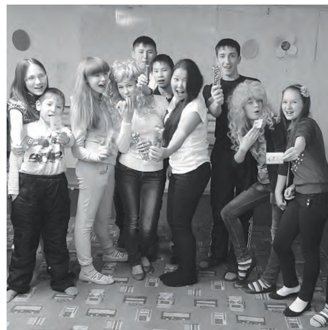
Главное не победа, а участие и... отличное настроение!

Мы уверены, что цель мероприятия выполнена, потому что ребята узнали много нового и интересного про Красноярский край, ведь некоторые из участников мероприятия никогда даже не выезжали за пределы родного села и не подозревают, насколько большой и богатый край, в котором они живут. Мы очень надеемся, что после таких встреч наше подрастающее поколение будет с гордостью и любовью относиться к своей малой родине.