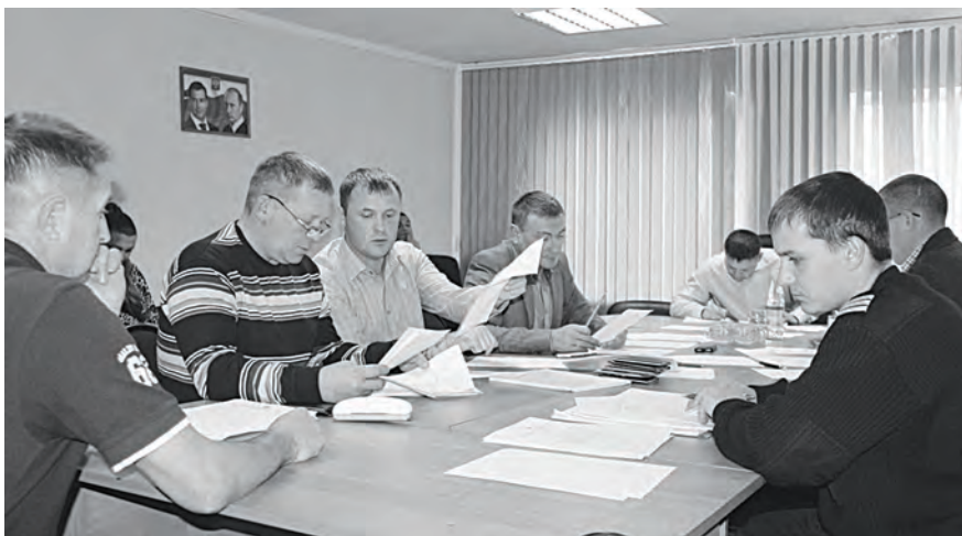
Первое заседание Ванаварского сельсовета в новом составе

В с. Ванавара состоялось первое организационное заседание 1-й сессии Ванаварского сельского Совета депутатов 4-го созыва. На ней присутствовало семеро из десяти вновь избранных депутатов. Заседание было открытым, и многие ванаварцы, небезразличные к жизни села, пришли, чтобы быть свидетелями выбора нового главы Ванавары.