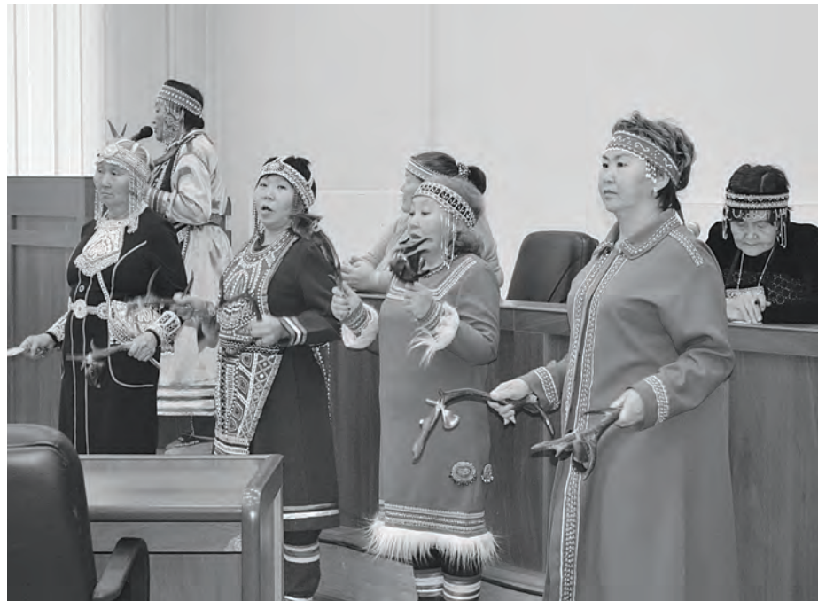
Выступление фольклорной группы «Кэргэн»