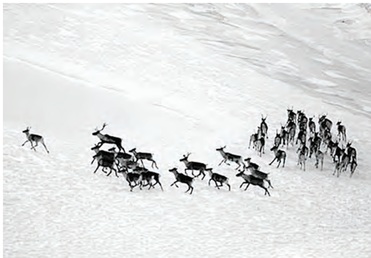
Группировка оленей, найденная во время миграции неподалеку от п. Тура в марте 2014 года

Наши исследования опираются не только на эти данные, но и на опыт соседних регионов. Например, в Якутии уже несколько