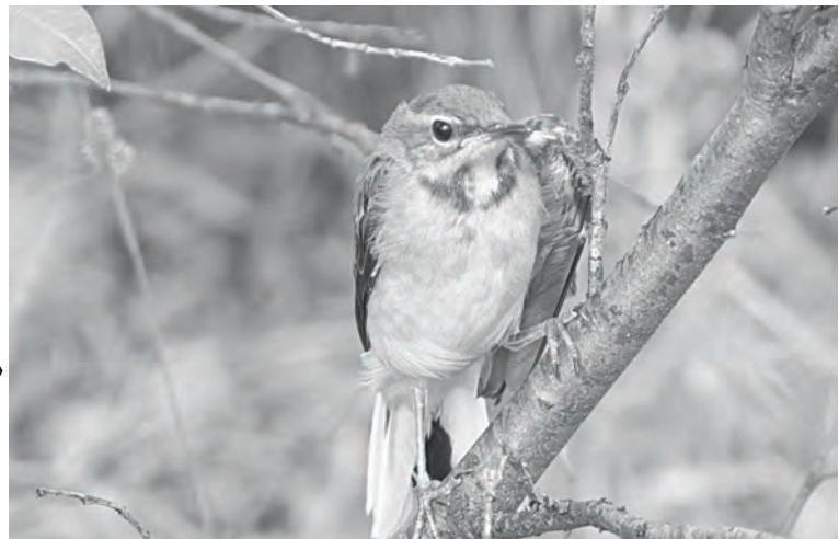
Летом в «Тунгусском» работала группа ученых, их цель – изучение биоразнообразия заповедника

- Одна из функций сотрудников заповедника – это сопровождение туристов,