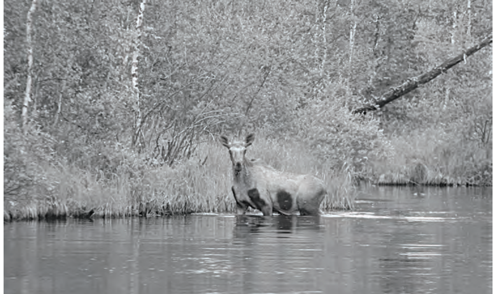
Животные на территории заповедника совершенно не боятся человека