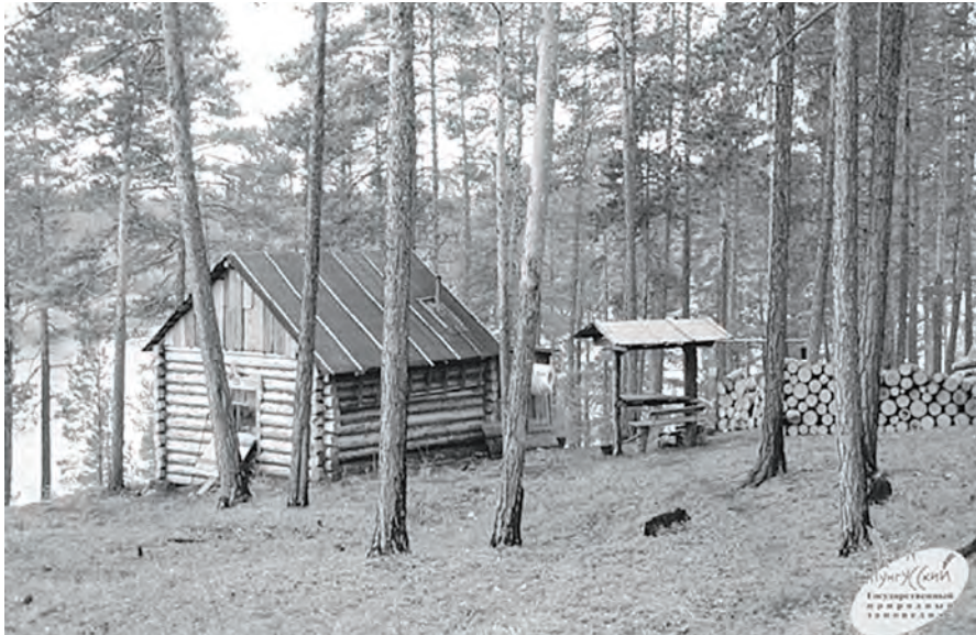
В планах администрации заповедника на 2015 год – строительство гостевого домика