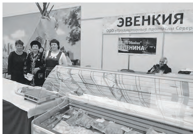
Эвенкийский прилавок с настоящим чумом был одним из самых колоритных на ярмарке

В минувшие выходные, 11-12 октября, в МВДЦ «Сибирь» состоялся продовольственный фестиваль «Продовольственное кольцо. Урожай-2014». Участие в ярмарке-продаже приняли около 200 производителей и фермеров со всего Красноярского края и из соседних регионов. Уже традиционно в фестивале приняла участие и Эвенкия.