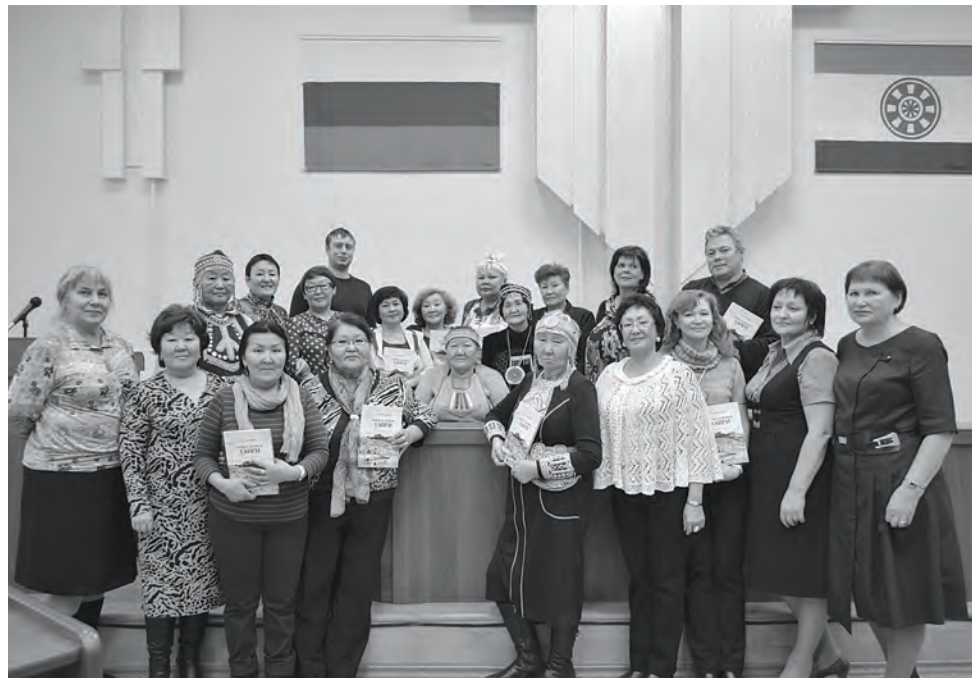
Участники презентации книги Т.М. Сафьянниковой «Сыны и дочери тайги»