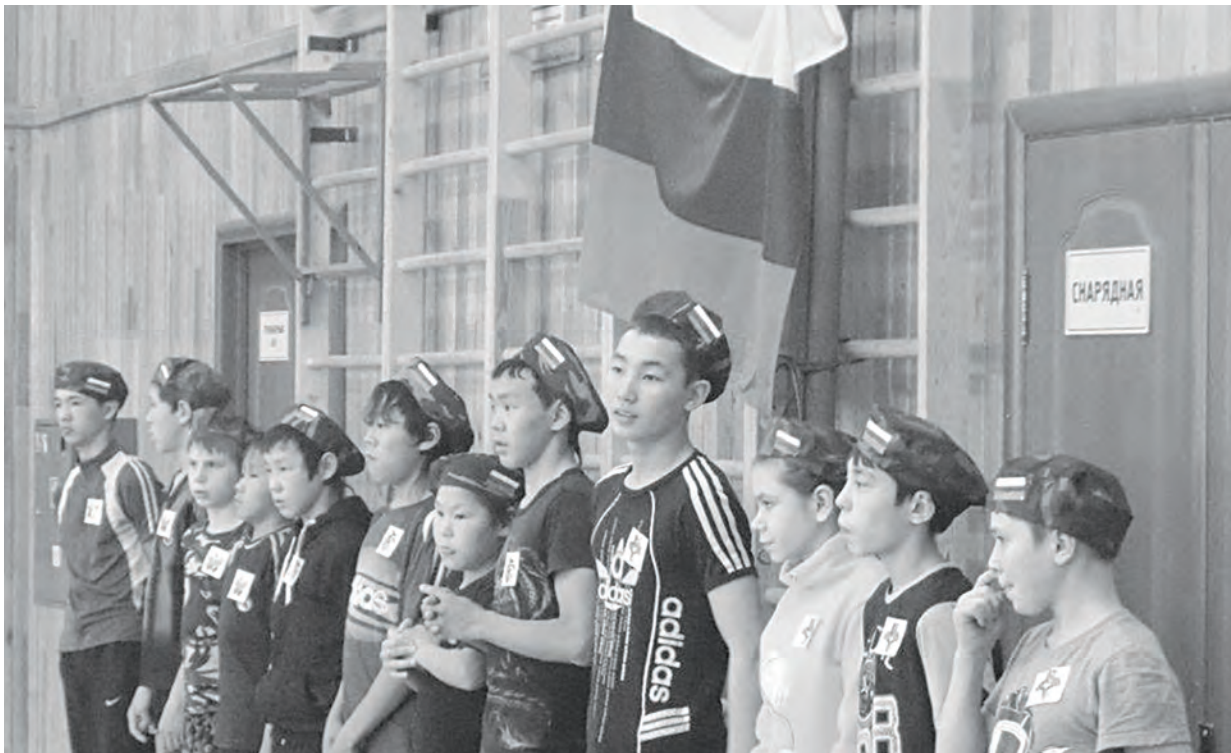
В коррекционной школе уделяется особое внимание патриотическому воспитанию ребят

К 80-летию образования Красноярского края в Туринской коррекционной школе-интернате VIII вида прошло спортивно-патриотическое мероприятие «Патриоты Сибири».