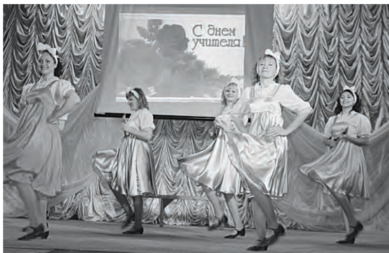
Педагогов поздравляют ванаварские «Девчата»

Каждую осень не только ученики, но все общество приносит дань благодарности людям одной из самых уважаемых профессий – учителям. В День учителя педагоги получают цветы, слышат добрые теплые слова признательности и восхищения.