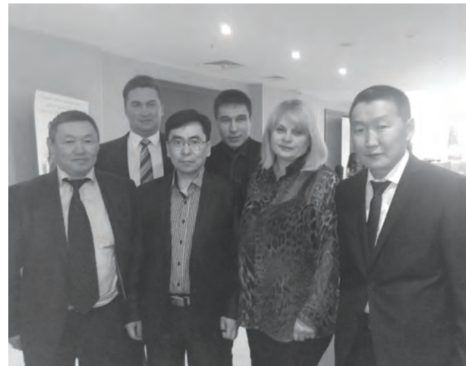
Подобные семинары - площадка для живого обсуждения проблем коренных народов