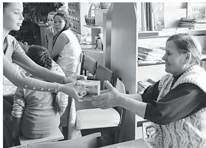
Люди старшего поколения всегда рады вниманию и общению

Мы ещё раз от души желаем нашим бабушкам и дедушкам крепкого здоровья и благополучия!