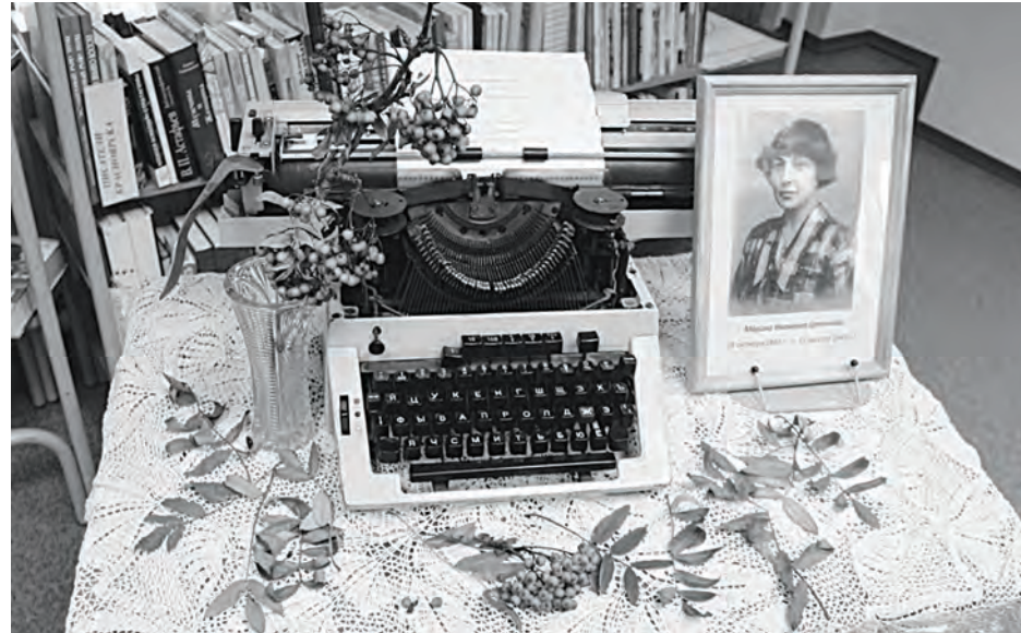
Марину Цветаеву в Эвенкии читают и любят

Приходит осень, жарко алеют на рябинках поспевающие гроздья, и каждый культурный человек обязательно вспоминает в эти дни знаменитые строки великой Цветаевой: «Красною кистью рябина зажглась, падали листья...».