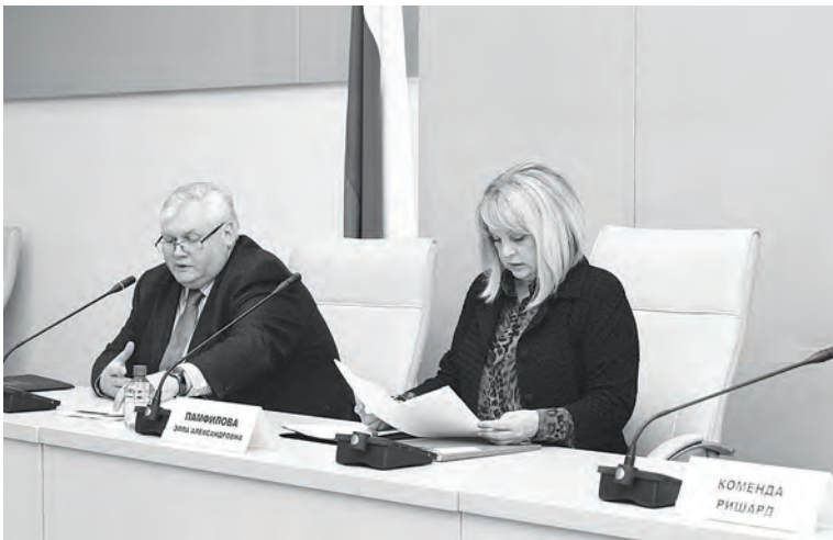
Продолжение на стр. 3

В ходе работы семинара рассмотрены различные темы основных докладов, такие как «Декларация ООН о правах коренных народов: руководство для