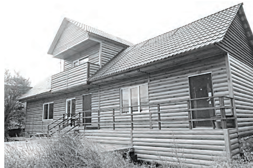
Дом аборигена в Байките