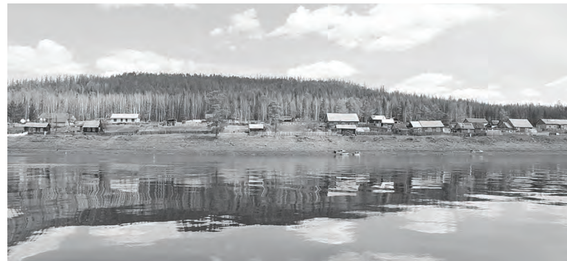
За лето в поселке возвели мост, проложили тротуары, установили мемориал памяти