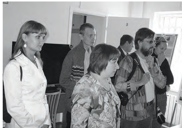
Посетители выставки в Эвенкийском архиве

Почетный житель ЗАО Боярских. 24.04.2012