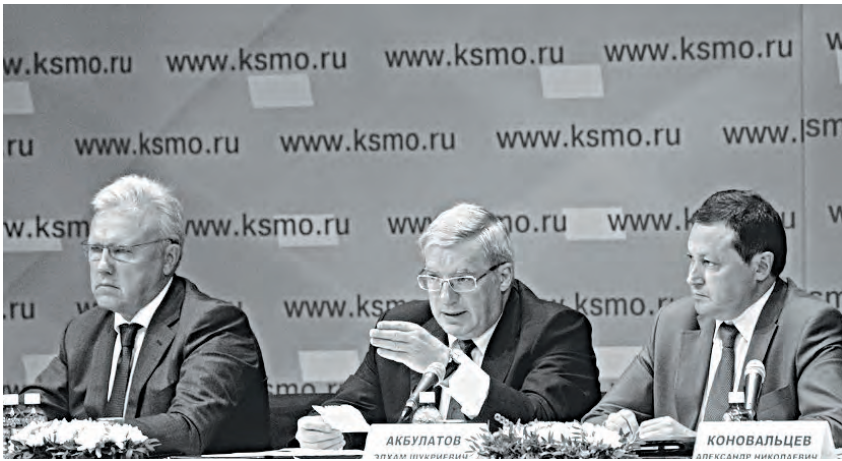
Краевой власть гулдыдерэн

хавалдули программалтын ачир. Эри эчэ ая бирэ. 2015 аннганиду упкатту муниципалитетылду бюджетнаил программал омакталдули овкалдули гулэлдули бимэчир. Строительнаива комплексаваня угириwкэ. Илмактал хавамнил-да мэрдувэр гулэлвэр одядатын, хозяйствал хэгдыгултын бюджетнэилтын мэнгуртын бимчэл. Проблемал кэтэ, нунгарватын итыувка. Миттули нги-вэл этэн таравэ ора-таравэ миты омачинты»,- гунэн Виктор Толоконскай. Съезд хавалналин омактал предложениел овувдянгатын, краевоилва, федеральнэилвэ законилва бугадыл самоуправлениеил хававэтын дэнчадырилватын аюсчангатын. Крайду индерил илэл упкатва социальнэилвэ, бододылвэ бэлэгэлвэ гадянгатын.