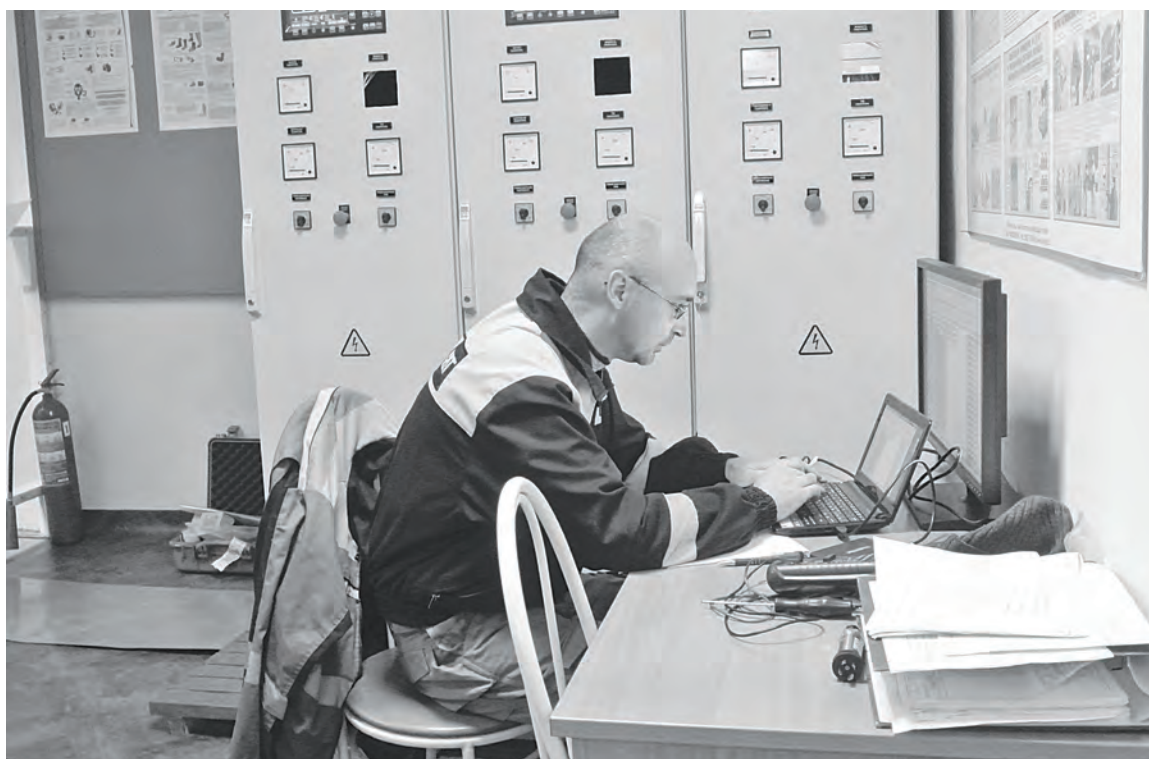
Теперь на ДЭС «Шпат» стоит современная система управления