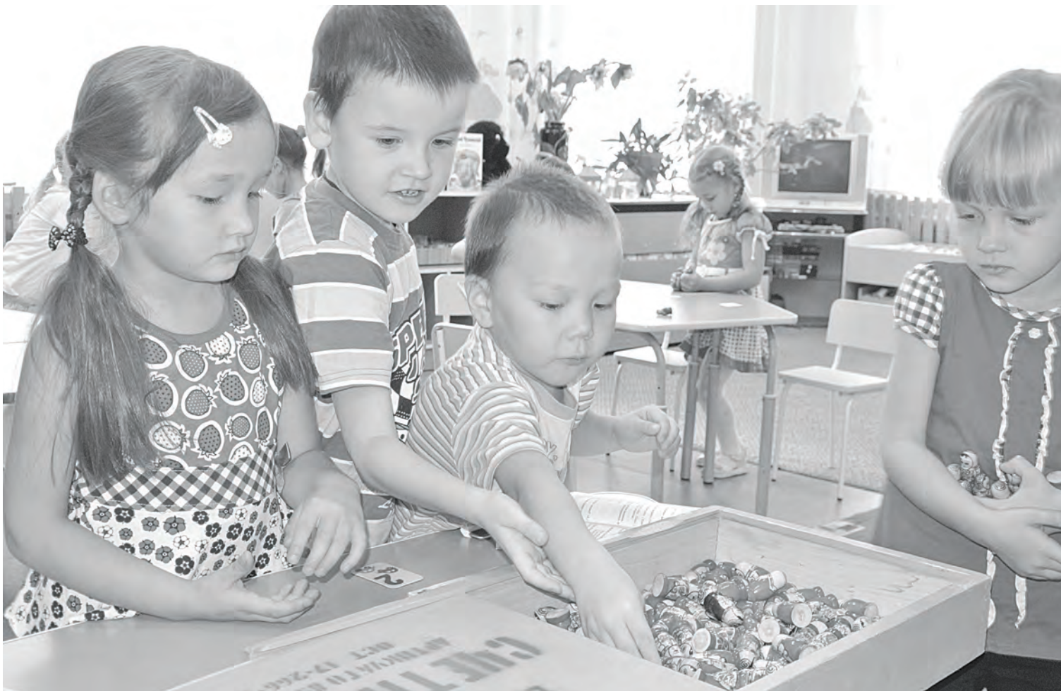
Детский сад для ребенка — это место, где он учится самостоятельно жить, мыслить, принимать решения

27 сентября в России отмечается общенациональный праздник — День воспитателя и всех дошкольных работников. И в этот раз, чтобы рассказать читателям о профессии воспитателя, мы подготовили мозаику из пяти небольших эссе — мнений специалистов Туринских детских садов. О том, какой они видят свою работу, какие в ней бывают сложности и о том, как воспитателю удастся найти подход к разным детям, читайте далее.