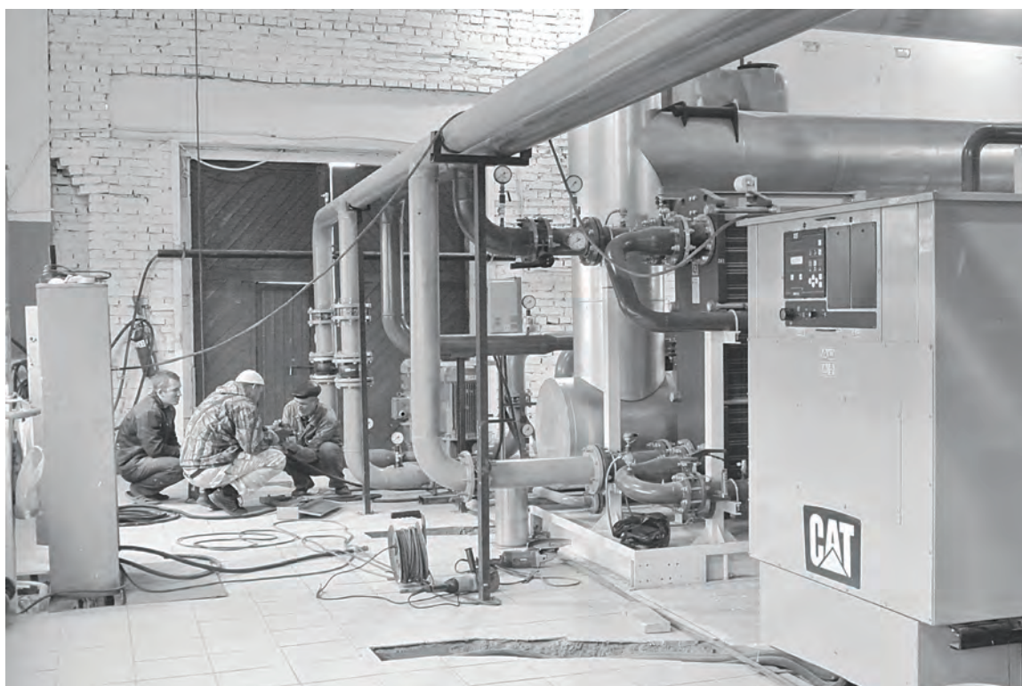
Зима покажет надежность нового оборудования