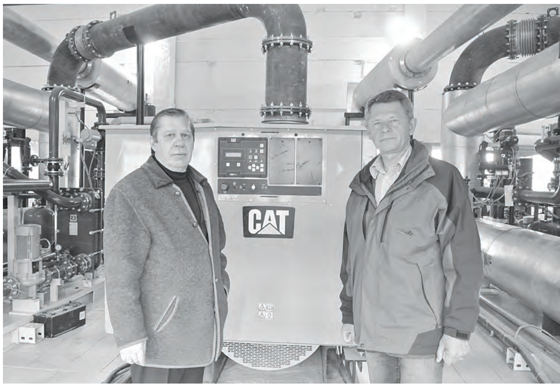
Энергетический комплекс Илимпей выходит на новый уровень

В завершение хотелось бы еще добавить, что помимо технического усовершенствования объектов предприятия «Илимпейские электросети» на новый уровень выходят и сами условия труда на дизельной. В скором времени сотрудникам выдадут новую фирменную спецодежду. Современные дизельные генераторы не требуют такого ухода и постоянной замены масел и ГСМ, как их отжившие свой век предшественники. Поэтому собственное выражение дизелистов: «работаем по локоть в масле», к ним теперь будет не применимо. Также необходимо отметить и улучшение условий работы других сотрудников, которые трудятся в офисе предприятия. Административное здание «Илимпейских электросетей» сегодня представляет собой образец качественного оснащения рабочих мест. Но об этом - в другой раз. А что касается энергетического комплекса Илимпей, можно констатировать, он действительно вступает в новый современный век.