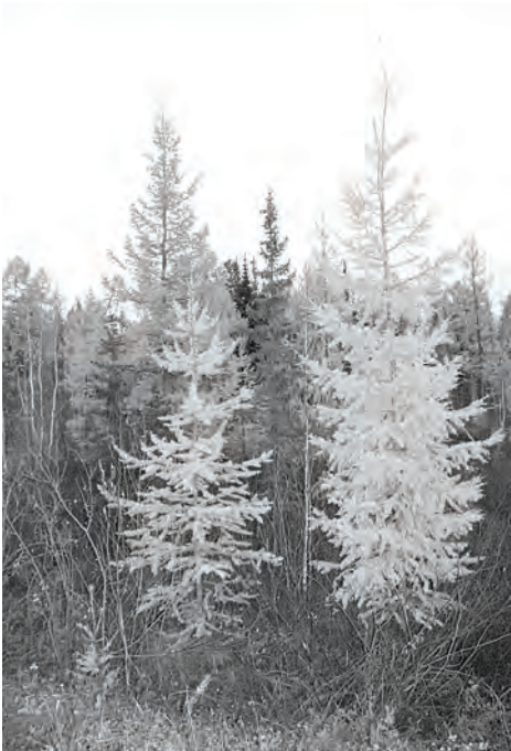
Татьяна ВЛАСЕНКО Фото автора

Тайга в ожидании длинной белой зимы сменила убор на многоцветный и роскошный. Светлые березки теперь так прозрачны и невесомы, что, кажется, стоит подуть ветру, как они оторвутся от земли и улетят в далекие дали. Золотые лиственницы блещут всеми оттенками желтого, а угрюмые ели на их фоне особенно темны и зелены. Яркие рябины, считая, что их алых кистей недостаточно для украшения пейзажа, оделись в багрянец всеми своими кронами. Сосны и кедры хотя и не сменили зеленый убор, но в своих длинных иглах теперь хранят прозрачные дождевые капли, которые в редких лучах солнца вспыхивают всеми цветами радуги. А вот и первый, самый белый и чистый снег упал на остывающую землю - пока ненадолго, как предвестник холодов и длинного ожидания весны. Медленные снежинки, танцуя, с неохотой опустились на раскисшие дороги. Прощай, лето!