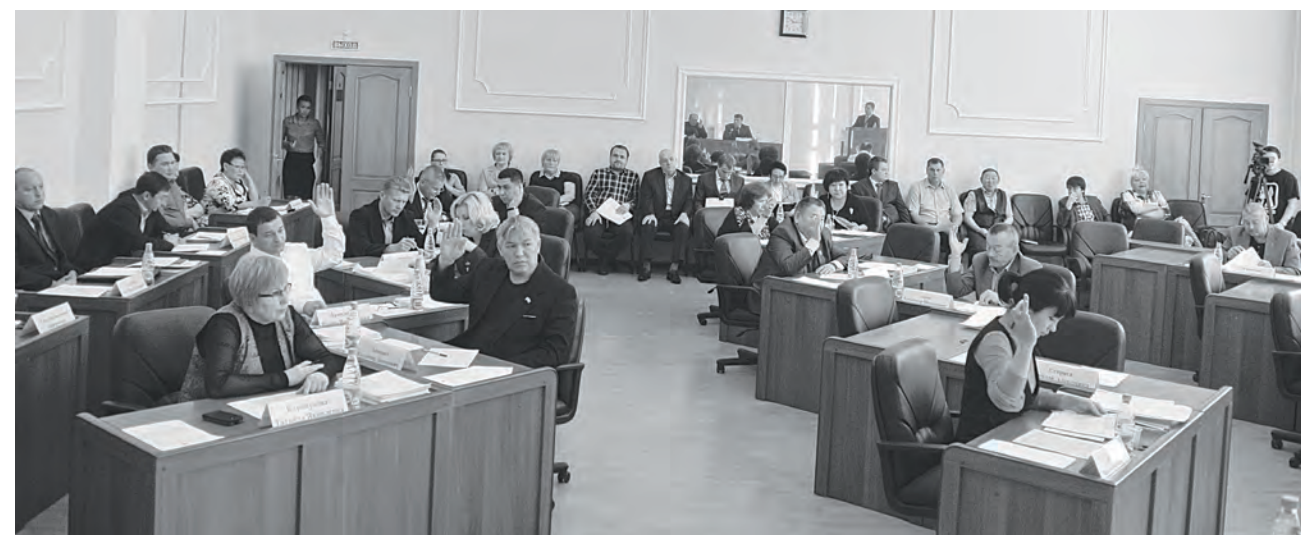
На пленарном заседании XX сессии райсовета принято 19 решений

Сегодня в Туре завершила работу XX сессия Эвенкийского районного Совета депутатов. В течение всей этой недели парламентарии рассматривали важные и актуальные вопросы жизнедеятельности района.