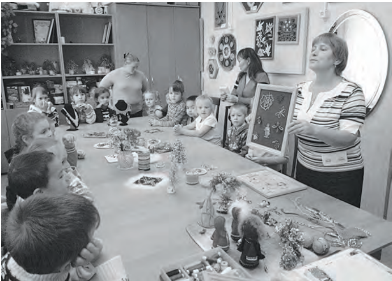
В доме детского творчесва каждый найдет себе занятие по вкусу

Начало учебно-го года означает и начало нового сезона работы Муниципального казенного образовательного учреждения «Дом детского творчества». В этом году все кружковые занятия будут проходить только на базе учреждения.