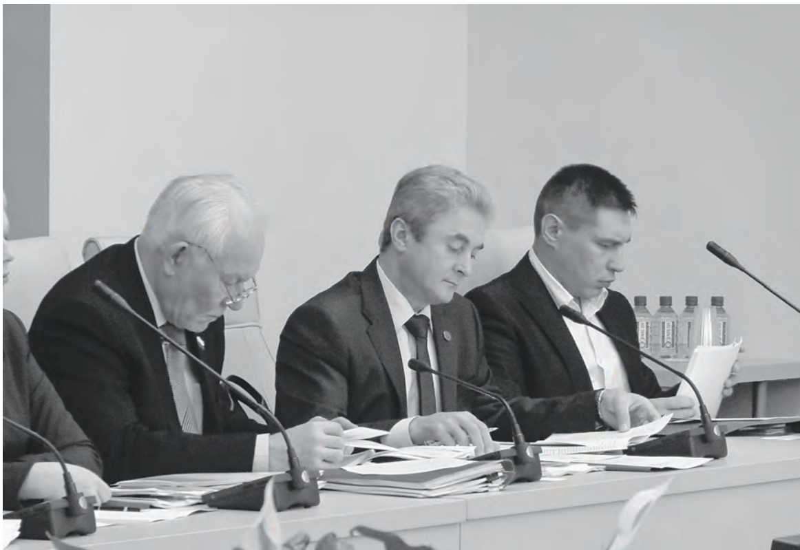
Первыми на круглом столе слово держали главы Эвенкии и Таймыра