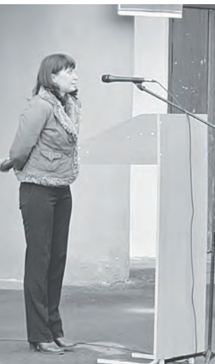
Самые теплые воспоминания звучали от одноклассников