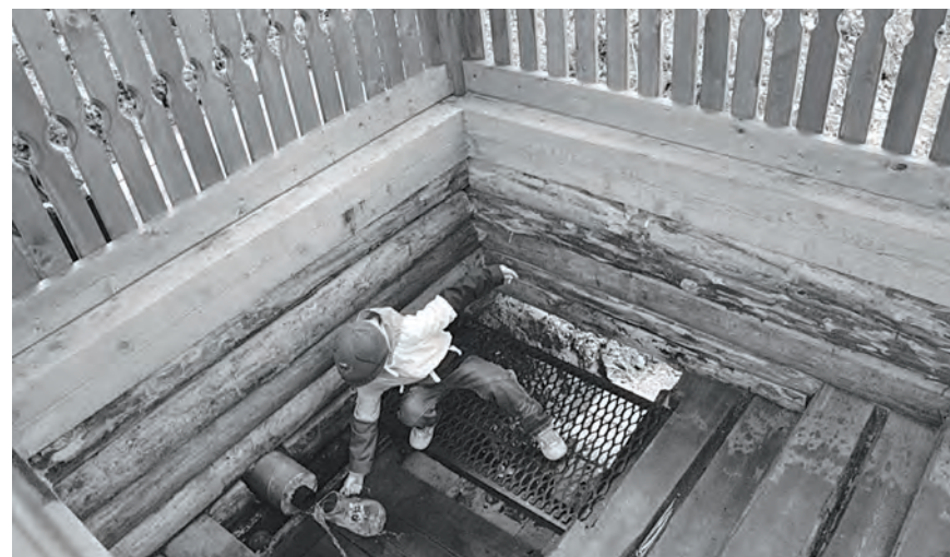
Первый забор воды из освященного источника