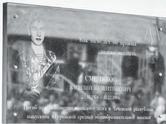
Чтобы память жила в веках ...