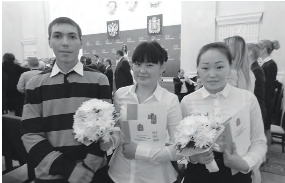
Наши стипендиаты на торжественном вручении свидетельств в Красноярске

По традиции на торжественное мероприятие были приглашены родители и педагоги ребят. Многие приехали издалека – из Туры, Минусинска, Енисейска, Ачинска, Назарова. В зале играл оркестр, создавая теплую атмосферу.