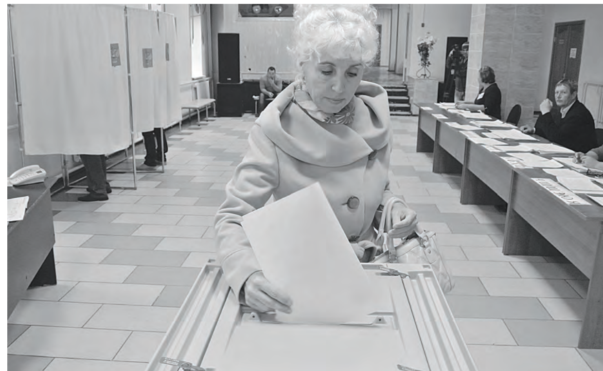
14 сентября. Тура. Избирательный участок № 2233

14 сентября в единый день голосования Эвенкия наряду с жителями всего большого объединенного края выбирала губернатора региона. А жители Туры, Байкита и Ванавары кроме этого голосовали еще и за кандидатов в депутаты местных представительных органов.