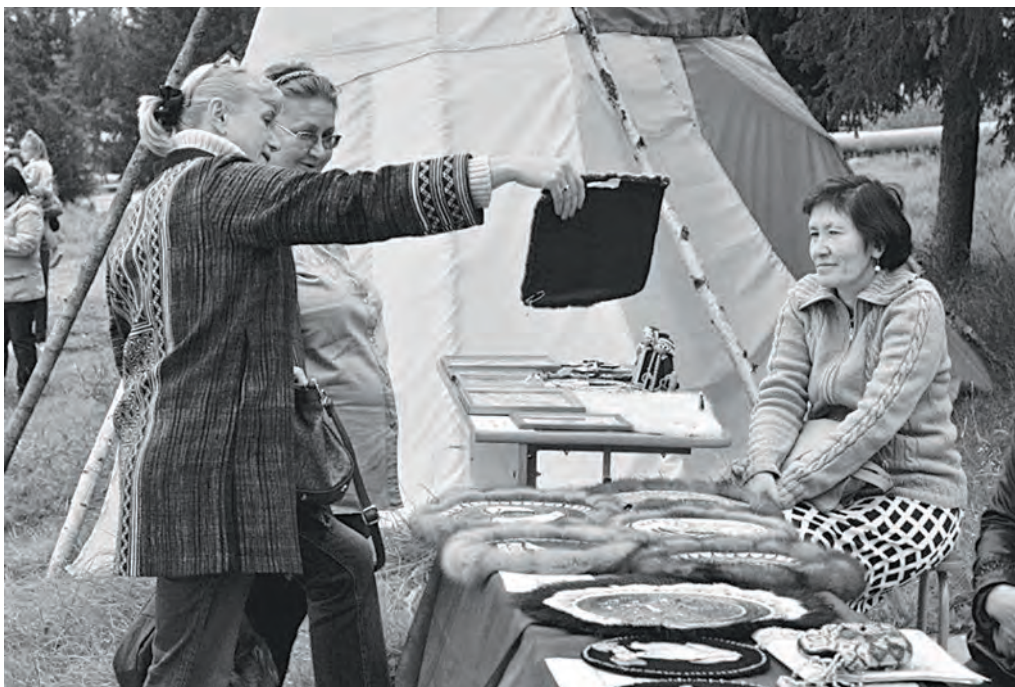
На выставке декоративно-прикладного искусства Гильдии мастеров