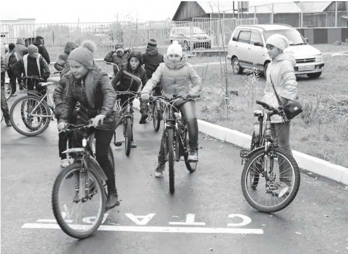
Ребятам очень важно знать правила дорожного движения!

15 сентября в четвертый раз стартовал муниципальный кон- курс юных инспекторов дорожно- го движения.