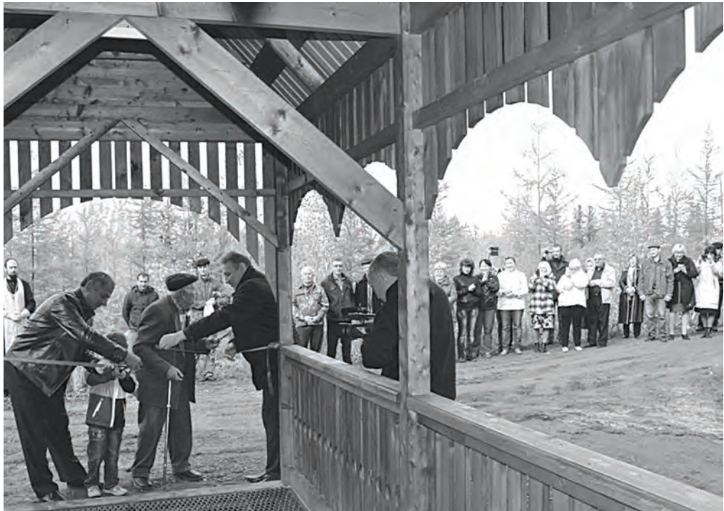
На открытие родника пришло много байкитян