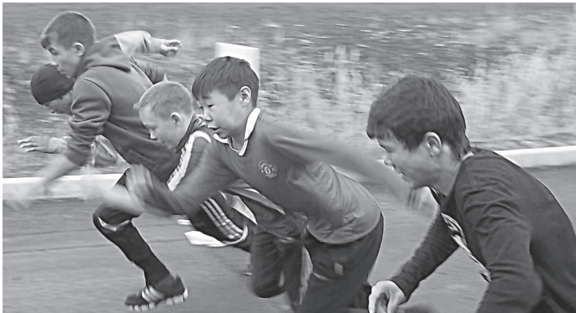
Спорт лучше всего помогает отдохнуть от учебы