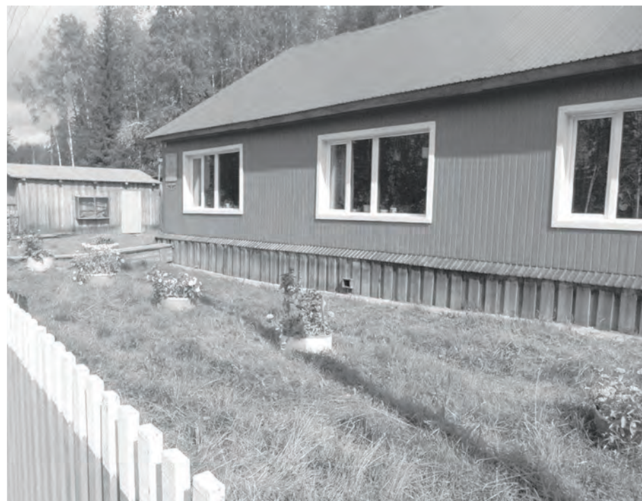
Кузьмовская начальная школа