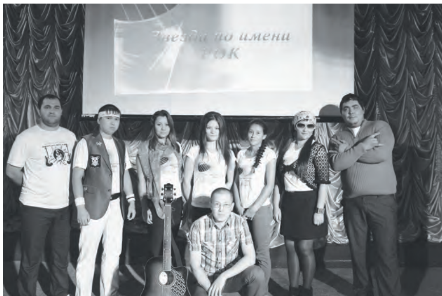
Участники и организаторы рок-концерта в Ванаваре

24 августа в стенах Дома культуры села Ванавара Молодежный центр «ДЮЛЭСКИ» («Вперёд») провел свой первый рок-концерт под названием «Звезда по имени Рок».