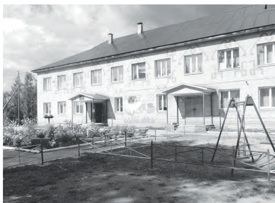
Детский сад «Морозко» в Байките