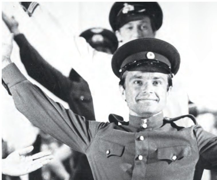
«Солдатская пляска», г. Днепропетровск, 1969 г.

В Туру меня сразу встретили, вручили мне ключи от квартиры, конечно, она была «не ахти какая», на Смидовича, но, тем не