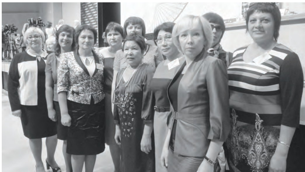
Представители эвенкийской делегации на краевом Августовском педсовете

Эвенкийская педагогическая делегация приняла участие в традиционном краевом Августовском педсовете, прошедшем в Красноярске на прошлой неделе.