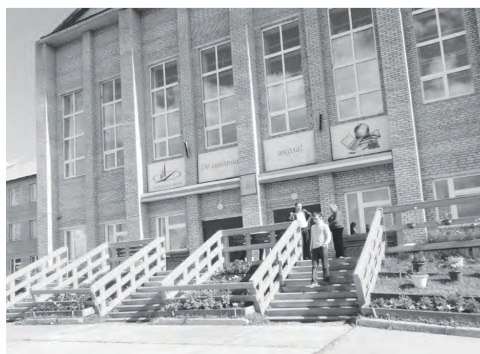
Байkitская средняя общеобразовательная школа