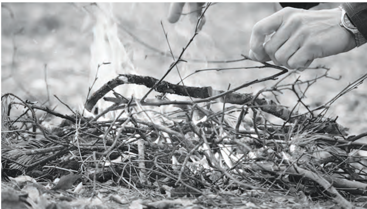
Костер – самый простой способ подать сигнал бедствия

венного охотничьего ружья. Существуют различные сигнальные пистолетные и винтовочные трассирующие патроны. Все они предназначены для подачи аварийного сигнала из боевого и охотничьего нарезного оружия. При подаче сигнала всякое пиротехническое средство следует держать в вытянутой руке, развернув соплом от себя. С подветренной стороны не должны стоять люди, находиться легковоспламеняющиеся предметы. Категорически недопустимо направлять ракеты и патроны в сторону спасательных судов, самолетов, вертолетов.