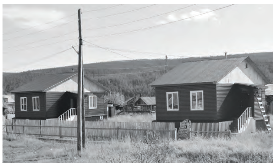
Новые жилые дома в Нидыме

- Согласно переписи 2010 года в Нидыме 217 человек. Но, так как мы знаем всех, посчитали буквально по головам - выходит 278 человек. Кто-то уезжает, например школьники, многие из них после учебы в вузе или ссузе остаются в городе, либо приезжают в Туру. Но, хочу заметить, что к нам на постоянное место жительства также приезжают люди. В основном - учителя. У нас нехватка квалифицированных педагогических кадров в школе и садике. Так, в этом году к нам