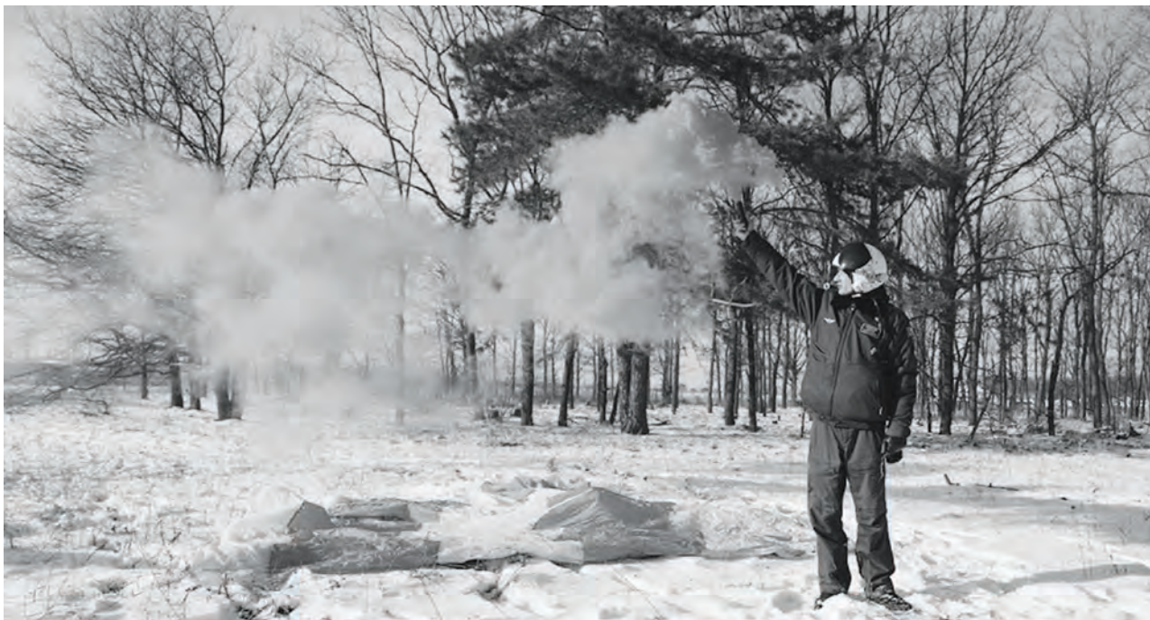
Запуск сигнальной ракеты

В охотничьих магазинах можно приобрести «Пиротехнический сигнал охотника». В комплект входит пусковое приспособление и патроны красного, желтого и зеленого огня. Также продаются особые сигнальные патроны, которые могут отстреливаться из обычно-