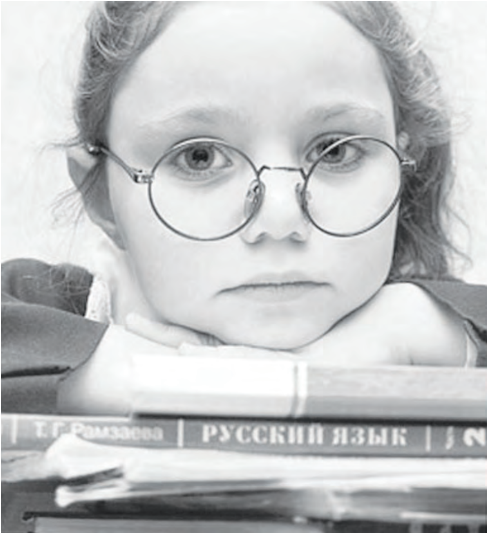
Скорее бы в школу...