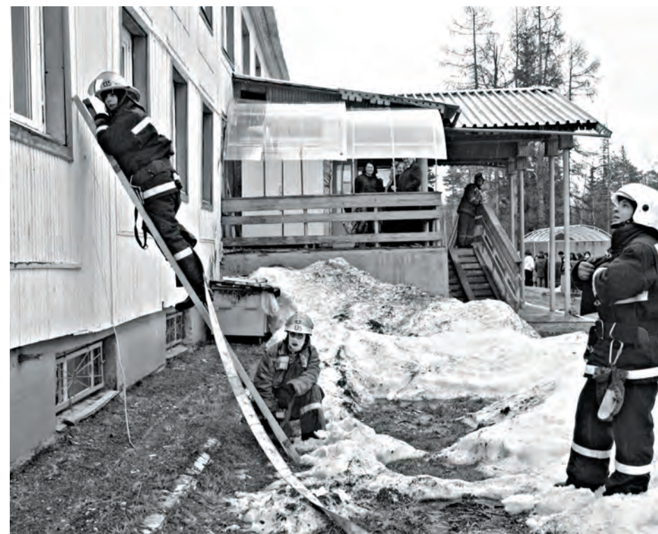
Пожарно-тактическое занятие в Доме-интернате для престарелых и инвалидов

Самый первый и самый важный номер в любом телефонном справочнике - 01. Огонь не щадит ничего и никого, в борьбе с ним важна каждая минута. От того, как оперативно и профессионально работает служба МЧС, часто зависит не только размер материального ущерба, нанесенного пожаром, но в первую очередь человеческие жизни.