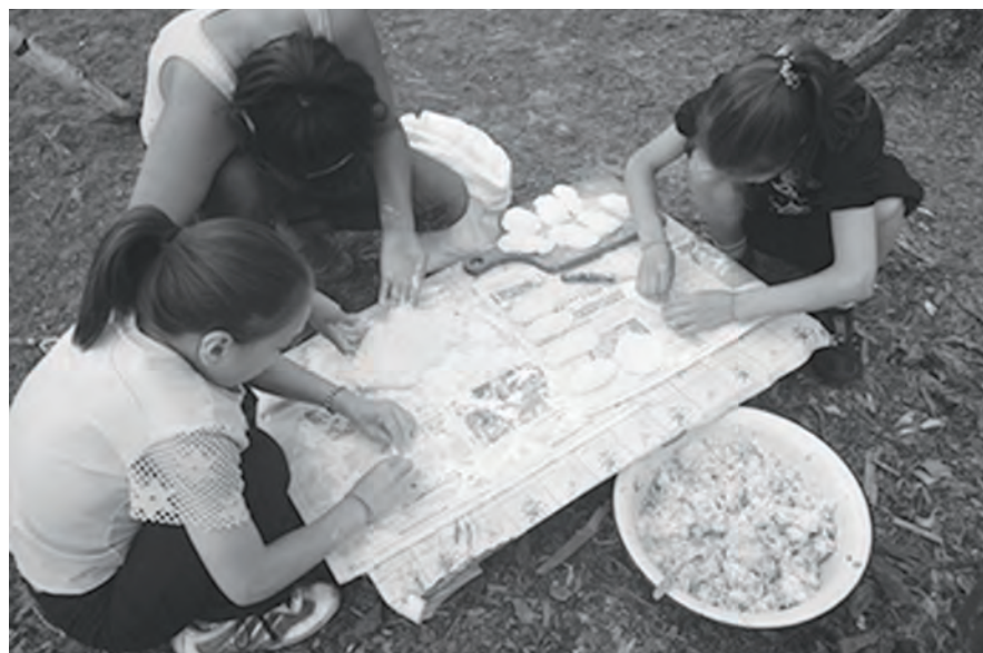
...а в это время девчонки стряпают для них пирожки

В 2014 году на территории Эвенкийского муниципального района в течение июля работали шесть детских летних лагерей-стойбищ. Это: «Арункан» - расположен в 35 км выше по течению р. Нижняя Тунгуска от п. Тура, «Вилюкан» - находится в 20 км от п. Эконда, «Орончикан» - в 18 км от п. Суринда, «Уриkit» - в 58 км от п. Ошарово, «Стрелка» - в 13 км от п. Стрелка-Чуны и «Аньбок», расположенный в 10 км п. Суломай.