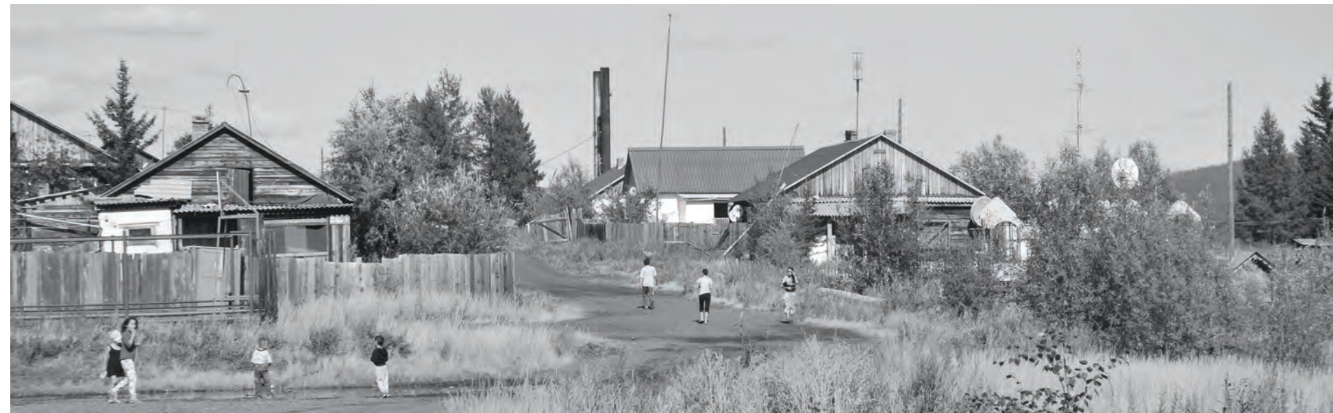
В последние годы внешний вид поселка преобразается