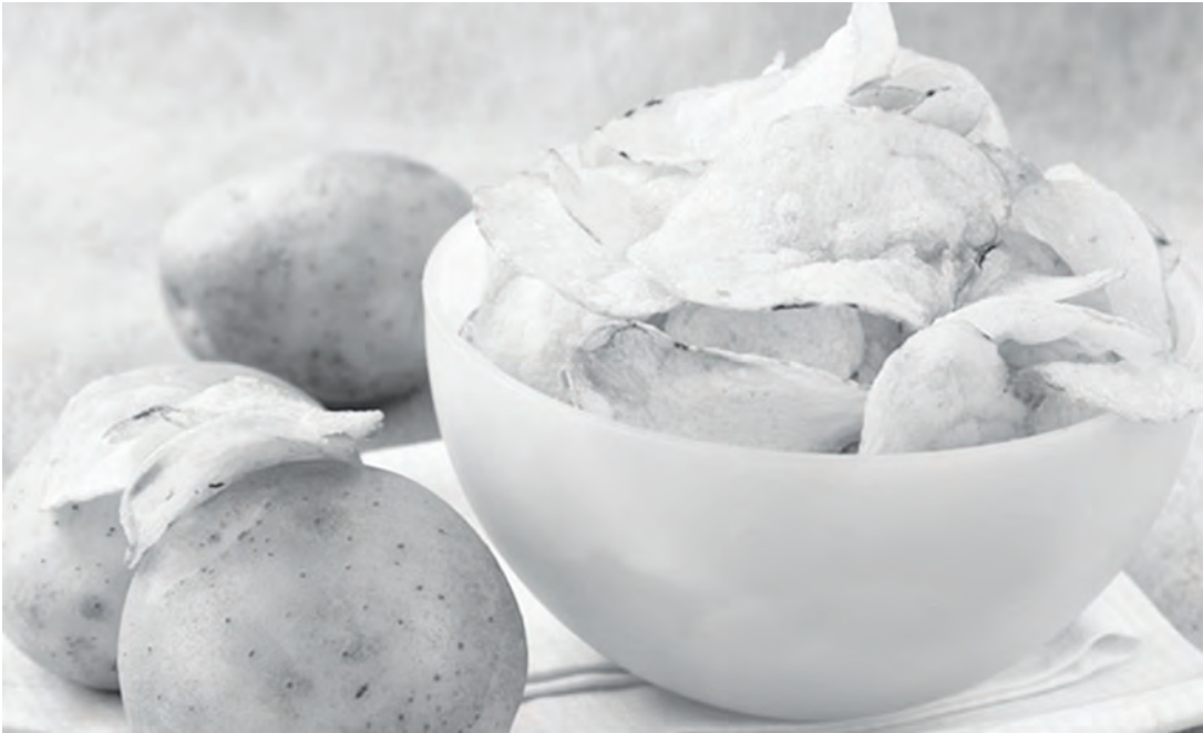
Вкусный, но очень вредный перекус. Не злоупотребляйте!

24 августа в мире отмечается День рождения картофельных чипсов. Поэтому сегодня речь пойдет, об этом, пожалуй, самом популярном снеке нашего времени. Об истории этого продукта читайте далее.