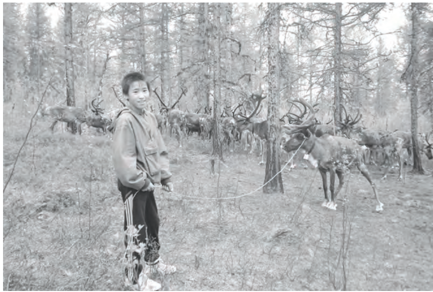
В лагере «Орончикан» ребята не просто общались с оленями, но и заботились о них

Эвенкийским этнолагерям-стойбищам в этом году исполняется 10 лет. Первый лагерь «Арункан» был открыт летом 2004 года. С тех пор многое изменилось и, прежде всего, быт ребят-таёжников...он стал более цивилизованным.