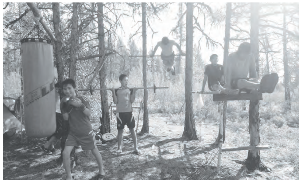
Тайга – лучший фитнес-центр: мальчишки укрепляют свои мускулы...