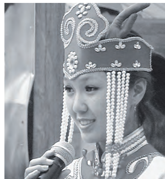
Победительница конкурса «Таежная красавица»