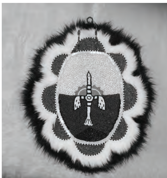
Одна из работ Н.И. Черончиной

Праздничное действо проходило с 24 по 27 июля на базе этнографического комплекса «Эвенкийская деревня», который расположен недалеко от села Первомайского в Тындинском районе.