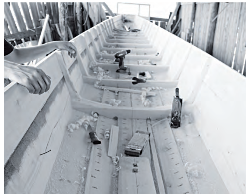
Так рождается лодка

особенно в летнее время. Металлическая лодка о камни быстро протирается, а вот деревянный шитик хоть за камень иногда и зацепится, но только стружку снимет - и пошел дальше. Красота!