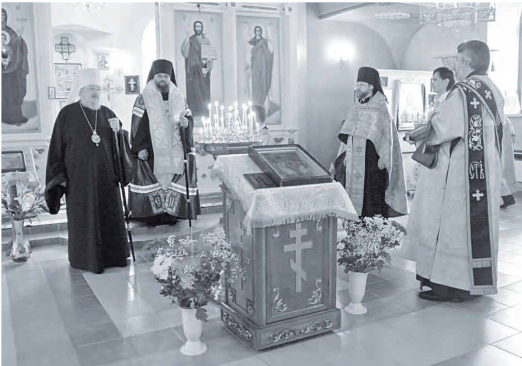
Проповедь Свято-Троицкой Эксэри дюдун

Епископ гунэн: «Суннгивэ приходвэсун упкачин Россия сарэн. Амин Григорий вавчанин Свято-Троицкайва Эксэри дюван хунгут оран. Тарил вавчал илэл – кэсэдерил илэл. Православнаил христианил Россия упкаттун дуннэлдун индерил, аявденэл митнгивэ Эксэри дюван садерэ, мевардувар нокчэдерэ. Авады Сибирь, авады Север, авады Эвенкия, россиянил, гил илэл, эчэл сарэ. Нунгартын энгкил митнгивэ гудейвэ дуннэвэ ичэрэ. Туруду би ичэм нямапчува Эксэри дюван, нунгандулан кэтэ илэл эмэнгкил. Эксэри дюн Эвенкия, Россия, Сибирь дулиндун илитчаран».