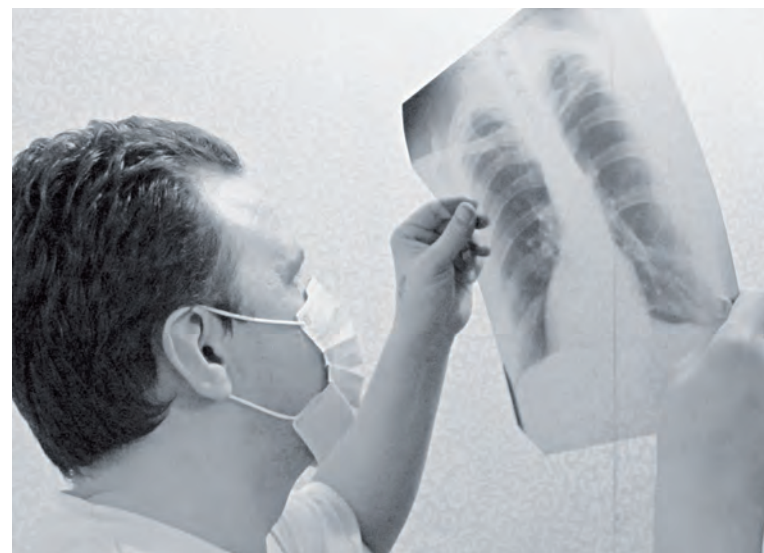
Флюорография позволяет выявить болезнь на ранних стадиях, что повышает шансы на излечение

частые перерывы в лечении. У таких больных развивается лекарственная устойчивость к препаратам, т.е. лекарства не помогают больному, микробы становятся устойчивыми к лекарствам. В последние годы выросло число больных с лекарственной устойчивостью, лечение должно быть длительным и непрерывным, что приводит к хорошему результату. Клинически установлено, что перерывы в лечении, даже на короткий срок, способны снизить эффективность лечения. Если выявляется устойчивость микобактерий к какому-то препарату, то врач заменяет его другим, к которому сохранилась чувствительность. Когда человек заражается от пациента с лекарственной устойчивостью – это очень плохо. В последние годы туберкулез стал чаще сочетаться с ВИЧ-инфекцией. У больных с ВИЧ снижен иммунитет (невосприимчивость к болезни) и они чаще заболевают туберкулезом. Туберкулез, в свою очередь, способствует прогрессированию ВИЧ-инфекции. Группой риска в отношении развития туберкулеза особенно являются лица, принимающие длительное время гормоны, наркоманы, больные сахарным диабетом, язвенной болезнью желудка и 12-перстной