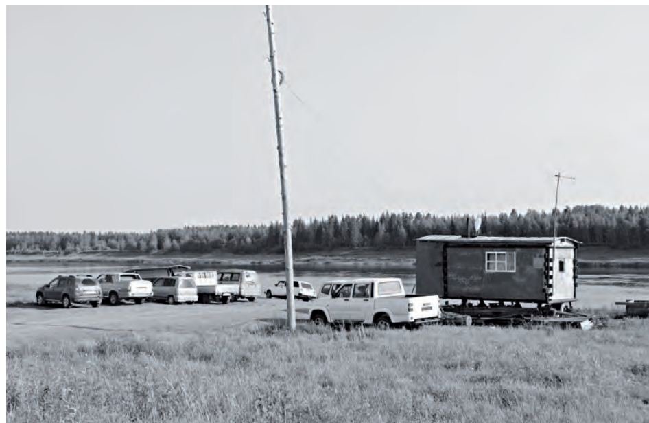
Лодочная станция, организованная ванаварцами

Попытки организовать лодочную станцию в Ванаваре предпринимались не раз ещё с 80-х годов прошлого века. По разным причинам они все как-то заканчивались неудачей. Но вот уже третий сезон на берегу Подкаменной функционирует отличная лодочная станция, созданная самими владельцами лодок.