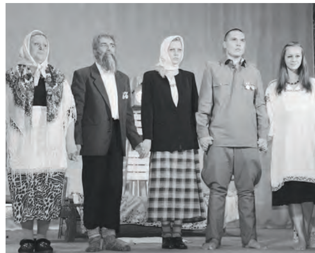
Сцена из спектакля «Любишь - не любишь»

Уже не первый раз ванаварцы аплодируют Байкитскому ТЮЗу. В рамках своего юбилейного турне по большим и малым поселениям Эвенкии его коллектив привез в Ванавару сказку для детей и взрослых «Счастливый случай» и трагикомедию «Любишь-не любишь».