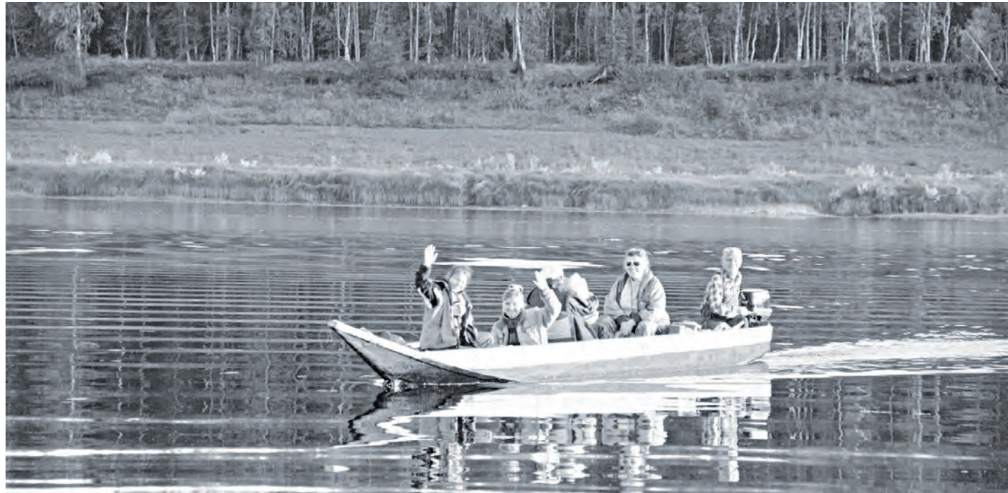
Прогулка семьей на шитике - что может быть лучше!