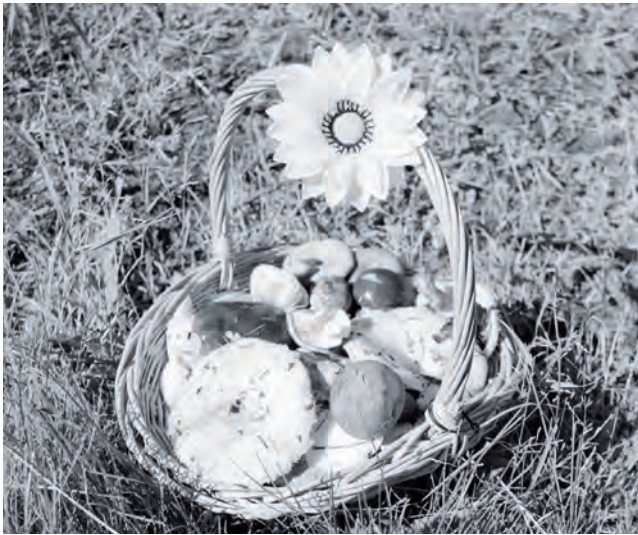
Откуда грибочки? Из леса, вестимо!

Грибы - совершенно удивительные живые существа. Их предки вышли на сушу вместе с одноклеточными водорослями примерно 2 млрд. лет назад, а около 300 млн. лет назад появились первые настоящие грибы. По особенностям роста и размножения они напоминают травянистые растения, но таковыми не являются, и питаются, разлагая готовые органические вещества, отдаленно напоминая этим животных. Грибница заменяет грибам корни. Чтобы добыть грибочки, нужно знать их повадки. В Эвенкии растет множество съедобных грибов, и некоторые не особенно привередливые грибники собирают в свои корзинки все, что попадает под руку: скользкие яркие маслята, аккуратные розовенькие волнушки, хрупкие разноцветные сыроежки, дружные опята, моховики и т.д. Гурманам подавай только грузди и рыжики. Что и говорить, это всем грибам грибы!