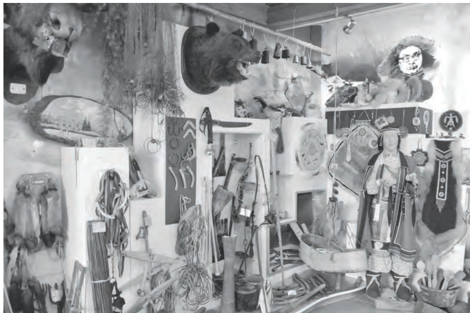
Часть коллекции экспонатов музея – выставить их все нет возможности