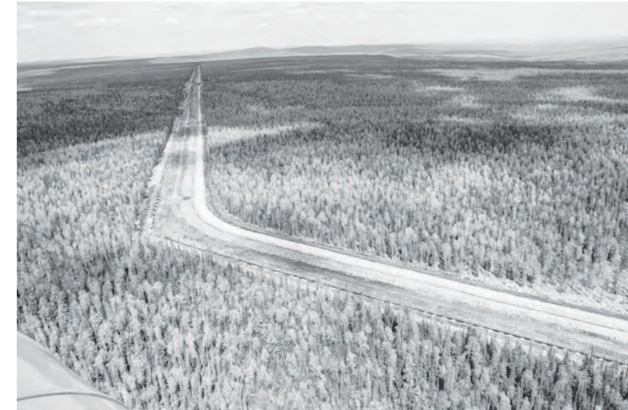
Маршрут трассы нефтепровода Куюмба-Тайшет пролегает через безлюдную тайгу

Протяженность трубы – около 700 км, при этом большая ее часть (порядка 500 км) проходит по территории нашего края, пересекая Эвенкийский, Богучанский и Нижнеингашский районы. Пропускная способность – 15 млн тонн нефти в год. Начинается нефтепровод в Куюмбе, конечной точкой станет ГНПС «Тайшет» (головная нефтеперекачивающая станция трубопроводной системы ВСТО). Помимо линейной части трубопровода предполагается строительство четырех нефтеперекачивающих станций, три из которых будут расположены в Красноярском крае, и объектов инфраструктуры. Строительство идет в два этапа: линейная часть и две нефтеперекачивающие стан-